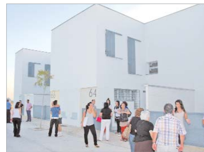
Un barrio joven y muy transitado.