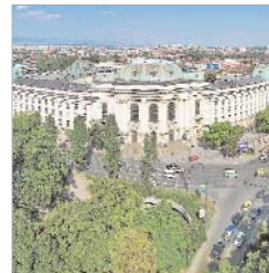
Vista global de la capital búlgara.