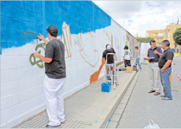
Cinco grupos de graffiteros se disputan la final del certamen.