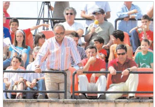
El alcalde y su equipo estuvieron arrojando al San José desde el palco.