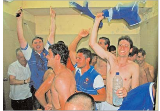
La ducha fue generalizada para todos los estamentos de la entidad.