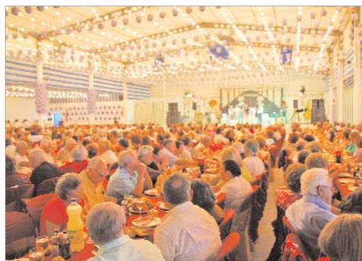
El Ayuntamiento recibió la noche del miércoles a los mayores del municipio.