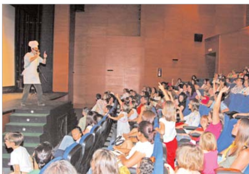
Más de 300 personas asistieron a la última sesión de cuentacuentos.

El éxito obtenido en la segunda edición del programa hace que los bibliotecarios piensen en una nueva etapa que comenzará el próximo curso escolar