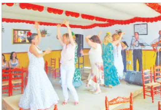
Cientos de rinconeros bailaron al compás las sevillanas