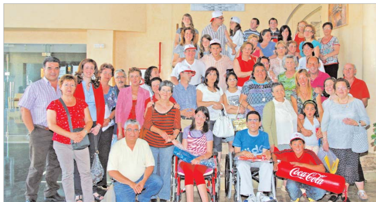
El grupo de participantes, tras la clausura de la actividad.

Estas dos últimas asociaciones han sido las que han coordinado este proyecto, organizado por la Zona Básica de Salud. Además, han colaborado el Área de Salud, Bienestar Social y Juventud.