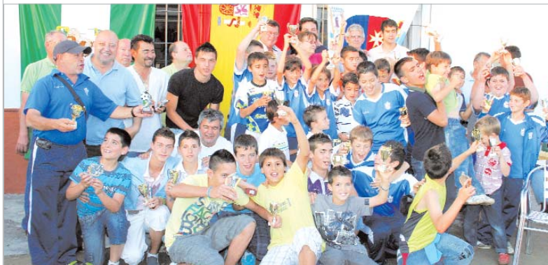
La familia del Rinconada posa con sus trofeos en la sede junto a los delegados de Deportes y Fiestas Mayores.

Con la finalización del ejercicio liguero, los clubes de la localidad aprovecharon para reconocer a sus jóvenes valores de futuro y premiar a sus escalafones inferiores en sendos actos que convocaron a toda la familia deportiva de la localidad.