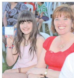
La llave de una nueva vida.