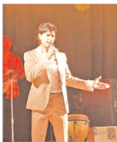
El cantautor Álvaro Rey.