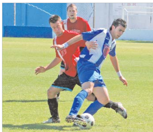
El Rinconada acumula motivos para quejarse durante la campaña.

que, en teoría, deberían restituir los guarismos a la entidad del Leonardo Ramos, a la espera de que se produzca alguna reclamación del Loreto, equipo que, a día de hoy, ocupa el tercer escalón del pódium por detrás de los ascendidos Huévar y Villaverde. El cuadro blanquiazul se muestra esperanzado en que se haga justicia, aunque con esta Federación nunca se sabe. En cualquier caso, el club sigue dispuesto a llegar a las instancias que sean necesarias para que esos más que merecidos seis puntos coloquen al Rinconada en el honorable tercer puesto.