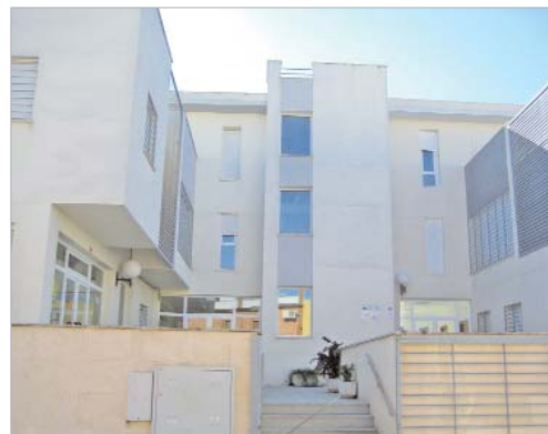
Edificio en el que se ubica la Residencia de Adultos con Discapacidad.

En total, el Complejo de la Discapacidad ofertará en pocos días un total de 88 plazas.