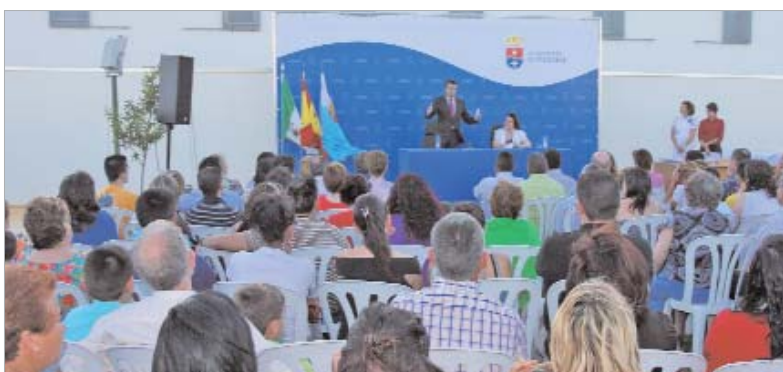
Adjudicatarios, familiares y amigos quisieron ser testigos.

Así, los propietarios quedarán en la misma situación que aquellos que han cumplido los pagos contratados y a partir de ahora abonarán una hipoteca próxima a los 480 euros al mes.