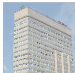
El hotel del Soderinsa en Sofía.