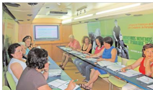
Uno de los grupos que ha participado en La Rinconada.

Divididos en grupos de 16 personas, los interesados entre los cuales se encontraban las mujeres que han participado en el Taller de Empleo dedicado a la Dependencia del año pasado y los de éste, socios de Afadi o Asociaciones de Mujeres, entre otros, han recibido información sobre los riesgos de tipo ergonómicos (posturas forzadas o movilización manual de las personas) y los de tipo psicosocial (estrés o carga mental).