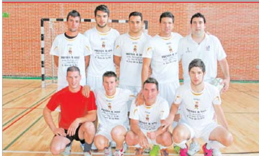
La plantilla del Fulham 05 posa para TN antes del partido ante el Campo Arena.