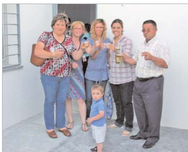
La primera fiesta de inauguración familiar.