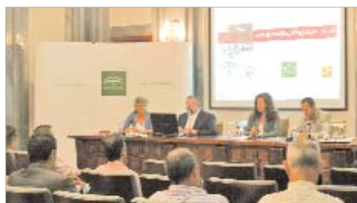
Presentación del programa de actos del congreso.

Otra sesión importante, será la presentación del proyecto Mediterránea Proyect , iniciativa de investigación y desarrollo de la SEAV. A través de este, se pretende poner en valor el patrimonio arqueológico y virtual utilizando las nuevas tecnologías aplicadas al patrimonio.