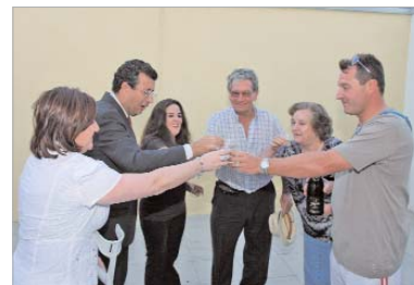
Día de brindis por un problema resuelto.