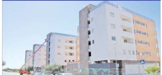
Promoción de 64 pisos de Lomas del Charco.