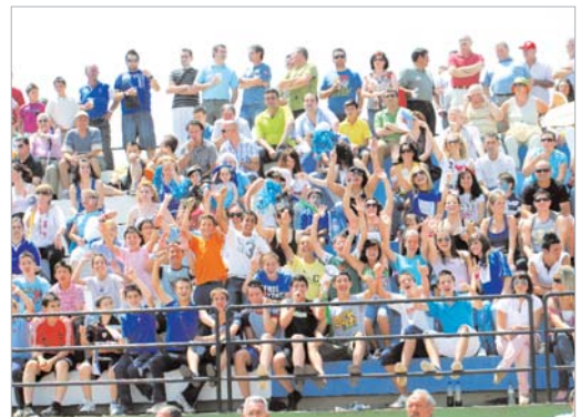
Las gradas registraron un lleno y se calculan unos 2.000 espectadores.