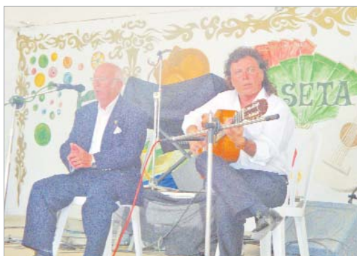
El Festival de Cante fue el protagonista del domingo.