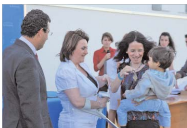
Día de felicidad para grandes y pequeños.

garaje y con un precio que oscila entre los 108.000 y los 132.000 euros.