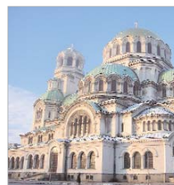
Imagen de la Catedral de Sofía.