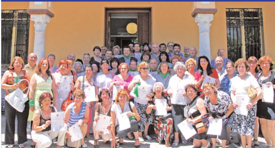
El alcalde, la delegada de Bienestar Social y la de Educación, con los alumnos que han finalizado sus clases.