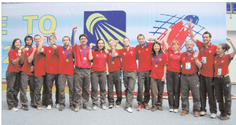
Los rinconeros defienden la medalla de bronce cosegada en Moscú el pasado año y aspiran a superarse.

El Soderinsa tendrá que verse las caras con rivales como el temible BC Saarbrücken alemán, el Skaelskor danés o el Primorye ruso