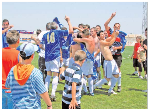
La fiesta comenzó en el césped con evidentes muestras de alegría.