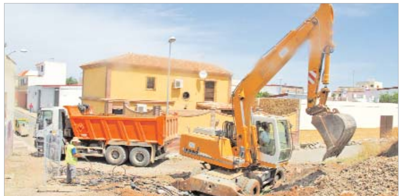
Se actuará en una superficie de 10.743 metros cuadrados.

Este nuevo servicio, unido a la reforma de las calles traseras a este apeadero, son fruto de un acuerdo alcanzado entre el Ayuntamiento y Adif, por el cual éste se comprometió a ejecutar las obras de la nueva estación y el Consistorio a la reforma integral de la barriada.