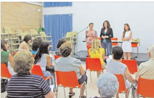
La delegada de Bienestar Social y la de Salud, en el taller de la memoria

Las Áreas de Igualdad y Bienestar Social y Salud ponen en marcha un taller de la memoria para apoyar a este colectivo