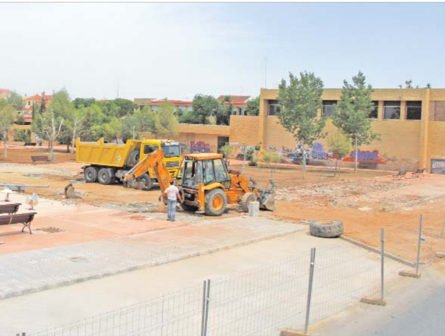
El parque del instituto Miguel de Mañara abrirá a los vecinos antes de agosto.

El parque del Miguel de Mañara: donde antes había vallas, ahora habrá un parque de 6.600 metros con pistas deportivas