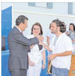
Día de sonrisas de ilusión.