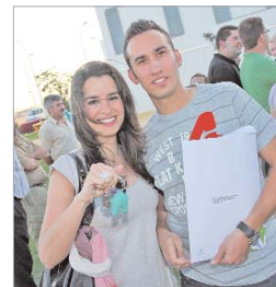
Futuro en común.