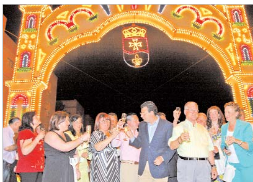
El equipo de Gobierno en la inauguración del alumbrado.

La Feria comenzó el miércoles con la recepción del Ayuntamiento a los mayores del municipio