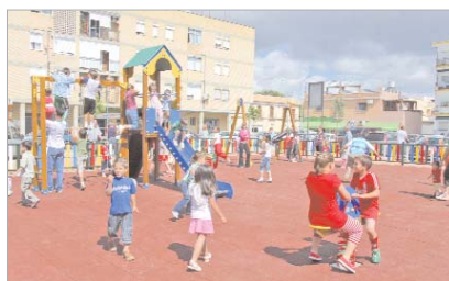
Plaza de La Libertad.

La Rinconada cuenta desde hace unos días con tres nuevas plazoletas totalmente reformadas, que forman parte del plan de plazas que el Área de Vía Pública está acometiendo con el objetivo de renovar los espacios verdes y abiertos de la localidad.