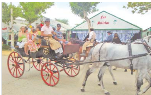
El Real se convirtió en una improvisada pasarela de coches de caballos.