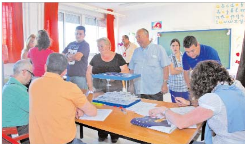
Vecinos de la localidad votando en los colegios electorales.

En la batalla política el PSOE es el claro vencedor puesto que con un 64,72 por ciento de los votos mantiene firme el apoyo ciudadano en