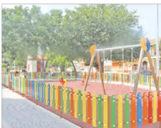
Plaza de La Estacada.