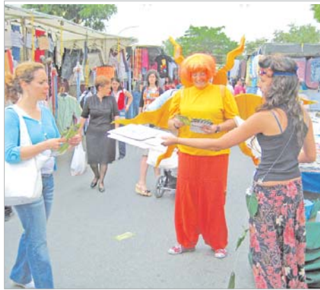
Miembros de La Caracola repartieron folletos informativos.