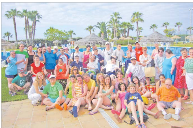
Imagen de los 41 usuarios en la piscina del hotel.

Islantilla, acompañados por 12 monitoras. Este viaje es ya un clásico para los usuarios del Centro Ocupacional y se ha convertido en una de las actividades más atractivas de todo el curso. Durante su estancia, entre los días 1 y 6 de junio, han