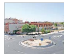
Plan de movilidad y conexiones

Es otra conquista social que se verá complementada con la apertura de nuevas oficinas de farmacia.