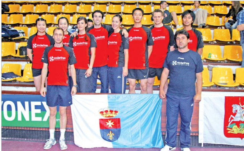
La plantilla del Soderinsa posa con la bandera de La Rinconada antes de medirse a los rusos del Ramenskoe.

El Soderinsa repitió el tercer puesto que cosechó en Moscú el año pasado, un galardón que tiene un mérito tremendo a tenor de los contrincantes que se dieron cita en Sofía.