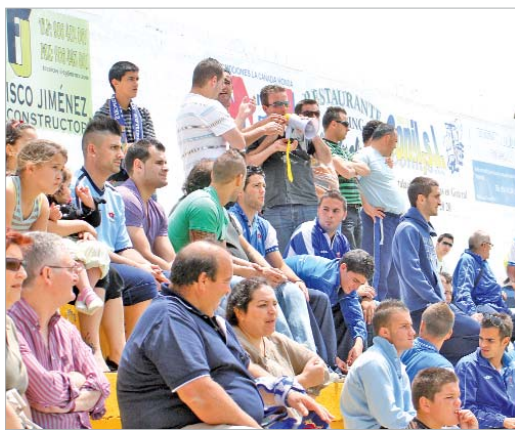
Los aficionados no se perdieron ni un detalle del encuentro.