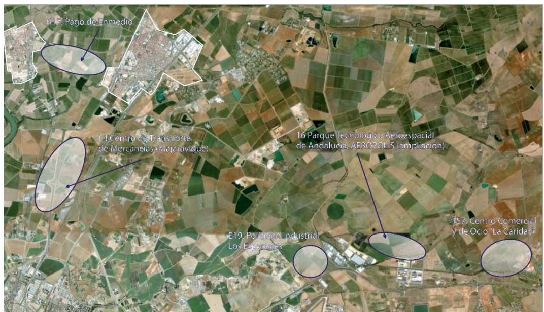
Término municipal de La Rinconada.

De ellas, se desgajan cuatro grandes zonas de oportunidad empresarial con una suma total próxima a los seis millones de metros cuadrados, "con los que aseguramos que el crecimiento productivo que la localidad viene experimentando en la última década encuentre posibilidades para seguir generando riqueza y empleo", explica el alcal-