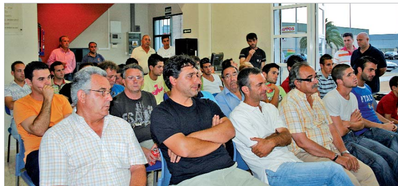
Representantes del San José y el Rinconada abarrotaron el hall de los estudios centrales de la Radio.