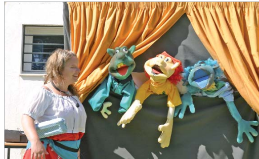
Los más pequeños disfrutaron también de una actuación de títeres.

El Área de Medio Ambiente ha dado por concluido un amplio calendario de actividades para conmemorar el Día del Medio Ambiente, que tuvo lugar el pasado 5 de junio.