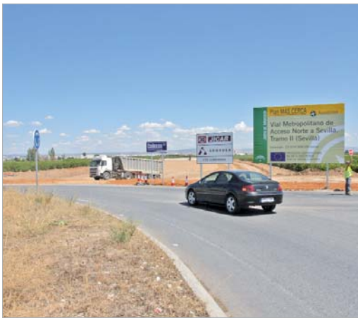
Las obras de la segunda fase de la autovía de Acceso Norte están comenzando.

Con esta inversión, cofinanciada con fondos europeos del programa Feder, se estima que se crearán unos 495 puestos de trabajo, de los cuales 287 serán directos y 208