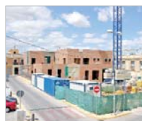
El Centro de Salud de La Rinconada

El voladizo del Estadio estará listo y muy avanzadas el resto de remodelaciones previstas