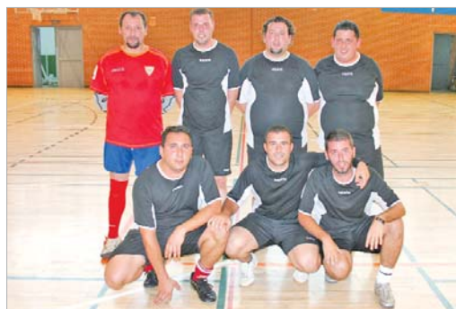
Los Ozanapios ascienden a Segunda tras estar líderes toda la campaña.