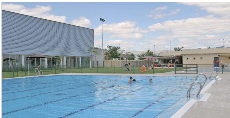
La piscina anexa a la Piscina Cubierta ofrece por primera vez baño recreativo.

La oferta de actividades acuáticas en la localidad no termina ahí. Además, entre junio y septiembre la Escuela de Piragüismo ofrece cursos de tres sesiones semanales.