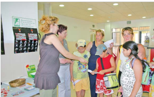
Los vecinos recibieron folletos informativos.

Acat, la Zona Básica de Salud y el Área de Igualdad y Bienestar Social organizan actividades de concienciación y sensibilización