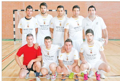
El Fulham 05 se ha proclamado campeón por segundo año consecutivo.

Además, también jugarán en Tercera el próximo año Los Talega, últimos de la tabla, el Bar Corona Estación de Servicio Casimiro y el Tres Calles C que después de tener la salvación casi amarrada se complicó al final y lo terminó pagando. Suerte a todos para la Liga 2010.