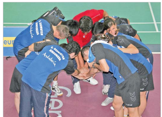
Grito de guerra del Soderinsa antes de comenzar el duelo ante Rusia.