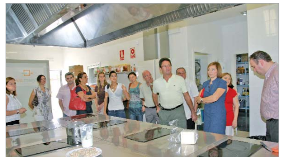
Los asistentes conocieron las instalaciones por dentro.

Además, este espacio tiene capacidad para desarrollar acciones adaptadas a la demanda de formación continua, privada, seminarios o jornadas, relacionadas siempre con la hostelería y el turismo.