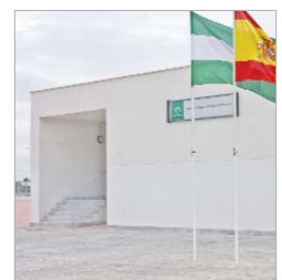
Nuevo colegio Blanca de los Ríos.