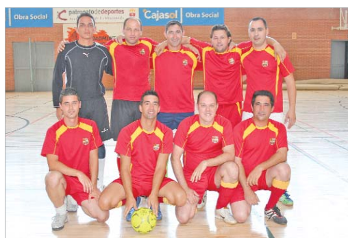
El Fútbol Club Bacilona acabó primero tras no presentarse el Cañamera.