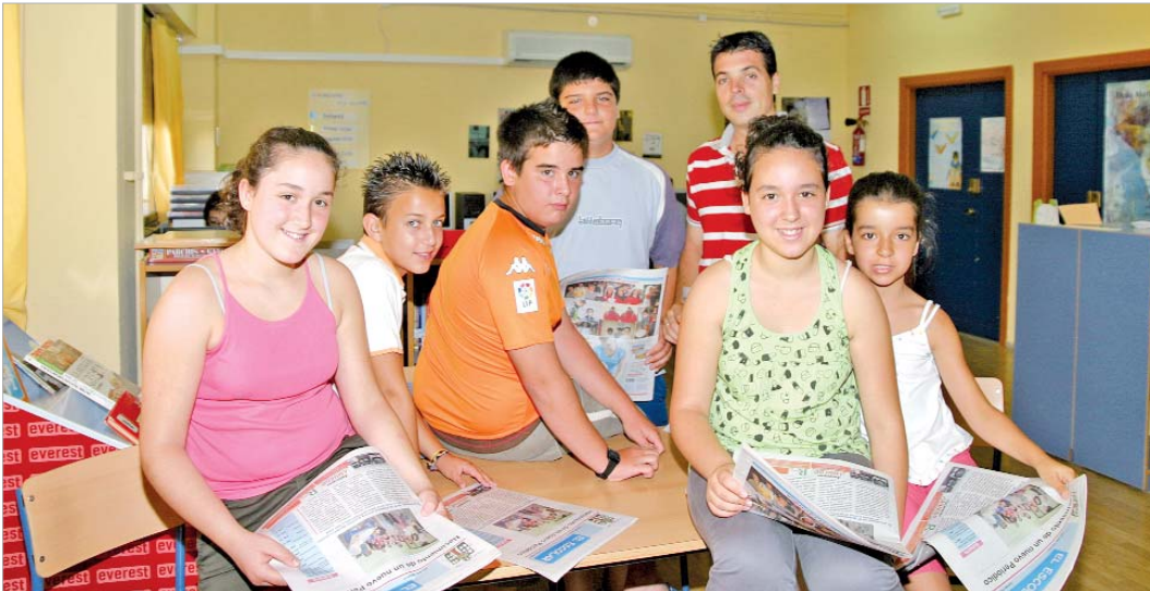
El profesor-coordinador del proyecto, junto con algunos de los alumnos que han elaborado el periódico.