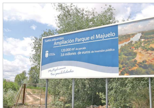
Las obras del Majuelo empezarán durante el verano.

También de interés metropolitano será el Parque de Las Graveras que incluirá otras diez hectáreas. Este espacio se articulará en torno a una antigua gravera junto a las naves de la fábrica de tabaco y contará con un