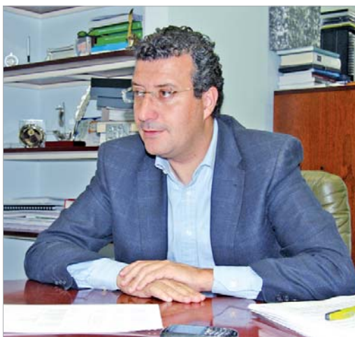
El alcalde analiza diariamente el estado de los proyectos.

parte indivisible del modo en que gobernamos desde hace 26 años. La tendencia es al aumento de la calidad y de la eficacia: con nuevos centros de salud y las farmacias, con un estudio milimétrico de las necesidades de colegios, con la atención a mayores, personas con discapacidad