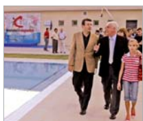
Plan de Instalaciones Deportivas

Que La Unión sea un proyecto cien por cien público garantiza que