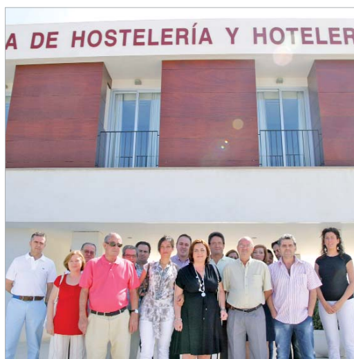
La delegada de Desarrollo Económico, con los empresarios.

Por ello, la delegada ha explicado a los asistentes que "queríamos mostraros el trabajo que los alumnos desarrollan en estas ins-