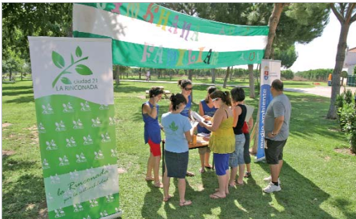
Las familias participaron en una gymkhana en El Majuelo.

Durante todo el mes de junio el Ayuntamiento ha estado realizando actividades para involucrar a la población en la lucha por la sostenibilidad del entorno