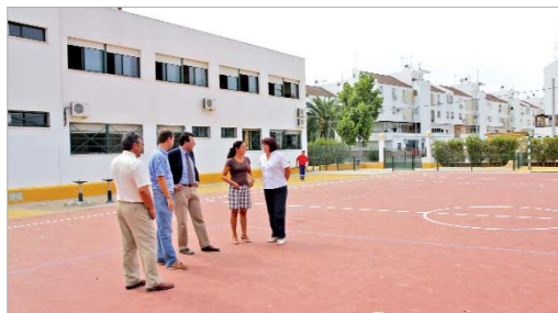
El colegio Los Azahares cuenta para este curso con una pista polideportiva.

Y es ese contacto fluido y continuo que se mantiene desde el Área de Educación y Vía Pública con los directores y las AMPAS el que permite que los centros estén en perfectas condiciones cada comienzo de