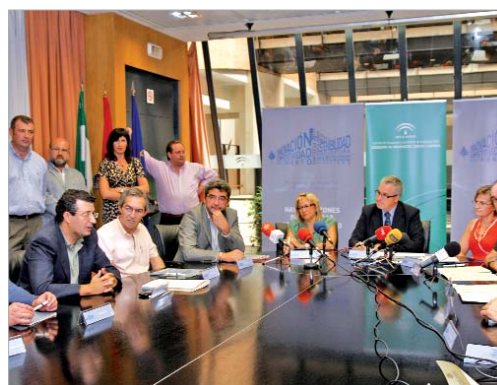
El alcalde durante la firma del convenio con la agencia IDEA.

A este programa podrán acogerse empresas del sector industrial, servicios a empresas, medio ambiente y comercio al por mayor. Las compañías interesadas en adquirir estas naves obtendrán una serie de incentivos que podrán llegar hasta los 500 euros. Además los proyectos promovidos por jóvenes emprendedores y mujeres tienen un 20 por ciento adicional sobre la base incentivable e incentivos reintegrables. Además, los emprendedores podrán acogerse a un 50 por ciento de anticipo para la compra de la nave y hasta la subsidiación del tipo de interés en, como mínimo,