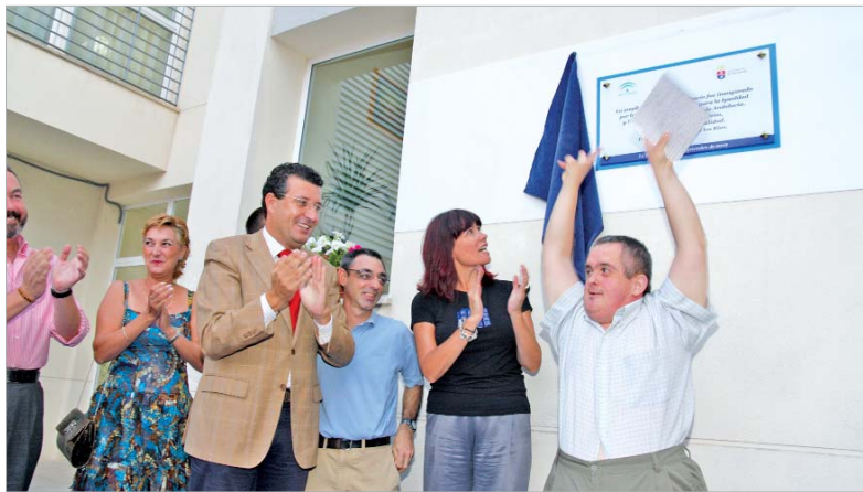
La consejera de Igualdad y Bienestar Social y el alcalde, tras descubrir la placa inaugural de la ampliación de la Residencia.

En la inauguración de la ampliación de la Residencia, estuvieron presentes la consejera de