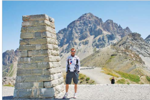
El gran reto de los Alpes franceses.