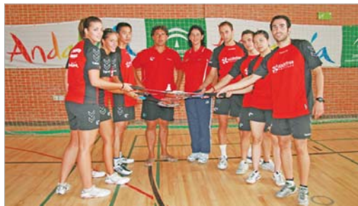
La primera plantilla del Soderinsa antes de comenzar la competición.