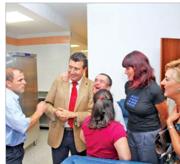
Alcalde y consejera conocieron las instalaciones por dentro.