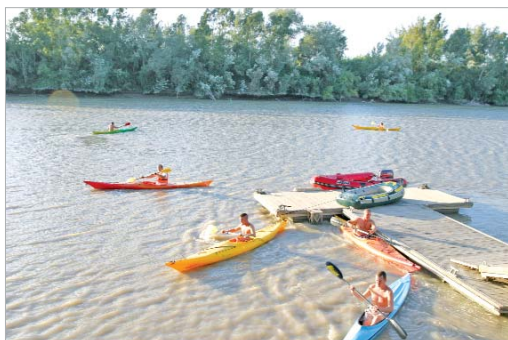
Usuarios preparándose para salir al río en piragua.