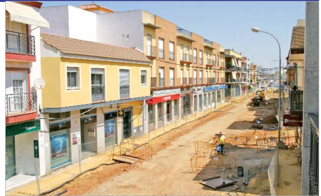
Las obras de las calles aledañas al arroyo estarán concluidas antes de las Navidades.