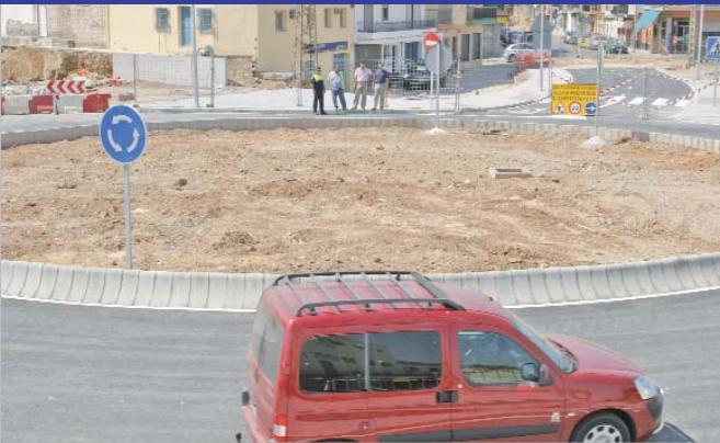
Ya está terminada la segunda gran rotonda del bulevar del arroyo.