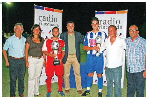
Foto de familia tras la entrega de los Trofeos Radio Rinconada.