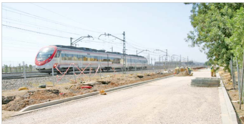
Espacio en el que ya se trabaja para poner en marcha la segunda estación de trenes.

En paralelo, el Ayuntamiento está reformando las calles próximas a la futura estación de Cercanías