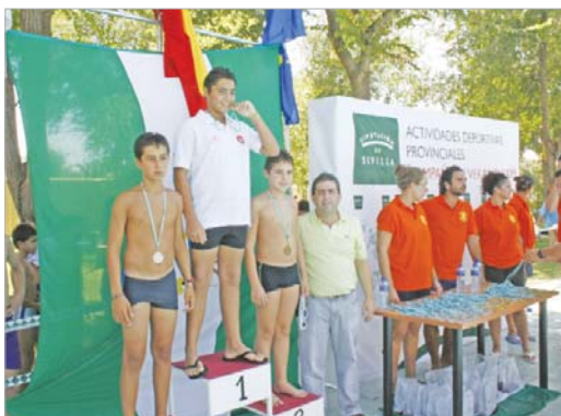
Los participantes locales consiguieron un gran número de medallas.