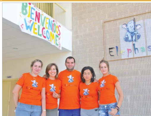
Equipo de profesionales de Elephas.

mos a ganar el concurso a pesar de competir con empresas de gran peso, porque lo que planteábamos era otra manera de entender la educación del primer ciclo". Y no es para menos. Entre la oferta formativa del centro se encuentra la inducción a las nuevas tecnologías, la iniciación en el inglés, la introducción a la agricultura ecológica y la animación a la cultura emprendedora, incorporando a los padres. Asimismo, se van a formar grupos de reflexión compartida (escuela de padres) y se fomenta entre los padres la lactancia materna.