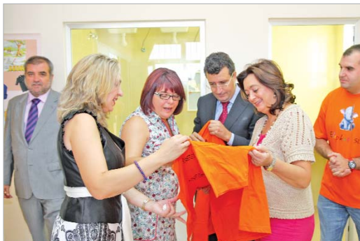
El centro está gestionado por la empresa Elephas.

ción de primera, de calidad, que nos ayuda a crecer y que incluye en él desde este curso a las antiguas guarderías".