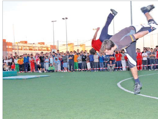
Jóvenes en la primera exhibición del programa Red Creajoven.

propuestas deberán tener una duración de entre 20 y 45