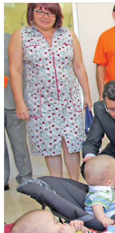
La consejera de Educa-

Y es que, como señaló la consejera "no sólo se trata de un cambio de nombre, sino que el paso de 'guardería' a 'escuela' introduce como obligatorio un proyecto didáctico adaptado a las edades más tempranas que se integra en el modelo educativo andaluz". En este sentido, Moreno resaltó "la apuesta del gobierno autonómico por la implantación de este nuevo sistema que permite acceder a una educa-