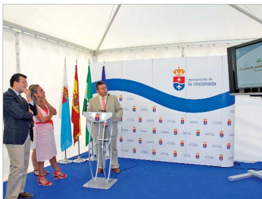
La consejera atiende las explicaciones de la obra.