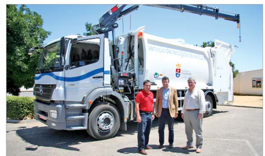
Alcalde y delegado de Vía Pública, junto al recién adquirido camión.

Respecto a sus características técnicas, éste cuenta con 21 metros cúbicos de capacidad y está perfectamente adaptado para recoger tanto los contenedores aéreos como los soterrados. Cuenta, además, con todos los adelantos técnicos necesarios para un desarrollo óptimo de su trabajo. El alcalde señala que "con el La Rinconada cuenta ya con tres líneas de recogida de basuras, lo que