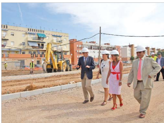
Alcalde, delegada provincial, consejera y edil de Urbanismo, durante la visita.