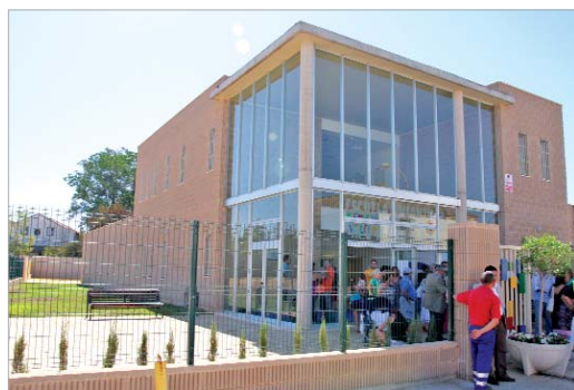
La empresa trabaja en la Escuela Infantil de la barriada Santa Cruz.

Desde el principio tuvieron claro el tipo de empresa que querían crear. Tenía que ser innovadora, con más participación de los padres y un lugar determinante para el desarrollo del niño en sus primeros años de vida. Según el equipo que conforma Elephas, lo más importante para ser la concesionaria de las instalaciones de la guardería era "creérselo" y "tener ganas e ilusión". "Desde el principio confiábamos en que iba-