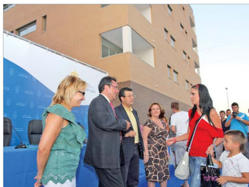
El consejero de Vivienda y el alcalde, durante la entrega de llaves.

Cada piso cuenta con casi 70 metros cuadrados repartidos en tres y dos dormitorios, salón, baño y coc-