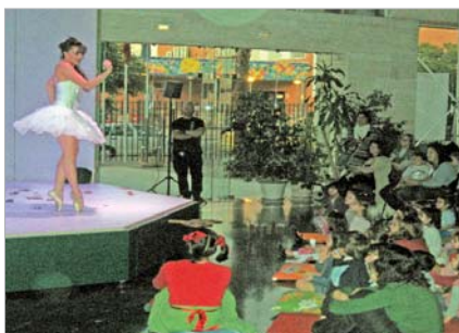
El hall del teatro acogió la obra 'Caja de Música'.