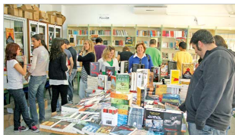
Alumnos del instituto San José visitando la feria del libro.

ha sido provechoso: "La participación ha sido muy positiva, seguiremos haciéndola año tras año, los