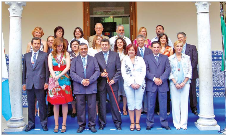
Composición de la corporación municipal de la presente legislatura.