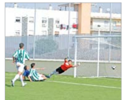
Remate de Antoñito que hace el 2-0.