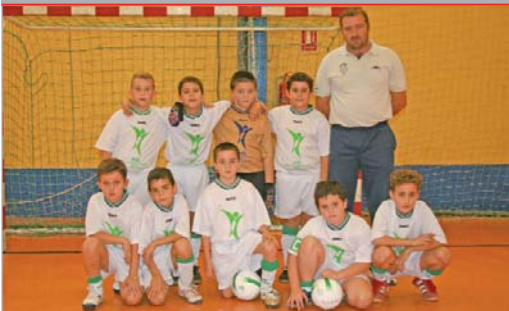
La plantilla benjamín del Tres Calles ha debutado esta campaña en la competición.