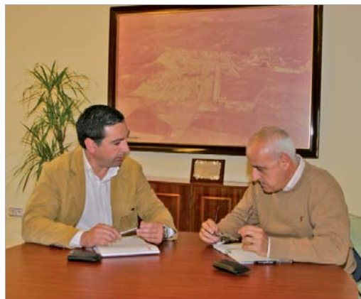
El delegado de Vía Pública y el gerente del consorcio, durante su reunión.

En cuanto a las líneas que enlazan con la capital, el Consistorio está estudiando la implantación de mejoras en el recorrido y en los horarios de los fines de semana para reforzar el servicio.