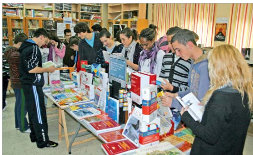
Los jóvenes visitando el stand de la feria.

La Paz, ha puesto un stand con las últimas novedades que interesan a jóvenes y adultos. Los diferentes grupos del centro han visitado a lo largo de la semana la feria en dos ocasiones. Una primera para un acercamiento a las obras y otra para realizar sus compras, con descuentos, o resolver las posibles dudas que tuviesen. Las novelas más demandadas han sido las