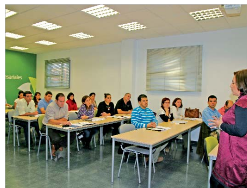
Pilar G. Extremera visitó a los alumnos en una de las sesiones.

La delegada de Desarrollo Económico, Pilar García Extremera, visitó recientemente una de las clases y aprovechó para recordar a los participantes que "estas acciones formativas se presentan como complemento a otras iniciativas que ponemos en marcha desde el Ayuntamiento y también a la formación que habéis adquirido