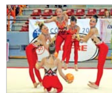
Las chicas, en plena actuación.

notar, ya que hacía mucho tiempo que no iban a un torneo de esta índole. Cuando empezó a sonar la música las dudas quedaron aparcadas y sacaron lo mejor de ellas levantando al público de sus asien-