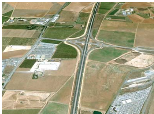
Vista aérea de la zona de Majarabique

da al norte de la capital hispalense entre las infraestructuras de comunicación viaria proyectadas SE-35 y SE-40. Estos terrenos se corresponden en gran medida con los suelos recogidos en la reserva que está tramitando la Consejería