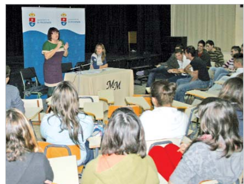
Los alumnos se interesaron por la actualidad del municipio.

Atentos e interesados no sólo en los 30 años pasados, sino -y sobre todo- en el futuro inmediato, en proyectos concretos y en lo que está por venir. Ésa es la filosofía con la que el Ayuntamiento ha querido acercar a los jóvenes el rico pasado político democrático que llevamos ya acumulados.