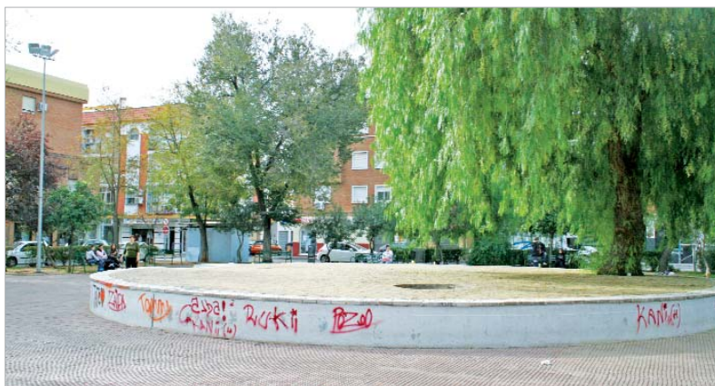
El proyecto de remodelación del Parque de los Pintores se encuentra en fase de redacción.

La remodelación integral de este parque se inserta en el conjunto de acciones de mejora en la escena urbana que acomete el Área de Vía Pública. Además, se actuará en el parque Al-Mutamid y las zonas de juegos infantiles de los parques 8 de marzo, Valle-Inclán y Blas Infante