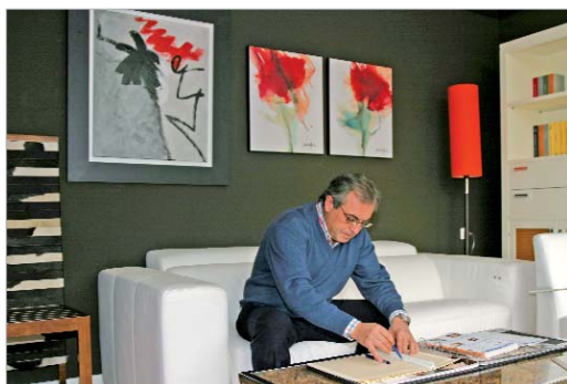
Sus propietarios realizan diseños a medida.

Y es así como sus dueños se han ido abriendo paso para a continuación consolidar su negocio en el municipio, siempre pensando en el comprador para ofrecerle lo mejor y que se marche de sus instalaciones lo más satisfecho posible por si algún día decide regresar.