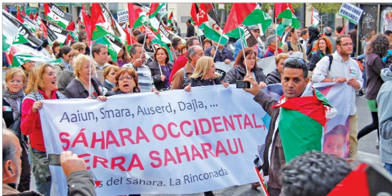
El grupo de rinconeros durante la manifestación.

La marcha, que finalizó en la Puerta del Sol, fue organizada por la Coordinadora Estatal de Asociaciones de Amistad y Solidaridad con el Pueblo Saharaui y la Plataforma Cívica Pro referéndum del Sáhara.