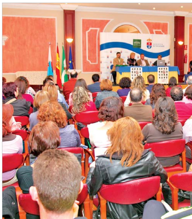
Un numeroso público acudió a la segunda edición de las Jornadas de Estudio sobre la violencia de género.

A partir de ahí, Argota consideró que "es el momento de subir un escalón y afinar en la coordinación mediante elementos que faciliten el trabajo y la calidad de la atención integral para trasladar a las