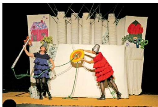
La compañía Buho Teatro.

se representan, es el precio asequible de las entradas -sólo tres euros- lo que permite acercar el mundo del teatro a todos los ciudadanos del municipio.