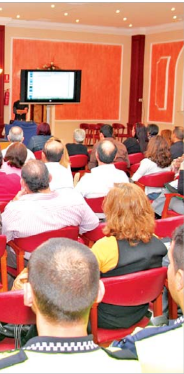
lencia basada en el género que se celebró en el Salón Royal.

Las tres asociaciones de mujeres del municipio se 'movilizan' en repulsa de la violencia de género y apoyo a las víctimas