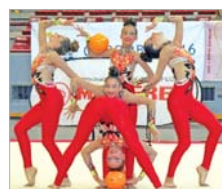
En el momento del comienzo.