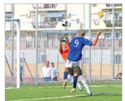
Jesús hizo el tercero en este remate.