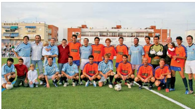
Foto de familia de los participantes en el encuentro.

Toreros y artistas se reunieron en el 'Castañita' para apoyar al equipo de fútbol San José