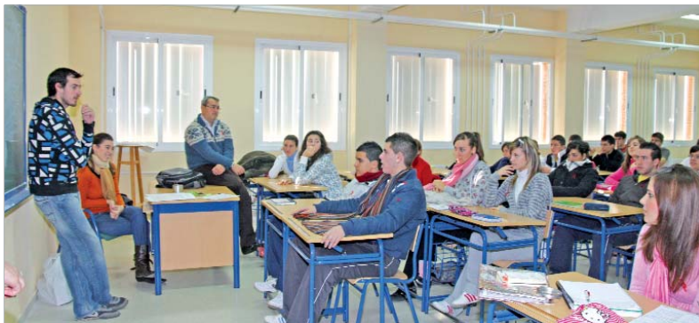
Charla sobre Sida del año pasado.

El Área de Juventud pretende involucrar a los jóvenes en la lucha contra el VIH y concienciarlos de practicar un sexo seguro