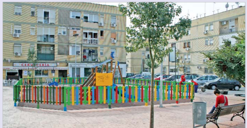
La plaza se denominará Monserrat Andrade en memoria de una vecina asesinada a manos de su marido en 2006.

Este lugar se llenará de vida convirtiéndose en punto de encuentro de los vecinos de la barriada Santa Cruz. Para ello se ha acondicionado con mobiliario urbano, arboleda, zona de juegos infantiles y se ha pavimentado el paseo que comunica con la calle Rafael Alberti, en un