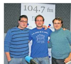
'A la verita de tu novia'.