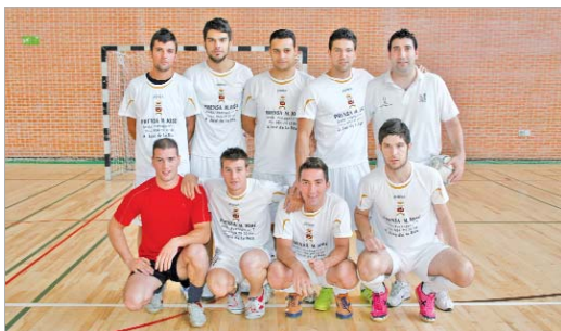
El Fulham 05, vigente campeón, arrancó ganando al Chiquitistán por 4-2.

La Liga Local de fútbol sala ha arrancado una nueva edición marcada por la emoción y por la creación de la División de Honor, que permitirá a los diez mejores equipos clasificados de la pasada temporada jugar en una categoría a ida y vuelta, lo que permitirá enmendar errores en los duelos directos, al tener otra oportunidad con el mismo conjunto. Además, de ello ha derivado la inclusión de nuevos equipos que estaban en lista de espera en el