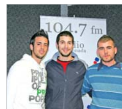
'A.G.R. La Esperanza...'