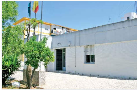
La sede de la Policía acogerá el Centro Municipal de Información a la Mujer.

Los servicios públicos relacionados con las personas con discapacidad, los mayores (con el programa Aula Abierta y los talleres