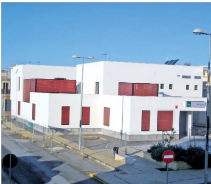
El complejo sanitario se ubica en la barriada Santa Marta.

204 parcelas públicas conforman este parque empresarial urbano que se convierte en el único de la localidad que además de espacios productivos, incluye 3.000 plazas de aparcamiento, 55.000 metros cuadrados de espacios verdes, y estancias de paseo y recreo del arroyo Almonazar, en cuya ribera se podrán realizar recorridos de hasta 2,7 kilómetros en bicicleta o a pie.