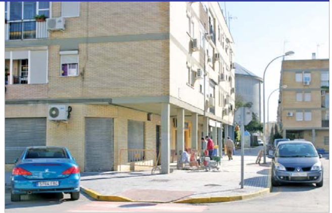
Los soportales de la barriada Santa Cruz renuevan su aspecto.