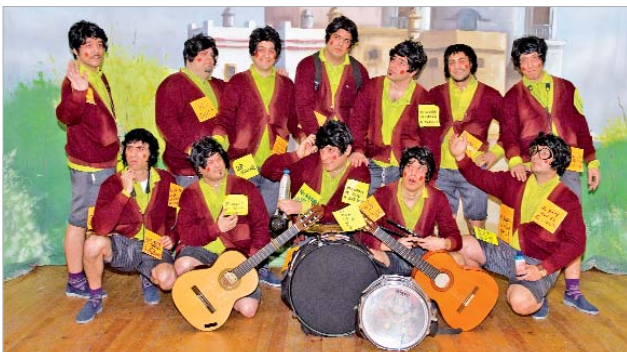
La chirigota 'Ojú, que cabeza tengo' ha pasado a cuartos del Concurso de Agrupaciones de Cádiz.

En definitiva, el Carnaval se presenta más apasionante que nunca y resulta imposible predecir quienes serán los favoritos del jurado. Lo que está claro es que las calles ya rebosan papelillos y serpentinatas y que, aunque el carnaval no ha tomado aún el municipio, las ganas de coplas predicen un éxito asegurado de la fiesta del disfraz.