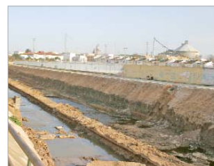
El arroyo antes de comenzar su embellecimiento.

turbia que desprendía malos olores, pero no será hasta el mes de abril cuando comprueben de primera mano el 'espectacular cambio' que ha experimentado esta zona del municipio. Será entonces cuando la primera fase de urbanización del arroyo se abra al público y puedan disfrutar plenamente de sus potencialidades.