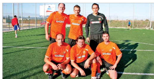
El Fútbol Club Bacilona, uno de los clásicos de la Liga Local, posa para TN.