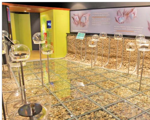
Restos arqueológicos del Museo.

Las Área de Cultura y de Urbanismo y Medio Ambiente se han unido al grupo de investigación de la Universidad de Sevilla 'Geografía, Física Aplicada y Patrimonio' para llevar a cabo un estudio sobre el cuaternario aluvial de La Rinconada, a través del control y seguimiento esporádico de los numerosos frentes de explotación de áridos localizados