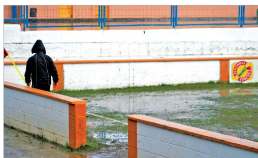
El estado del Municipal de Las Cabezas imposibilitó la disputa del partido.