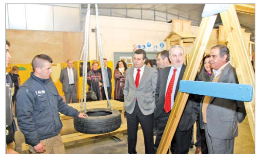
Los alumnos muestran el trabajo realizado.

Este grupo se divide en tres especialidades. Los alumnos de jardinería se encargan de plantar árboles de sombra, coníferas y arbustos,