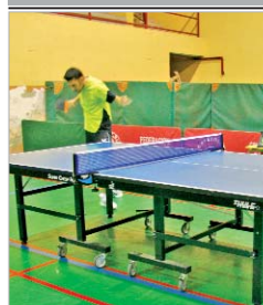
Imagen de un partido de la entidad.