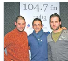
'Debemos hasta el disfraz'.