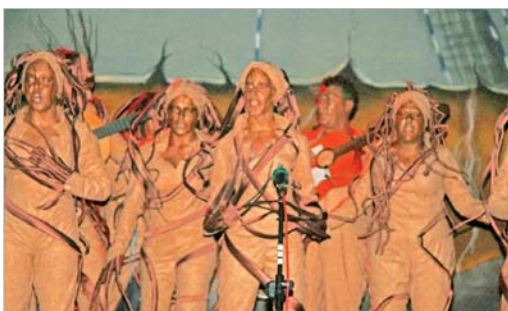
La comparsa de las niñas vuelve al Gala tras 'Arraigadas', en 2008.