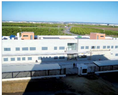
La Central de Seguridad tendrá capacidad para acoger a más de 100 efectivos.