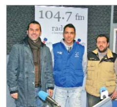
'No gano pa' chaquetas'.