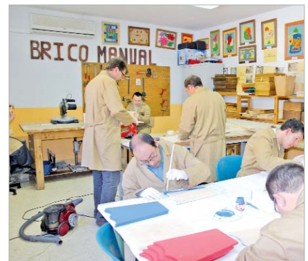
Las aulas del Centro Ocupacional tendrán más amplitud.