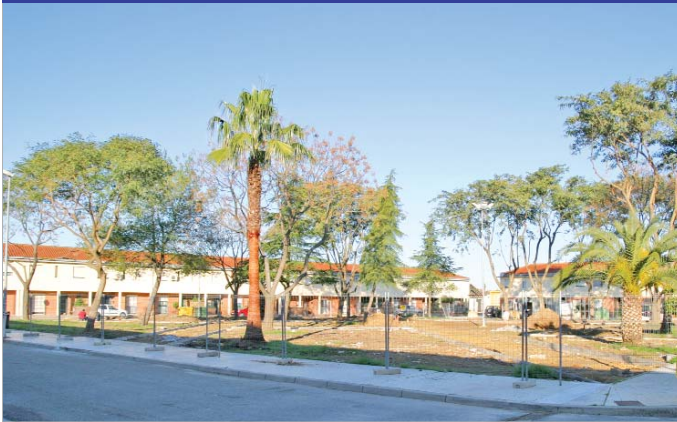
Las actuaciones en la plaza Antonio de Mairena continúan a buen ritmo.