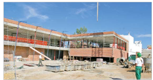
Las instalaciones del nuevo Ayuntamiento estarán listas este año.

La nueva rotonda del quiosco de 'la turronera' y las mejoras en la pista del colegio Azahares, también formaron parte del conjunto de proyectos que se financiaron con estos fondos y de los que ya pueden disfrutar los vecinos.