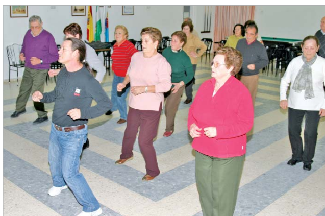
El taller de baile de salón es de los más demandados.

El baile, la gimnasia, las manualidades y la informática tienen muy buena aceptación entre los usuarios que aprovechan las clases para divertirse a la vez que fomentan un envejecimiento activo