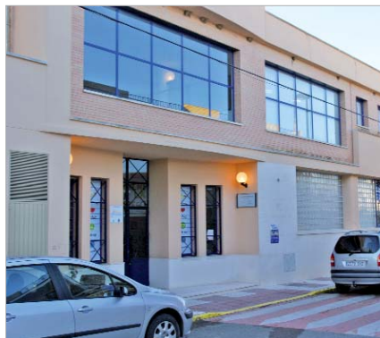
La Guardería Gloria fuertes aumentará en 26 sus plazas.