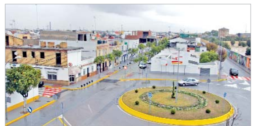
La calle Los Carteros totalmente acondicionada.