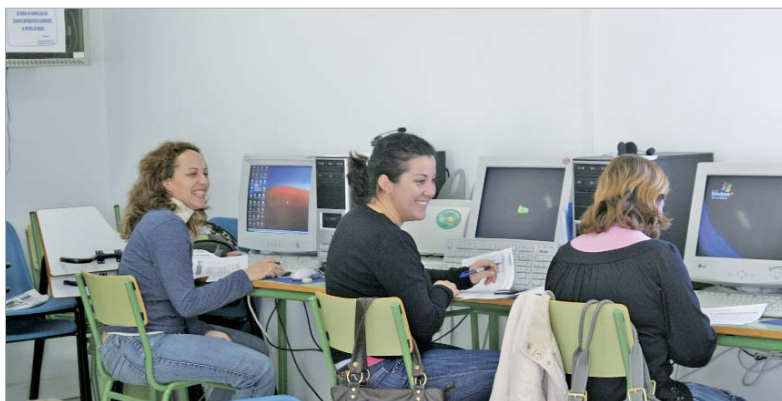
Alumnas del taller de informática de la pasada edición.

pretende fomentar el sentimiento de valía personal y social de las participantes, así como dotarlas de herramientas útiles para relacionarse de una manera más saludable, motivándolas en el ocio compartido, intercambio y utilización de un tiempo libre creativo. El cinco del mismo mes empieza el taller de 'Comunicación e interacción social', con el aprenderán a escuchar y hablar de manera que se sientan