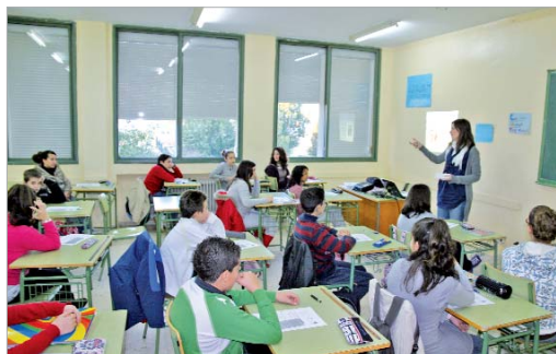
Charla en el instituto Miguel de Mañara.