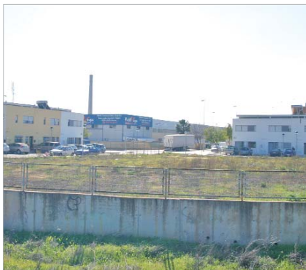
El Cañamo 1 contará con pistas polideportivas.

Las inversiones se enmarcan dentro del conjunto de medidas promovidas por la Administración Central dirigidas a impulsar la recuperación económica y la creación de empleo así como para financiar proyectos de desarrollo sostenible. La ampliación de la guardería Gloria Fuertes, el nuevo edificio del Centro Ocupacional de Torrepavas y la creación de instalaciones deportivas, los proyectos locales más destacados