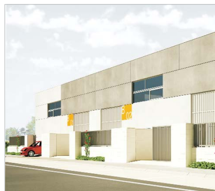
Se construirán dos naves en el Cañamo 3.

Nueve proyectos municipales se adelantarán en el calendario local gracias a la activación del Plan 5.000, un nuevo programa de inversiones extraordinario que desarrolla el Gobierno Central y que dará continuidad este año al vigente Fondo Estatal de Inversión Local (Plan E) que inició su ejecución en 2009, para impulsar la economía y la creación de empleo.