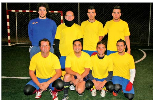
Máster Rápido se quedó fuera de los cuartos en el último triangular.