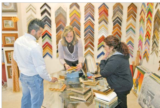
El trato personalizado es su seña de identidad.

Sin duda, gracias a esta implicación, nuestra protagonista ha consolidado una clientela bastante fiel y ha convertido a Cuadros Molina en un referente no solo para los vecinos del municipio, sino también de los alrededores. "A la tienda acude gente de Guillena, Alcalá del Río o Brenes, y aunque funcionamos sobre todo por el "boca a boca", proyectos como la Campaña de Apoyo al Comercio Local, impulsada por el Ayuntamiento, suponen una gran ayuda y un estímulo para reactivar las ventas", finaliza.