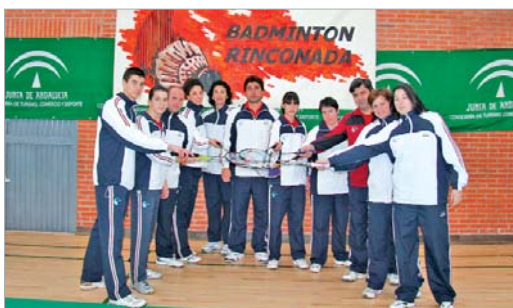
El tercer equipo rinconero, antes de certificar su pase a la final.