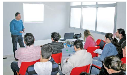
Los alumnos durante el desarrollo de las clases.

de Bomberos ubicado en el núcleo de San José de La Rinconada es la sede de este curso que tiene una duración de 40 horas.