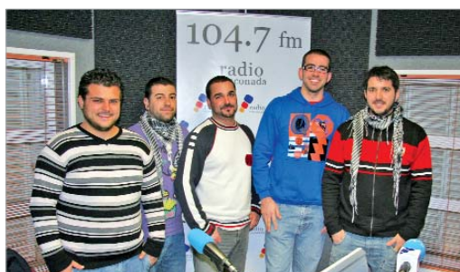
'Los que se mueren por el día 10' en los estudios de Radio Rinconada.

Durante el concurso, que, por primera vez en su historia, es provincial y se extiende durante seis días, la Radio llevará en directo a los hogares la retransmisión íntegra del evento.