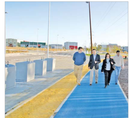
El Cádiz 3 cuenta con 204 parcelas públicas.