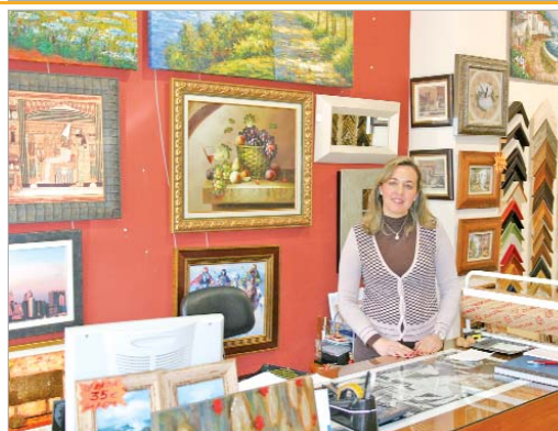
La propietaria en el mostrador del establecimiento.

meros años de dificultades. "Invertimos todos nuestros ahorros en la tienda y hasta que ésta empezó a despuntar vivimos momentos muy malos y de mucho agobio. Pese a todo, con esfuerzo y dedicación se sale adelante", recuerda.