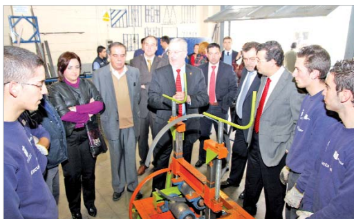
En su visita a la aula de carpintería metálica.

El parque de las Graveras contará con 15 hectáreas en las que se localizará un lago artificial en el que se podrá practicar deportes acuáticos como la piragua o el remo.