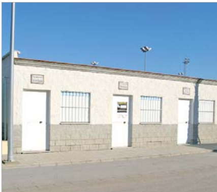
Cuatro clubes deportivos contarán con una sede social.

El Área de Igualdad y Bienestar Social prevé aumentar las plazas en 60, una vez que la Junta de Andalucía apruebe su petición.