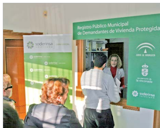
Los interesados tienen que acudir a la oficina de Vivienda para inscribirse.

Los interesados pueden tramitar su inscripción en cualquier momento a través de la web: soderinsaveintiuno.com o personalmente ante el Registro Público de Demandantes de Vivienda ubicado en la empresa municipal, en horario de 8.00 a 14.30 horas.