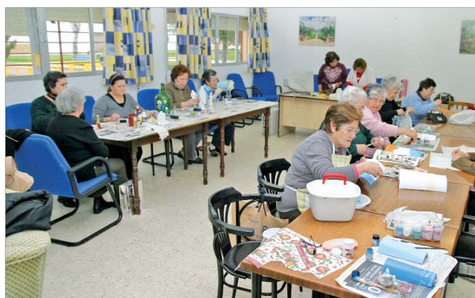
Las mujeres realizan manualidades en el taller.

Promover la convivencia de las personas mayores, el apoyo a su integración y el fomento de la participación mediante actividades de tiempo libre son los objetivos de estos Centros de Día de Mayores, más conocidos como hogares del pensionista.