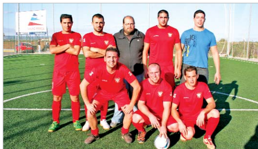
El Peña Sevillista ganó en su debut por un ajustado 5-4 al F. C. Bacilona.

En Tercera, con muchos equipos noveles, algunos de los veteranos tiraron de experiencia para situarse en el grupo de cabeza. Así, Nirvana Soccer ganó a los Polivalentes por 9-2, y el Che Gastón Café Bar La Oficina hizo lo propio con el Wisla 08, al que derrotó por un contundente 7-2.