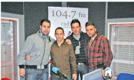
Algunos miembros de 'Los Siembravientos' en Plaza Maracena.