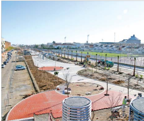
Vista del estado actual de los primeros 480 metros de bulevar.

La urbanización se mantendrá en la misma línea incorporando el parque del Pueblo Saharaui y creando para los vecinos de la zona unas instalaciones deportivas de barrio.