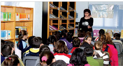
Los niños del colegio Los Azahares durante la sesión de cuentos.

17.00 horas sesiones de Cuentacuentos para niños de cuatro a siete años, los denominados 'primeros lectores'. En éstas no sólo se leen cuentos sino que también se intercambian experiencias sobre otras narraciones escuchadas.