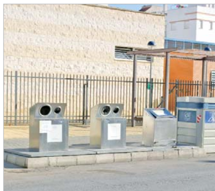
Nuevos contenedores soterrados para varias vías del municipio.