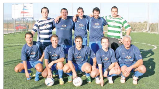
El Mecancor Cachimba debutó con victoria frente al Boca Juniors (4-2).