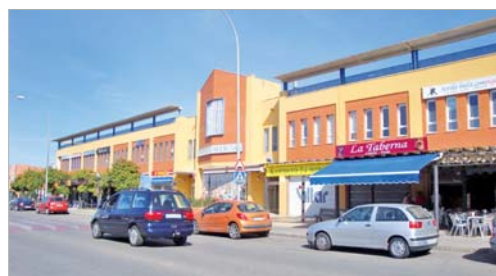
Varias empresas locales se acogen a las subvenciones de la Junta.

hasta un 50 por ciento del presupuesto aceptado, según cada caso, siendo las acciones más subvencionables la mejora tecnológica y las destinadas a garantizar la seguridad.