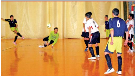
El Tres Calles hizo bueno en Estepa el empate cosechado ante el Guadalajara.