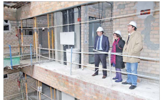
El alcalde y la delegada de Vivienda en la promoción Huerta de Amores.

Por último, se están construyendo los 44 dúplex en venta de la zona Rinconada Oeste, que cuentan en su mayoría con casi 70 metros cuadrados y un precio de venta de unos 79.500 euros. Según avanza la edil de Vivienda, "esta promoción estará terminada a principios del próximo año".