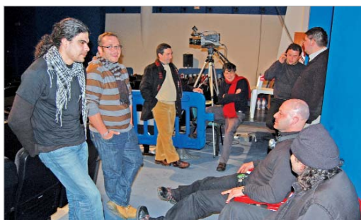
Parte del equipo técnico del Antonio Gala espera el veredicto del Jurado.