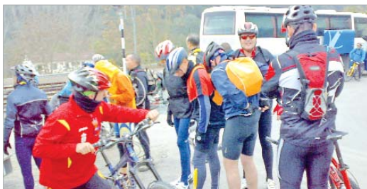
Imagen de la ruta que se desarrolló desde Cazalla hasta La Rinconada.

Un grupo de aficionados al ciclismo de La Rinconada, integrados en clubes como Los Domingueros o Bici Manía Extreme han realizado recientemente el trayecto que une Cazalla de la Sierra con La