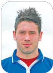
Lobo San José

El incansable carrilero del equipo cañamero anotó un nuevo gol en su cuenta frente al Mosqueo, definiendo como si de un delantero centro se tratase ante Revuelta. El cantarrano está dando la cara cuando el equipo le necesita.