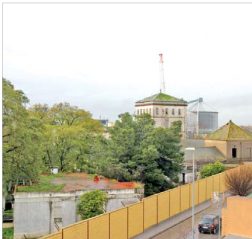
Vistas de la Hacienda Santa Cruz.

Con la idea de seguir ofreciendo diferentes oportunidades que deriven en la consecución de un puesto de trabajo, el Ayuntamiento de La Rinconada ha solicitado a la Junta de