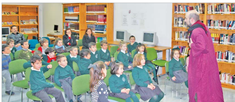
Los alumnos del PUA escuchan las historias en la biblioteca.

Por otro lado, en la biblioteca de La Rinconada el poeta Francisco Belmonte habla cada martes del mes de febrero de su obra poética y la recita a los alumnos del colegio Guadalquivir con el único fin de aunar a las diferentes generaciones y transmitir su amor por las letras a los más pequeños.