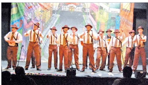
La comparsa del pregonero se llevó el premio al mejor piropro a La Rinconada.