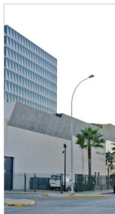
Centro Cultural de La Villa.

Los actos finalizan los días 25 y 26 con unas jornadas sobre Formación en Género e Igualdad de Oportunidades en la sede de la Asociación de Mujeres Abiertas al Futuro (AMAF).