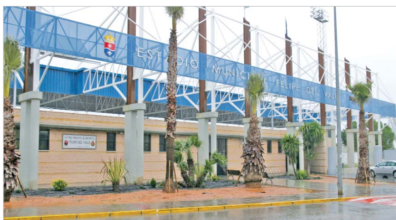
Los usuarios de las Escuelas deportivas de adultos se beneficiarán de las nuevas instalaciones.

Asimismo, en el Felipe del Valle se cambiará, además, el campo de albero anexo por uno de césped, cuyas obras también se iniciarán antes del verano.