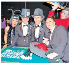
La comparsa mairenera Hagan juego .