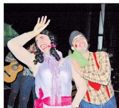
La chirigota A la verita de tu novia .