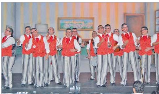
La comparsa de Alcalá de Guadaíra se llevó el primer premio de forma merecida.