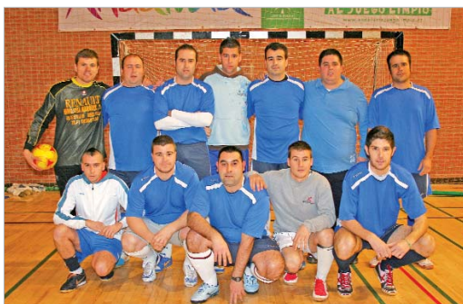
El equipo Hinojosa Márquez, justo antes de la disputa de un partido.