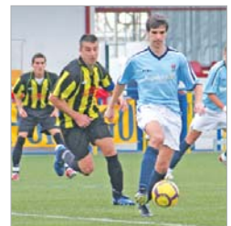
Palacios se marcha de Barrón.

Ahora, toca cerrar la permanencia y dar bola a los canteranos.