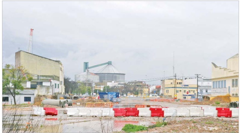
Las obras de urbanización de la siguiente fase comenzarán a principios de primavera.

Por otra parte, Emasesa ha adjudicado los trabajos para la colocación de un colector de dos