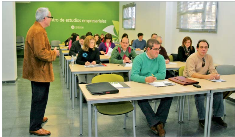
Imagen de uno de los seminarios impartidos en el Centro de Estudios Empresariales.

Los cursos ofertados están teniendo una acogida muy favorable, hasta la fecha se han desarrollado 12 seminarios con un público asistente de unos doscientos alumnos.