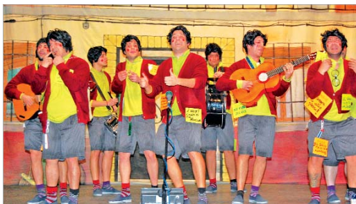
La chirigota Ojú que cabeza tengo se llevó el primer premio en la modalidad.