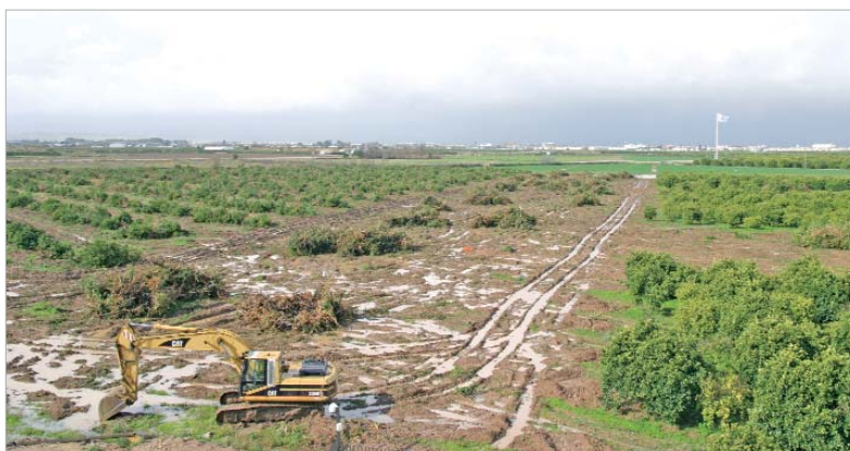
Zona del Pago de Enmedio donde se levantará el futuro viaducto.

'El Abrazo' diseñada por el ingeniero Florencio Pozo tendrá 784 metros