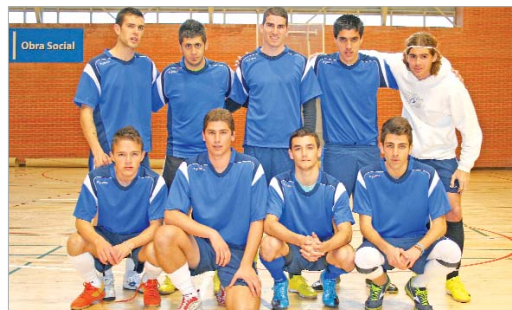
El Drink Team posa para TN antes de jugar su partido ante el Marbu.

Por su parte, la emoción es la nota predominante en la Primera, Segunda y Tercera división, donde grupos de hasta cuatro equipos comparten el liderato. En Primera, la Peña Sevillista , el Unión San José B , Santa Cruz y La Estacada mar-