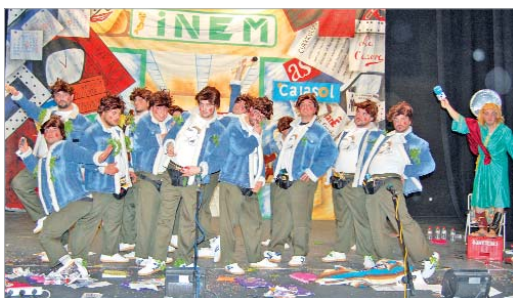
La chirigota de Gamba y Bola, Los que se mueren por el día 10 , fue segundo premio.