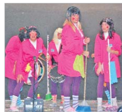
La chirigota El batallón del Neoclor .