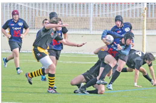
Imagen de archivo del encuentro entre La Estación y el Peñarroya.

La Estación cierra su primera Liga cuarto en la tabla tras ganar al Ciencias en el duelo final