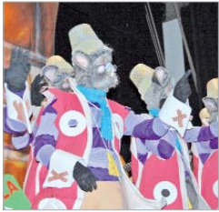
La comparsa sevillana Los Pérez .

Ojú que cabeza tengo cantó a La Unión con un piropo precioso a La Rinconada, cambiando la Estacada y el Lejido por la Azucarera