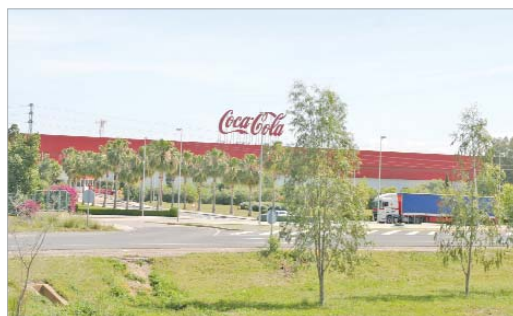
La fábrica produce en el parque empresarial 'Los Espartales'.