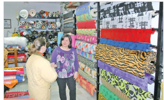
La atención personalizada es clave para Estrella.

textil en nuestro país, de manera que "es muy difícil que la gente no pida telas que nosotros no le podamos conseguir", señala.