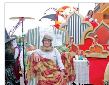
La música y los disfraces inundaron las calles del municipio.