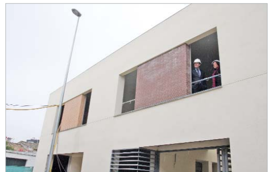
Los ediles en su visita a Huerto del Benito.