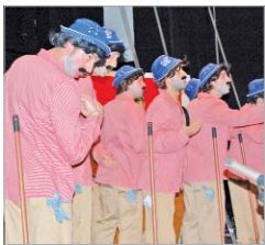
Los algarbeños No gana pa 'chaquetas .