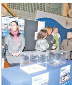
Durante la recogida de fondos.

De momento, aprovechando las actividades culturales, deportivas y lúdicas del municipio, se están colocando huchas para recolectar dinero de forma directa. Además, diferentes proyectos están ultimándose