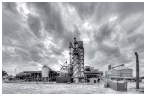
'Un dulce final', de José Manuel Gallego Reina.