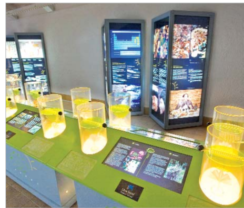
Imagen de la exposición.

'Por narices' entra en el universo de los olores desde una perspectiva de la biología, la cultura y la experiencia directa de oler. Las esencias de la exposición se encuentran diluidas en una combinación de sustancias especialmente diseñadas para cada caso, de manera que el efecto final que se consigue es lo más parecido a lo que realmente se percibe en la naturaleza. La exposición es el resultado de un largo