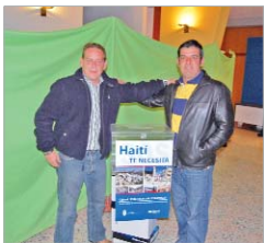
No faltó la solidaridad con Haití.