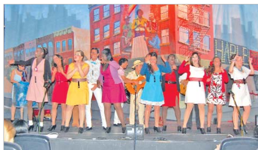
La comparsa Calles de Harlem se llevó el tercer premio en su modalidad.

Por último, declaró que a partir de la Final, "el Carnaval se devuelve al pueblo para que lo disfrute".