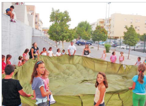
Los más pequeños durante una de las jornadas.

El programa de desarrollo local de la Diputación Provincial de Sevilla 'Plan de Barrios' con la colaboración del Área de Bienestar Social actúa en la zona del Jardín de Las Delicias y Avenida de Portugal a través de una serie de actuaciones encaminadas a generar procesos de desarrollo y mejora de la calidad de vida en estas partes del municipio. Por ello, tres asociaciones que ya venían trabajando en la zona con proyectos individuales han formado un foro de coordinación con el fin de desarrollar la misma orientación en líneas de acción y de ese modo tener una comunica-