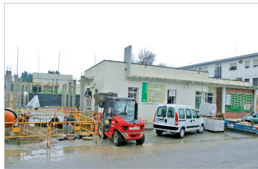
El Centro Comarcal ganará amplitud con la reforma.