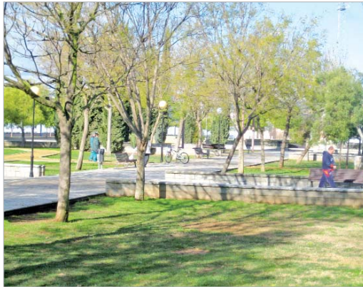
El Dehesa Boyal es uno de los parques con más afluencia de usuarios.

Un total de siete operarios del área se están ocupando de reparar los soportes aplicándoles pintura