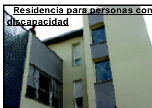
Residencia para personas con discapacidad

res, la residencia para personas con discapacidad o el nuevo instituto de La Rinconada en la barriada Virgen de las Nieves, este último con una dotación de 1,38 millones de euros. La piscina cubierta , con 2,1 millones de euros, o el impacto de las actuaciones en la barriada de La Paz ,