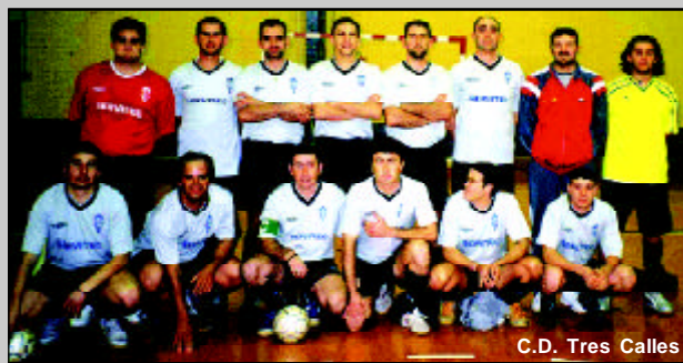
C.D. Tres Calles

Calles a la lucha por el tercer puesto ante Torre de los Guzmanes, club al que los rinconeros derrotaron por 5-3. Ganó el cuadrangular el Olimpic de Triana al vencer por 8-7 al Brújula.