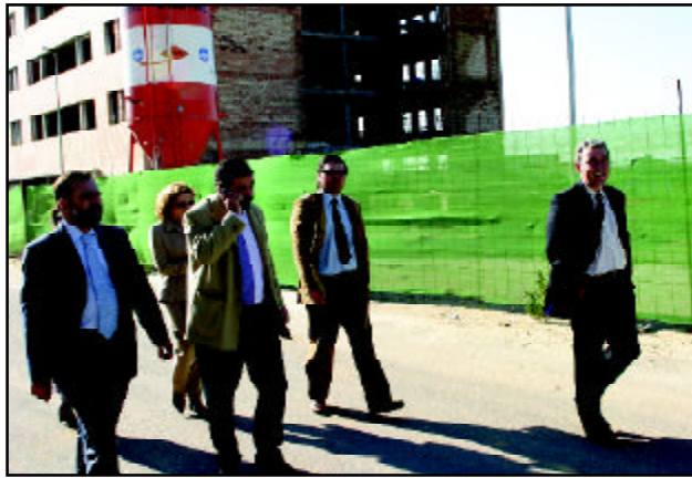
La visita recorrió todas las promociones en marcha. Al fondo, El Mirador.

dad de las obras responde al buen engranaje conseguido entre la promotora, Rinconada Siglo XXI, y la constructora, SoderinSA, ambas empresas municipales».