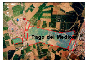
Pago del Medio

El capítulo de inversiones solidarias mantiene en el 0,8 del presupuesto local (89.840 euros) el porcentaje de ayuda al Tercer Mundo, con un apartado especial para reforzar los hermanamientos con Santiago de Las Vegas-El Rincón (Cuba) y Ain El-Beida (Sáhara). Otro de los objetivos de 2004 será la promoción de La Rinconada como «municipio emprendedor, activo y vanguardista», según destacó el alcalde, Enrique Abad.