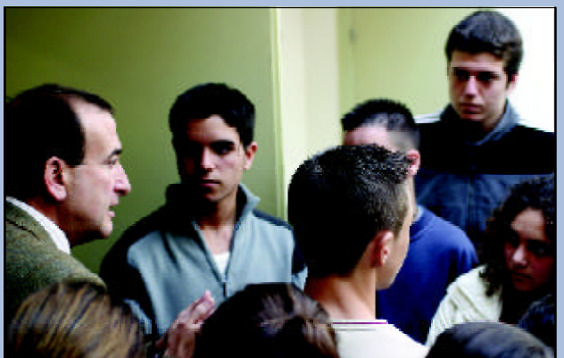
El alcalde, Enrique Abad, comparte desayuno e impresiones con cada grupo de alumnos visitante.

Con el objetivo de dar a conocer la labor de los concejales en los plenos y de acercar la institución a los más jóvenes y aprovechando el 25 aniversario de la Constitución, Presidencia puso en marcha en noviembre pasado el proyecto 'Conoce tu Ayuntamiento', por el que ya han pasado unos 75 alumnos de los IES de la localidad y se esperan 200 más hasta final de año.