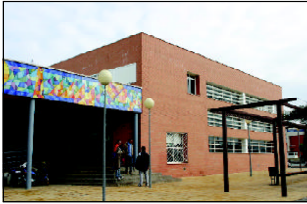
El próximo 10 de febrero finaliza el plazo para solicitar la subvención de uno de los masters más prestigiosos del ramo. El CFM 'Juan Pérez Mercader' es uno de los centros de recepción de solicitudes.

Con esa idea de fondo, Gran Vega activa una de las acciones más novedosas y esperadas, como es la subvención y financiación de este master con el que mujeres universitarias con experiencia profesional podrán perfeccionar sus conocimientos sobre dirección económica y financiera, marketing comercial, recursos humanos, dirección de operaciones y habilidades directivas, con los que ganar cuotas de calidad profesional para ocupar primeros puestos de responsabilidad y gestión empresarial, «ofreciéndoles mecanis-