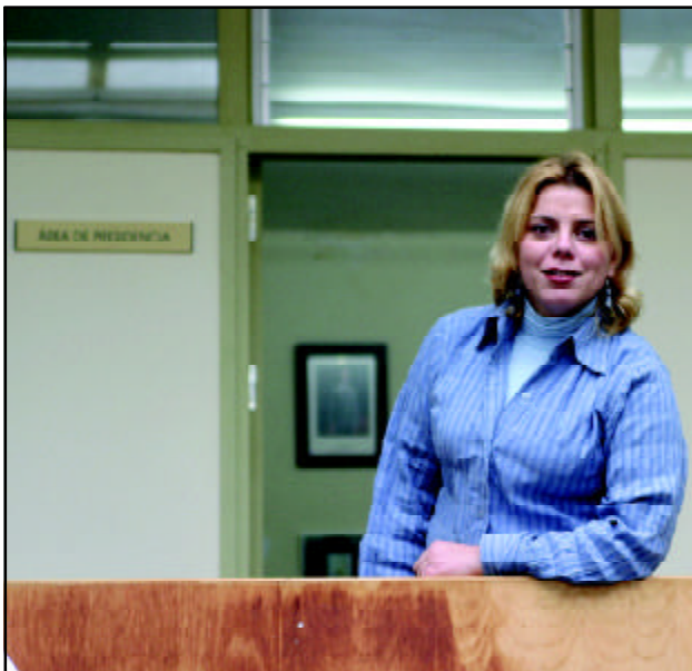
Con ganas. Así es como ha arribado esta joven política a la primera fila de la gestión municipal, haciéndose cargo de Presidencia y de Comunicación e Imagen.