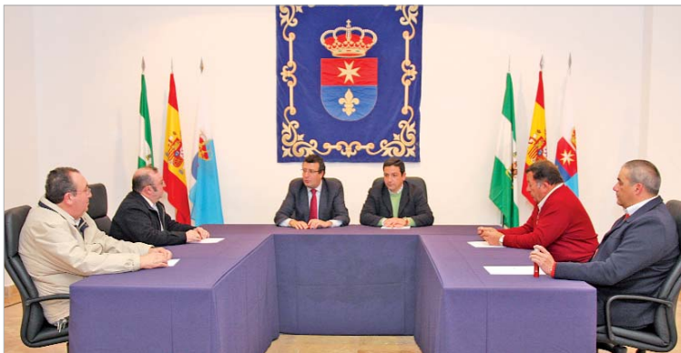
El alcalde, y el delegado de Festejos, con los hermanos mayores.