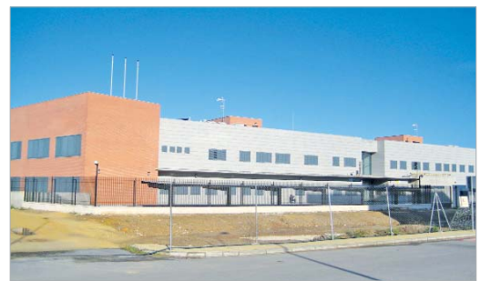
Vista general de las nuevas instalaciones.