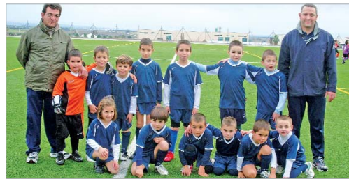
La plantilla prebenjamín del Rinconada posa con sus entrenadores.

Hace unos días, la web del Rinconada recogía un mensaje de un futuro futbolista que se ofrecía para el equipo más joven de la entidad. En el texto se presentaba “como un jugador de equipos que, aunque no marcará muchos goles, era un buen recuperador y pasador”. El tiempo dirá hasta donde llega esta joven promesa, pero de lo que no cabe duda es del brillo que reflejaban sus ojos cuando escribía el mensaje y seguro que se imaginaba con la camiseta blanquiazul y el escudo de su equipo en el pecho. Y ese sueño se convierte en realidad para muchos chavales de La Rinconada. Gracias al trabajo de la Junta Directiva y de un grupo de personas que prestan su tiempo al club, se posibilita a numerosos equipos de cantera competir cada fin de semana y disfrutar de la cara más pura y más bonita de este deporte. El paso de los años decidirá cuáles triunfan en el fútbol y quienes lo hacen en otros aspectos de la vida, pero, sobre todo, en los más pequeños, nadie puede