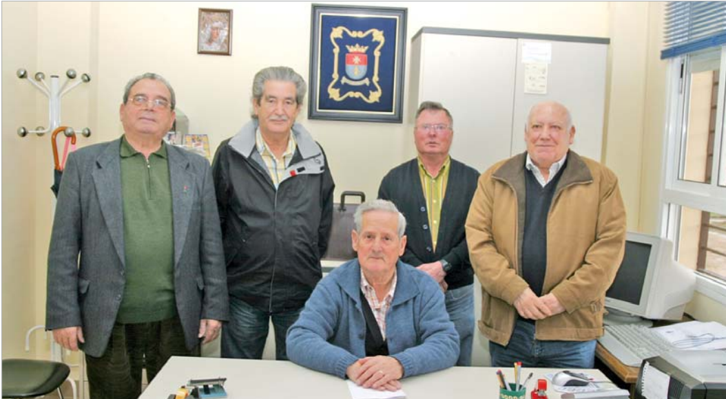
Parte de la junta directiva en el despacho de Curro.