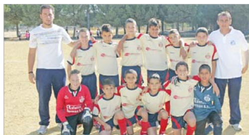
Los alevines rinconeros son retratados antes de comenzar un partido.

arrebatarles la ilusión de verse en un estadio lleno de gente coreando su nombre y marcando el gol en la jugada decisiva del envite.