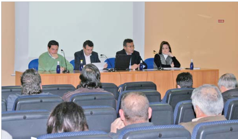
Los nuevos proyectos se presentan como una oportunidad para las empresas locales.

reunión, el auditorio conoció los nuevos proyectos que próximamente se pondrán en marcha en el municipio. En este sentido, a