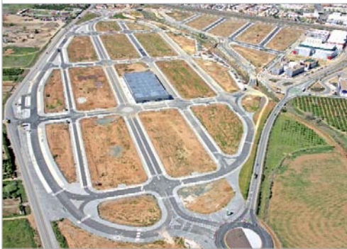
Imagen aérea del Cáñamo 3.

También, existe la posibilidad de instalar empresas en alguna de las seis naves que construye Soderinsa Veintiuno en el Cáñamo 1.