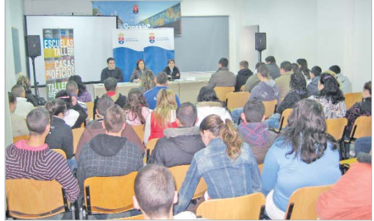
Sesión informativa de un taller de empleo.