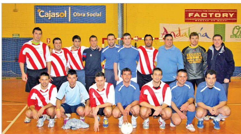
Los dos equipos posan juntos antes de que diera comienzo el partido amistoso en el Agustín Andrades.