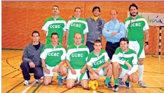
La plantilla del CCBC Marbu posa antes del comienzo de uno de sus partidos.