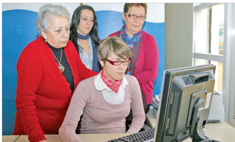
Las presidentas de las cuatro Asociaciones de Mujeres durante el Encuentro Digital.

Desde AMAF se organizan jornadas de concienciación donde puede participar cualquier persona”