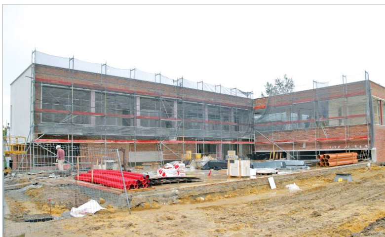
Vista general de la fachada del nuevo ala en construcción.

La construcción del nuevo ala sigue los pasos del proyecto de Félix Pozo, cuyo diseño conecta ambos edificios