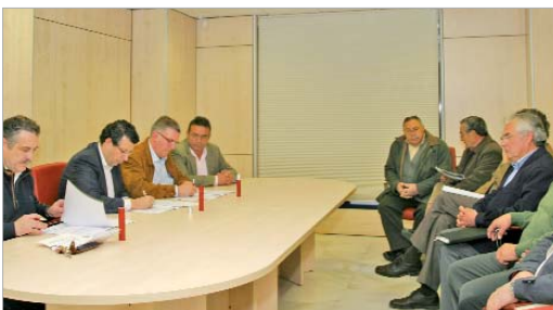
Durante la firma del convenio.

El acuerdo contempla la legalización de las edificaciones con una antigüedad anterior al 31 de marzo de 2004. A aquellas que se construyeron a posteriori, y que no tengan licencia urbanística municipal, se les aplicará la Ley de Expediente de Legalización.