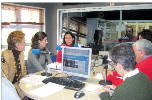
Los participantes en el debate, en pleno desarrollo del mismo.