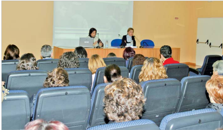
La jornada contó con un numeroso público asistente.