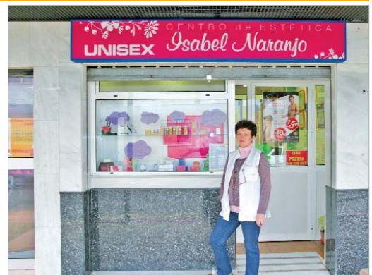
La propietaria en la puerta del establecimiento.

presumir de su fidelidad y confianza, ya que afirma que "el 90 % siempre ha acudido a mi estudio donde estuviere, buscando mis servicios en momentos especiales de sus vidas, de los cuales yo me siento orgullosa de haber sido participe".