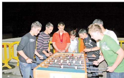
Diversia reúne a jóvenes con ganas de pasarlo bien.

de actividades distintos. El primero comienza esta misma semana en el Centro Joven 'La Estación', donde los chavales que lo deseen podrán participar en las diferentes zonas habilitadas, disfrutando de las nuevas tecnologías, el deporte, conciertos de Dj's o talleres de manualidades, entre otras. Esta primera edición se extenderá hasta el próximo 30 de abril y tendrá su continuidad con una segunda durante los meses de primavera y una tercera, hasta ahora inédita, desde el 19 de