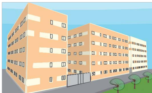
Imagen de la maqueta del proyecto.

Tras las 21 unifamiliares de Huerto de Benito, los 39 pisos de Huerta Amores y los 44 dúplex de Rinconada Oeste, se pondrán en marcha 100 nuevas unidades en la zona conocida como Acceso a Pago de Enmedio, frente al bar Domingo, en el núcleo