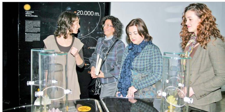
Las ediles de Cultura y Desarrollo Local durante la inauguración.

lantó la edil de Cultura "queda patente también en el fomento de la literatura que recupera la historia y las señas de identidad de La Rinconada y que se va a materializar en la publicación 'De Picasso a Góngora', compendio que recoge la evolución de San José en el acceso a la lectura al cobijo de las vivencias de su biblioteca municipal". Dicha publicación se presenta el próximo 23 de abril, Día del Libro, siguiendo la línea marcada de hacer la cultura más cercana y al alcance de todos.