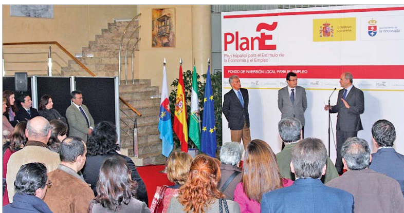
Javier Fernández, explica al Ministro, Manuel Chaves, y al delegado del Gobierno, José Luis López Garzón, el proyecto de urbanización.

El Ayuntamiento de La Rinconada no frena su actividad ante la crisis sino que, en respuesta, actúa de forma implacable aportando propuestas decididas y directas. La congelación de impuestos, programas de apoyo al comercio y a emprendedores y la formación para el empleo son algunas de las iniciativas que están en marcha con el objetivo de paliar sus efectos