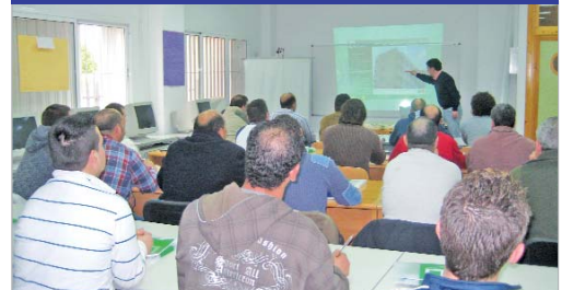
Sesión formativa para trabajadores del sector de la construcción.