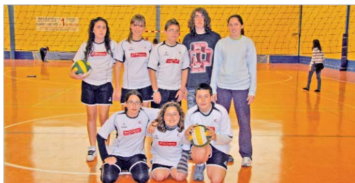
El equipo Infantil de La Rinconada, antes de empezar su último partido.

El voleibol en La Rinconada se canaliza a través de las Escuelas Deportivas Municipales. Se trata de un deporte que, poco a poco, va ganando participantes en el municipio desde la base, lo que está