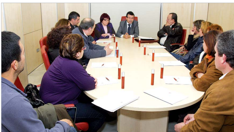
Todos los representantes de los organismos educativos durante la firma del convenio.

reconocer "la labor que llevan a cabo las AMPAS de nuestros colegios, cuyos integrantes se dedican de forma voluntaria y altruista a apoyar la formación y el desarrollo educativo de los alumnos".