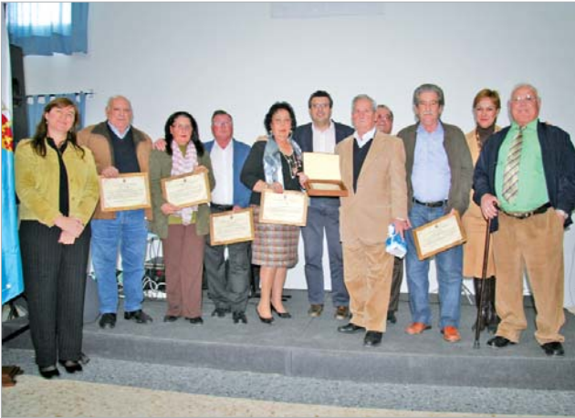
Homenaje a los miembros de la junta directiva del 'Pablo Picasso'.