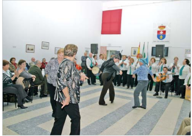
Los mayores disfrutaron cantando y bailando sevillanas.