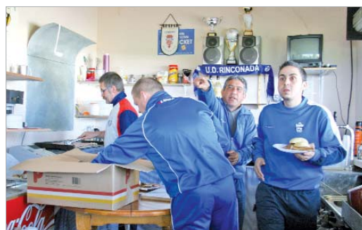
Los directivos del Rinconada, en plena faena en la cantina del club.