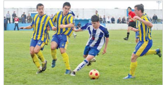
Mimi se lleva el balón ante tres contrarios ante el Nueva Sevilla (1-0).

que indignó a la numerosa parroquia rinconera presente en el terreno de juego. Para colmo, poco después, el Villanueva aprovechó el desconcierto para poner las tablas en el marcador y anotar el segundo tanto, gracias a un gol fantasma que pitó el linier y que, a todas luces, no había entrado.