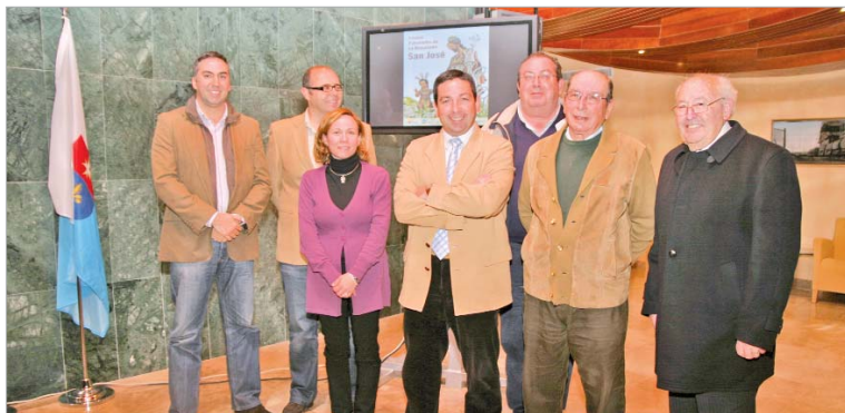
El delegado de Festejos y representantes de la hermandad durante la firma del convenio.