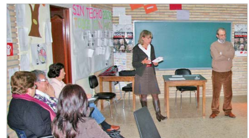
Cáritas tiene una amplia trayectoria ayudando a los más desfavorecidos.

Este proyecto, que se financia gracias a los fondos de la obra social La Caixa, tendrá lugar cada quince días en sesiones de dos horas.