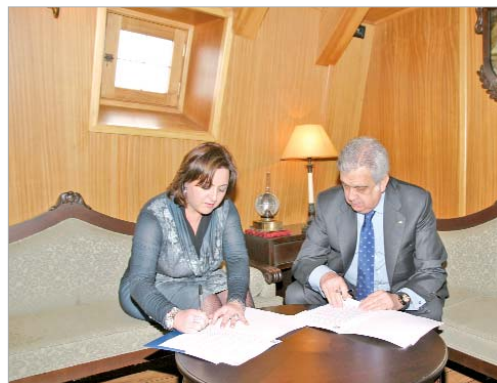
La firma del convenio se realizó en un camarote del Galeón.

Mediante este acuerdo, ambas partes elaborarán propuestas y participarán en distintas actividades que tendrán como denominador común el