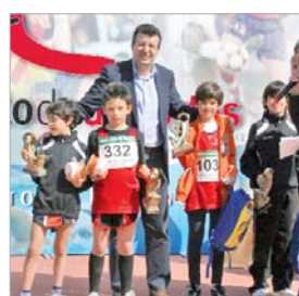
El alcalde galardonó a los atletines.