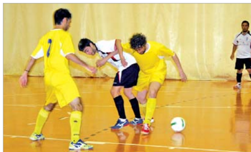
Waito trata de eludir la presión de dos jugadores del OTH.

Gracias a este triunfo, no se complicó en exceso la permanencia, que podría sellarse en San Juan en lo que, sin duda, va