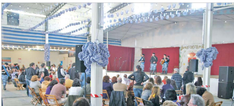
Los asistentes disfrutaron de las actuaciones en la caseta municipal de San José.

La ONG 'SOS Ayuda sin Fronteras' organizó un certamen en el que los asistentes donaron alimentos, material escolar y se recogieron fondos para los más necesitados