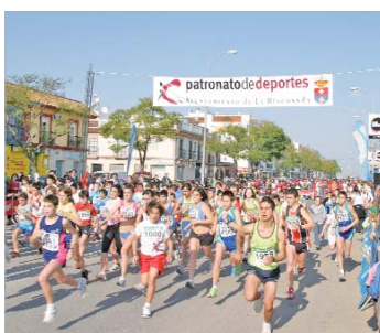
Infantiles y cadetes disfrutaron de la prueba atlética.

Algunos compiten contra ellos mismos. El simple hecho de mejorar la marca de la última vez que se probaron en una prueba atlética, de la satisfacción personal que proporciona el progreso, les es suficiente para calzarse las zapatillas y echar un pulso al crono con otros 3.000 participantes como testigos y compañeros de viaje, de aventuras y de fatigas. Ése que aprieta desde atrás y se pone a su altura comparte su objetivo, su reto, pero aquel otro al que está a punto de dar caza tiene una apuesta con sus amigos. Para él, la prueba es competición, no sólo contra el crono, sino contra su grupo, con los integrantes de la pandilla con los que sale a correr por las tardes por las calles de La Rinconada. No le importa ganar, pero sí ser el mejor de su grupo y así, con un poco de suerte, recibir las invitaciones de sus compañeros en el tan adorado tercer tiempo.