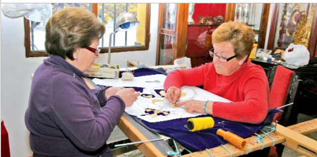
Varias mujeres se encargan de bordar un banderín.

Las bandas que acompañan a las imágenes son nuevas y el paso de Cristo contará con los acordes de la Banda del Santísimo Cristo de la Sangre de la Hermandad de San Benito y como acompañamiento a Nuestra Señora de los Dolores estará la Banda Municipal de la Puebla del Río.