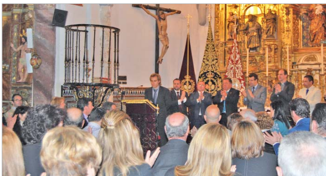
El alcalde, el párroco y los hermanos mayores de las hermandades.