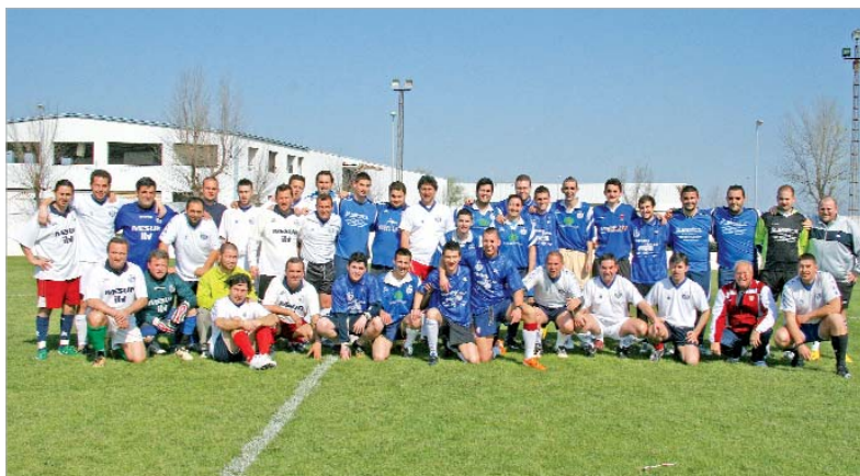
Los participantes en el fin de fiestas de la I Liga de Empresas posan para TN antes de empezar el partido.