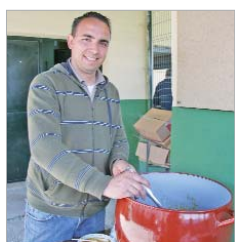
Juanito hizo un potaje.