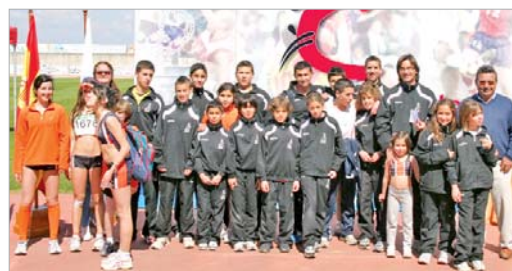
El Club Atletismo Rinconada tuvo una actuación destacada.