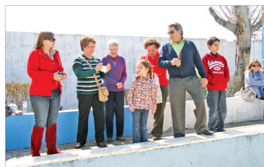
Los aficionados no cesaron de animar a los suyos desde las gradas.