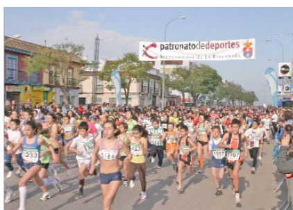
Los alevines fueron los primeros en correr.