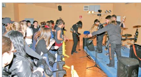
El grupo de rock 'Ekkadon' levantó pasiones entre los presentes.

Además, el programa tendrá continuidad con una segunda edición en los meses de primavera que también se trasladará cada sábado al aire libre al núcleo de La Rinconada, y una tercera a finales de año que complementará las actividades que tienen lugar en estas