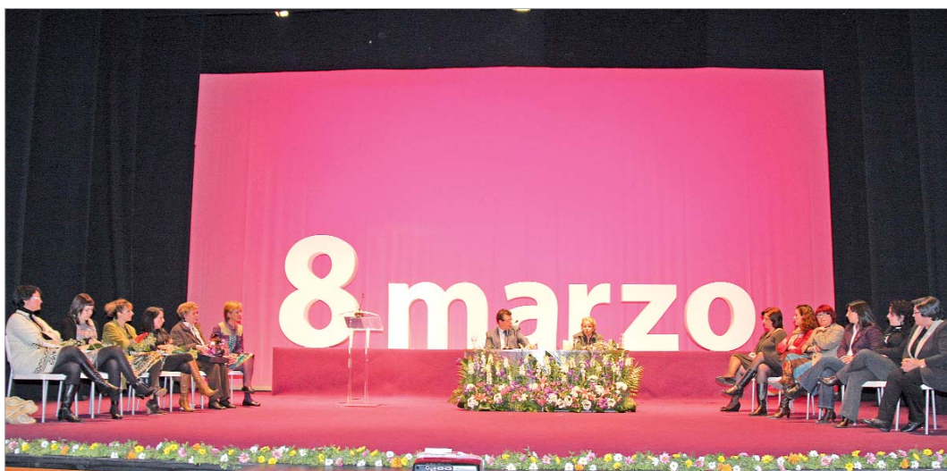
Las premiadas, las delegadas y el alcalde, Javier Fernández, compartieron escenario en una tarde en la que primó el homenaje y el recuerdo.

El alcalde, Javier Fernández, manifestó "la importancia de educar a las generaciones venideras desde la igualdad para que se erradiquen las desigualdades". Asimismo, adelantó que "el nuevo Centro de Información a la Mujer estará listo para el año que viene".