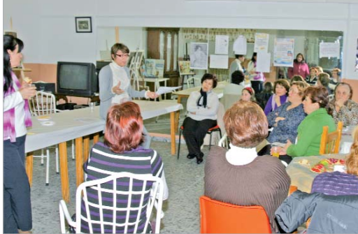
La sede de Mujeres Progresistas 2.000 debatió acerca de la 'Ley del Aborto'.