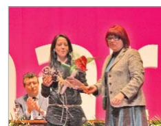
La asociación de mujeres Azahar.