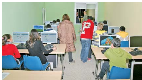
Algunos de los jóvenes optaron por navegar por Internet.