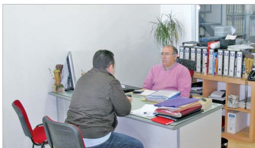
El dueño de Romeauto atendiendo a uno de sus clientes.

comparten nuestra opinión de que este es un momento muy importante para cambiar de vehículo