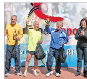
Los más veteranos fueron muy aplaudidos.

dual e indivisible, y supone un vínculo de unión con La Rinconada a través del atletismo en una prueba cada vez más grande que ninguno se quiere perder. Y entre los participantes, uno, que entre todos los corre-