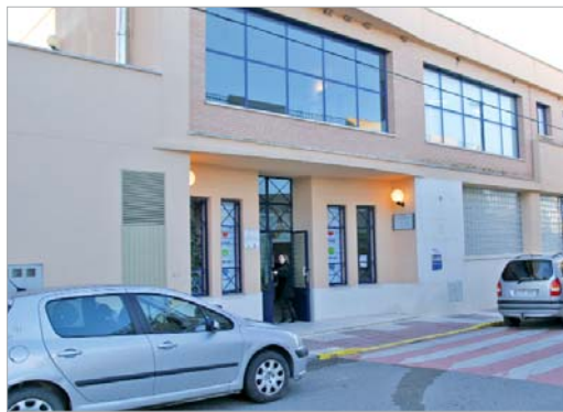
La guardería Gloria Fuertes ampliará la zona dedicada a bebés de 1 y 2 años.

Los temas educativos y sociales están ampliamente recogidos en esta partida. Aquí se enmarca la ampliación de la Escuela Infantil Gloria Fuertes, con la creación de dos nuevas aulas con capacidad para