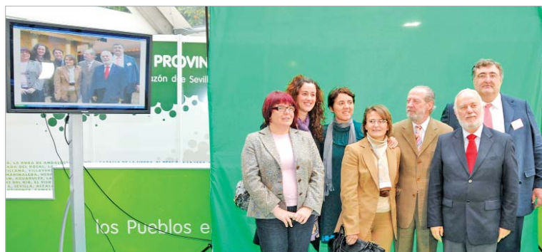
El presidente de la Diputación y representantes del Gobierno local en el stand.

Los asistentes pudieron disfrutar de un viaje en el tiempo a las diferentes recreaciones arquitectónicas y de modos de vida de los Tartessos o los romanos.