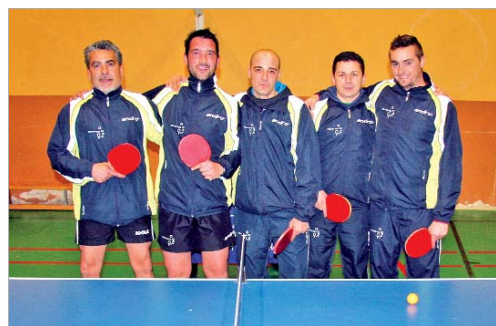
Los integrantes del primer plantel de Club Tenis de Mesa San José.