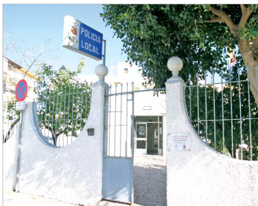
Actuales dependencias de la Policía Local.