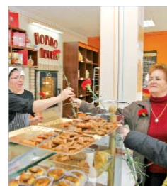
Entregando los claves.

su dedicación a toda la ciudadanía, por lo que no podía ser