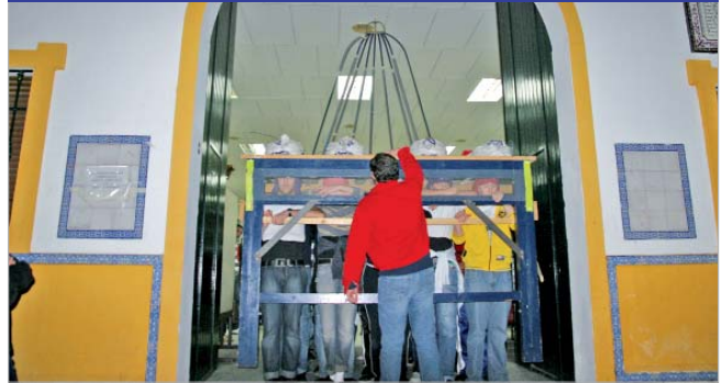
Imagen del ensayo de la cuadrilla de costaleros del paso de palio.