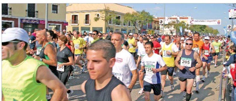
Los corredores tomando la salida en la prueba reina.

Récord de participación en una prueba que supone una cita obligada en el calendario atlético provincial, que cada año cobra mayor enjundia y atrae a más gente