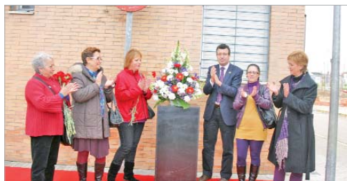
La calle Teodora Ocaña lució un ramo de flores en recuerdo a 'la cosaria'.

Las sobrinas de la 'cosaria más famosa de La Rinconada', emocionada por el momento, agradeció la muestra de cariño de su pueblo hacia su tía. Durante el