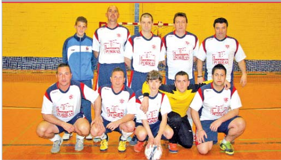
La plantilla del Estrella Roja, un histórico, posa para TN antes de un partido.