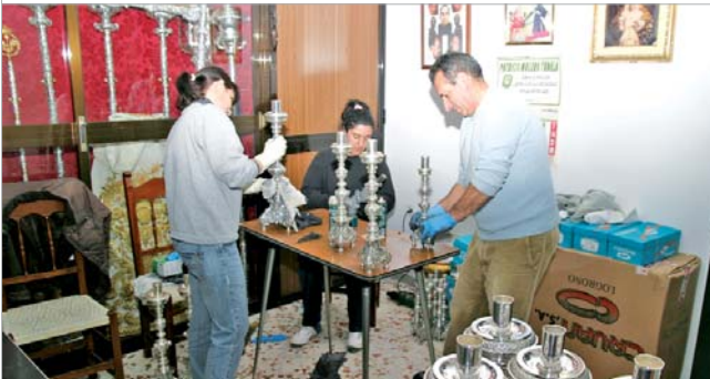
Los miembros de la hermandad limpian la plata.

En el mes de octubre la hermandad iniciará un programa de actividades que se prolongarán durante un año para celebrar el 50 aniversario de su fundación.