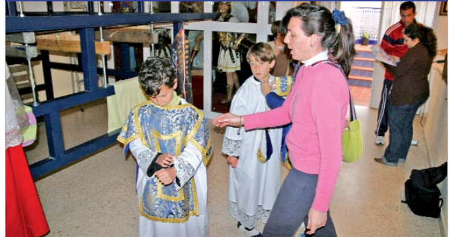
Los monaguillos acuden a las pruebas de vestuario.