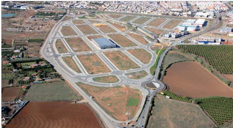
Vista aérea de los terrenos del Cádiz 3.

Otro de los elementos que lo integran y hacen de éste un parque con sello propio es el mobiliario urbano de diseño como bancos, papeleras y luminarias. También, la distribución de especies vegetales de bosque autóctono de bajo coste de mantenimiento, las diez fuentes de agua