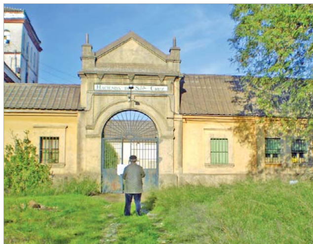
Entrada de la Hacienda de Santa Cruz.

En la Rinconada existen varias construcciones emblemáticas que han marcado la génesis y más tarde el desarrollo de la localidad. Una de ellas, sin duda, es la Hacienda Santa Cruz, construcción que data de 1929 y que forma parte de la historia viva del municipio. Esta edificación era la anti-