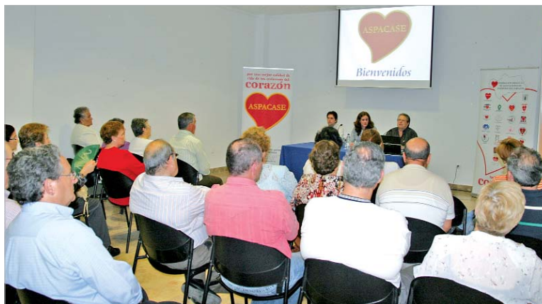
Un numeroso público acudió a la charla.

personal cuando tuvo un infarto de corazón y cómo éste le llevó a crear, junto con 12 enfermos más, la asociación. Además,