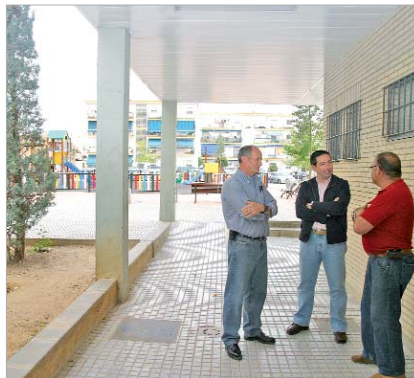
El delegado de Vía Pública visita los soportales de Santa Cruz.