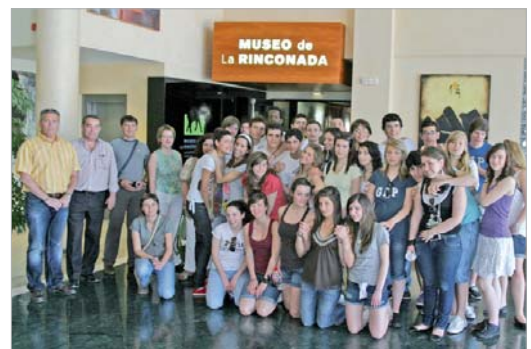
Los alumnos visitaron el Museo.

días, una forma de conservar los conocimientos adquiridos para trabajar sobre ellos cuando vuelvan a las aulas y, en definitiva, poder conocer algo más acerca de la cultura y la identidad andaluza y española a través de La Rinconada.