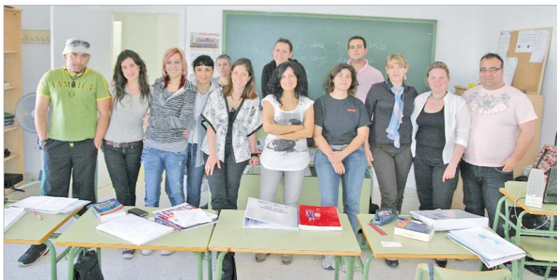
Los matriculados del curso de inglés participan activamente en las clases.

El primero de los módulos 'Inglés: Atención al público' lo imparte la profesora Sonia Alonso, que a través de juegos y pequeños teatros que simulan situaciones comunicativas en un contexto determinado, logra que los alumnos participen activamente y estén muy motivados