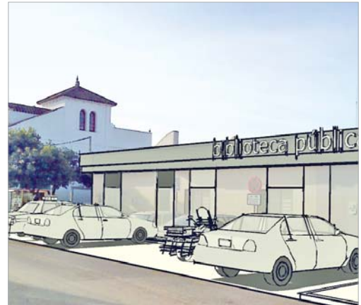
Imagen virtual de la futura biblioteca.

Esta reforma permitirá trasladar las dependencias existentes, ubicadas en la Casa de Cultura, a un nuevo edificio más amplio en el que se incrementarán y mejorarán los servicios que se prestan en la actualidad.