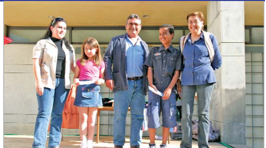
Los delegados de Medio Ambiente y de Juventud entregaron los premios.