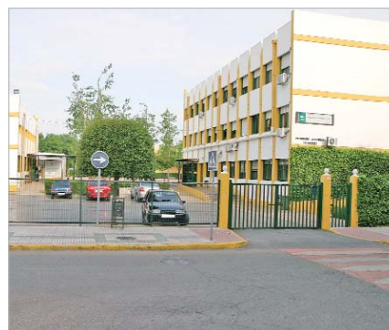
El Júpiter dispondrá de servicios de comedor.

En la última sesión plenaria se aprobaron los proyectos que se van a financiar con el Programa de Fomento del Empleo Agrario, conocido como Per 2010.