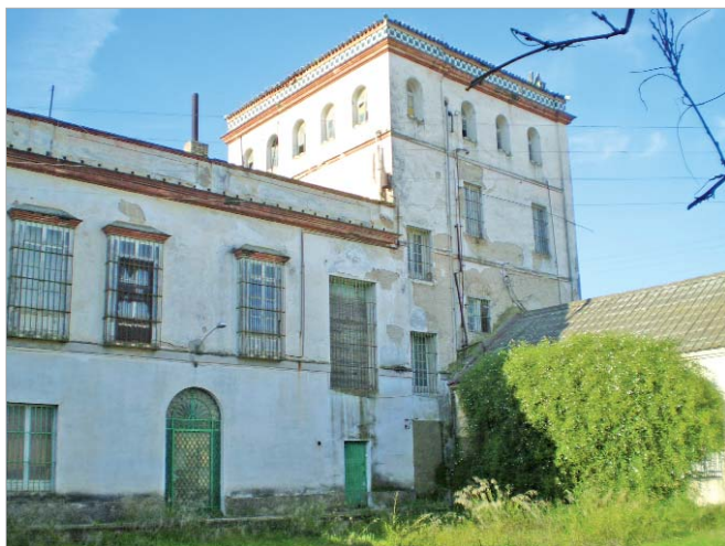
El edificio acogerá una biblioteca metropolitana y servirá de espacio escénico.

El recinto acogerá distintas dependencias entre las que destacan una biblioteca de carácter metropolitano, aulas polivalentes y espacios escénicos