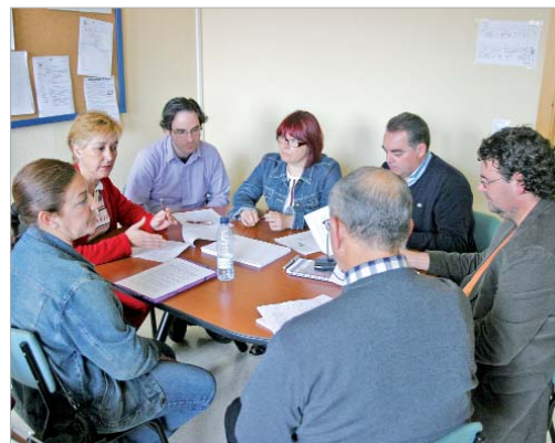
Las delegadas de Educación y de Igualdad se reúnen con el profesorado.

impartidas por asesoras del Instituto de la Mujer, los profesores analizarán cómo se trata actualmente el amor y la sexualidad desde la educación y cómo podría abordarse para