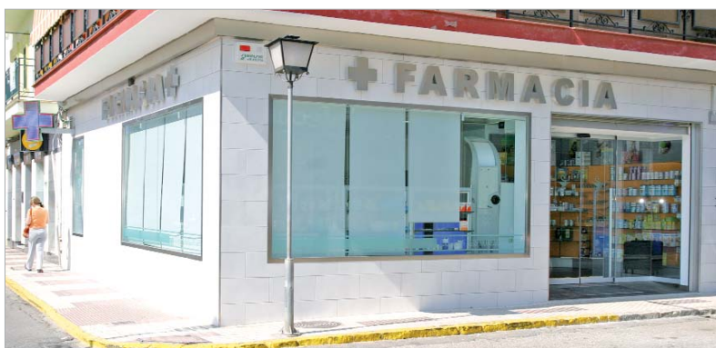
La Consejería de Salud adjudicará las nuevas oficinas antes de finales de año.

Esta adjudicación marca un avance histórico que hará posible ubicar oficinas en barriadas de expansión residencial. El núcleo de La Rinconada, por su parte, sumará dos más en la zona de Santa Marta y del Santísimo