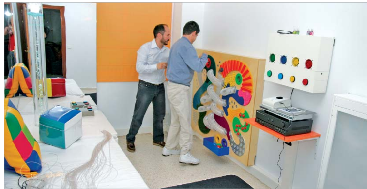
El panel táctil sirve para conocer las diferentes texturas que existen.

Una cama de agua musical o un panel táctil son algunos de los elementos que favorecen la relajación