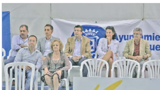
El alcalde, Javier Fernández, siguió el duelo en el palco de autoridades.