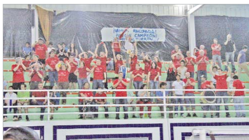
Los aficionados desplazados hasta Huelva no cesaron de animar.