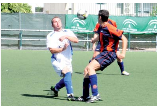
Isaac anotó dos goles más en su cuenta y suma ya ocho dianas en Liga.

Si la portería ha sido crucial para que el San José no pelee con los mejores, no es menos cierto que la concentración en los minutos finales tampoco se le ha dado excesivamente bien a los de