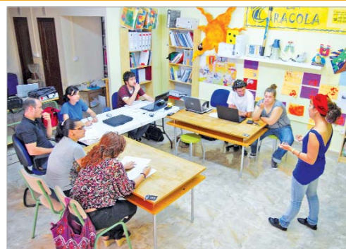
'La Caracola' se reúne con una de las asociaciones.

Las actividades serán diversas, habrá dinamización a lo largo de toda la mañana donde los asistentes podrán conocer las actuaciones del resto de entidades, invitando al contacto entre unas y otras ya tengan la misma temática o diferente. Se trabajará buscando una organización interesociativa y el enriqueci-