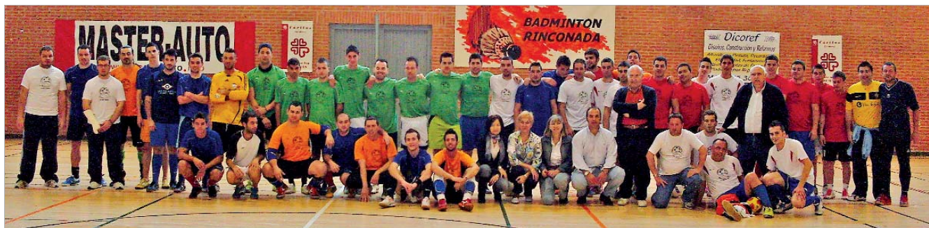
La delegada Igualdad y Bienestar Social estuvo presente en los partidos disputados por los cuatro equipos participantes.