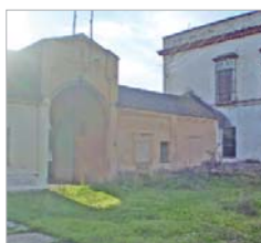
Será residencia temporal de artistas.

calle. Así pues, se pavimentará y actuará en el entorno colocando zonas ajardinadas en las inmediaciones.