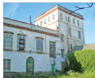
Vista general de las instalaciones.

En definitiva, un complejo donde la cultura, el arte y los eventos sociales irán de la mano.