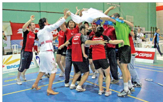
La bandera de La Rinconada ondeó entre la algarabía rinconera.

nero. Pero en ese momento emergió el espíritu de campeón de uno de los jugadores franquicia del Soderinsa. Remontó el partido y dio la final a su club.