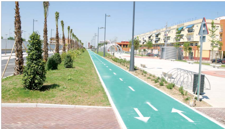
El enclave se convertirá en una gran fiesta donde los vecinos serán los auténticos protagonistas del día.

El próximo 7 de mayo los vecinos 'Entrarán en una nueva realidad', comprobarán in situ el espectacular cambio que ha experimentado el cauce del arroyo Almonazar, ahora soterrado y totalmente urbanizado y acondicionado, en una primera fase.