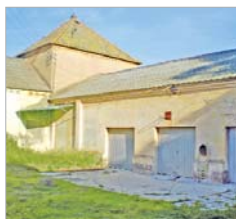
Celebrará seminarios y congresos.

Una de las principales acciones que se van a acometer para poner en valor el edificio pasa por mejorar su accesibilidad. Y es que, está flanqueado por grandes muros que lo aíslan del espacio urbano. En este sentido, se actuará en la zona de acceso desde la carretera de la estación, demoliendo el cerramiento y el portón existentes y sustituyéndolos por una verja totalmente permeable, que permita la visión del edificio desde la