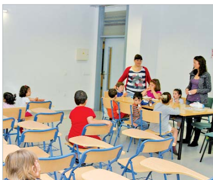
El aula matinal permite la conciliación familiar.