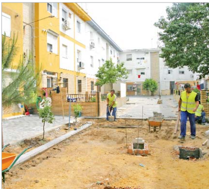
Las obras en el patio Luis de Góngora finalizan en pocos días.

se está sometiendo a una reforma integral que incluye, además, la construcción de una pista polideportiva multiusos de la que disfrutarán los vecinos de la zona.