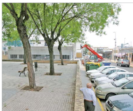
En la plaza Azorín se remodelará el pavimento, mobiliario y luminaria.

obras que se suman a las que ya están en marcha y que supondrán la adecuación de espacios públicos a la vez que se fomenta el empleo en la localidad