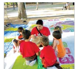
Fiesta africana en el Alamillo.

vivencia y al intercambio. Así, en el Parque del Alamillo se festejó 'Acércate a África', una actividad en la que todos los colectivos participantes pusieron stands y realizaron numerosos talleres. Se dieron clases de cocina, de danza, percusión o de juegos típicos. El Pacto realizó un taller en el que los asistentes aprendieron datos sobre los diferentes países que componen la región.