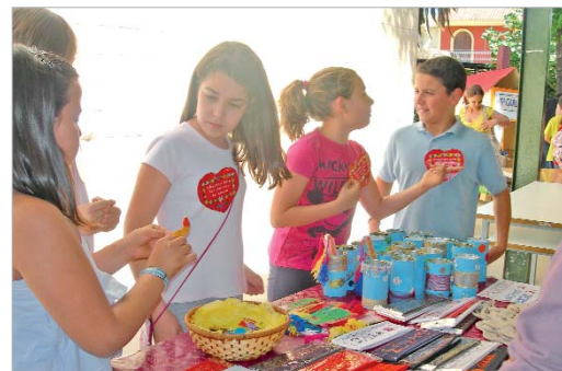
Los alumnos del PUA en uno de los puntos de venta.

Así, los alumnos se han implicado directamente con este proyecto, elaborando con sus propias manos pequeños objetos y enseres de gran utilidad como