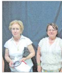
Reconocimiento a dos socias.