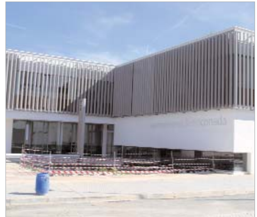
Se crea un nuevo acceso al Ayuntamiento por la calle Carretera Nueva.

Además, también cuenta con aparcamiento subterráneo con capacidad para 15 vehículos y una nueva entrada por la Carretera Nueva.