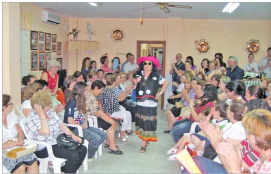
Pase de modelos.