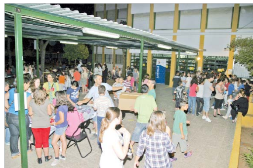
Cada edición reúne a más participantes en el Júpiter.

El programa continuará hasta el próximo 25 de junio, fecha en la que se celebrará una gran fiesta acuática y un bautismo de buceo en la piscina de verano del polideportivo 'Castañita'.