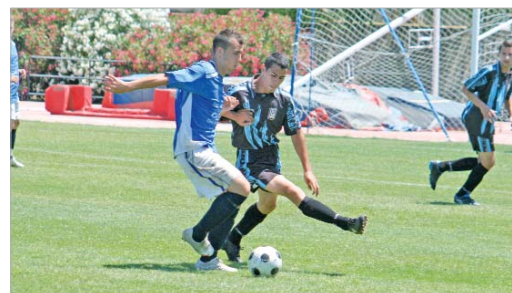
Trompo estuvo activo durante el tiempo que permaneció en el campo.