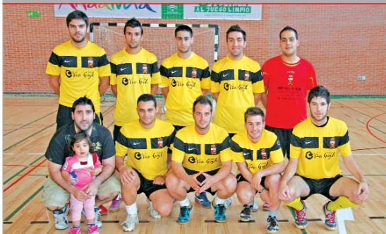
El Fulham 05 ha logrado revalidar el título de Campeón de la Liga Masterauto.