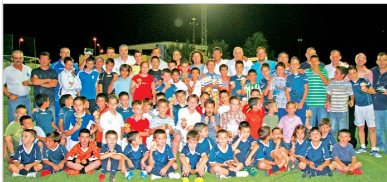
Los integrantes de la directiva del Rinconada posa junto con los miembros de los diferentes equipos de cantera.

El pasado viernes, el Rinconada quiso rendir un homenaje muy especial a su cantera. Por ello, sobre el tapiz del Leonardo Ramos se dispusieron un gran número de trofeos para regalar ese recuerdo imborrable a cada uno de los integrantes de los escalafones inferiores. El mejor jugador, el más regular y el máximo goleador de los juveniles, cadetes e infantiles fueron desfilando ante los representantes del Consejo