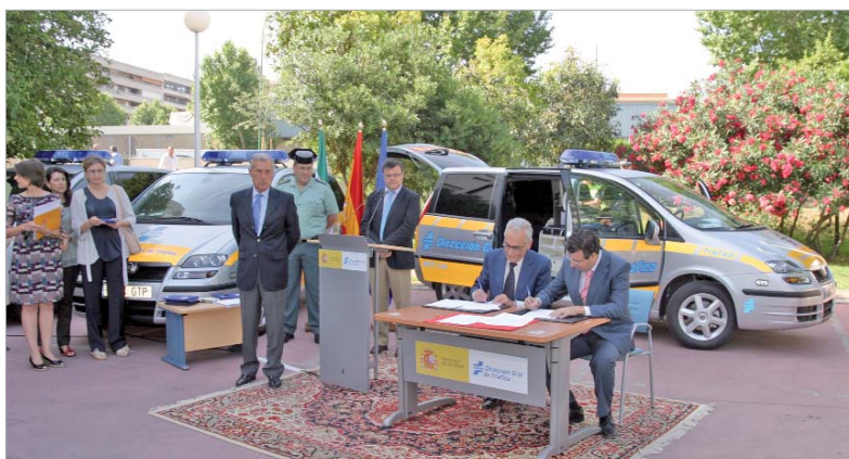
Este vehículo realizará controles de alcoholemia dentro del término municipal.

Está dotado de un aparato que permite una medición más exacta del nivel de alcohol espirado