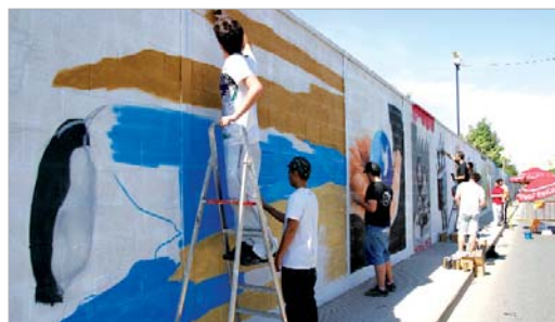
Los artistas urbanos ultimando sus trabajos.