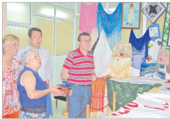
El alcalde observa las manualidades elaboradas.

A lo largo de la tarde hubo momentos emotivos, como fueron la recitación de poemas o la entrega de placas a algunas socias en honor a su fidelidad con la asociación, y otros más divertidos y desenfadados, como la representación de la obra