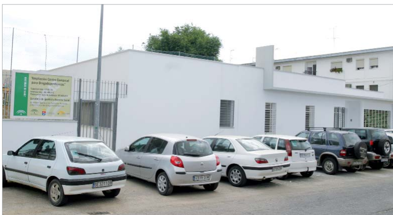
Las dependencias cuentan con una superficie de 325 metros cuadrados.

Las obras mejoran los espacios ya existentes incorporando nuevos despachos para impartir acciones formativas