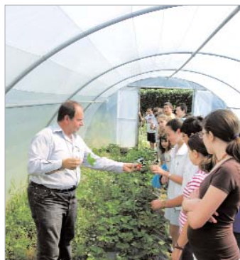
Un profesor enseña a los niños en el huerto.