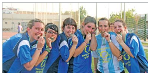
Las integrantes del plantel de Máster Rápido posan con sus medallas.