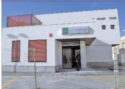
Este edificio triplica el espacio del anterior albergando 900 metros cuadrados.