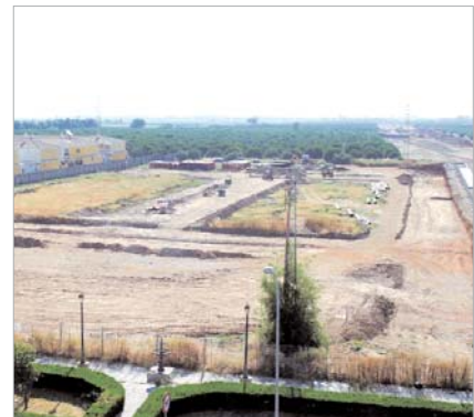
Ya ha comenzado la urbanización de los 100 pisos del pago.