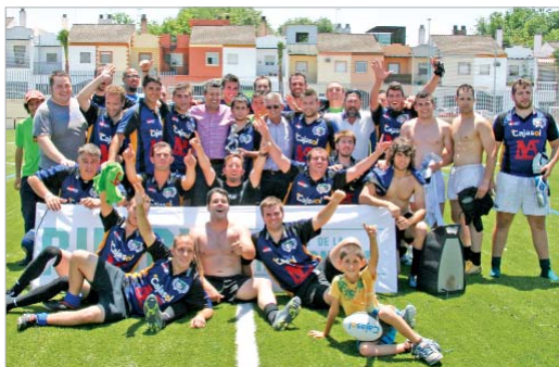
Foto de familia del rugby con el alcalde y el delegado de Deportes.

El rugby es un deporte joven en la historia de La Rinconada, pero que ha llegado pisando muy fuerte en el año que lleva funcionando en la localidad. Y todo ello, gracias al Club La Estación, que ha formado un plantel competitivo, que ha integrado toda la demanda existente en la localidad y que ha sabido ganarse la confianza del público merced a un gran trabajo de planificación y una evolución y progresión constante a nivel de