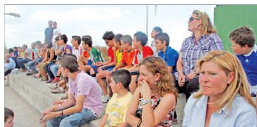
Las gradas del anexo a la piscina cubierta tuvieron una gran entrada.