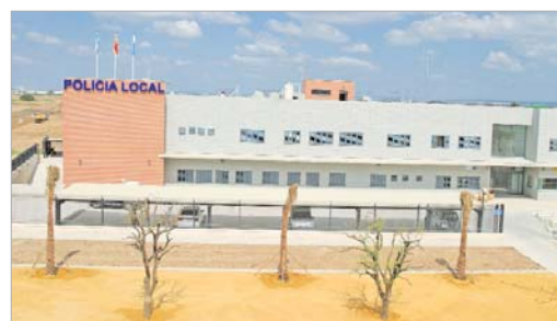
Vista general del complejo de seguridad.