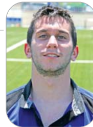
Coca Rugby La Estación

El secretario del Rinconada fue reconocido por sus compañeros de directiva con una placa por su labor, no sólo al frente de la secretaría, sino como creador y actualizador de la página web de la entidad, que ha sido todo un éxito.