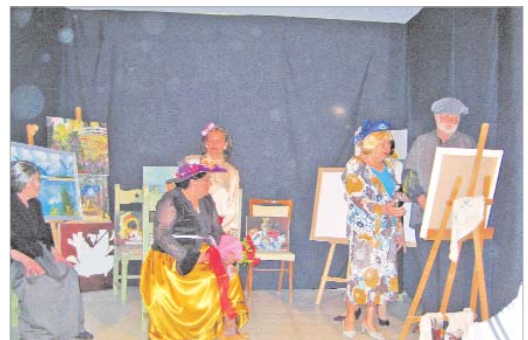
Una escena de la obra de teatro.

teatral 'Cuatro palabras' y un desfile de moda muy hippie a cargo de miembros y colaboradores.