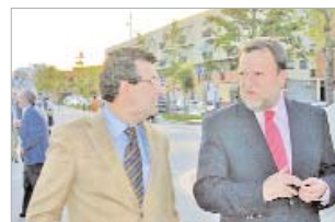
Visita del alcalde de Sevilla.

naje a todas aquellas familias que un día decidieron instalarse en San José y poco a poco formaron parte de su crecimiento como barrio de La Rinconada. Sin olvidar la estación de trenes y la Azucarera, que junto a la Torre del Cañamo han constituido lugares claves para el desarrollo del municipio.