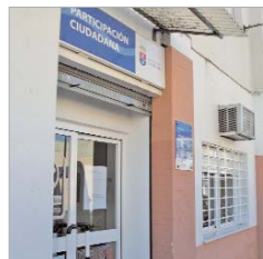
Sede donde se ofrecerá el servicio.