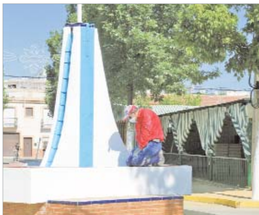
Empleados municipales cuidan que nada falle en estos días.

Para los que se desplacen en transporte privado hay dos bólicas de aparcamientos con capacidad para albergar a unos 2.000 vehículos. El primero de ellos se ubica en la zona de la Azucarera y el otro en la conocida 'Tía del Pito', junto a la guardería Santa Cruz.