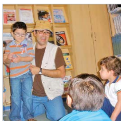
de 'El caracol Serafín', relato que forma parte de un juego didáctico

multimedia para ciegos y que tuvo como protagonistas a dos caracoles. Acto seguido, los asistentes escucharon el cuento de Jon Scieszka 'La auténtica historia de los tres cerditos', relato que versiona la famosa fábula, despojándola de tópicos y convirtiéndola al lobo en el bueno del relato.