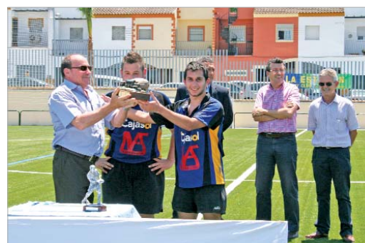
El club reconoció la aportación de la empresa Manteser Andalucía.