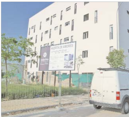
Los 39 pisos de la zona de Huerta de Amores.

sidad, y en el segundo se localizarán 30 unidades en venta, que se concederán a través de sorteo. Ambas adjudicaciones se efectuarán también durante los meses de verano.