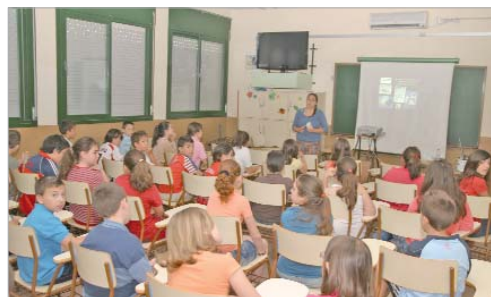
Alumnos del colegio Júpiter durante una de las sesiones informativas.

El Área de Salud en colaboración con la Sociedad Protectora de Animales y Plantas de Sevilla desarrolla en los centros escolares un programa de concienciación sobre el cuidado de los animales de compañía. Tener una mascota implica cuidarla, llevarla al veterinario con asiduidad o darle un trato humano, entre otros muchos factores. Esto es lo que quiere transmitir el pro-