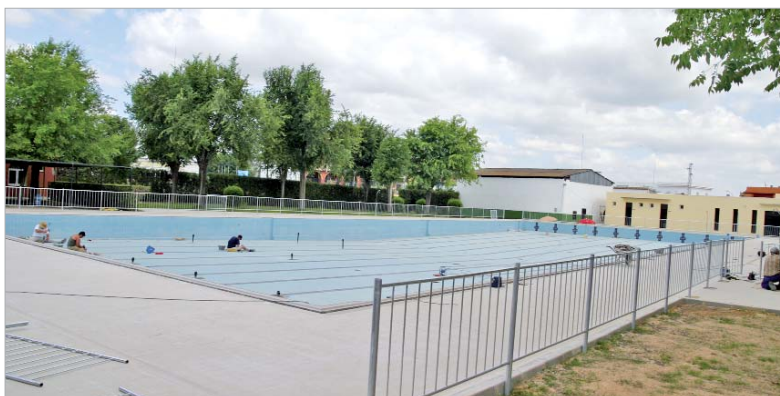
En menos de un mes los ciudadanos disfrutarán de la instalaciones renovadas.

En concreto, se han modificado las profundidades de los vasos. Además, se han colocado depuradoras más modernas y se han cambiado la iluminación y las playas de las diferentes piscinas. En estos momentos siembran el nuevo césped. La obra supone una inversión de 420.000 euros a cargo del Plan Director de Instalaciones Deportivas.