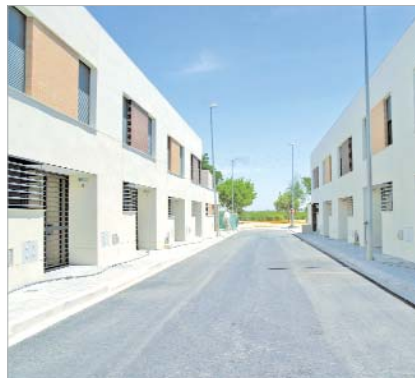
Imagen de las 21 unifamiliares de Huerto del Benito.