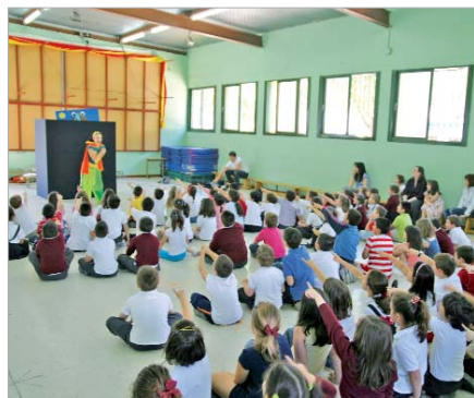
Los cuentos son la mejor forma de aprender.

La asociación cultural 'La Caracola' desarrolló un espectáculo de títeres y de cuentacuentos para enseñar las claves de una alimentación sana. Por otro lado, tanto la protectora de animales y la funda-