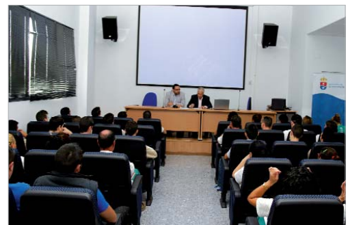
El presidente de FEANSAL acudió a la inauguración de las jornadas.

Finalmente, se conformó una mesa redonda en la que los jóvenes tuvieron la oportunidad de exponer sus preguntas y dudas.