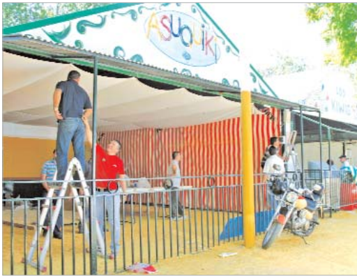
Los socios de las casetas se preparan para la Jira.

Los ciudadanos disfrutarán de los fuegos artificiales en el Paseo del Almonazar, un enclave que embellecerá este estallido de colores en el cielo