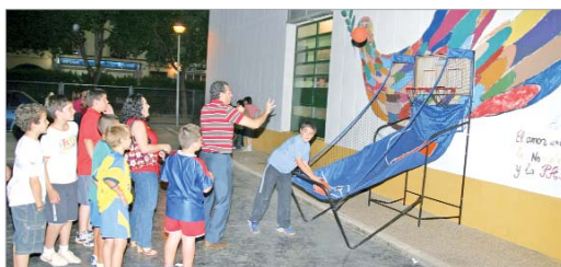
El alcalde, Javier Fernández, juega con los niños al baloncesto.

En palabras del primer edil, "no hay más que ver las caras de los chavales y cómo disfrutan de las actividades para constatar que esta alternativa de ocio tiene una gran acogida y está plenamente consolidada después de cinco