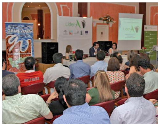
Los asistentes se informaron del procedimiento para solicitar las ayudas.