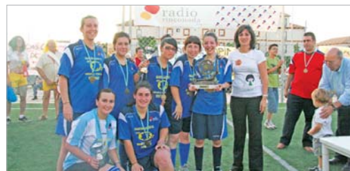
Máster Rápido se coronó campeón del torneo por segundo año seguido.