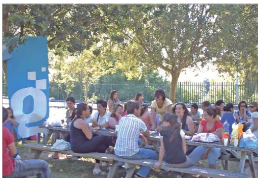
Los usuarios del CAPI durante la merienda en el Majuelo.

aniversario de estas instalaciones, creadas para ofrecer a los vecinos formación y manejo de las nuevas tecnologías con el fin de ampliar sus oportunidades en el campo