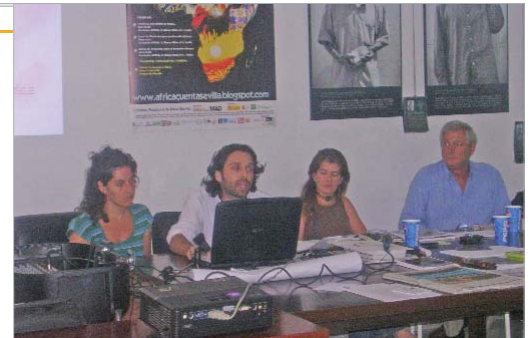
Miembros del Pacto contaron su experiencia.

Además, de las diferentes conferencias que se impartieron hubo tiempo para dedicar un día a la con-