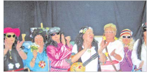
Las participantes en el desfile.