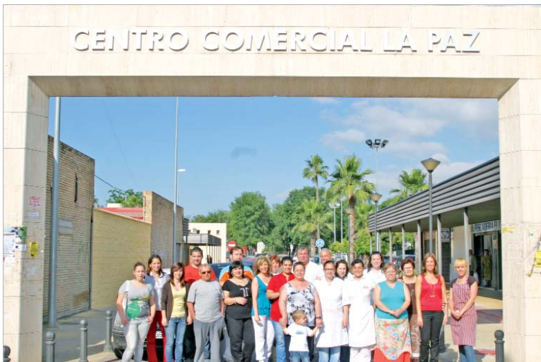
Foto de familia de los comerciantes.

Desde que en el año 1980 abrieran los primeros comercios en la barriada de La Paz, como la pescadería 'El Centro' o el bar 'Bombona', entre otros, ya se podía apreciar entre los propietarios