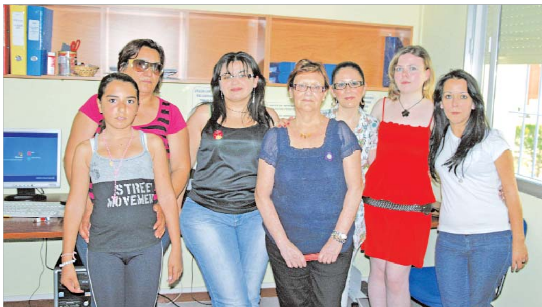
La asociación tiene su sede en el Centro de la Mujer.