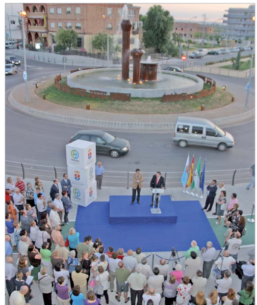
Vista general del acto.