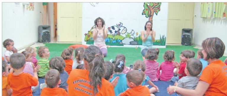
La compañía Plan B mostró en la guardería Santa Cruz su espectáculo 'Molto vivace'.

En total, 2.298 escolares han vivido sus primeras experiencias en las artes escénicas y han podido conocer los diferentes espacios escénicos del municipio. La semilla del arte ya está sembrada.