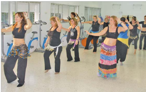
Alumnas del taller de Danza Oriental durante una de las clases.

Junto a estos módulos, el Centro de la Mujer anuncia nuevas actividades formativas y de ocio durante el año 2011, incluyendo programas de sensibilización que promuevan la igualdad de oportunidades entre hombres y mujeres.