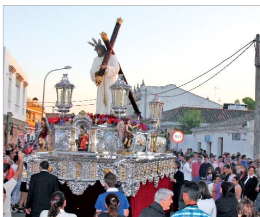
El Cristo recorrió las calles del casco histórico arropado por los vecinos.

A las seis en punto de la tarde, el eco del primer golpe de martillo del capataz anunció la salida extraordinaria del Cristo a los vecinos congregados a las puertas de la iglesia Nuestra Señora de las Nieves. Al ritmo de las marchas interpretadas por la Agrupación Musical Nuestra Señora de los Reyes de Sevilla, los cofrades rinconeros vibraron al paso del Nazareno por las calles del casco histórico y le