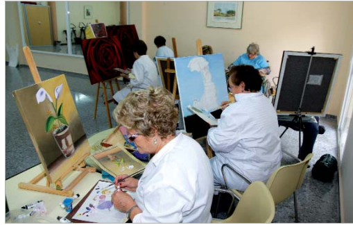
El curso de Pintura al óleo descubre nuevos talentos entre sus asistentes.