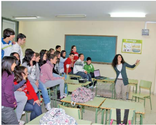
Los jóvenes escuchan una charla en el instituto Miguel de Mañara.