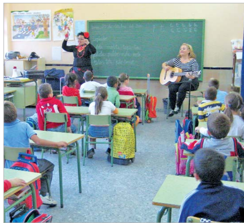
Niña Maceta y Folklorica Rizada actuaron en una clase de Primaria.

'Solistas en el aula' es una iniciativa de la Consejería de Cultura junto con la de Educación, y pertenece al programa de Abecedaria que lleva espectáculos de música, danza y teatro dirigidos a los escolares a los espacios escénicos de los municipios, con el fin de acercar la cultura a los más jóvenes.