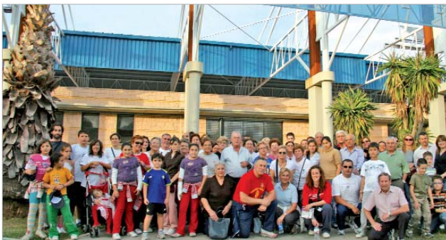
Miembros del Gobierno local participaron en las marchas.

Comité Argentino de Educación para la Salud de la Población (CAESPO), la Representación de la Organización Mundial de la Salud en Argentina, así como su Ministerio de Salud, han premiado esta iniciativa de hermanamiento en salud.