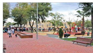
Numerosos vecinos acudieron a la apertura del parque.