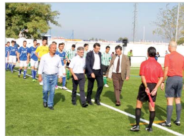
El delegado provincial de Deporte hizo el saque de honor.

El primer edil también, adelantó que "la guinda a este plan la otorgará próximamente el nuevo complejo Leonardo Ramos Yerga".