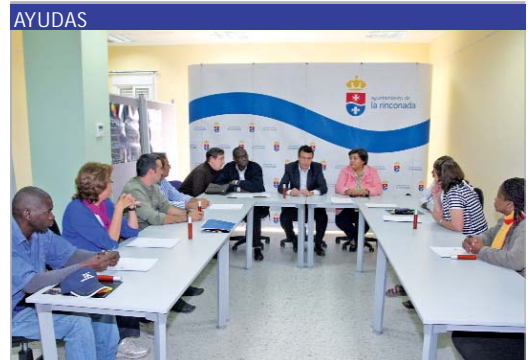
Imagen de la firma de los convenios con las ONGD.

docena de ONGD colocaron stands en los que explicaron los proyectos que llevan a cabo en África. Además, se realizaron talleres de henna, té, danza, percusión y juegos. Los asistentes pudieron degustar un arroz solidario y pasteles árabes. Todo ello acompañado por música y sonidos africanos.