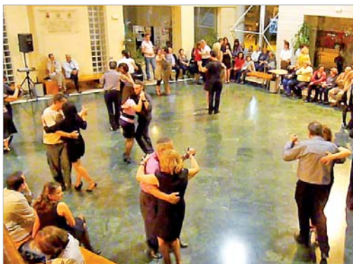
El hall de La Villa se llenó de pasos de baile.

El tango fue el protagonista de una jornada en la que estuvieron presentes 70 parejas que se deslizaron por la improvisada