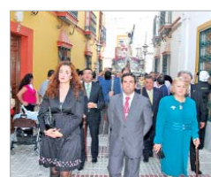
El Gobierno local junto al Nazareno.