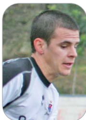
Canito A.D. San José

El lateral cañamero, que no se ha estrenado esta campaña a causa de una lesión, ha recaído de la misma y tendrá que pasar por el quirófano, por lo que se pierde casi la totalidad de la temporada. Es, junto a Pozo, el gran inédito azulino.