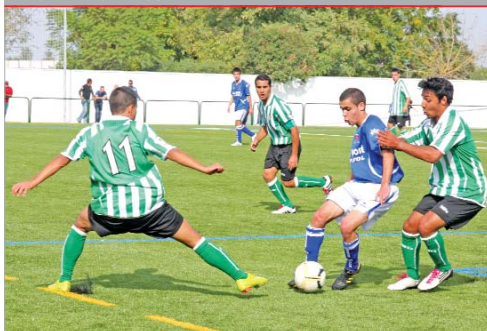
El San José juvenil de Liga Nacional estrenó el Anexo al Felipe del Valle.