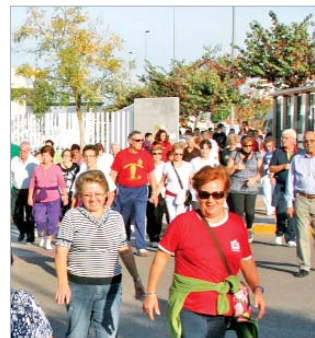
El tejido asociativo participa en el proyecto.