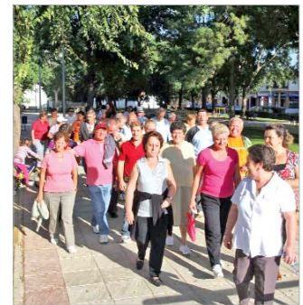
Las rutas recorren cuatro kilómetros de distancia.