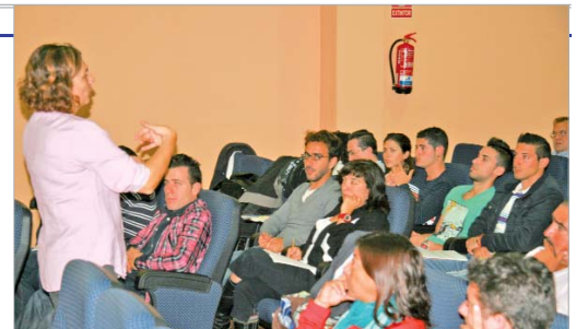
El Centro Joven 'La Estación' sirvió de punto de encuentro para los 60 asistentes.

Por la tarde, la conferencia viró hacia la gestión de las infraestructu-