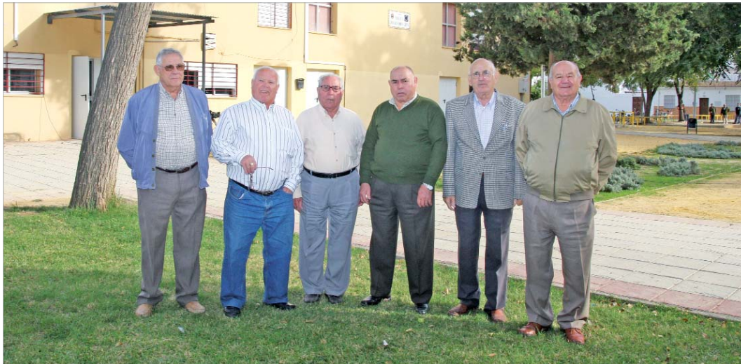
La Junta Directiva posa en el parque de la Comunidad Económica Europea.