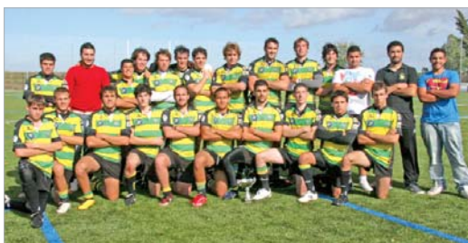
El Atlético Portuense posa con su trofeo que le acredita como campeón.

El Anexo al Felipe del Valle acoge un Torneo de enjundia, marcado por la afluencia de público