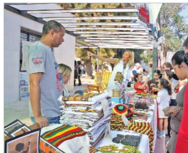
Los stands tuvieron una gran afluencia de visitantes.