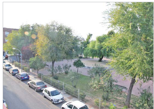
La imagen de Los Pintores cambiará por completo en los próximos meses.

Inclán y Blas Infante. En ellos, se va a modificar el recinto de juegos pasando a eliminar los areneros y colocando pavimento de goma. Esta misma acción se lleva a cabo en los parques de Carretera Nueva, Quintero León y Quiroga y Juan Sebastián Elcano.