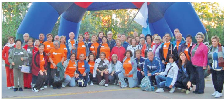
Ambos Centros de Día representaron al municipio de La Rinconada.

gar y el 'Pablo Picasso' consiguió el oro en hockey, mientras que el gran