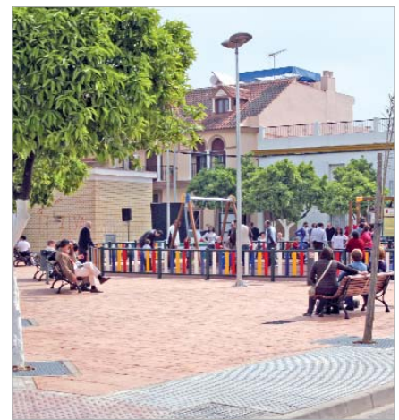
San Juan Bosco.