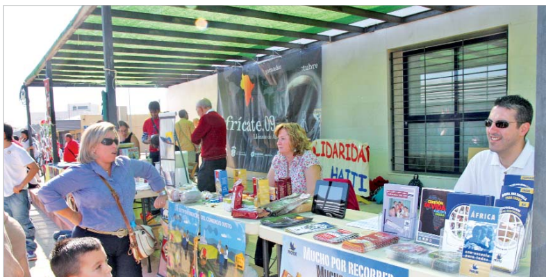
Durante la fiesta de la Solidaridad más de una docena de ONGD explicaron los proyectos que llevan a cabo en África.

La Rinconada acogió, recientemente, una nueva edición del 'Afrícate', unas jornadas que ilustran la realidad de este continente olvidado y ponen de relieve sus riquezas y la diversidad de su cultura y sus tradiciones.