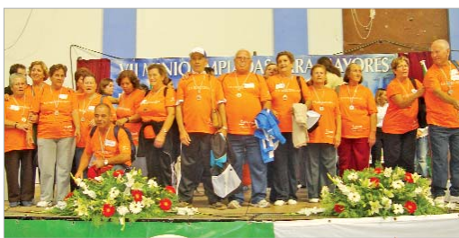
27 usuarios del centro participaron en las Miniolimpiadas.

Todos recuerdan con una sonrisa que por cosas del destino les tocó competir en la prueba de fútbol humano contra los del 'Pablo Picasso', quienes se impusieron al final. Y es que desde esta