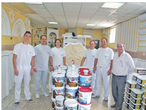
El nuevo punto de venta estará operativo a principios de 2011.

Con esta inversión, la familia Castro espera consolidarse como una de las empresas punteras del sector, generando empleo y riqueza en el municipio y fortaleciendo este nuevo espacio de suelo industrial.