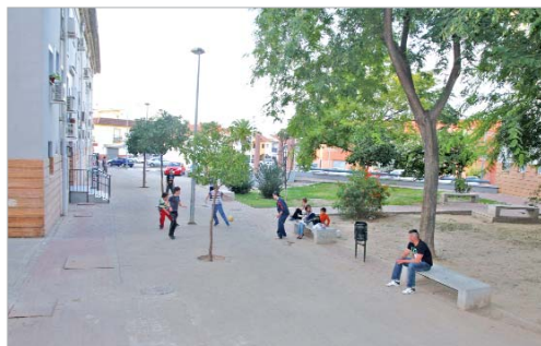
Situación actual de la Plaza de los Inventores.

El delegado se reunió recientemente con los vecinos y escuchó sus demandas de mejoras en el barrio. Así, también se acordó