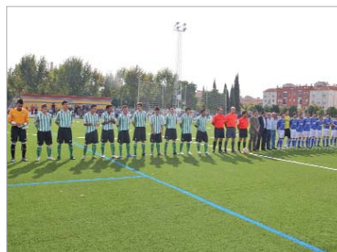
La cantera del U.D. San José jugó todos los partidos.