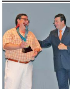
Fue premio alcalde en 2007.