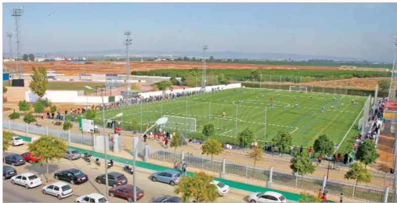
Este campo de césped artificial será usado por el club de rugby 'La Estación'.