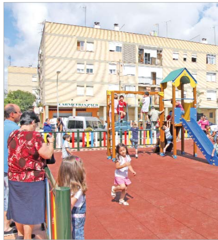
Plaza de la Libertad.