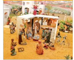
Belén del año pasado.