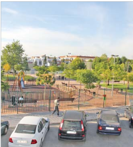
Parque del instituto del Miguel de Mañara.