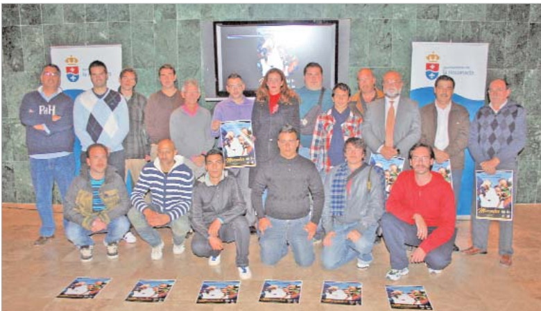
Los delegados de Salud y Deportes posan con el equipo de rugby y representantes del Cajasol Ciencias.

La Estación Rugby Club se une a la campaña internacional 'Movember 2010', un movimiento solidario que incide en la importancia de prevenir e informar sobre esta enfermedad