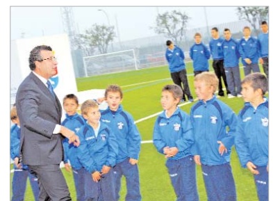
Los pequeños intercambiaron impresiones con el alcalde.