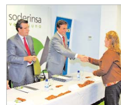
Los beneficiarios reformarán sus locales.

Peluquerías, restaurantes, videoclub, escuelas infantiles, hostales o gestorías son algunas de las empresas del sector servicios que se han beneficiado de la segunda parte de la línea de ayudas que