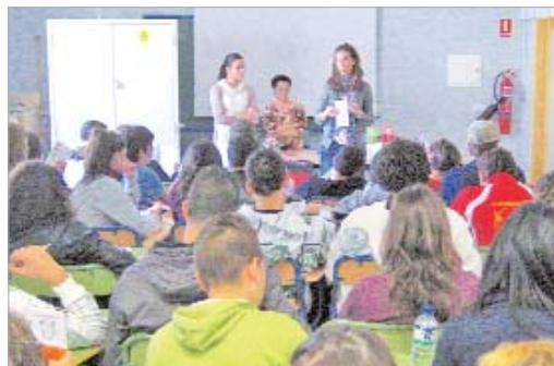
El instituto Antonio Ulloa recibió la visita de miembros de AR y FESAR.