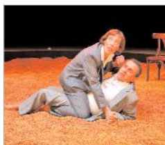
Una escena de la obra.