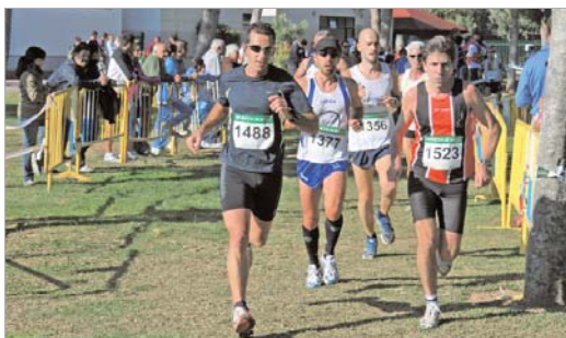
El circuito del Majuelo hizo las delicias de los asistentes a la prueba.

El parque El Majuelo acogió la I prueba del Circuito Provincial Campo a Través que organiza la Diputación de Sevilla y que reunió en el recinto rinconero a un nutrido grupo de atletas de todas las edades de los clubes más importantes de la provincia.