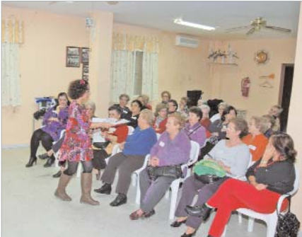
AMAF ofreció una charla sobre desigualdad y violencia de género.