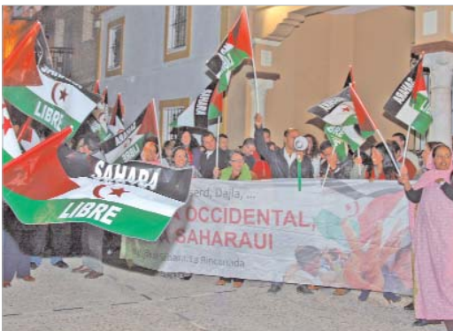
La plaza de España fue el lugar de encuentro de los ciudadanos que quisieron apoyar al pueblo saharauí.

Numerosos vecinos, colectivos y miembros del Gobierno local se reúnen en la Plaza de España para mostrar su repulsa ante los actos del gobierno marroquí contra los saharauis