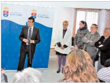
El alcalde, durante su intervención.

Esta unidad da servicio a La Rinconada, Alcalá del Río, Brenes y Burguillos con un amplio programa de tratamientos y prestaciones