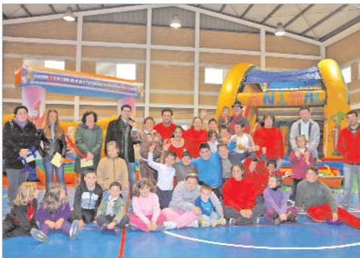
Foto de familia de los participantes en 'Los Azahares'.

También, hubo castillos hinchables y una ludoteca con materiales estimulantes y de entretenimiento.