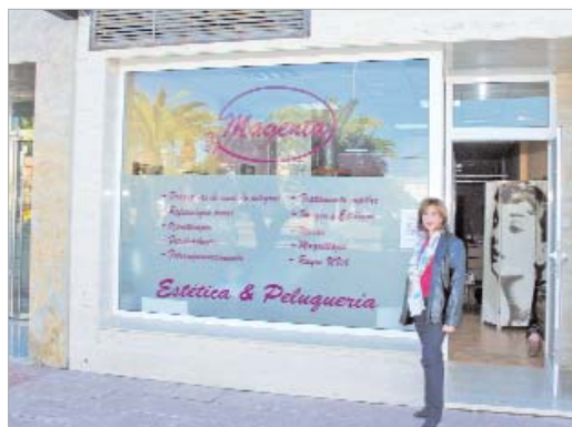
A las puertas de su local, 'Magenta', nombre de un color rosa fuerte.