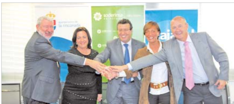
El alcalde, la edil de Desarrollo Económico y los representantes de Cajasol, tras la firma del préstamo.

Las obras de urbanización que se están desarrollando en la actualidad abarcan 40 hectáreas