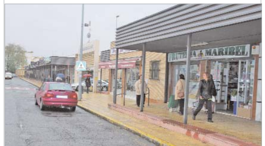
La asociación de La Paz realizará un mercadillo navideño.

También, se acogieron a esta partida dos agrupaciones de empresas como son los comerciantes de la barriada de La Paz y de la calle Córdoba, que realizarán acciones conjuntas para impulsar y concienciar a los vecinos de la importancia de consumir en la localidad, como única vía para que sus negocios sigan adelante en esta difícil situación económica.