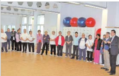
El alcalde y el edil de Deportes, en su visita a la sala.

Este espacio dispone de unos 200 metros cuadrados divisibles mediante mamparas separadoras con el objetivo de que varios grupos puedan trabajar de forma simultánea. Además, cuenta con dos entradas y dos taquillas.