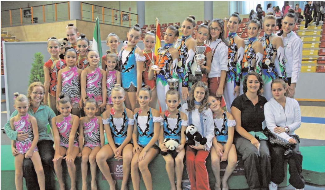
La familia de la gimnasia rítmica con sus merecidos galardones.