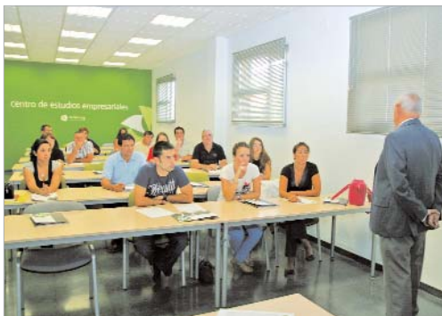
Los seminarios gozan de un alto porcentaje de participación.

Los incentivos que se conceden son de hasta el cien por cien para proyectos de inversión, la compra de turismos con un precio inferior a 24.000 euros o la adquisición de empresas, entre otros, siendo el importe máximo por cliente de 200.000 euros. También, se podrán sufragar necesidades puntuales de tesorería o liquidez.