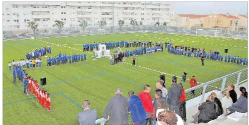
La barriada Santa Marta dispone ya de su nuevo estadio.