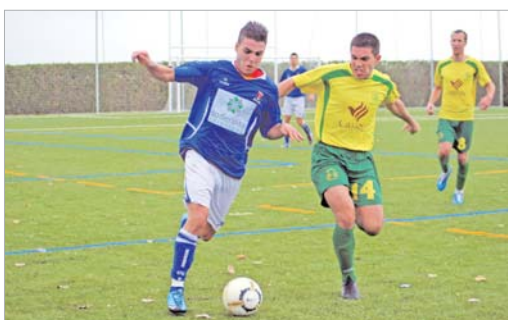
Cantos volvió a los terrenos de juego ante el Montilla y cuajó un buen partido.