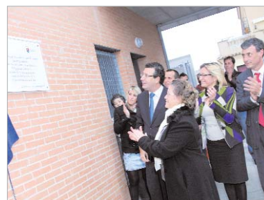
Las autoridades descubren la placa junto a la viuda de Yerga.