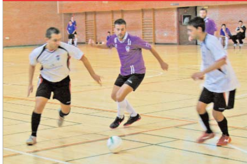
El Tres Calles lo intentó ante el Payasos Crouss, pero acabó cediendo otro triunfo.