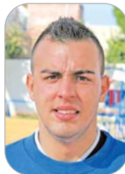
Trompo U.D. Rinconada

La lateral zurdo cañamero juvenil se estrenó como jugador del equipo senior frente al Higuero y cuajó una actuación que le ha permitido quedarse con la primera plantilla, ya que no tiene nada que envidiar a sus compañeros.