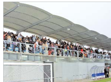
Numeroso público se congregó en las gradas.