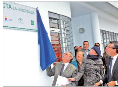
Numerosos vecinos acudieron a la puesta de largo del centro.