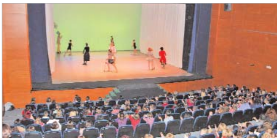
Ballet de Carmen Roche.

Manuel Monteagudo presenta en La Villa una obra del poeta y dramaturgo Federico García Lorca, escrita en 1931.