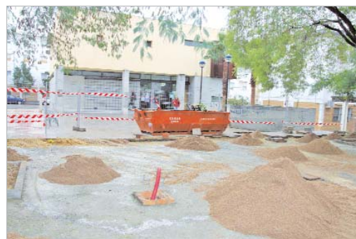
La plaza de Azorin tendrá suelo de pavimento.