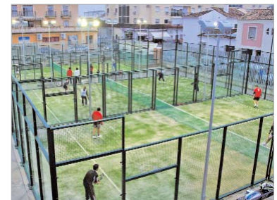
Se disputaron varios partidos de pádel.