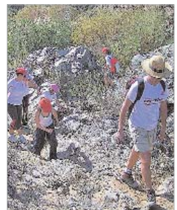
Imagen del sendero de La Caldera.