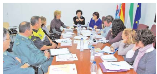
Los integrantes de la Comisión Local durante la reunión.