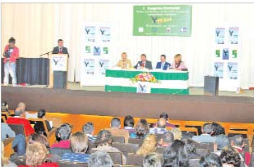
La edil de Bienestar Social y el delegado provincial, en el congreso.

Además, familiares de enfermos de alcoholismo contaron a los estudiantes sus experiencias personales y AR San José les pasó un cuestionario para conocer sus hábitos a la hora de beber y hacer un estudio de la juventud rinconera.