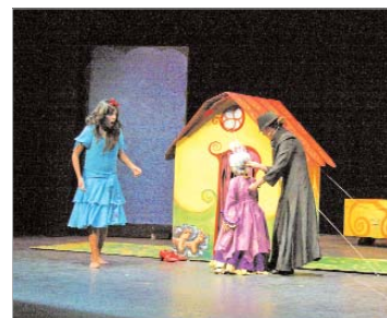
Búho &amp; Maravillas.

Albadulake fusionó el circo contemporáneo con flamenco en 'Malaje'. El broche de oro lo puso el Ballet de Carmen Roche, en el que a través de la danza contó a los asistentes el cuento de la 'Cenicienta' acompañado de la música de Prokofiev.