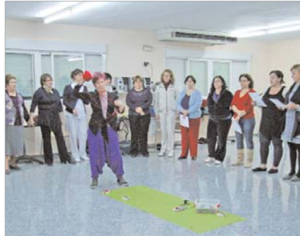
Un grupo de alumnas en el taller de buenos tratos del 'Pablo Picasso'.