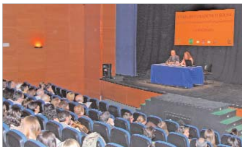
La delegada de Cultura y el coordinador en la presentación.

Las ponencias de académicos y científicos se han centrado fundamentalmente en la cuenca de Guadix Baza. Así, expusieron los últimos hallazgos e investigaciones acerca de los restos fósiles y arqueológicos, testimonio de la actividad humana en esta zona. El seminario contó con la presencia de expertos de las universidades de Huelva, Sevilla, Jaén, Paul Valéry de Montpellier y miembros del Proyecto Orce. Este foro está organizado por el Área de Cultura y la Asociación Española para el Estudio del Cuaternario (AEQUA), en colaboración con la Universidad de Sevilla, la Diputación y la delegación provincial.