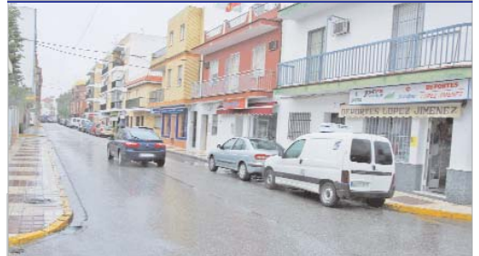
Los comercios de la calle Córdoba recibieron ayudas para proyectos conjuntos.