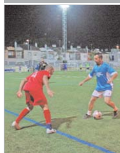
Imagen de uno de los encuentros.