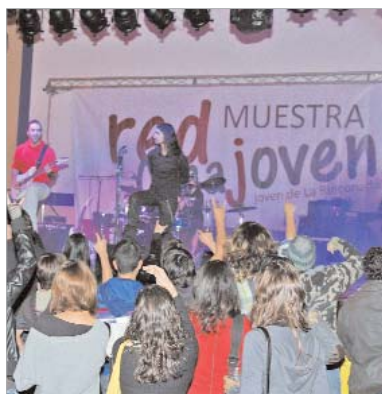
Los conciertos congregaron a numerosos jóvenes.

Con el objetivo de fomentar la participación juvenil en la localidad, más de 50 artistas se dieron cita en la III Muestra Red Creajoven para presentar a los asistentes sus nuevos trabajos y creaciones.