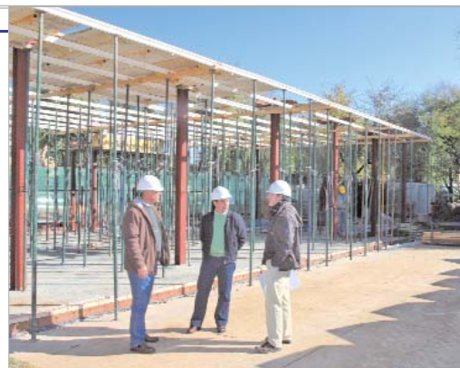
El delegado de Vía Pública visita las obras del comedor del colegio Júpiter.

Por último, en breve se inician las remodelaciones de la plaza Doctor García Baquero y el arreglo del emblemático depósito del agua, mientras que en Los Inventores se está desarrollando la primera fase de poda de árboles.