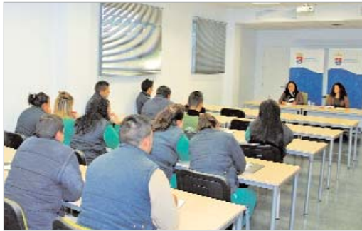
Los alumnos asistiendo al taller en el Centro de Estudios Empresariales.

qué son las habilidades sociales y cómo mejorarlas, dirigido a los 40 alumnos que se están formando en la Escuela Taller 'Las