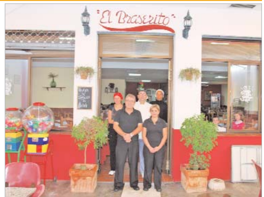
El propietario cuenta con un equipo de trabajo muy implicado en el proyecto.

les con un espectáculo de magia en directo.