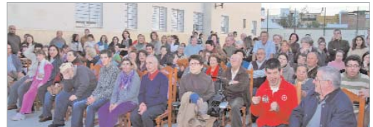
Durante la merienda el coro 'La Familia' recitó algunos villancicos.