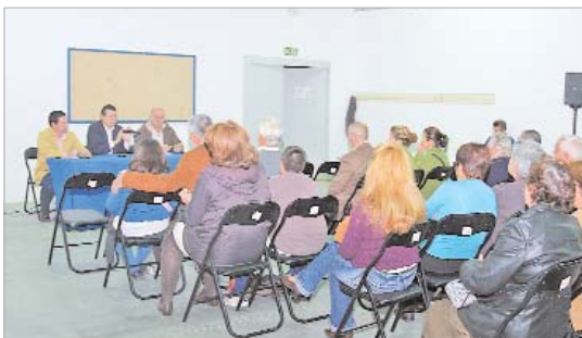
El alcalde, el delegado de Vía Pública y el técnico del ramo, durante la reunión.