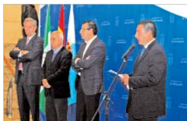
El delegado de Movilidad presentó el nuevo servicio.

El Centro Cultural de La Villa acogió la puesta de largo del nuevo servicio de microbús urbano de La Rinconada, del que se encarga la empresa Grupo Ruiz y que ha posibilitado que se amplíen los horarios, se reduzca el tiempo de espera, existan más paradas y señalizaciones y se mejoren las conexiones con otros medios de transporte público.