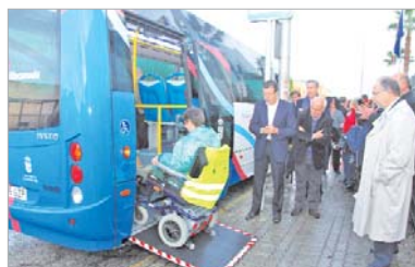
Una mejora importante es la adaptabilidad del microbús.