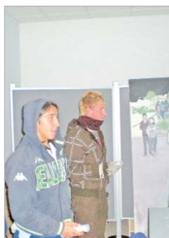
La Animateka, en ediciones anteriores.

Los días 23, 27, 28, 29 y 30 de diciembre, así como el 3 y 4 de enero, en horario de 9.00 a 14.30 horas, 'La Estación' se convierte en el punto de encuentro para los más peque-