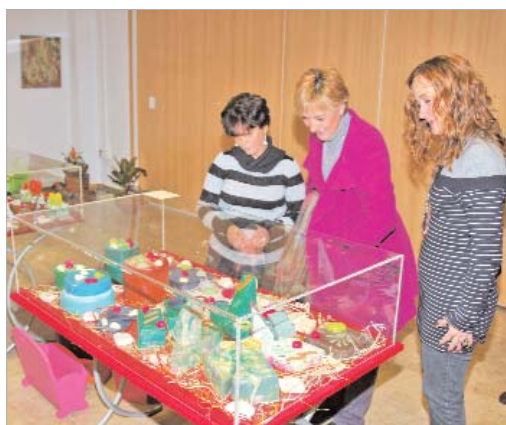
Las obras han sido elaboradas por los alumnos de los talleres del Patronato.