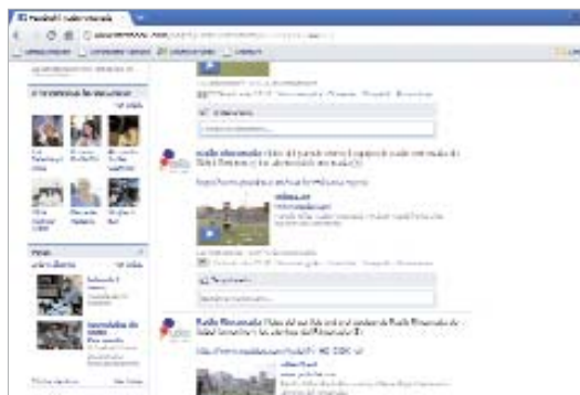
Imagen de la nueva página abierta en Facebook por Radio Rinconada.

Radio Rinconada ha puesto en marcha recientemente una página en la red social Facebook, con la idea de poder promocionar a través de la red la programación diaria, así como subir fotos y vídeos de los colaboradores del 104.7 y de los invitados que todos los días pasan por los estudios del ente público.