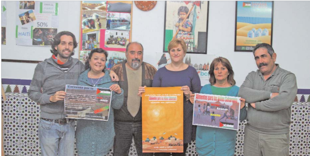
Miembros de la junta directiva de la asociación posan con los carteles del programa.