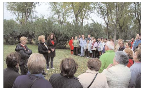
El punto de reunión fue el parque de 'El Majuelo'.