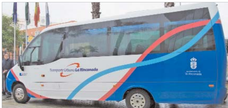
Los vehículos son de tecnología avanzada con GPS.

El Gobierno local diseña una red que permite a los ciudadanos la intermodalidad en el transporte urbano, pudiendo combinar el carril bici, el microbús y las dos estaciones de Renfe para sus desplazamientos diarios. Tres nuevos vehículos de tecnología avanzada ofrecen a los vecinos un servicio de microbús funcional y adaptado a sus necesidades