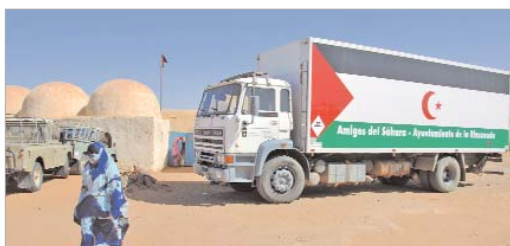
El año pasado un camión repleto de alimentos llegó a Ain Beida.

"El pueblo saharauí no tiene medios propios para poder subsistir, no disponen de recursos naturales, ni nada que les permita abastecerse, depende de la solidaridad internacional, de la ayuda que gente comprometida les hace llegar cada año", explica Manuel Coronel, miembro