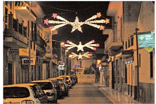
El núcleo de La Rinconada dispone de varias calles con iluminación festiva.

calles engalanadas para las fiestas respetando el medio ambiente y reduciendo el gasto energético que este tipo de adornos supone", como