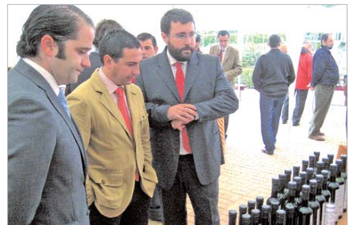
El edil de Vía Pública, durante su visita a la exposición.

Entre las actividades programadas hubo catas de productos de las empresas expositoras y la