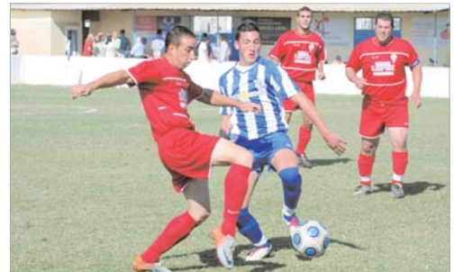
Andrades no volverá a lucir la elástica rinconera en esta temporada.

El goleador retorna a su club de origen, el San José, para ayudarle en la permanencia