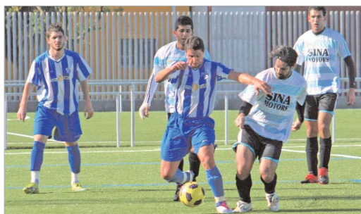
Machio no ha respondido a las expectativas en la demarcación de central.