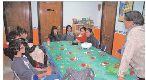
Los asistentes expresan sus opiniones.

Además, desde la asociación emitieron un comunicado en el que ponían de manifiesto su apoyo a los enfermos e informa-