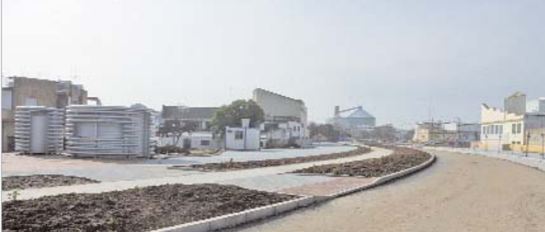
En breve comenzará el asfaltado, la colocación de la luminaria y los trabajos de jardinería y equipamiento urbano.