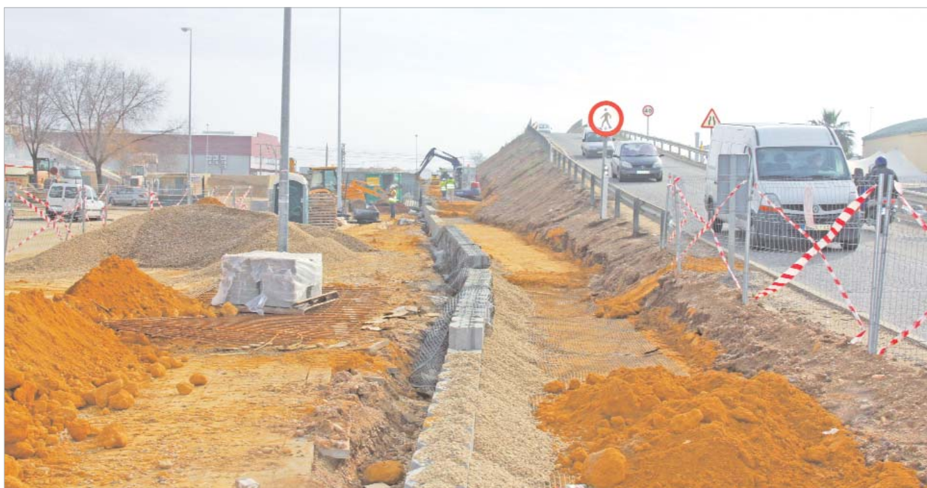
La ampliación del puente ya está en marcha y se espera que esté finalizado para el próximo año.