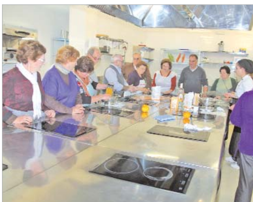
Los participantes, en pleno proceso de elaboración.

La actividad ha sido organizada por Soderinsa Veintiuno, dentro de los actos que viene desarrollando a lo largo de este año con motivo de sus veinte años de