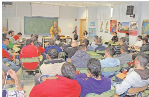
Alumnos de secundaria del instituto Antonio de Ulloa, durante una sesión informativa.

Con motivo de la conmemoración del Día Mundial Contra el Sida, el Área de Juventud instaló