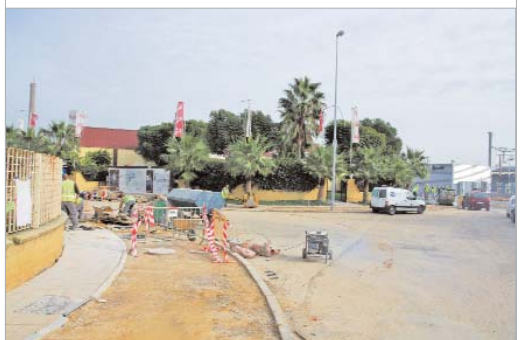
En Navidad el carril bici llegará a la nueva estación.

Por su parte, el carril bici sigue adelante. Actualmente, se está actuando en la avenida de Boyeros y antes de Navidad se pretende que esté asfaltado hasta la nueva estación. Asimismo, esta primera fase de tres kilómetros estará concluida el próximo año.