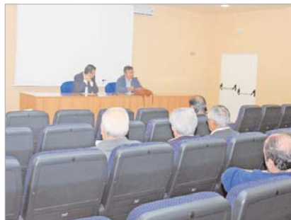
Los vecinos expresaron sus dudas e hicieron propuestas de las que tomó nota el Gobierno local.