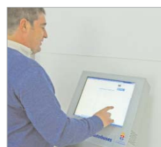
Hay dos pantallas táctiles.