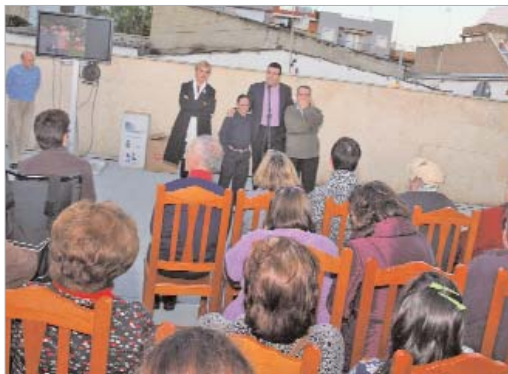
El alcalde y la delegada de Bienestar Social visitaron el centro.

A cada uno de los chavales se les hizo entrega de un regalo. El broche de oro lo puso el coro de campanilleros 'La Familia', que cantaron villancicos tradicionales, amenizando la tarde con sus voces y panderetas.