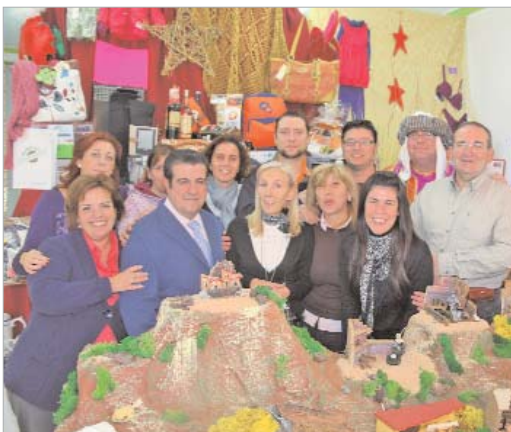
Los comerciantes han colocado un belén junto al escaparate que sortean.

para ofertar artículos a precios reducidos. Así, entre los clientes que hacen sus compras se regalan papeletas para entrar en el