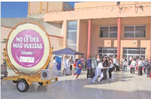
Voluntarios del área se disfrazaron para concienciar sobre el uso del preservativo.

Un punto móvil de información recorre los centros de Secundaria repartiendo folletos explicativos