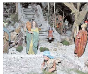
Una escena del belén.

celebrar la segunda edición de su Mercadillo Solidario, una iniciativa a la que este año se han sumado los comerciantes de La Paz. Además, el circuito de belenes ya está en marcha y las acciones solidarias también con el programa 'Caravana por la Paz' que organiza otro año la asociación de Amigos del Pueblo Saharaui.