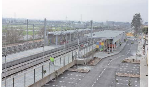
El diseño de la estación es moderno y vanguardista.