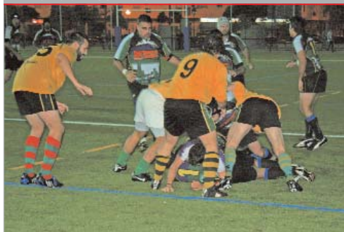
La Estación quiere convertirse en el equipo revelación de esta temporada.