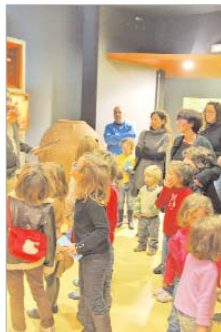
Un grupo visita el Museo.

El horario es a las 12.00 horas y es necesaria la inscripción previa para participar en las diferentes jornadas.