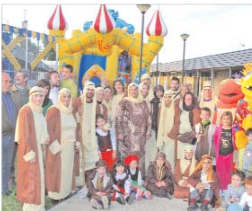
Los niños son los grandes protagonistas de este mercadillo que continúa el próximo día 21 con la llegada del cartero real.

Desde el seis y hasta el diez de diciembre, los comercios ofrecieron cada tarde a los pequeños actividades de animación que incluían castillos hinchables, reparto de globos y caramelos o la visita de personajes televisivos como 'Los Lunnis'. Asimismo, otro de los elementos que se convirtió en el cen-