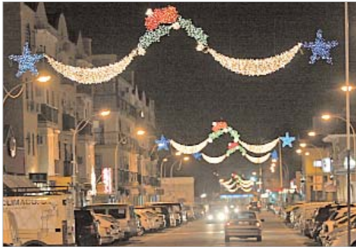
La calle Madrid es una de las vías elegidas para albergar las luces navideñas.

En concreto se han colocado 40 arcos artesanales de mimbre en las calles Madrid, Cultura, Córdoba, Alberto Lista, Los Carteros, San José y Málaga, en el núcleo de San José, y Virgen de Gracia, Justo Montescián