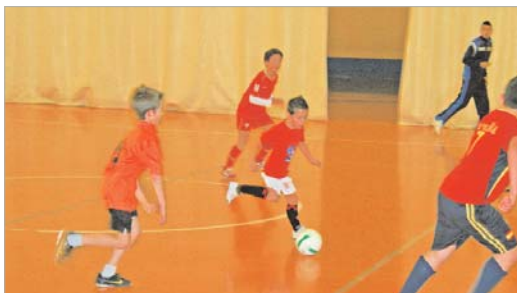
El joven canterano Robert vio puerta ante el conjunto de La Muralla.

El Tres Calles celebró el XIII Trofeo de Navidad ante una nutrida presencia de aficionados en las gradas del Agustín Andrades, Gorri .