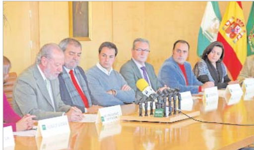
El presidente de la Diputación y la edil de Formación, durante la firma.

Prodetur, se pondrá en marcha a principios de año con el objetivo de promover el acceso al mercado de trabajo de las personas desempleadas que presentan mayores dificultades para encontrar empleo, tales como parados de larga duración, discapacitados, o colectivos en riesgo de exclusión social.