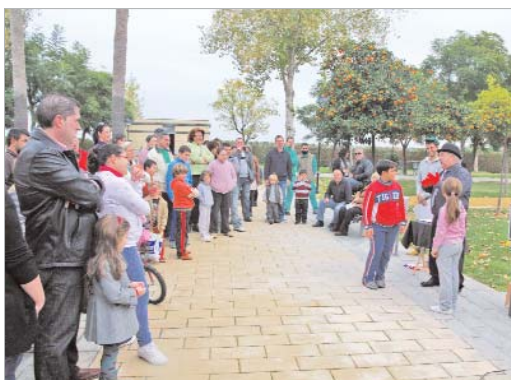
El parque Dehesa Boyal se convirtió en una escuela de reciclaje.

La asociación cultural 'La Caracola' organiza una jornada de sensibilización sobre el reciclaje en el parque Dehesa Boyal