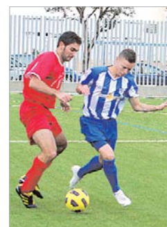
Emi intenta llevarse un balón.

Ahora, tendrán que visitar al Alcalá del Río, recibir al Benacazón e ir a Guillena, donde apurará sus últimos cartuchos, ya con los refuerzos que tiene previstos realizar.