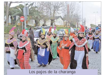
Los pajes de la charanga