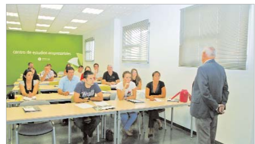
Las clases las imparten expertos en la materia.

hasta el viernes previo para inscribirse. El uno de febrero se impartirá otro sobre gestión del trabajo.