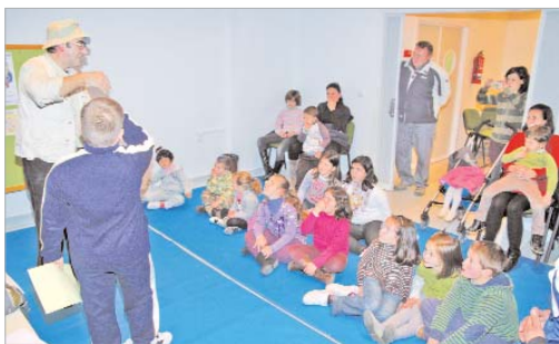
Los niños aprenden a través de las sesiones de cuentacuentos.

Sin olvidar que continúan con el club de lectura y con una nueva edición del concurso de relatos Gloria Fuertes.