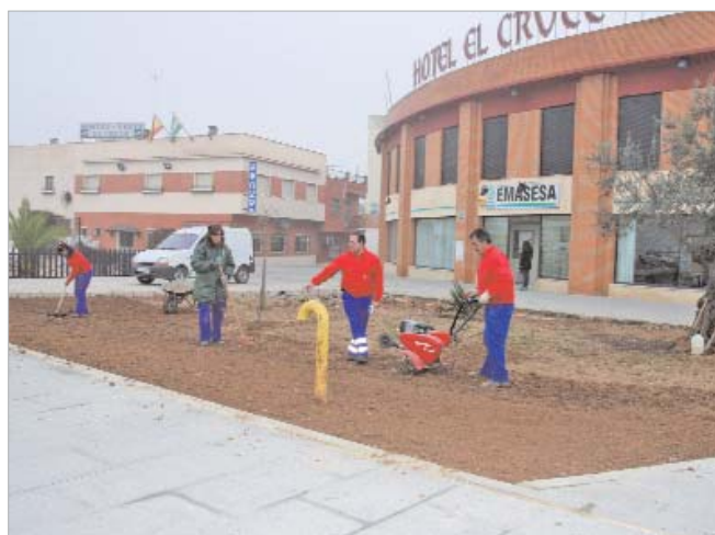
Se introduce jardinería en algunos parterres que estaban baldíos.