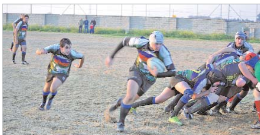
La Estación espera que se reanude la competición con muchas esperanzas.