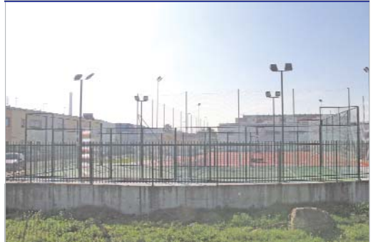
Pistas deportivas del Cábano 1.