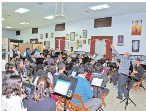
La Banda Municipal en uno de los ensayos de los viernes.

Hace alrededor de ocho años se formó la Escuela de Música Cristo del Perdón, empezó con clases particulares en la casa hermandad y desde hace tres años, con la colaboración del Ayuntamiento, se ha transformado en una auténtica academia en la que unos 120 niños y adultos aprenden a tocar algún instrumento.