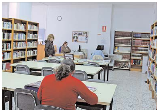
La biblioteca dispone de un amplio catálogo.

gio de Los Azahares que leerán los alumnos a partir de cinco años.