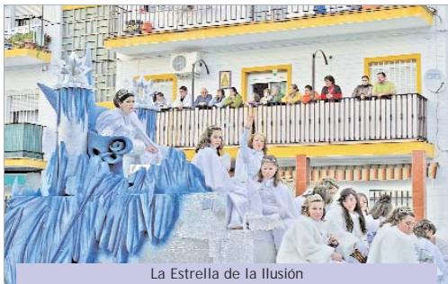
La Estrella de la Ilusión