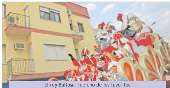
El rey Baltasar fue uno de los favoritos