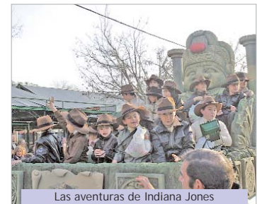
Las aventuras de Indiana Jones