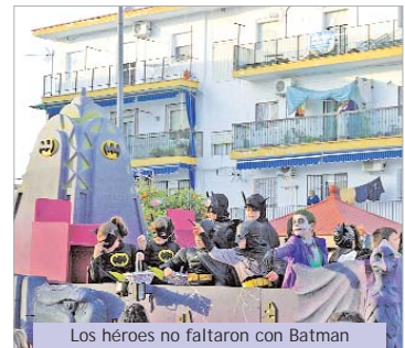
Los héroes no faltaron con Batman