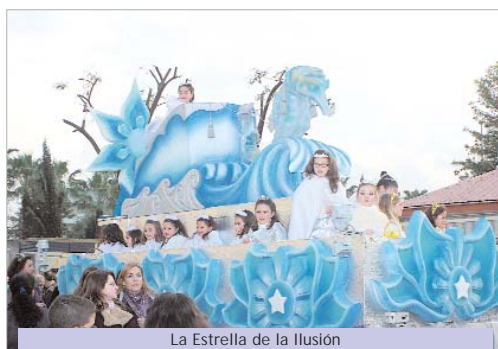
La Estrella de la Ilusión