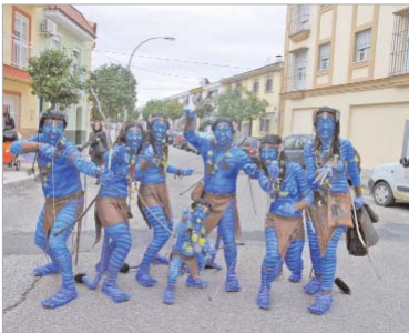
'Avatar' ganó el concurso del año pasado de La Rinconada.

El domingo estará dedicado a los niños. Tampoco faltará el baile, la fiesta y los premios.