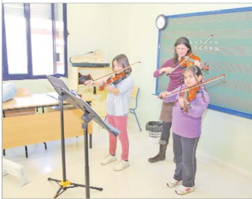
Un par de alumnas aprenden a tocar el violín.

El escenario elegido será como siempre el Centro Cultural de La Villa.