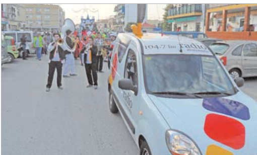
Radio Rinconada retransmitió en directo la Cabalgata de Reyes.

La Radio se hizo eco del día de la ilusión de los más pequeños y así, preparó una programación especial con motivo de las cabalgatas de Reyes en ambos núcleos de población.