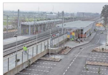
Vista general de las instalaciones.

El apeadero contará con un paso inferior entre andenes accesible a personas con movilidad reducida y, además, posibilitará la intermodalidad bus-ferrocarril.