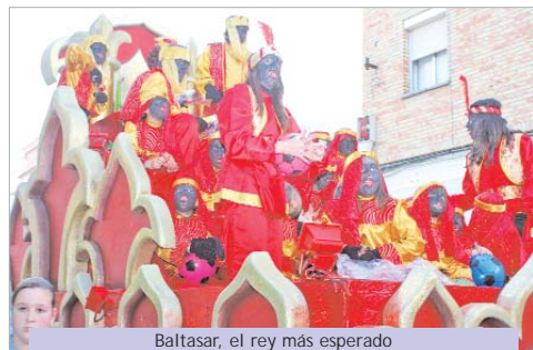
Baltasar, el rey más esperado