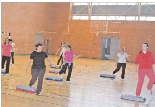
Un grupo de aero-step en el pabellón Fernando Martín.