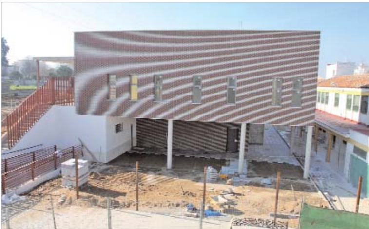
El Centro Ocupacional de Torrepavas, en la recta final.

Para ejecutar la obra se han contratado a 19 vecinos, siguiendo la línea del Ayuntamiento de contratar mano de obra local.