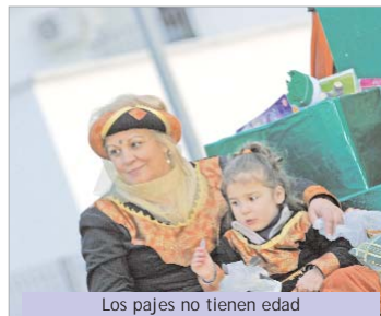
Los pajes no tienen edad