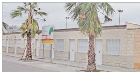
Las sedes se entregarán próximamente a los clubes.

nuevo voladizo y con la construcción de una sala polivalente. En su campo anexo se ha sustituido el suelo de arena por césped artificial y se han reformado las gradas. Por último, la piscina al aire libre del 'Castañita' fue sometida a una remodelación completa antes de la temporada de verano.