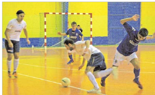
El Tres Calles se está reencontrando con su parroquia a base de goles.

En la segunda parte, Waito puso más tierra de por medio y, aunque los visitantes recortaron hasta el 6-3, Waito selló su