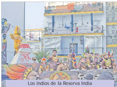
Los indios de la Reserva India