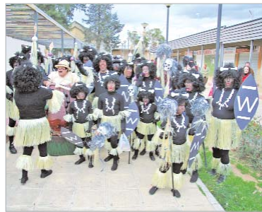
Las familias se disfrazan para hacer el pasacalles.