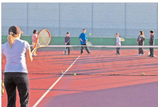
Los más pequeños disfrutan con las clases de tenis.