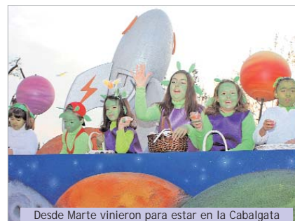
Desde Marte vinieron para estar en la Cabalgata