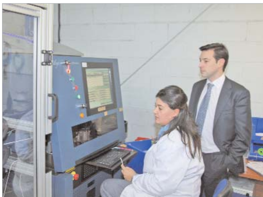
SACT dispone de la tecnología y la maquinaria más avanzadas.