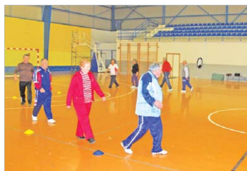
Los mayores realizan ejercicios para mantenerse en forma.

Además, a través de las escuelas deportivas los clubes locales federados cuentan con una amplia cantera de deportistas para sus respectivas disciplinas.