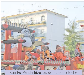
Kun Fu Panda hizo las delicias de todos