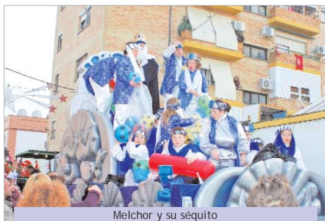
Melchor y su séquito