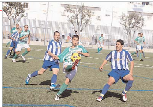
Sedeño y Machio presionan a un futbolista del conjunto palaciego.

Pronto cobraría ventaja en el marcador el equipo del Leonardo Ramos, después de un córner que remató en el primer palo