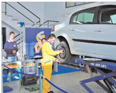
Uno de los participante realiza una prueba.