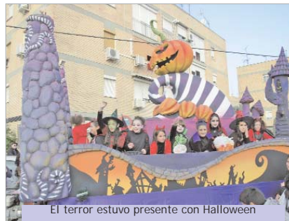
El terror estuvo presente con Halloween