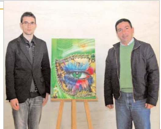
El delegado de Festejos y el ganador del concurso junto al cartel.

Bajo el lema 'Otro punto de vista' el autor ha diseñado un enorme ojo de largas pestañas