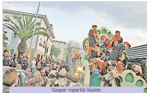
Gaspar repartió ilusión