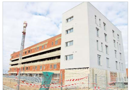
Los 44 dúplex de Rinconada Oeste continúan a buen ritmo.