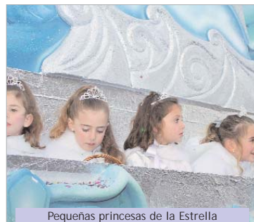
Pequeñas princesas de la Estrella