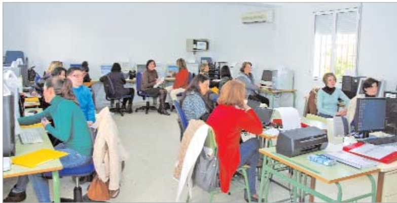
Alumnas del taller de ofimática durante el transcurso de una de las clases.

Durante este mes el programa de actividades crece con la puesta en marcha de dos nuevos módulos - uno de 'Informática básica' y otro de 'Ofimática' - que acercan a las participantes al mundo de las nuevas tecnologías.