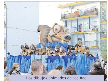
Los dibujos animados de Ice Age