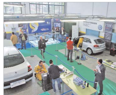
Empresas del automóvil han estado presentes.

o los frenos de los coches, entre otras categorías. Además, los ganadores recibirán una preparación específica para participar en la fase nacional.