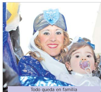
Todo queda en familia