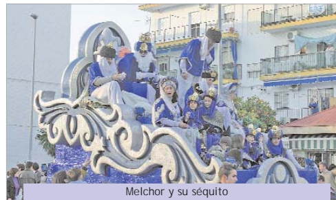
Melchor y su séquito