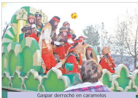
Gaspar derrochó en caramelos