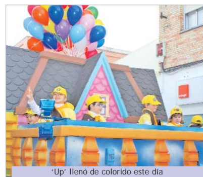
'Up' llenó de colorido este día