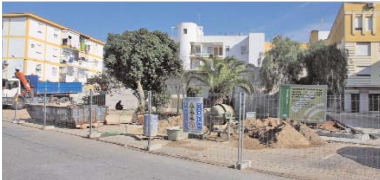
El Centro Municipal de la Mujer continúa en obras.

efectos negativos de la crisis. Para ello, el presupuesto para este año "persigue que los sectores de la población que más lo necesitan mantengan su nivel de vida y es por esta razón por la que no hemos reducido la partida que se