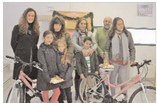
La edil de Cultura junto a las premiadas en un acto en la biblioteca.

Vega las felicitó "por la creatividad demostrada" y las animó a "seguir visitando la biblioteca, para que conozcáis el centro, cómo funciona y participéis en las múltiples actividades que se realizan tanto en el de