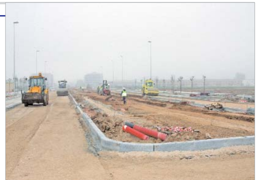
La avenida de La Unión estará lista en unos meses.

na, equiparando los servicios de aquellas zonas envejecidas a los de las barriadas de nueva creación. Para ello, se reservan 1,7 millones de euros que modificarán la estética de las principales vías del municipio.