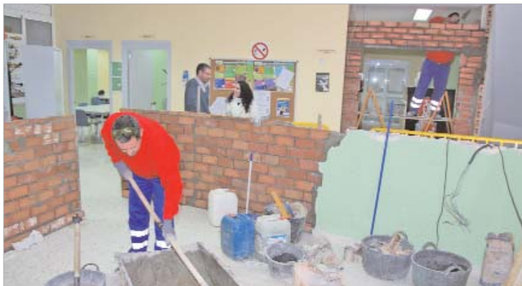
Las obras consisten en la reestructuración del espacio disponible en la primera planta del edificio.

También, gestionará la puesta en marcha de diversas acciones formativas y de ocio, por lo que se reforzará el grupo de voluntariado de este núcleo.