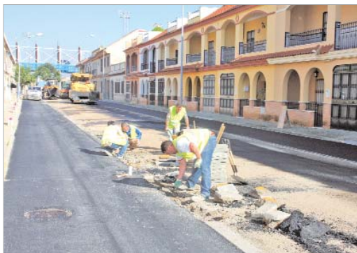
Imagen del proceso de pavimentación de la calle San Cristóbal.

San Cristóbal donde ya ha concluido el proceso de asfaltado y pavimentación de la primera fase de las obras, que comprende desde la intersección con Vereda de Chapatales en dirección a la avenida Jardín de las Delicias.