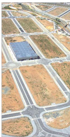
Vista aérea del Cádiz 3.