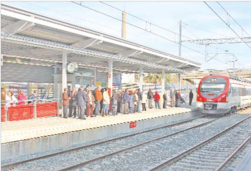
Numerosos vecinos acudieron al acto.

El municipio avanza hacia un modelo de ciudad moderna y sostenible con la puesta en funcionamiento de una nueva estación que dará servicio a las nuevas barriadas en expansión y a los trabajadores procedentes de los parques industriales.