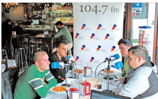
Diez y Trompo analizaron el paso a sénior en El Templo de la Cerveza .

Tertulia Deportiva sigue cumpliendo ediciones con diferentes temáticas y en establecimientos diversos de La Rinconada.