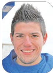
Marchena U.D. Rinconada

El centrocampista defensivo cañamero no pudo estar en Hytasa al cumplir ciclo de tarjetas por segunda vez en lo que va de temporada. El futbolista ha visto diez amarillas en la presente campaña y fue expulsado ante La Barrera.