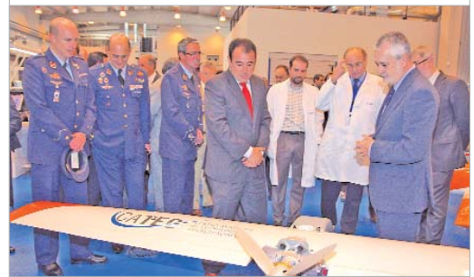
Visitaron todas los departamentos del centro.

difundir los resultados de sus investigaciones y proyectos y mantiene y coordina sus actividades con la Universidad y otros centros de investigación.