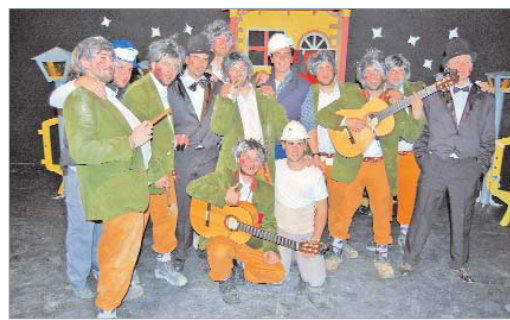
Los Surferos regresan con un tipo que promete en Las Viagras Glorias .