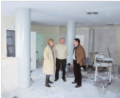
La reforma consiste en redistribuir el espacio.

Una vez concluidos los trabajos, el ambulatorio se utilizará como nueva sede de Servicios Sociales, abandonando así las dependencias que ocupan desde 2005 en el Centro de Día '20 de Julio'.