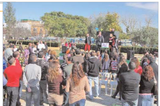
Los más pequeños disfrutaron a lo grande de un nuevo Carnavalito .

Y es que la diversión continuará en la calles durante los siguientes fines de semana, los días 18, 19 y 20 en La Rinconada, y los días 26 y 27 en San José.