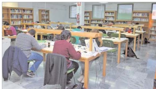
La biblioteca está abierta hasta las doce de la noche.

A partir del 13 de febrero la biblioteca vuelve a su horario habitual.