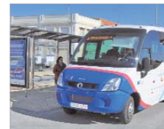
Parada de microbús.

La empresa encargada de gestionar el servicio, Grupo Ruiz, ha adquirido tres vehículos, que se caracterizan por ser de última generación, de modo que cuentan con sensores acústicos para invidentes, avisos de paradas, adaptabilidad para personas con movilidad reducida y conexión a través de GPS. Asimismo, se han colocado 37 postes y ocho marquesinas que señali-