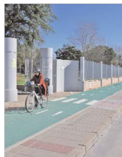
El tramo de carril bici que discurre por Jardín de las Delicias.

En estos momentos se trabaja en la avenida Ain Beida y desde ahí continuará hasta el parque 8 de Marzo, Juan de la Cueva, Jorge Manrique, Juan de Austria, Joaquín Flores Márquez y avenida de San José hasta unirse al carril existente en el primer tramo del paseo Almonazar.