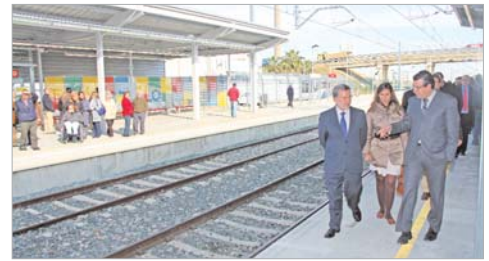
El alcalde, durante la visita.