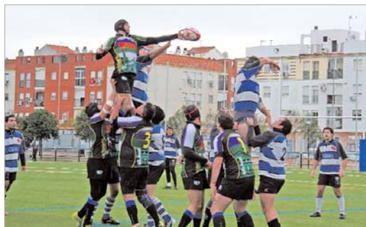
El duelo ante el Córdoba marcará definitivamente las opciones del club.

La competición, que parecía un duelo entre los ferroviarios y los califales, ha asistido a la irrupción del cuadro universitario que, en estos momentos, a pesar de sumar dos derrotas en la primera vuelta, se ha colado entre los aspirantes con opción