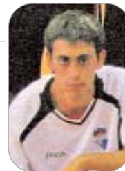
Waito Tres Calles

El mediapunta recién llegado al Rinconada desde el Tocina, debutó a lo grande ante el Alcalá. Fue salir al campo y estrenar su cuenta goleadora. La lástima es que no sirvió de nada, ya que el Rinconada cedió el triunfo por 2-1.