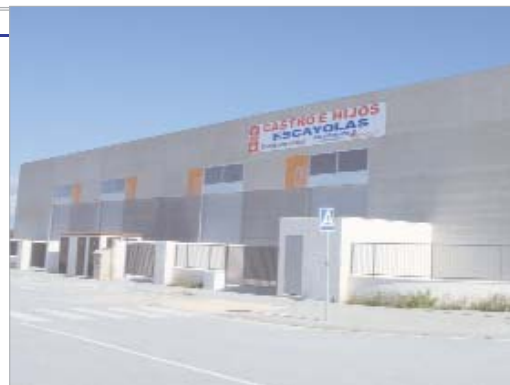
Imagen general de las naves.

Las construcciones están terminadas enteramente de hormigón y disponen de un sistema contra incendios. La superficie es de unos 170 metros cuadrados útiles y disponen de patios que van desde los 48 a los 120 metros cuadrados.