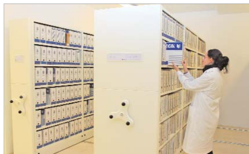
El archivo municipal está disponible para todos los ciudadanos.

"Investigadores y ciudadanos podrán consultarlo y su reproducción tendrá fines culturales y científicos", apunta la edil.