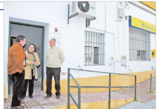
Los ediles de Vía Pública y Juventud durante una visita a las obras.

Así, el centro contará con un vestíbulo donde se ubicará el punto joven para ofrecer a los chavales información sobre cursos, viajes u