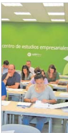
Seminarios en el Centro de Estudios.

Así, se destinan un total de 2,7 millones de euros a diferentes proyectos. En el Cádiz 3 se construirán en el primer trimestre del año seis nuevas naves y además, se lanzan dos naves en alquiler y otras dos con opción a compra, "de modo que la falta de financiación no sea un obstáculo para iniciar una activi-