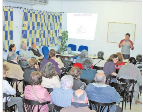
Los mayores asisten a una ponencia sobre la importancia de la cultura andaluza.