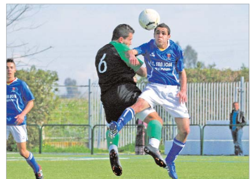
Los azulinos vengaron la derrota en Jerez por 1-0 con un set en blanco.

Los cañameros derrotan al Pueblonuevo por un contundente 6-0 y aspiran a ascender