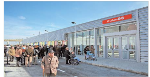
Puerta principal de la estación.