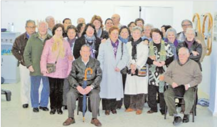
Los alumnos de tercero ya están planificando el viaje de fin de curso.