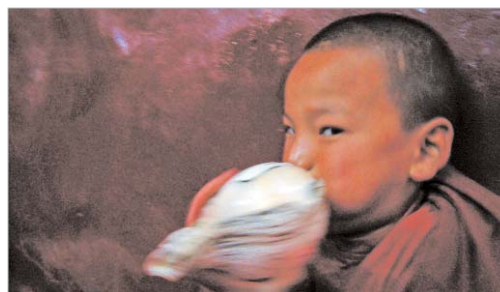
Una de las fotografías de la exposición.

"Desde el área de Cultura nos propusimos a principios de legislatura apoyar las creaciones y acciones culturales de nuestros vecinos y la sala de exposiciones ha sido un buen ejemplo de ello, ahora traemos al municipio un pedacito de Asia", señala la edil del ramo, Raquel Vega.