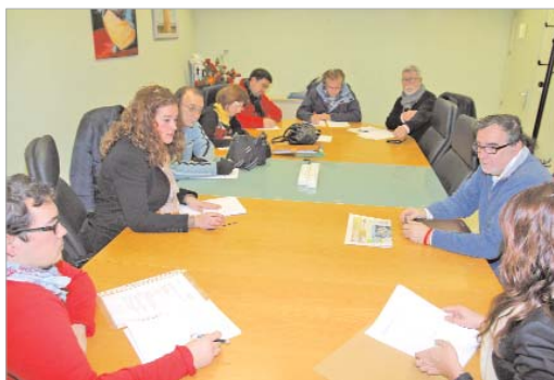
La delegada de Salud junto con representantes de los centros educativos.

En el mes de febrero se pone en marcha una nueva campaña higiénico-bucal que está destinada a los alumnos de Primaria y con la que