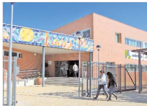
El CADE de La Rinconada está ubicado en el 'Juan Pérez Mercader'.

Por otra parte, las subvenciones para el mantenimiento del trabajador autónomo son de hasta 4.000 euros para financiar gastos de funcionamiento de los últimos seis meses como puedan ser el alquiler del local, la cuota de autónomo, la luz y el agua, el