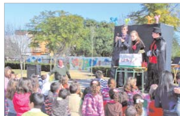
El Carnavallito congregó a un buen número de vecinos.

A continuación, abrirán paso las máscaras y los disfraces que volverán a inundar las calles de ambos núcleos de población.