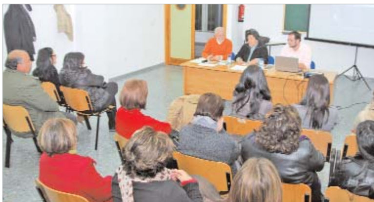
La jornada informativa se celebró en el centro municipal de formación 'Juan Pérez Mercader'.

Durante algo más de dos horas los asistentes pudieron aclarar sus dudas e introducir propuestas que ayuden a volver a la vida y a la esperanza al pueblo haitiano.