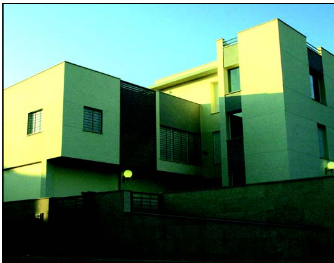
Las obras de la zona residencial están listas y las del centro de día tras en otoño.

Así, se dividirá esta zona para habilitar una sala de estar-comedor, un gimnasio-sala de rehabilitación y un taller para actividades ocupacionales, además de los despachos administrativos.