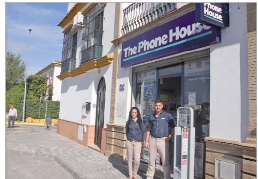
Los comienzos han superado todas las previsiones de la empresa.

muy exigentes de excelencia de calidad para las aperturas, "lo cierto es que los comienzos han superado todas las previsiones iniciales que teníamos, fundamentalmente por la gran aceptación de los vecinos, gran parte de los cuales ya eran clientes de 'The Phone House' y que hasta ahora se tenían que desplazar a las tiendas de Sevilla", comenta la dueña.