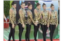
Conjunto Júnior A Oso Panda Rinconada

Después de varios años sin competir en la categoría absoluta, este año se federó al Junior y éste ha logrado clasificarse para el Nacional tras ser tercero en Andalucía.