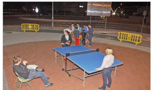
Los juegos de mesa tienen una acogida muy favorable.