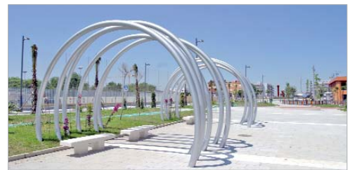
Más de 3.500 personas asistieron a la apertura del primer tramo.

Alrededor de 3.500 personas compartieron el inicio del sueño del soterramiento del arroyo Almonazar y la puesta en servicio del bulvar resultante en lo que fue un episodio histórico para La Rinconada. Atrás quedaban unos últimos años en los que habían tenido que convivir con un problema medioambiental y una cicatriz que dividía el núcleo de San José. Anteriormente a eso, también se daba carpetazo a otros, problemas anteriores, pero que aún recordaban algunos de los presentes, en los que el arroyo provocaba riadas que se traducían en cuantiosas pérdidas materiales y alguna que otra desgracia personal. Como dijeron