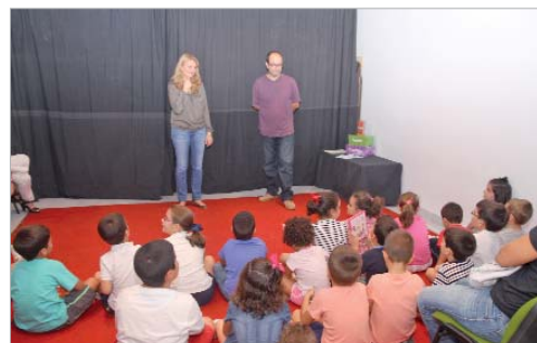
La edil de Cultura acompañó a los niños en la primera sesión.

En la clausura de la pasada edición participaron 400 personas en