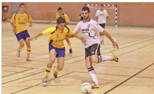
El San José ha sabido reponerse a su primera derrota y sigue en cabeza.