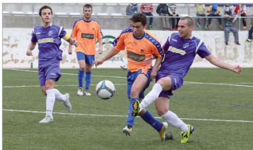
Leo anotó el primer tanto en Paradas, primera victoria azulina a domicilio.