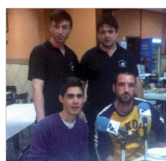
El C.T.M. San José, en Casa Funes.