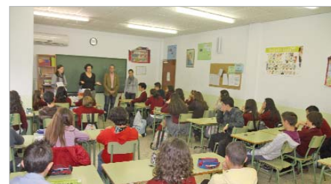
Alumnos del colegio San José, durante una charla informativa.