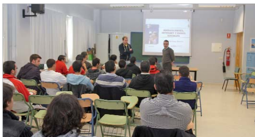
El delegado de Educación acompañó a los jóvenes en esta primera sesión.

El área de Participación Ciudadana pone en marcha estos talleres que se imparten en los institutos de la localidad