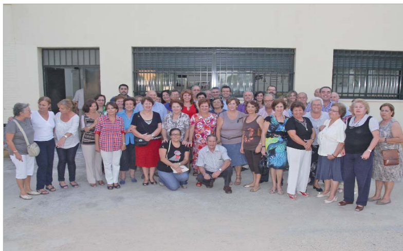
Un total de 21 alumnos estudian este año el tercer curso del programa educativo Aula Abierta.

en la edición anterior podrán acceder a un programa de postgrado denominado Aula de Formación y Ocio (FOROCIO), "un proyecto que quiere ser un incentivo para que deis continuidad a vuestra formación, y que servirá de transición y sentará las bases para la creación el próximo año de una Universidad Cívica Municipal, en la que se estudiarán los contenidos de ahora