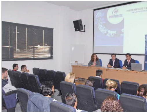
El alcalde y la delegada de Empleo y Formación visitaron el primer día del curso.

Durante la visita, Fernández señaló que "este tipo de iniciativas forman a nuestros jóvenes en profesiones con futuro y con oportuni-