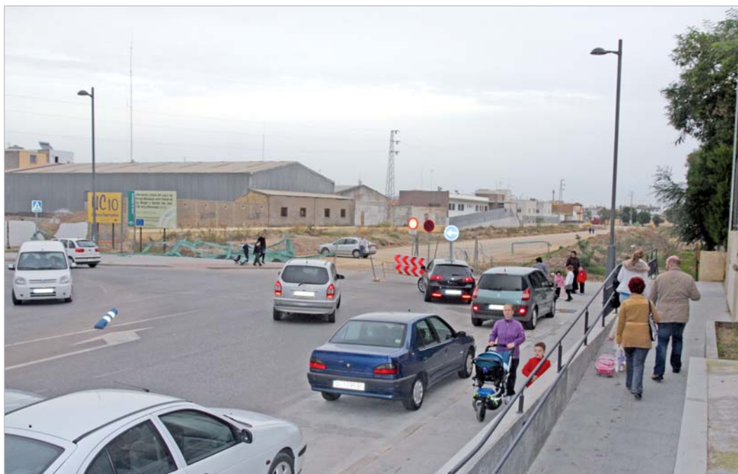
Vista del segundo tramo del bulevar resultante del soterramiento del arroyo Almonazar, sobre el que se actuará como última fase de una obra histórica para La Rinconada.

ración del segundo tramo, el global del paseo quedará vertebrado por una zona central peatonal