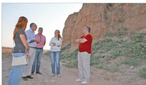
El Cerro Macareno cuenta con restos arqueológicos importantes.

La delegada de Cultura y un grupo de especialistas en patrimonio visitan el yacimiento que acoge restos de diferentes civilizaciones