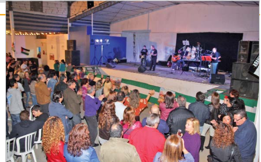
'Ratas Muertas del Almonazar' durante su actuación.

Agüera, "la solidaridad siempre tiene un gran valor, y en estos