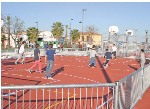
Los vecinos de La Rinconada cuentan con pistas de baloncesto y fútbol sala.

"Desde hoy, los vecinos y las vecinas de la localidad disponen de un nuevo espacio de ocio al aire libre. Entramos en la fase final de la urbanización del arroyo Almonazar con el que hemos solucionado un problema histórico para el municipio en el que se eliminan las cuestiones medioambientales", señaló el alcalde, Javier Fernández, durante el acto de apertura.