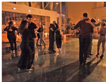
Amantes del tango de Andalucía llegaron al Centro Cultural de La Villa.

Entre tango y tango, quienes lo desearon pudieron tomar un refrigerio en la barra habilitada para la ocasión y cedida a la Hermandad Cristo del Perdón, que recaudó fondos para sus actividades.