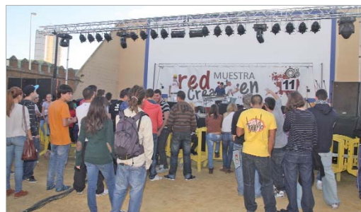
Los conciertos mostraron las dotes musicales de los participantes.

con ganas de pasarlo en grande, más de 1.500 jóvenes se dieron cita para disfrutar de los conciertos y la animación, que desde las 12.00 horas, amenizaron la jornada.