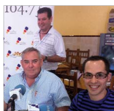
El San José F.S., en Casa Soto.