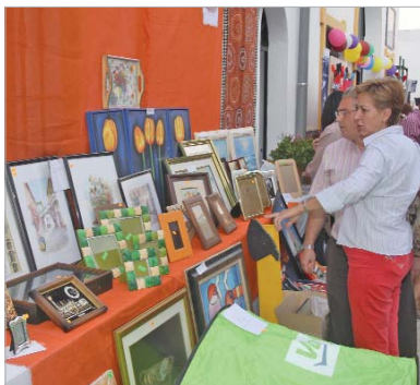
La edil de Fiestas Mayores visitó el mercadillo.

Los ciudadanos que así lo deseen, pueden hacer donaciones a la cuenta habilitada por el área de Cooperación Internacional en el Banco Popular 0075 3189 14 0665 00 15 43.