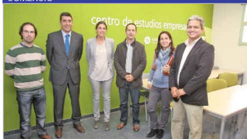
Varios representantes de la Cámara de Comercio visitaron la nueva oficina.