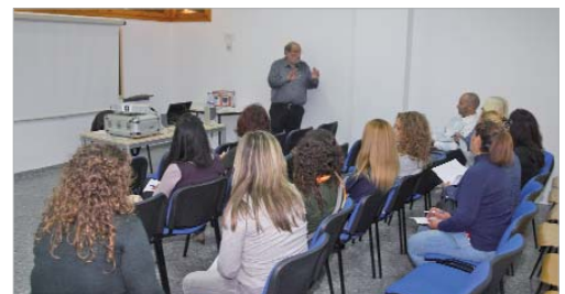
Unas 12 personas asistieron a esta acción formativa.