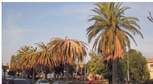
El insecto ataca a la palmera causándole la muerte.

La colaboración ciudadana es importante para detener su expansión