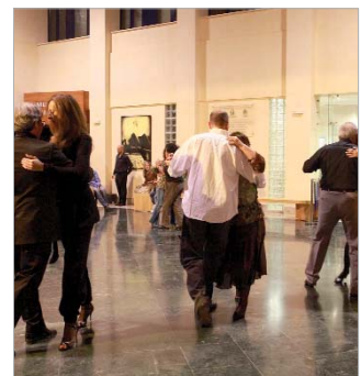
Todos los participantes disfrutaron de la jornada.