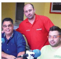
La Estación de Rugby en El Kike.