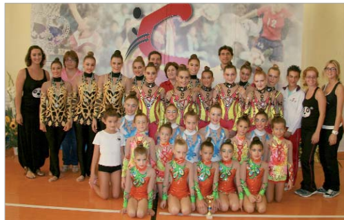
La familia del Oso Panda posa tras concluir el XIII Villa de La Rinconada.

Ya el tradicional Villa de La Rinconada permitió ver el potencial de las distintas escuadras y las citas posteriores no han hecho más que reafirmar las posibilidades y confirmar el gran trabajo que viene realizando la entidad. Enhorabuena a todas ellas.