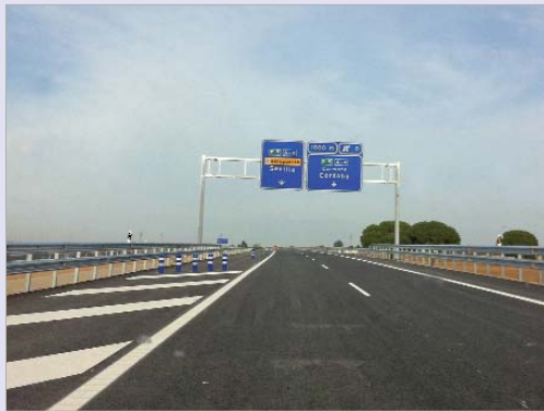
El tráfico fluido de vehículos por la SE-40 es ya una realidad.

de 108 millones de euros y suponen el primer estímulo para reducir los atascos que se forman en los accesos a la capital hispa-