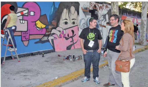
El concurso de graffiti llena de arte la calle Azucareros.

La música, el baile, la animación y los graffitis convierten al municipio en punto de encuentro para artistas y jóvenes creadores