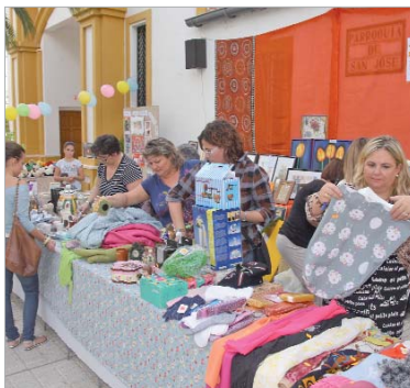
La portada de la iglesia San José acogió a los puestos.