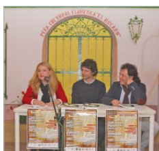
Presentación del libro.

La obra hace un recorrido por la historia de la peña, sus comienzos con un grupo de amigos hasta el primer festival oficial que se celebró el 10 de junio de 1983. El autor