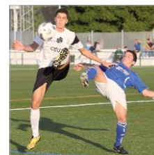
Duelo ante el África Ceutí.

El San José sigue situado en la mitad de la tabla después de los últimos resultados. El más reciente, la victoria ante el África Ceutí por 3-2.