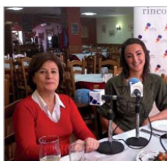
El Oso Panda, en El Braserito.