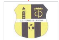
Club Deportivo Torre de la Reina