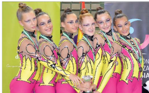
El Infantil de base se proclamó subcampeón de Andalucía en Granada.