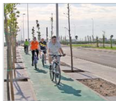
Carril bici del municipio.

Esta iniciativa se centra en los peatones y en los carriles bici y regula, asimismo, la circulación, la parada y el estacionamiento sobre áreas peatonales y vías ciclistas. La futura ordenanza quiere ser lo más participativa posible, por lo que su contenido inicial se ha