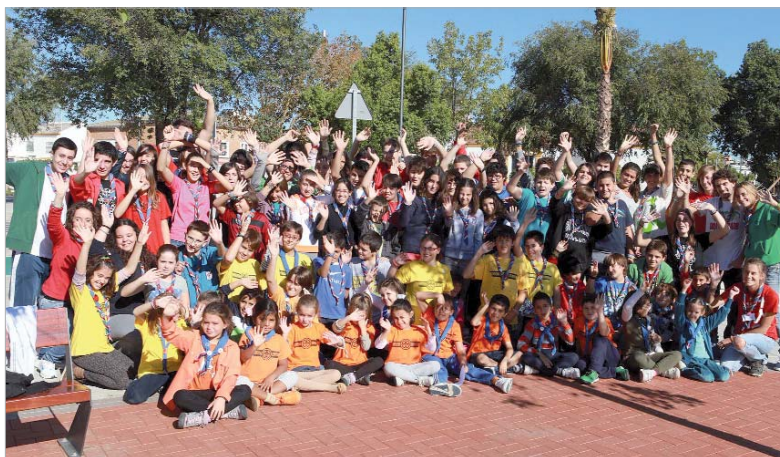
El Paseo del Almonazar acogió la reunión del grupo de scouts del municipio.

edades, los chavales pasaron un rato agradable y divertido en com-