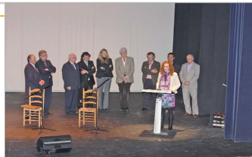
La gala se inició con el homenaje a Carrión de Mairena y Vega e Hijos.

habla de todos aquellos que con su granito de arena contribuyeron a crear lo que es hoy esta sede. Por otro lado, desgana cada uno de los festivales que se han celebrado.