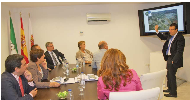
La consejera y el equipo de Gobierno se reunieron en el Ayuntamiento para hablar de los proyectos urbanísticos.

Esta infraestructura se divide en dos tramos. El primero, de 5,4 kilómetros, entró en servicio en 2006 y discurre entre La Rinconada y San Jerónimo. Las obras del segundo, donde se incluye un viaducto, se dividen en dos partes: una avenida