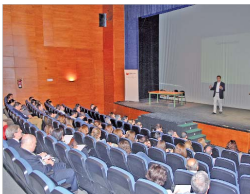
El Centro Cultural de la Villa reunió a empresarios y emprendedores.

Más de 200 personas asisten en La Villa a una mesa redonda y una conferencia que convierten a La Rinconada en el epicentro de las tecnologías de la información y la comunicación