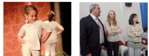
El pase de modelos de la Hermandad de La Resurrección fue un éxito.