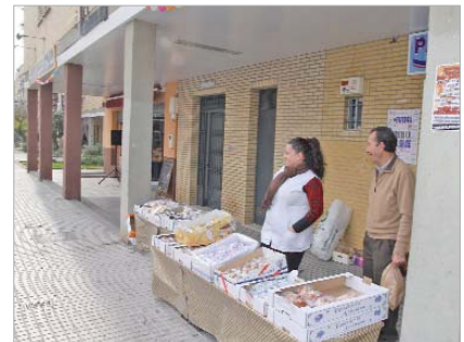
Mercadillo Barriada Santa Cruz.