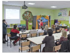
Taller de la asociación Flor de Jara.