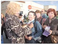
Reparto de lazos blancos.