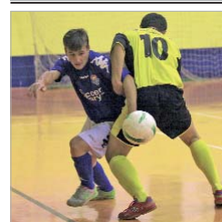
Chiqui, ante el Peñaflor.