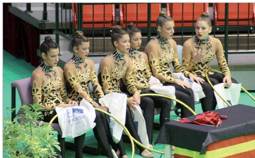
El equipo Junior estuvo a la altura de la exigencia del Campeonato.