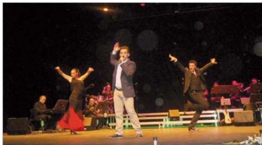
El artista sorprendió al público interpretando 21 temas.