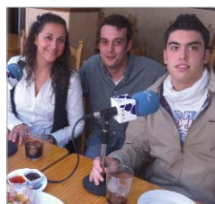
El equipo de natación, en El Beto.