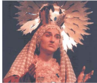
Bastarda Española y su 'Estrella Sublime'.