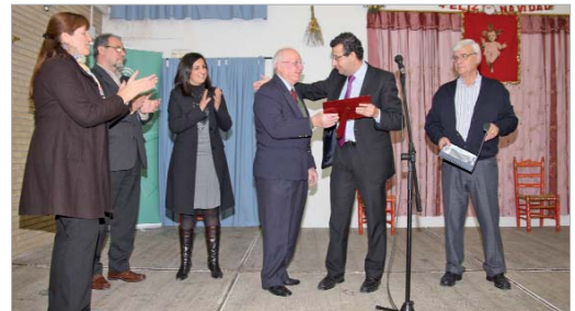
El Centro de Día rindió homenaje a Carrión de Mairena.