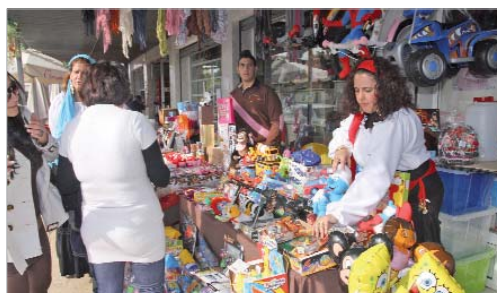
Los comerciantes contagian a los vecinos la ilusión por la Navidad.