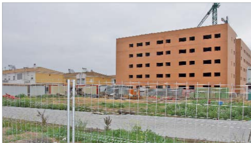
Los terrenos donde se levantará la biblioteca están plenos de actividad.

han comenzado en la zona de acceso a Pago de Enmedio con una duración estimada de aproximadamente