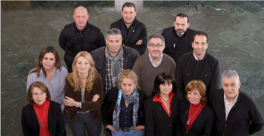
Desde hace diez años el equipo del área de Cultura viene trabajando en el Centro Cultural de La Villa con ilusión para acercar la cultura a todos.