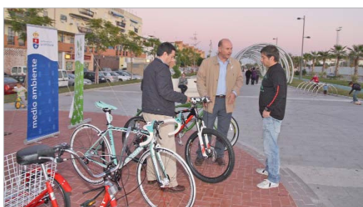
Los ediles de Medio Ambiente y Movilidad visitaron el stand informativo.