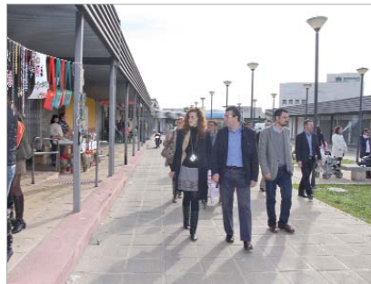
Mercadillo de La Paz.