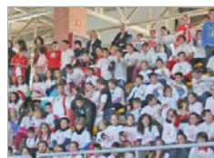
Los jugadores sevillistas hicieron las delicias de los escolares locales.