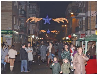
Mercadillo de la calle Córdoba.

Desde el Ayuntamiento se ha prestado todo el apoyo necesario para el buen funcionamiento y éxito de los mercadillos. De tal modo que, desde la delegación de Festejos, se ha dado base organizativa, a través de Comunicación se les ha suministrado publicidad y difusión, Vía Pública ha puesto la logística y la coordinación ha corrido a cargo de la concejalía de Comercio.