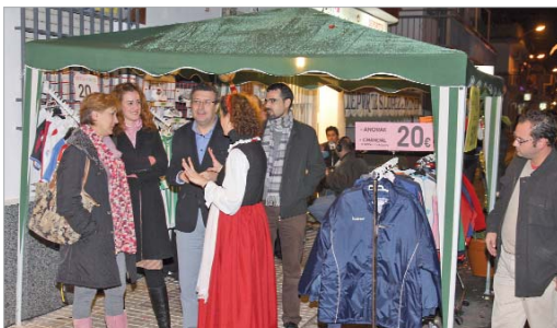
El alcalde y su equipo de Gobierno visitaron el mercadillo.

Los comercios sacan sus tenderetes a las puertas de sus negocios para promover las ventas