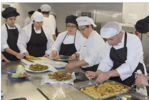
La escuela acoge a alumnos interesados en aprender diferentes disciplinas.

Actualmente, 75 personas están participando en los módulos de venta de productos y servicios turísticos, operaciones básicas de catering, aplicaciones informáticas