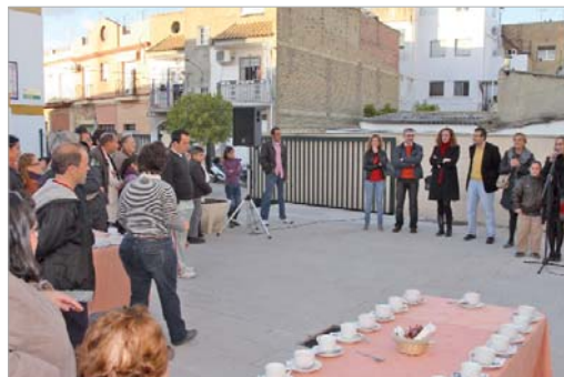
Los usuarios disfrutaron de una merienda con sus familiares.

que seguir trabajando en el reconocimiento y respeto a las personas con discapacidad como ciudadanos de pleno derecho, favoreciendo así la igualdad y una mayor presencia en todos los ámbitos de la sociedad", señala el primer edil.