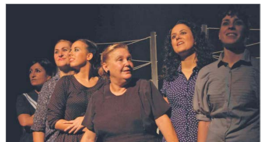
Fotografía del aula de Factoría Creativa.

Al ensayo asistieron, entre otros, participantes de otras enti-