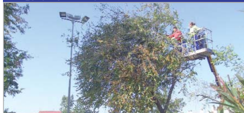
Con ayuda de una plataforma los operarios podan los árboles.