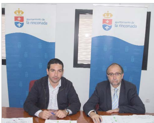
El delegado de Movilidad en la presentación de la encuesta del Grupo Ruiz.

La empresa concesionaria del servicio, Grupo Ruiz, ha hecho pública una encuesta realizada el pasado