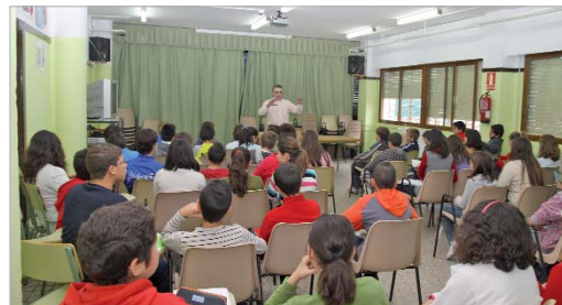
El delegado de Educación dio una charla sobre la Carta Magna.

Así, 50 estudiantes de primer curso de Primaria del colegio Los Azahares visitaron el