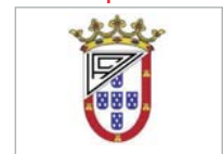
Unión África Ceuti Liga Nacional Juvenil

El rival del cuadro juvenil no digirió bien la derrota (3-2) en su visita al Anexo y se ensañó con las instalaciones del Felipe del Valle, rompiendo varias puertas.