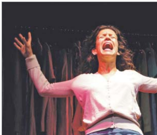
Compañía Tenemos Gato.

La Villa acogerá tres exposiciones sobre Memoria Histórica de La Rinconada, la Constitución de 1812 y las mujeres