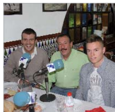
El fútbol local, en Tendío 12.