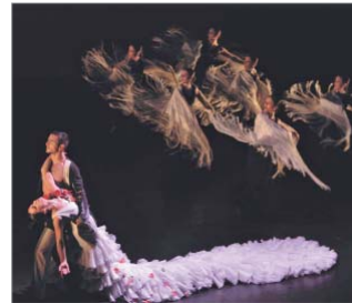
Centro Andaluz de Danza.