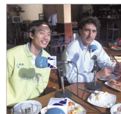
El Soderinsa, en El Pezcaito.