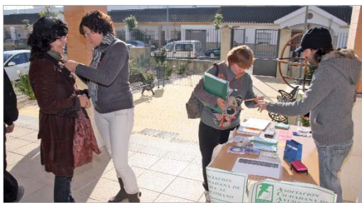
El instituto Antonio de Ulloa acogió una mesa informativa de ACAT.

Los jóvenes aprenden que la prevención es la clave para evitar la enfermedad