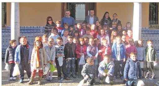
Alumnos de los Azahares visitaron el Ayuntamiento.

Los colegios de la localidad han celebrado el Día de la Constitución desarrollando actividades que tratan de acercar a los alumnos a la realidad histórica del país y ponen