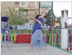
Performance sobre la violencia.