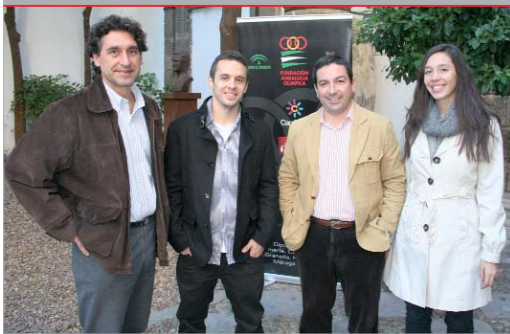
El delegado de Deportes, con los becados por Andalucía Olímpica.