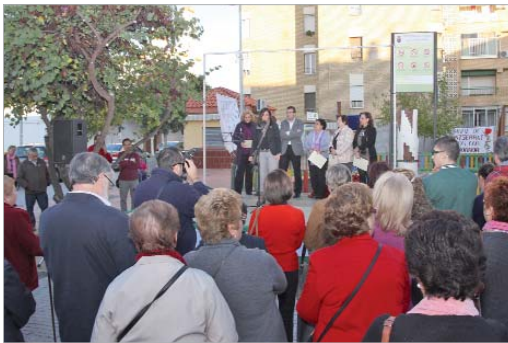
El alcalde durante la concentración en repulsa por la violencia de género.

Tanto Ayuntamiento como colectivos locales, han organizado un amplio programa de actividades, a través de las cuales "buscamos concienciar a nuestros vecinos y vecinas acerca de este problema social y dar nuestro apoyo a las víctimas. Este año hemos