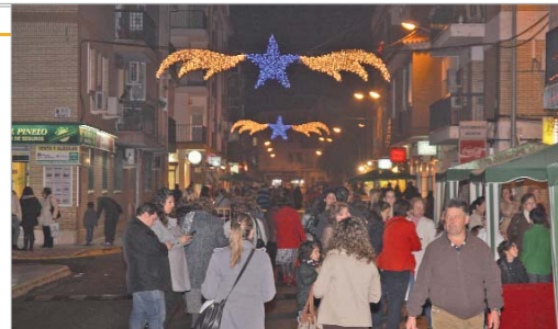
Los vecinos de la localidad disfrutan de las luces que engalanan las calles.