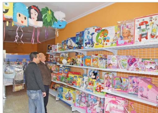
La calidad de fabricación de los juguetes es clave.

talleres de maquillaje facial o la visita de Mickey y Minnie Mouse.