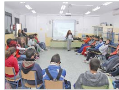
Charla sobre buenos tratos.