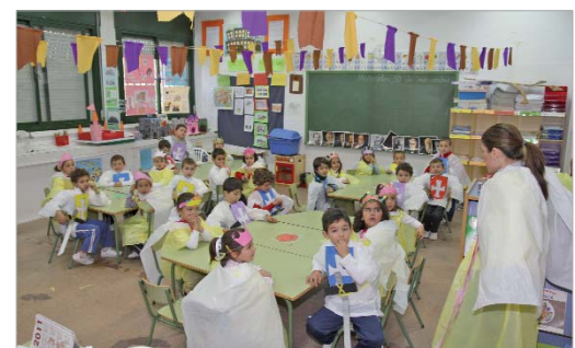
Los alumnos se disfrazaron de caballeros y princesas.

para inaugurar oficialmente la actividad. A continuación, los pequeños celebraron un baile medieval vestidos de princesas y caballeros y, tras el desayuno, tomaron parte en los juegos que se desarrollaron en el gimnasio.