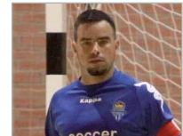
Porra Tres Calles F.S.

El capitán rinconero ha sumado esta temporada a su sacrificio y pelea habitual, un gran potencial goleador que le sitúa como segundo 'Pichichi' de su equipo.