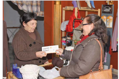
Los comerciantes entregan folletos informativos a los clientes.

Como señala Padilla, "si reflexionas sobre donde ir a comprar te das cuenta del potencial de nuestro pueblo. Hay muchos lugares a los que podemos dirigirnos, tenemos una amplia oferta de productos y servicios disponibles para que nuestros vecinos hagan uso de ellos".