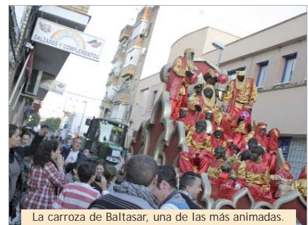
La carroza de Baltasar, una de las más animadas.