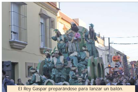
El Rey Gaspar preparándose para lanzar un balón.