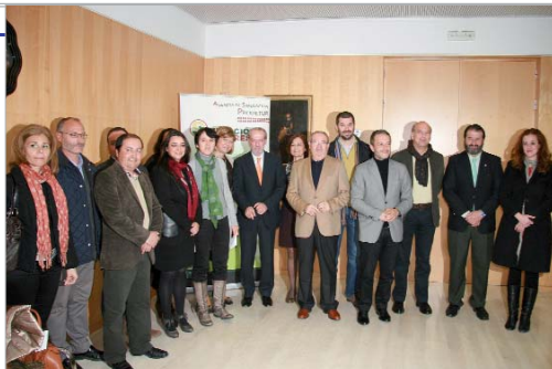
Foto de familia de los participantes en la firma del convenio en la Diputación.

Paralelamente, se contacta con empresas para que los alumnos del programa puedan poner en práctica sus conocimientos en situaciones