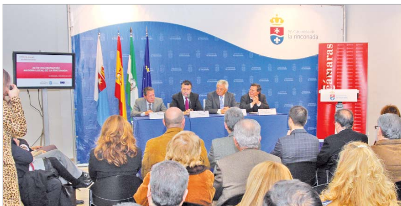
La Cámara cuenta entre sus activos con la cercanía a las empresas para que sean cada día más fuertes y competitivas.

La nueva oficina de la Cámara de Comercio en La Rinconada pone a disposición del tejido empresarial información y asesoramiento para mejorar la competitividad y fortaleza de sus negocios