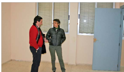
La remodelación del centro se centra en trabajos de albañilería y pintura.

Para ello, desde el área de Vía Pública se acometen las últimas reformas del edificio "con el fin de que su nueva distribución y adecuamiento sirvan para que los