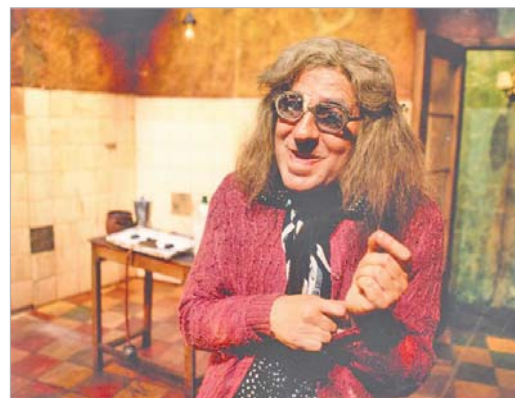
'Taí Viginia' es una historia de la vejez, de la soledad y de la locura.