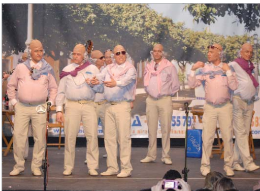
La chirigota de los Surferos, Las Viagras Glorias, ganó el año pasado.

El incremento de chirigotas y comparsas de toda la provincia permite ampliar el concurso un día más, con lo que la fiesta contará con cuatro preliminares, dos semifinales y la gran final