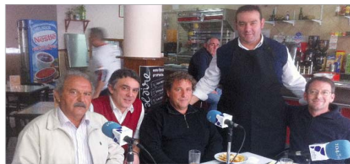
Una representación de la directiva del San José, en el Bar El Mexi.