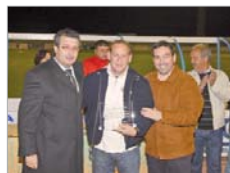
Diferentes entregas de premios y foto de familia de los participantes.