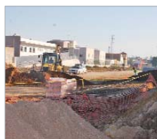
La segunda fase del Almonazar.

Skate Plaza, la primera fase de Pago de Enmedio, la Biblioteca de