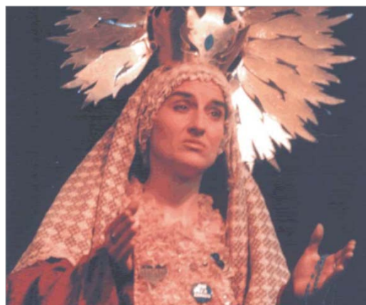
'Estrella sublime' es una obra que trata la tradición iconográfica mariana.