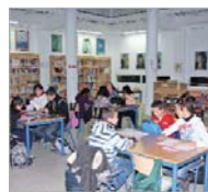
Habrà un nuevo colegio.

En materia de Educación, se conservan las becas escolares, universitarias, ayudas a las enti-