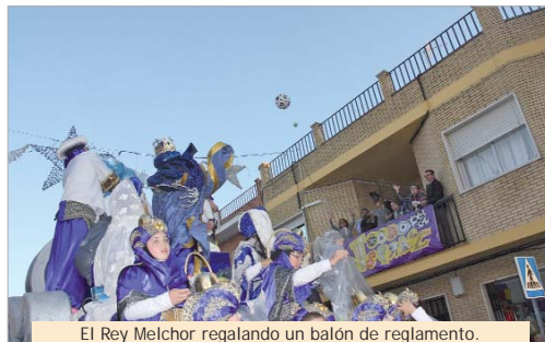
El Rey Melchor regalando un balón de reglamento.