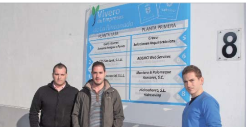
La empresa ya ha captado clientes de Madrid y Barcelona.