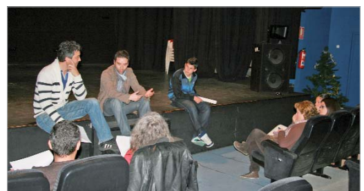
Los actores durante los ensayos en el Centro Cultural Antonio Gala.