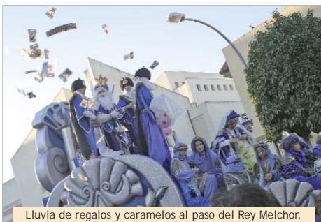
Lluvia de regalos y caramelos al paso del Rey Melchor.