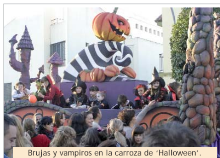
Brujas y vampiros en la carroza de 'Halloween'.