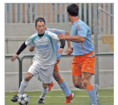
La Cañamera no debe confiarse.

Puede ser uno de los equipos más fuertes con todos sus efectivos, pero las numerosas y reiteradas ausencias de algunos de sus puntales le están lastrando hasta acercarlo al descenso. En Pilas, los cañameros cayeron por 3-2.