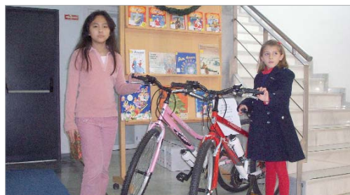
Las ganadoras han recibido un lote de libros y una bicicleta.

Cada año aumenta el número de participantes, siendo los colegios de la localidad los que más dibujos presentan. Los trabajos que se han recogido muestran una festividad tradicional con belenes, estrella de oriente, camellos o Reyes Magos.