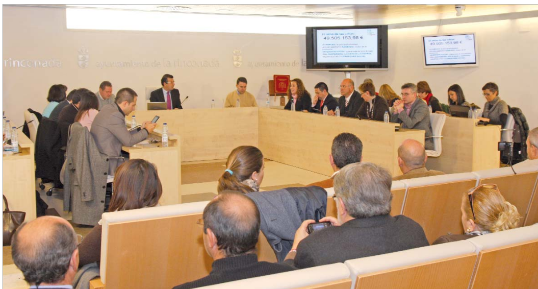
Imagen del Pleno Extraordinario celebrado en La Rinconada en el que se aprobaron las cuentas municipales con los votos a favor del Grupo Socialista.

Las cuentas generales rozan los 50 millones después de una legislatura en la que se han construido más de 70 nuevas dotaciones, fruto de la labor conjunta de todas las Administraciones públicas. El empleo, la formación, las políticas sociales y la educación, son las prioridades de este nuevo año y se llevarán a cabo tanto con fondos municipales como con recursos captados