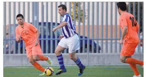
A pesar de que en su último desplazamiento se impuso al Salteras por 1-3, los veteranos se han dejado el liderato en casa, tras caer en sus últimos tres partidos. El último, ante el Vistahermosa (1-3).