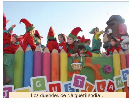
Los duendes de 'Juguilandia'.