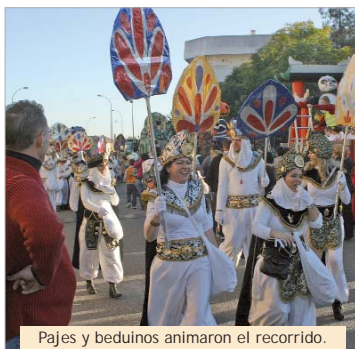
Pajes y beduinos animaron el recorrido.