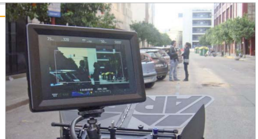
Imágenes del rodaje del corto en exteriores.