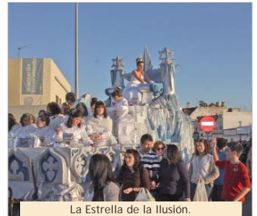
La Estrella de la Ilusión.