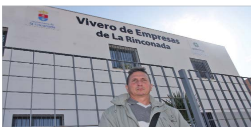
La empresa tiene obras en Pilas, Palomares o Sevilla capital.