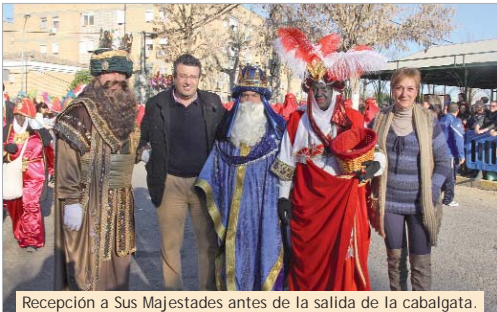
Recepción a Sus Majestades antes de la salida de la cabalgata.