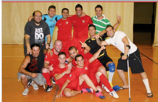
La plantilla de la Peña Sevillista, vigente campeón de la Liga Local.