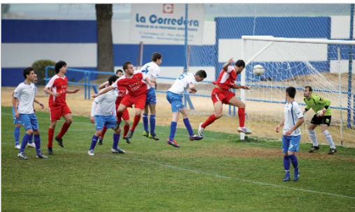
Aún con ocasiones como ésta, los cañameros no pudieron ganar en Arahál.

Cuesta creer que como estaban las cosas hace siete partidos, con el San José luchando por meterse en el grupo de cabeza, la situa-