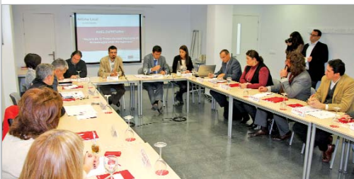
A la reunión asistieron representantes del Observatorio Económico de La Rinconada.

bal de las empresas del municipio, debatieron acerca de algunos de los problemas con los que se enfrentan a la hora de optimizar la productividad y propusieron medidas para mejorar la organización y la gestión dentro de la empresa, fomentando iniciativas formativas para los empleados o elaborando métodos para medir la capacidad productiva.