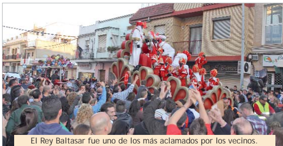
El Rey Baltasar fue uno de los más aclamados por los vecinos.