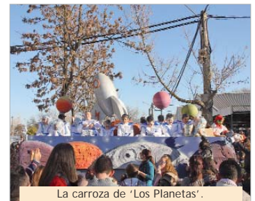
La carroza de 'Los Planetas'.