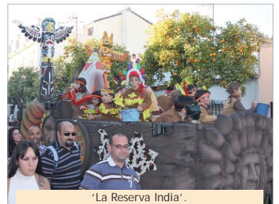
'La Reserva India'.