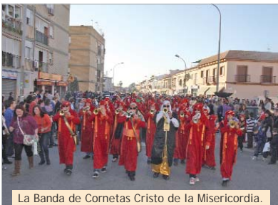
La Banda de Cornetas Cristo de la Misericordia.