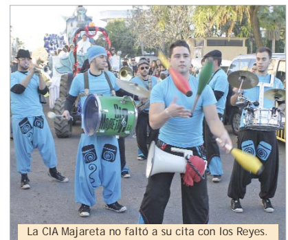
La CIA Majareta no faltó a su cita con los Reyes.