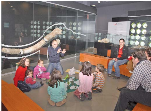
Los menores escucharon atentamente las explicaciones.

lúdico, tanto niños como mayores descubrieron qué estaba pasando hace 100.000 años junto al río Guadalquivir.