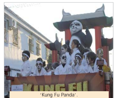
'Kung Fu Panda'.