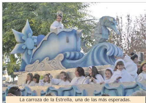
La carroza de la Estrella, una de las más esperadas.