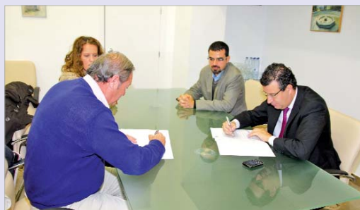
El municipio cederá a la organización un local en la Cámara Agraria.