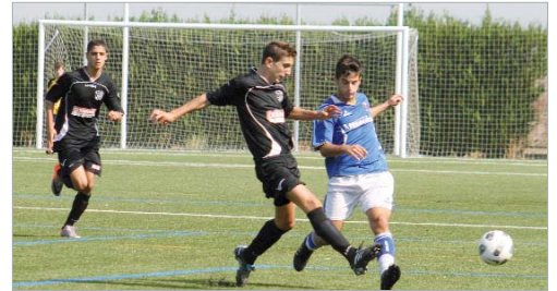
El juvenil cañamero sigue en zona de ascenso a División de Honor, a pesar de jugar en cuadro cada partido, debido a las necesidades del primer equipo. En el último choque, goleó al Don Bosco (1-5).