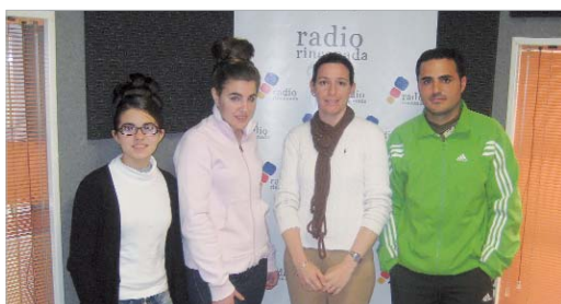
Por la mañana, Sus Majestades hicieron una primera parada en el 104.7.

Radio Rinconada ha llevado a todos los hogares la retransmisión en directo de las Cabalgatas de Reyes. Así, a través de un programa especial, puso voz a los auténticos protagonistas, como son los niños y niñas que, bien subidos en