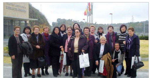
El grupo de abuelas cuidadoras de La Rinconada el día de la clausura.