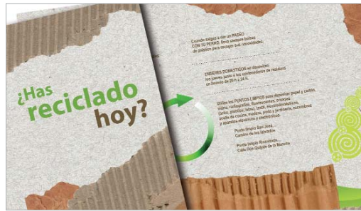
La campaña aboga por el reciclado en origen para cuidar el entorno.

La campaña se centra en cuatro aspectos principales vinculados a la gestión de los residuos, comenzando por la necesidad de reciclar en origen antes de sacar la basura entre las 20.00 horas y las 24.00 horas para depositarla en los contenedores correspondientes: amarillo para envases, azul para papel y cartón, verde para vidrio y el tradicional para restos orgánicos. También se recuerda a los vecinos la obligatoriedad de recoger los excrementos caninos de la vía pública y de