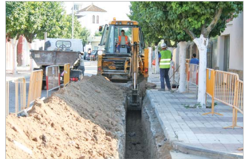
El empleo es el principal problema que ocupa al Ayuntamiento.

Otra de las líneas de acción está vinculada a la labor conjunta de Soderinsa Veintiuno y la nueva delegación de Agroindustria y Comercio, con tres ejes de actuación como son la Mesa del Comercio Local, que coordina las líneas de apoyo al sector, campañas de apoyo al comercio local y seguimiento y fidelización comercial.