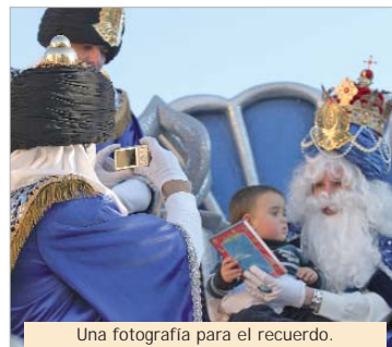
Una fotografía para el recuerdo.