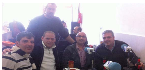
Los responsables de la directiva del Rinconada, en el bar Akí estamos.

nuestros micrófonos están preparados para escucharte