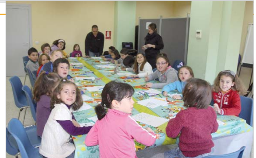
Los chavales han participado en talleres de fieltro, cocina o tarjetas navideñas.

Los jóvenes han participado en diferentes actividades como gymkhanas al aire libre, utilizando las zonas colindantes al centro del Paseo del Almonazar, talleres de manualidades, cocina, fieltro o tarjetas navideñas, visionado de películas en el salón