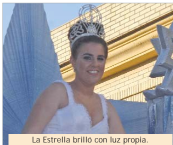
La Estrella brilló con luz propia.