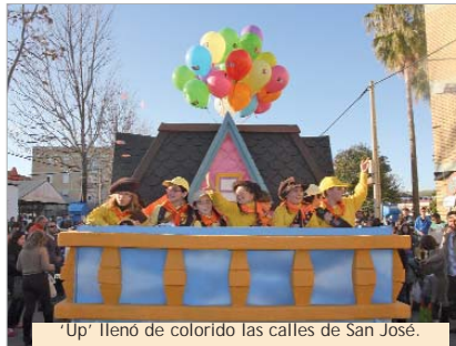
'Up' lleno de colorido las calles de San José.