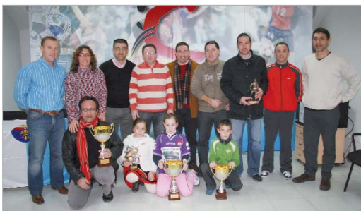
Foto de familia con todos los galardonados en la última edición.

El salón de actos de la Piscina Cubierta fue el escenario de la entrega de los premios de la V edición de la Liga de Fútbol 7, que se ha disputado desde el pasado mes de septiembre y que ha reunido a algunas de las vie-