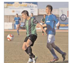
Ante El Coronil empató a dos.

El San José de Liga Nacional sigue en zona de ascenso. No obstante, los cañameros, no pasaron del empate ante El Coronil en casa y perdieron frente al Unión 70, lo que ha provocado que las rentas se estrechen y crezca la igualdad.