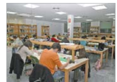
Biblioteca de San José.

"Las bibliotecas municipales no sólo son usadas para hacer uso de sus fondos bibliográficos, sino que ofrecen a los ciudadanos múltiples opciones que las hacen ser un ente vivo y repleto de actividades", como señala la delegada de Cultura, Nadia Gallardo. El programa 'Estudio Abierto' se divide en tres bloques correspondientes a los distintos periodos de exámenes. El primer bloque coincide con el mes de septiembre, el segundo