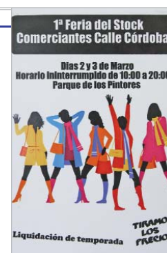
La feria será el 2 y 3 de marzo.

actividades puestas en marcha por la asociación como el Mercadillo Navideño, así como a nuevas ideas en las que ya están trabajando para los meses de verano.