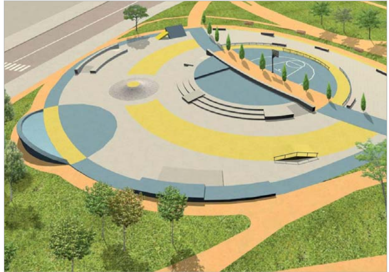
Imagen virtual del futuro Skate Plaza.

El circuito contará con un área de suelo con bancos de piedra y barandillas, una zona de gradas con