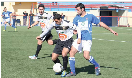
Enma trata de arrebatar un balón a un futbolista del Brenes.

El San José sigue atravesando un mal momento de resultados que, no obstante, no se ha traducido en problemas en la clasificación,