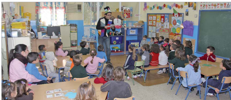
Los alumnos más jóvenes conocen las herramientas que conforman la biblioteca.

menores en qué consiste y qué servicios tiene la biblioteca. También se presenta una muestra de los libros que pueden encontrar poniendo como ejemplos libros curiosos y raros, libros gigantes, minilibros, libros con pop-ups, de pestañas, libros inclinados, libros con música, libros sin letras o libros-pelucho. Posteriormente se narra la historia de 'León de Biblioteca' de la obra de M. Knudsen del mismo título.