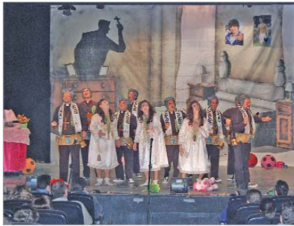
Segundo premio chirigota: 'El padre Carrasco'.