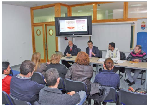
Reunión de la Mesa del Comercio.

pidió incorporar a la misma a los consumidores como parte esencial para su buen funcionamiento y para afinar al máximo en cada una de las iniciativas, "la Mesa del Comercio Local nació con la idea de acometer políticas concretas que permitan mejorar la venta y el buen funcionamiento de los diferentes establecimientos, y éste es un buen ejemplo de ello".