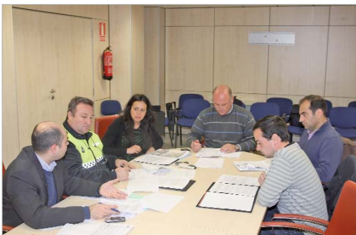
El edil de Medio Ambiente se reunió con ciudadanos y colectivos.

La nueva ordenanza de circulación de peatones y ciclistas se aprueba en sesión plenaria