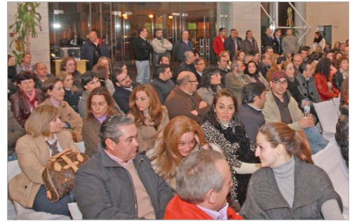
Un nutrido grupo de comerciantes locales acudió a la presentación.