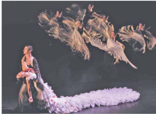
Espectáculo de danza 'Bolero'.