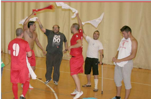
La Peña Sevillista, vigente campeón, vuelve a liderar la División de Honor.