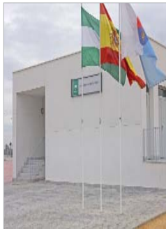
Colegio Blanca de los Ríos.

Para acometer estos trabajos, se ha destinado un presupuesto de 999.990,92 euros y un plazo de ejecución de ocho meses. "Durante las actuaciones, se