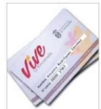
Tarjeta Vive La Rinconada.

las distintas propuestas comerciales de cada uno de los clientes se transmitirá a través de las redes sociales. Como destaca Miguel Alemany, "una empresa a la que no se puede acceder por