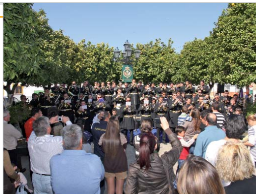
La Plaza de España acogió el tercer certamen de bandas de la Salud.

Padre Jesús Nazareno de La Algaba y la Banda de Música Amueci de Écija. Además, los más pequeños tuvieron la oportunidad de participar en un taller cofrade organizado por el Ampa Pluma y Papel del colegio