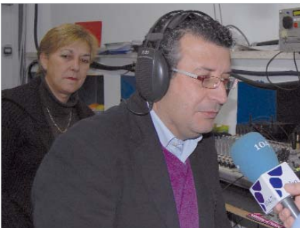
El alcalde visitó la unidad móvil de Radio Rinconada.