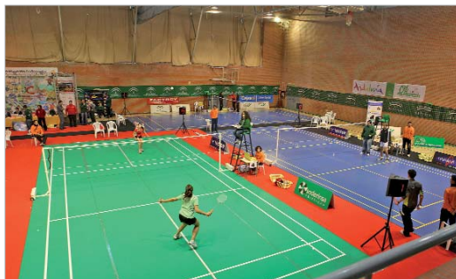
El Fernando Martín fue el escenario del II Internacional Sub 19.