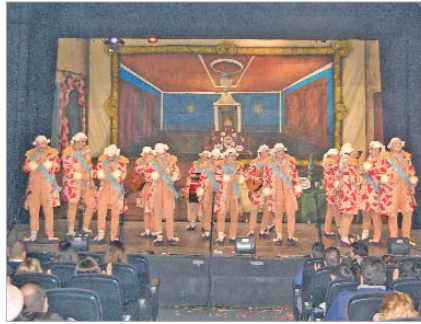
Segundo premio comparsa: 'Marqués de Pacotilla'.