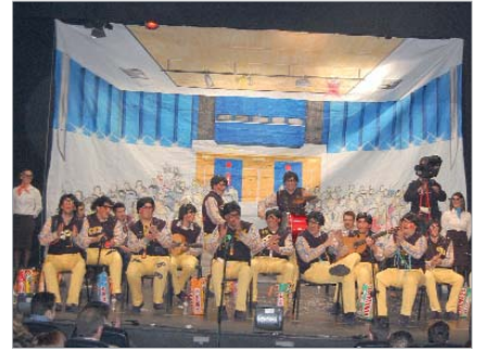
Tercer premio chirigota: 'Qué fácil se ve todo desde aquí'.