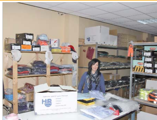
"Trabajamos con seriedad y responsabilidad para atender los pedidos".