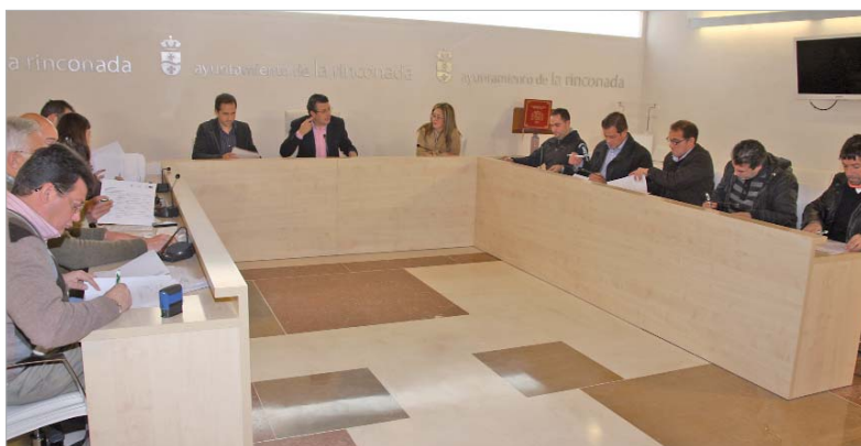
El alcalde y el delegado de Desarrollo Económico durante la firma de convenios con los empresarios.

En total se entregan más de 1,2 millones de euros para proyectos empresariales de creación, ampliación y modernización de empresas