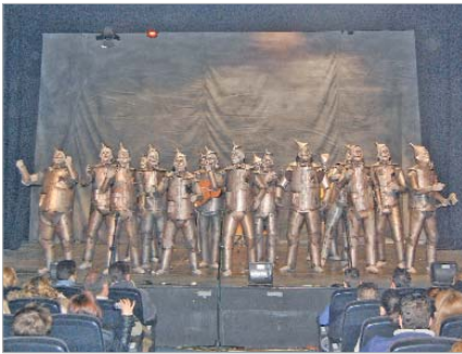
Primer premio comparsa: 'Metales'.

año se ha ido más allá con la celebración del I Certamen Infantil, que tuvo lugar en el Antonio Gala durante dos días, y que permitió comprobar la buena salud que tiene el Carnaval en el municipio y lo fuerte que empujan quienes llegan desde la cantera.