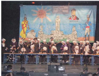
'Los cortos de cai' del concurso infantil de agrupaciones.