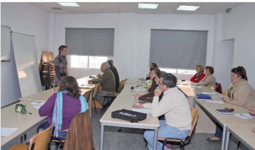
La edil de Participación Ciudadana dio la bienvenida al curso.

Las asociaciones aprenden a realizar las justificaciones de las subvenciones que reciben para sus proyectos