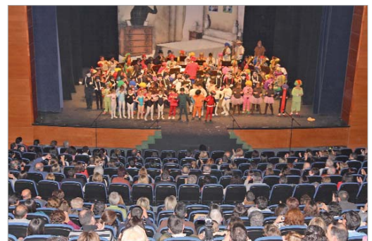
Los niños de la Escuela de Música participaron en el concierto.

Bajo el título de 'Carnavalitis Musicalis II: El Circo', la banda municipal, acompañada por los alumnos de la Escuela de Música Cristo del Perdón, ofreció un divertido espectáculo para toda la familia