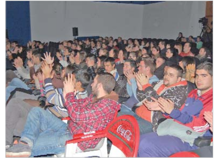
El público asistente vibró con cada una de las actuaciones.