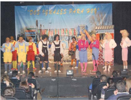
Primer premio chirigota: 'Dos iguales para hoy'.