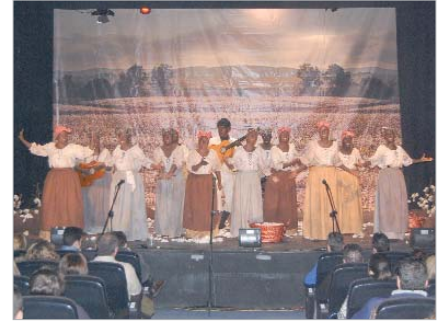
Tercer premio comparsa: 'Entre algodones'.