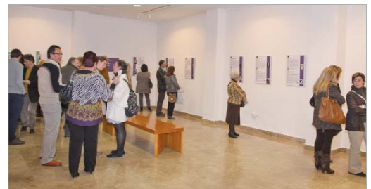
Un público numeroso se dio cita en el primer día de la muestra.

textualizan esta etapa histórica, haciendo énfasis en las políticas de igualdad; la segunda 'Mujeres en la vanguardia' en la que los alumnos han seleccionado a 40 mujeres de los dos bandos que se enfrentaron en la guerra civil y que destacaron en múltiples campos, como Clara Campoamor o Victoria Kent, entre otras. Una tercera parte titulada