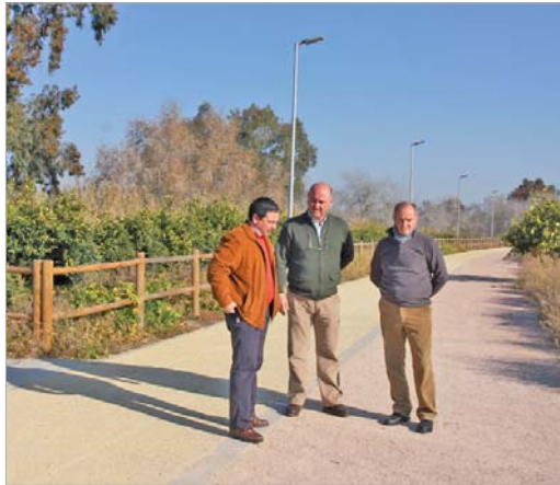
Los ediles de Urbanismo y Vía Pública visitan el estado de las obras.

En estos momentos y hasta finales de junio, se ejecuta la construcción de los caminos principales en los 45.000 metros cuadra-