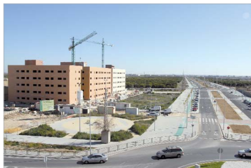
La avenida de La Unión dispone de zonas verdes y de paseo para los vecinos.

Asimismo se trata de un proyecto sostenible con tan sólo 33 viviendas por hectáreas, por