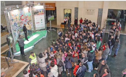
Numerosos vecinos y colegiales reciben la Copa del Mundo.

La Villa acoge el trofeo de 'La Roja' al que acuden numerosos vecinos futboleros