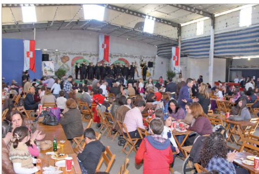
Seis bandas de música participaron en el festival.

El colegio San José organizó un certamen benéfico de bandas en la caseta municipal del recinto ferial de San José. Esta actividad se suma a las distintas acciones emprendi-