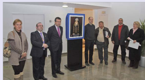
El alcalde y la edil de Fiestas Mayores con representantes de las hermandades.

Rinconada, Ramón Muñoz, la delegada de Fiestas Mayores, Pilar Escudero, y el alcalde, Javier Fernández, quien destacó las buenas relaciones que mantienen el Consistorio y las hermandades y abogó por seguir trabajando conjuntamente para fortalecerlas.