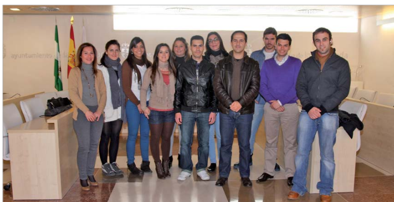
Los once alumnos hacen las prácticas en las diferentes áreas de Igualdad, Juventud o Vía Pública, entre otras.

Un total de once universitarios y alumnos de ciclos formativos de grado superior disfrutaron de becas formativas en diferentes áreas municipales