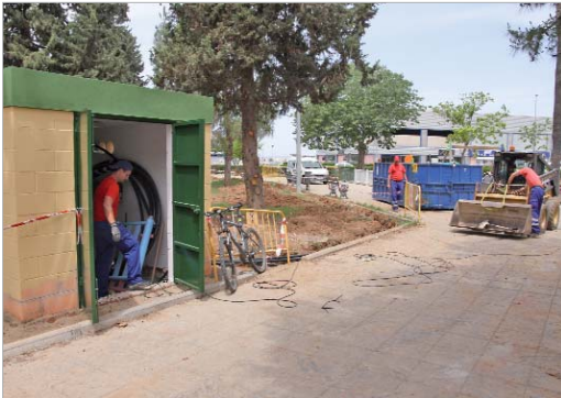
El parque Valle Inclán cuenta con una nueva caseta de bombeo.

El área de Vía Pública ejecuta varias actuaciones para regenerar y modernizar las zonas verdes de la localidad