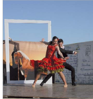
La Calabaza Danza Teatro.