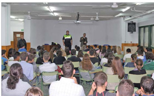
El edil de Seguridad Ciudadana estuvo presente en una de las charlas.

Los estudiantes conocen sus derechos y obligaciones como conductores, ciclistas o peatones