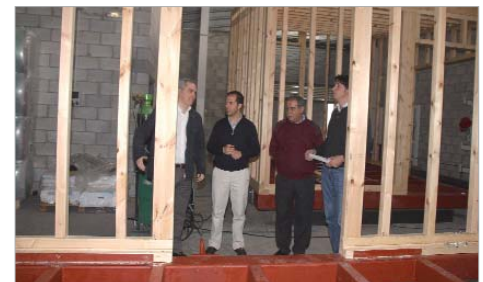
El delegado de Desarrollo Local charla con los responsables del proyecto.

"Ahora comenzará el revestimiento de la estructura, a cargo del equipo de Andalucía Team, pero parte de La Rinconada, además de ceder el espacio de ensamblaje, estará en la casa inteligente de Andalucía Team cuando participe en Solar Decathlon".