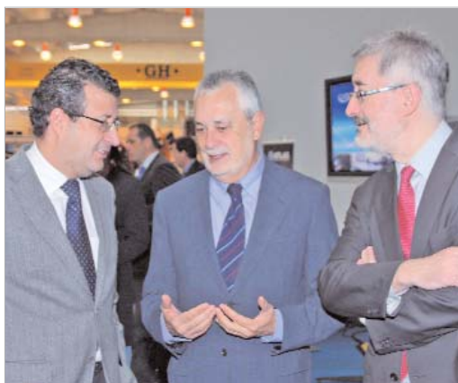
El alcalde, el presidente de la Junta y el consejero de Innovación en Aerópolis.

El Centro de Empresas de Aerópolis fue el escenario de la primera jornada de este encuentro, que contó con una conferencia magistral del astronauta espa-