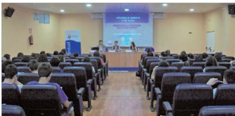
Las jornadas ofrecen a los estudiantes un asesoramiento integral para elegir su futuro recorrido profesional.

Alumnos del instituto Antonio de Ulloa reciben información sobre los distintos itinerarios formativos a su alcance para completar sus estudios