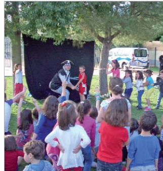
La biblioteca de San José.