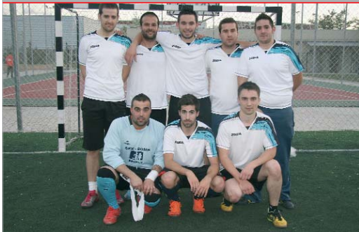
El Atlético Rinconada acecha a los dos primeros clasificados de Primera.