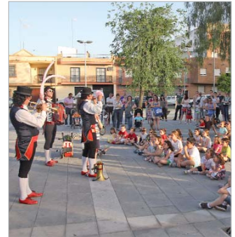
Compañía Maravilla Teatro y Música.