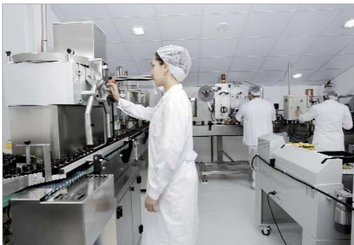
Imagen de las instalaciones de la empresa en el municipio.

Laboratorios BIO-DIS trabaja actualmente para su expansión en el mercado internacional y en los próximos años prevé llegar al mercado asiático, concretamente a países como Corea, Malasia y Singapur.