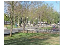
Parque Dehesa Boyal.

drán la oportunidad de disfrutar y aprender a través de este espectáculo