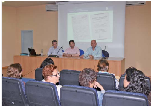
Los ediles de Comunicación, Medio Ambiente y Vía Pública en la presentación.

tas para que respeten y mantengan limpia la escena urbana", al mismo tiempo que "informamos a los vecinos de las ordenanzas