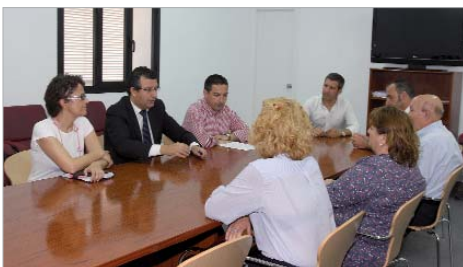
El alcalde se reunió con las asociaciones ubicadas en la Cámara Agraria.

Asimismo, el que fuera antiguo centro ocupacional de Torrepavas se ofrece a seis colectivos del municipio. El edificio, que albergaba los talleres del Patronato de Personas con Discapacidad, tiene una superficie de 685 metros cuadrados y ha sido remodelado con el fin de que su nueva distribución y adecuamiento sirvan para que desarrollen sus trabajos las asociaciones.