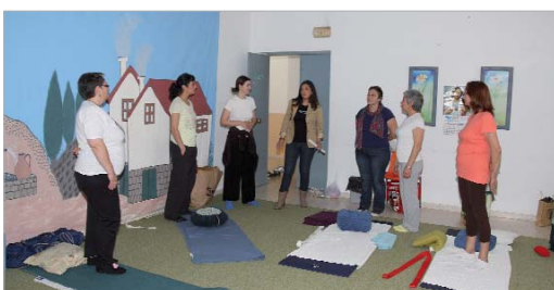
La delegada de Igualdad visitó el taller de Yoga.