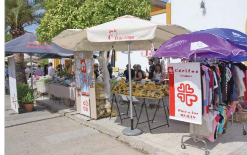
Los exteriores de la iglesia de San José acogieron el mercadillo.