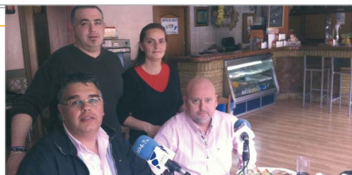
La prensa deportiva local, objeto de debate en Mesón Casa María.