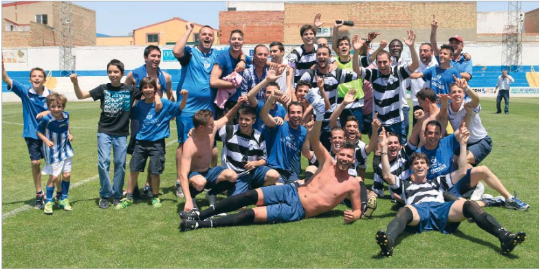
La plantilla rinconera, acompañada por algunos de los aficionados que se desplazaron a Pílas, celebran el ascenso.