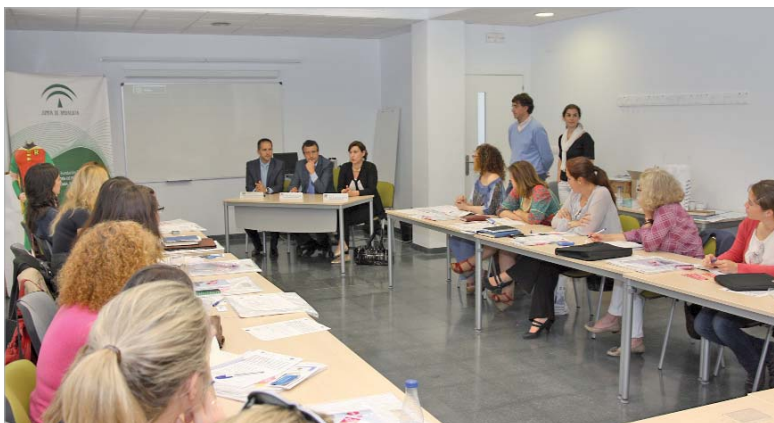
El alcalde, Javier Fernández, destacó la importancia de la cooperación empresarial.

participantes intercambiaron información sobre sus empresas y compartieron experiencias para contribuir a generar nuevas oportunidades de negocio, abordar proyectos de mayor envergadura, mejorar la comercialización