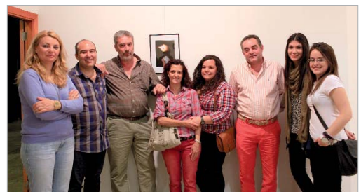
La sala de exposiciones acoge la muestra del concurso de fotografías.