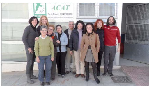
La programación se desarrollará en los próximos meses.

A través de las actividades darán a conocer la labor social que este colectivo viene realizando todos estos años