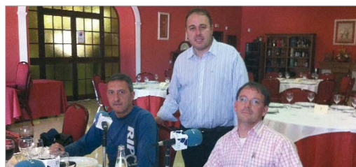
El San José analizó la campaña en el Hotel Restaurante Los Arcos.