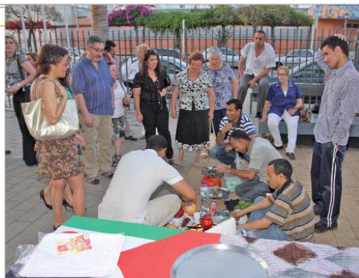
La asociación ofreció una degustación de productos saharauis.

El dinero recaudado de las entradas se destinará al programa 'Vacaciones en Paz', que cada