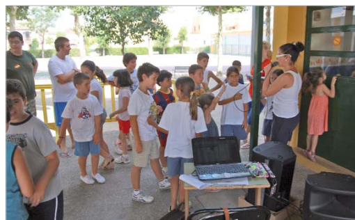
Los jóvenes realizan actividades por las mañanas.

Por segundo año consecutivo, el colegio Júpiter abrirá sus puertas desde el 26 de junio hasta el 27 de julio en horario de 08.30 a 14.45 horas para recibir a los jóvenes y monitores que, a lo largo de cinco semanas, participarán en diversas actividades como talleres, excursiones, manualidades, juegos o