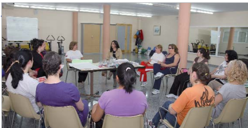
El taller de Crecimiento Personal se desarrolla en el 'Pablo Picasso'.

Además, el centro también ofrece módulos de informática básica y ofimática que favorecen su iniciación en el manejo de los ordenadores y las acercan al mundo de las nuevas tecnologías.