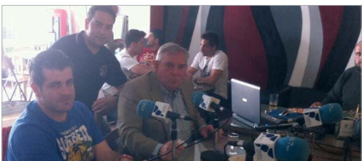
El San José Fútbol Sala celebró el ascenso en Tapeando Sí o Sí.

El programa Tertulia Deportiva, uno de los más reconocidos de la radio pública local, ha comenzado la etapa de análisis y reconocimiento de la presente temporada, una vez los equipos locales han comenzado a concluir sus respectivos ejercicios