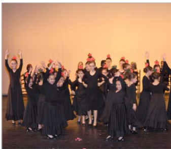
Aula de Danza.

Las aulas de guitarra flamenca y de danza fueron los protagonistas de la segunda jornada con la puesta en escena de soles y bulerías. Finalmente, los talleres de teatro y de fotografía pusieron sobre el escenario piezas teatrales y proyecciones de las mejores instantáneas.