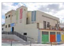
Centro Joven 'La Estación'.

Así nace el nuevo programa 'Verano joven activo', dirigido a adolescentes con edades comprendidas entre los 12 y los 17 años para cultivar su formación en valores como el compañerismo, la convivencia o el respeto, al tiempo que les ofrece la posibilidad de divertirse y crear lazos de unión entre ellos participando en juegos, gymkhanas, excursiones,