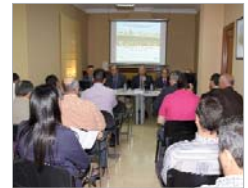
Diez en la apertura de la jornada.