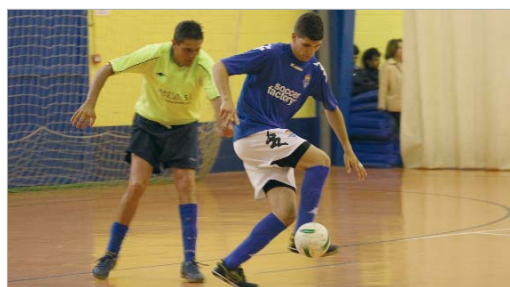
El Tres Calles lo intentó todo para lograr ascender, pero no pudo ser.