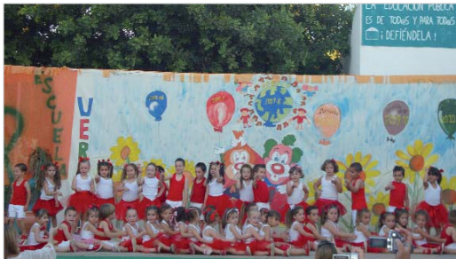
Los alumnos más pequeños del colegio Los Azahares en La Rinconada deleitaron a los presentes con un divertido baile. Para las familias, el AMPA instaló un ambigü.