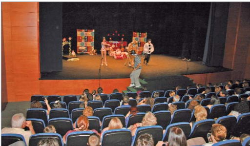
La Villa acogió el cierre del cuentacuentos de San José.

Por otro lado, la biblioteca de La Rinconada celebró su fin de curso en las tablas del Antonio Gala. En esta fiesta, los bibliotecarios explicaron a los asistentes los cuentos que se han trabajado y además, se les habló de la nueva biblioteca de La Rinconada, que contará con una zona infantil y sala de usos múltiples para seguir realizando la actividad. Los niños recitaron los trabalenguas aprendidos durante el curso, una poesía y cantaron dos canciones acompañados por la guitarra. A los padres se les entregó una memoria con todo lo trabajado y se les emplazó hasta el próximo mes de octubre en el que volverá la actividad.