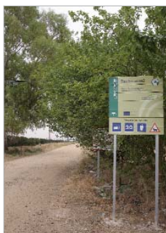
Camino de Alcalá.