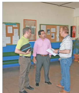
Marín y Campos con el director del Júpiter.

existentes, vigilando que las dotaciones y servicios estén en óptimas condiciones para que los docentes puedan llevar a cabo su