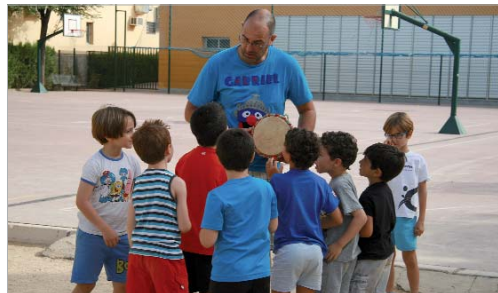
Una de las actividades durante el primer día del Campamento Urbano.

Hasta el 27 de julio, un total de 67 participantes disfrutarán del amplio programa de actividades que se estructura en temática semanal. Así, tratarán temas de cooperación internacional, conocerán países como China, India o el hermanamiento del municipio con Cuba, se meterán en el mundo de la