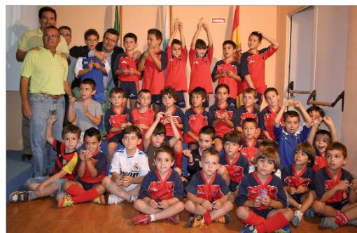
El Centro Joven La Estación acogió los premios del Esfubasa.