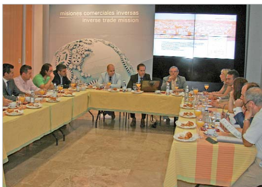
Ayuntamiento y Fundación Glocal presentaron el proyecto a los medios.

La Rinconada Business Meeting Point o La Rinconada BMP, como