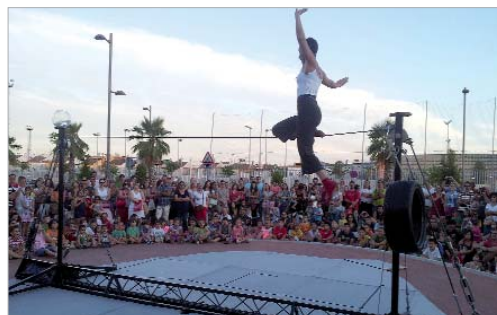
La compañía Corcoles ofreció un espectáculo de funambulismo.

Por tercer año consecutivo, el municipio de La Rinconada ha formado parte de la extensión en la provincia del Festival de Circo de Sevilla, Circada.