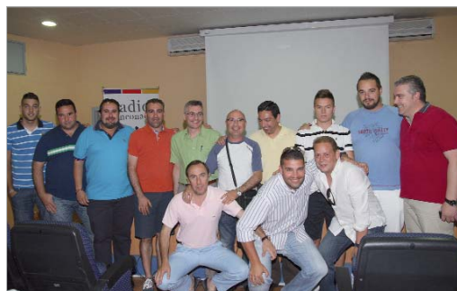
El Rinconada fue reconocido por el ascenso a Preferente del Sénior.

De igual modo, destacó que "cerramos la temporada con deportes y la abriremos de la misma forma, con el V Trofeo Radio Rinconada de fútbol que tendrá lugar en septiembre como prólogo a una temporada en la que habrá deporte, pero también todos los temas que emanen de La Rinconada y que formen parte, de una u otra forma, de la vida de la localidad".