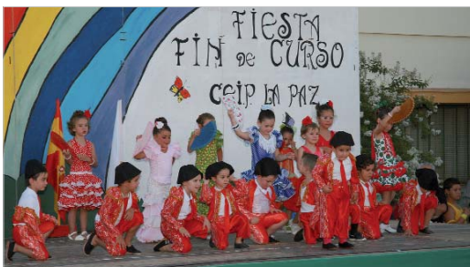
El colegio de La Paz recibió a las familias y les ofreció las funciones que los alumnos habían preparado. En esta imagen los más pequeños se disfrazaron de toreros y flamencas.