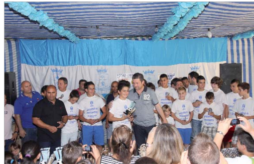
La Caseta del San José en la Jira acogió la entrega de premios.

muestra de agradecimiento y reconocimiento al esfuerzo del futuro del fútbol de La Rinconada, independientemente de que, a nivel deportivo, se hayan cumplido o no los objeti-