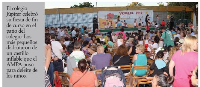
El colegio Júpiter celebró su fiesta de fin de curso en el patio del colegio. Los más pequeños disfrutaron de un castillo inflable que el AMPA puso para deleite de los niños.