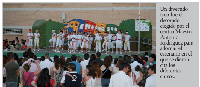
Un divertido tren fue el decorado elegido por el centro Maestro Antonio Rodríguez para adornar el escenario en el que se dieron cita los diferentes cursos.