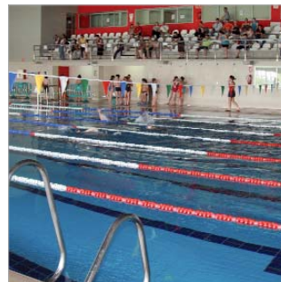
La Piscina Cubierta se engalanó para la cita.

La Rinconada ha celebrado las I Miniolimpiadas en las que han participado un total de 1.500 escolares de la localidad, a los que habría que sumar a los integrantes de las Escuelas Deportivas de Adultos, que también han tomado parte en la modalidad de Aerobithon.