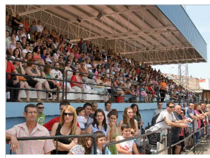
Las gradas del Felipe del Valle registraron un lleno absoluto.