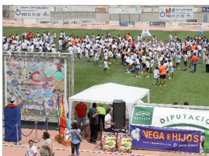
El césped del Felipe del Valle, con los participantes.