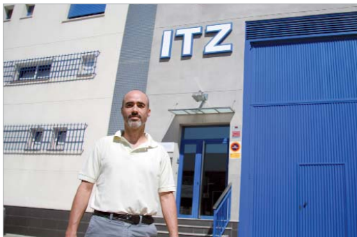
El gerente de ITZ posa en la puerta de su empresa en el Cañamo 2.

"Con una sola llave, un cliente puede abrir desde su casa a su oficina, el apartamento de la playa o el buzón"