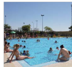
Los vecinos disfrutaban del baño.

12.30 a 18.30 horas, y sábados, domingos y festivos de 11.30 a 19.30 horas, las piscinas de los polideportivos