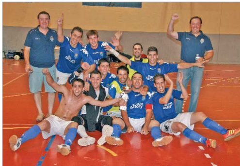
La plantilla posa para TN con el Trofeo de Campeón.