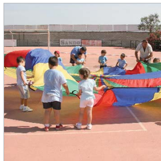
Desarrollo de una de las actividades.