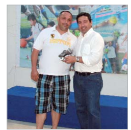
La sala polivalente del Felipe del Valle sirvió de punto de encuentro para la entrega de premios de la Liga Local.