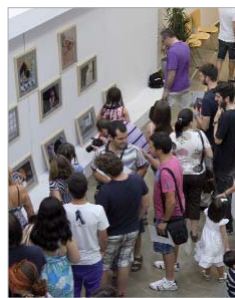
Los asistentes en la exposición.

Entrega los diplomas a los 24 alumnos de esta actividad y colofón con la proyección de las mejores instantáneas en el depósito de agua