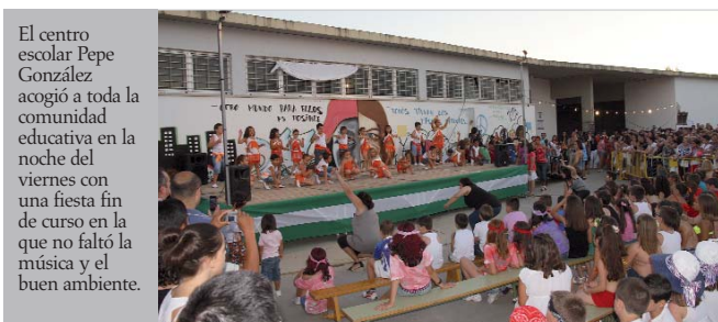
El centro escolar Pepe González acogió a toda la comunidad educativa en la noche del viernes con una fiesta fin de curso en la que no faltó la música y el buen ambiente.