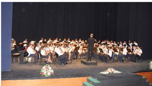
Concierto del Conservatorio Elemental de Música

El municipio dispone de una completa formación musical a través de estos centros