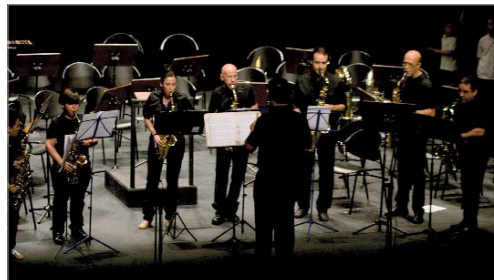
Escuela de Música Cristo del Perdón de La Rinconada.

del Conservatorio, la Escuela Cristo del Perdón y Factoría Creativa, formación que ponemos al alcance de los ciudadanos para que descubran este arte y todos los beneficios que comporta".