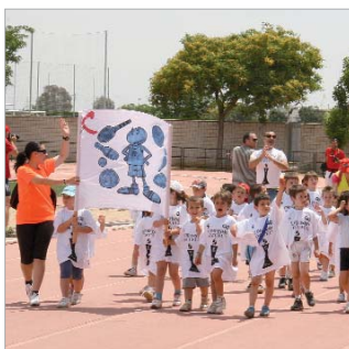
Imagen del desfile inaugural.