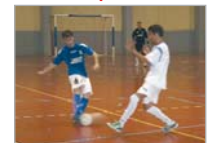
Primeros de Mayo San Juan

La pista donde se disputó la final de la Copa Federación no estuvo a la altura de los contendientes. Los jugadores de ambos equipos se quejaron de sus prestaciones.