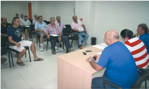
Momento de la asamblea del San José, celebrada en la Piscina Cubierta.