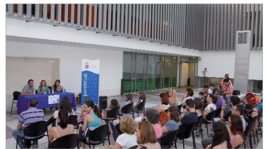
El patio exterior del Ayuntamiento acogió el acto.

Durante la recepción, celebrada en el patio exterior de la nueva fachada del Ayuntamiento, la delegada entregó los certificados de participación en la actividad a los alum-