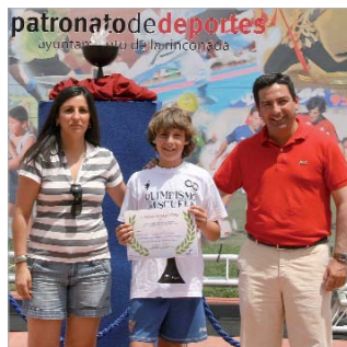
Hubo diploma para todos los participantes.