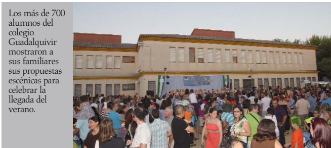
Los más de 700 alumnos del colegio Guadalquivir mostraron a sus familiares sus propuestas escénicas para celebrar la llegada del verano.