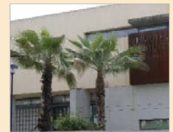
Biblioteca de San José.

ofrece la biblioteca, pretende reforzar el servicio de sala de estudio que actualmente presta el centro a través de la ampliación de su horario habitual. Durante varias semanas, universitarios y opositores, en su mayoría, han disfrutado de un clima adecuado para concentrarse y estudiar