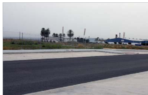
Zona de San José Norte.

Por otra parte, el acuerdo con Primsa conlleva la modificación del proyecto de urbanización de San José Norte, e incluye en la primera fase una manzana que