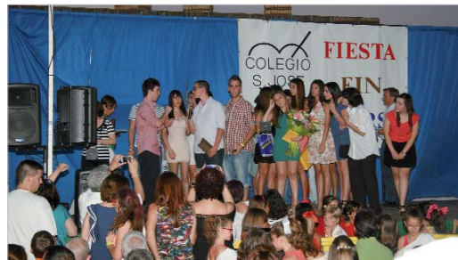
El colegio San José, también conocido como 'Convento', acogió en su patio la fiesta de fin de curso. Algunos alumnos homenajearon a los profesores y le entregaron obsequios.