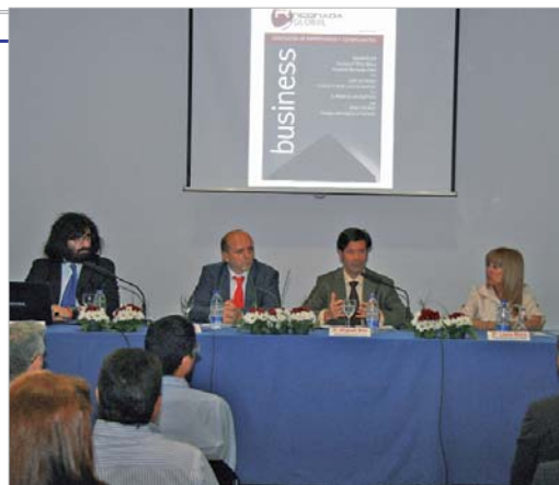
La asociación de empresarios presentó la revista.

La Revista Empresarial Rinconada Glob@l Business Magazine tiene como objetivo potenciar y motivar al tejido empresarial y comercial local mediante la información de las actividades de ésta y sus servicios de asesoramiento fiscal, laboral y jurídico, cursos de formación, coach empresarial, convenios de colaboración con entidades públicas y privadas, inserción de anuncios publicitarios para los asociados, y sobre todo, la concienciación de solidaridad y unión del tejido