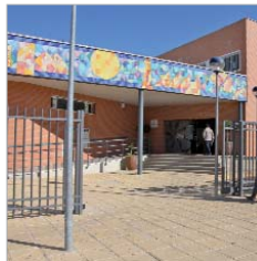
Sede del CADE.

El área de Formación del Ayuntamiento de La Rinconada, en colaboración con el CADE, ha llevado a cabo recientemente una jornada acerca del trabajo autónomo, con el objetivo de dar a conocer las distintas formas jurídicas que existen en el marco normativo legal, las ventajas e inconvenientes de adoptar una determinada forma jurídica u otra, los derechos y obligaciones