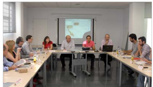
El edil de Desarrollo Económico estuvo presente en el desayuno.