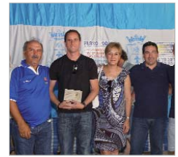
Entrega de premios del San José.

Por su parte, el Rinconada también se decantó en una nueva edición por reunir a su cantera