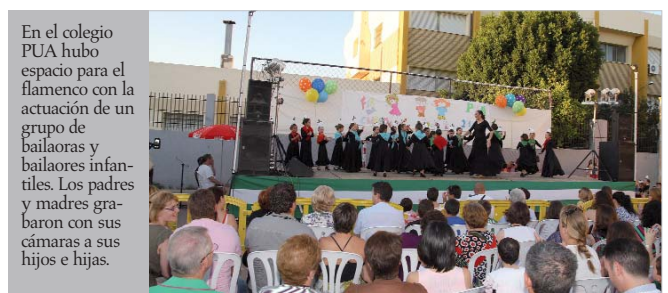
En el colegio PUA hubo espacio para el flamenco con la actuación de un grupo de bailaoras y bailaores infantiles. Los padres y madres grabaron con sus cámaras a sus hijos e hijas.