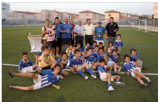
Entrega de premios a la cantera del Rinconada en el Ramos Yerga.

Como suele ser habitual para despedir la temporada, los distintos equipos del balompié local celebraron sus respectivas entregas de premios a los integrantes de sus canteras, como