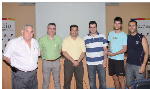
El Club Deportivo San José de fútbol sala, reconocimiento polideportivo.