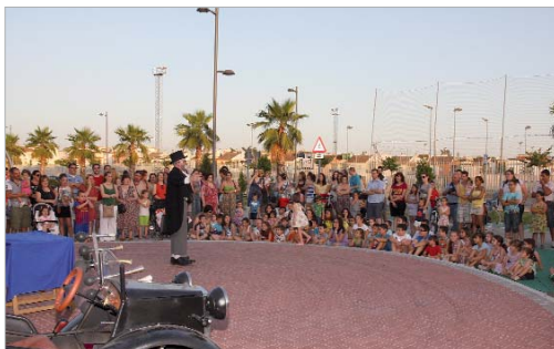
La compañía Oriolo en el Almonazar.