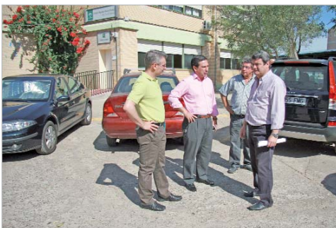
Los ediles de Educación y Vía Pública en el colegio PUA.

Además de la ampliación o modernización de las infraestructuras educativas, el Ayuntamiento también vela por las instalaciones