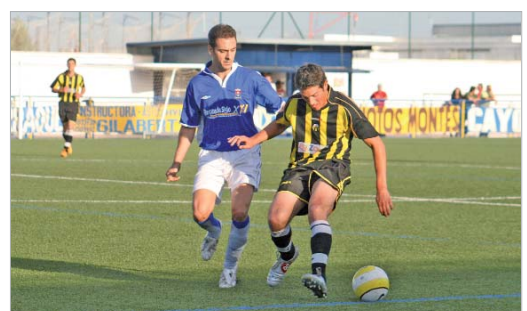
Israel, a la izquierda, luchará por ganar la confianza del técnico.