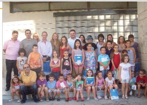
La edil de Cultura entregó los diplomas a los participantes.

ticiparon, así como unos obsequios por parte de la delegación. Asimismo, la librería La Paz, como en otras ocasiones, aportó un lote de cuentos para los más pequeños.