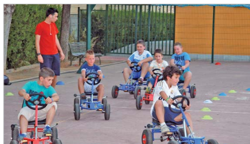
Los chavales disfrutan de múltiples actividades deportivas y de ocio.

Cada viernes, en horario de 21.00 a 00.00 horas, los jóvenes han participado en un amplio abanico de actividades como liguillas de fútbol, play, wii, talleres de manualidades, exhibiciones, gymkhanas deportivas, tiro-