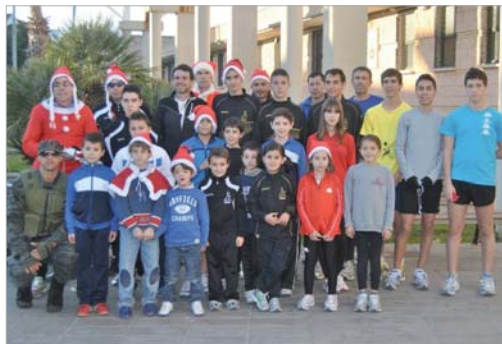
Una nutrida representación del club en día de la San Silvestre.