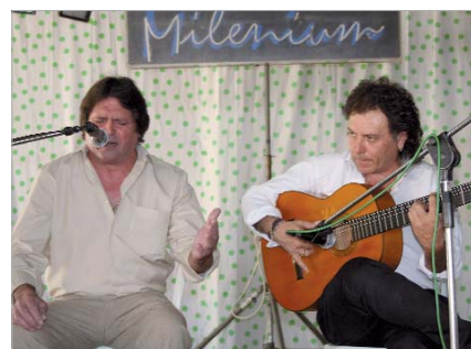
Como cada año, fueron muchos los asistentes al Festival.