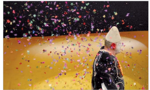
Leo Bassi en su nuevo espectáculo 'Utopía'.

Mientras, la compañía La Rous, Premio Nacional de las Artes Escénicas para la Infancia y la Juventud 2011, emocionará con 'El refugio', la guerra a través de