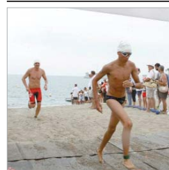
Uno de los nadadores cruza la meta.