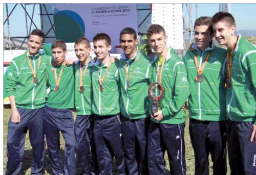
Los resultados del Club Atletismo Rinconada han sido muy positivos.

Al aire libre, el balance es un bronce en los 500 metros lisos.