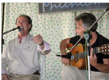
Uno de los instantes del Festival Flamenco en la Municipal.