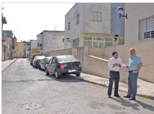
Los ediles de Vía Pública y Urbanismo visitan la calle.

Esto supone resolver un problema histórico de inundaciones y conectará con la red del segundo tramo del Almonazar