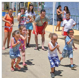
Los juegos infantiles estuvieron presentes.