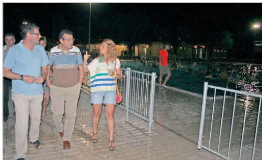
El alcalde y la delegada de Juventud visitaron la clausura de Diversia.

"Los monitores han hecho un trabajo magnífico, demostrando no sólo cualificación para llevar a cabo su actividad, sino implicación para que, cada edición, el resultado vaya siendo más positivo y permita aumentar la satisfacción de los participantes", recaló el primer edil