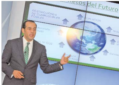
El asesor de Obama destacó la importancia de la sostenibilidad.