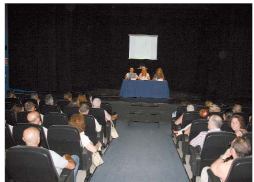
La edil de Cultura acompañó al autor en la presentación del libro.

Así, este trabajo constituye un estudio contrastivo que pone de manifiesto tanto lo real como lo fabulado por los visitantes extranjeros durante su visita a Sevilla.