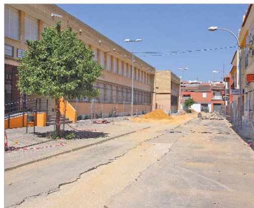
Debido a la ubicación del instituto, las obras han comenzado en verano.

La ejecución de las obras tiene una duración de un mes, de modo que para finales de julio estarán finalizadas. El presupuesto de la misma es de 58.510 euros a cargo de Emasesa.