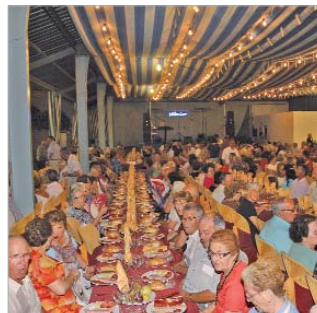
Los pensionistas llenaron la Municipal.