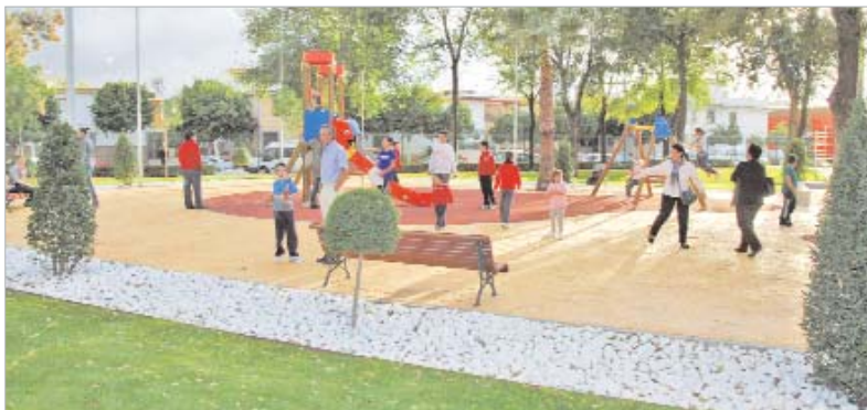
El parque Félix Rodríguez de la Fuente tiene zonas verdes que reciben más cuidado en verano.