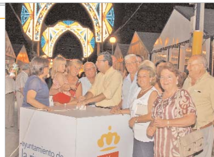
Encendido oficial del alumbrado.

Unas 300 personas de los Centros de Día se reúnen en la caseta municipal para la recepción del Ayuntamiento a los mayores