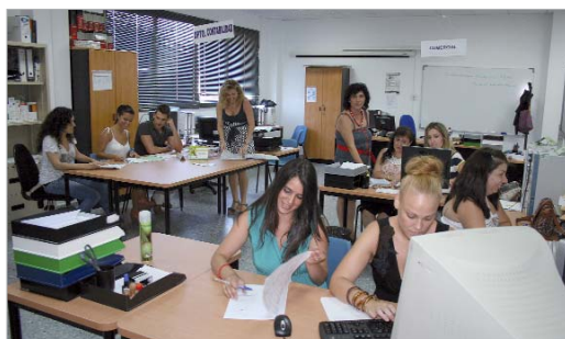
Imagen del aula donde se desarrolla el programa a pleno rendimiento.

Se espera que la inserción laboral alcance el 70 por ciento una vez terminado el proyecto