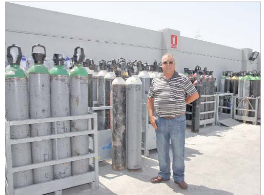
La empresa distribuye gases medicinales a los centros de salud.

palmente a la distribución de gases comprimidos destinado a clientes de la provincia de Sevilla básicamente, "este servicio hace llegar al cliente los gases que necesita para su actividad, ya sean gases destinados a soldadura, medicinales, o alimentación. Para ello, disponemos de una red de depositarios en toda la provincia. Además, somos distribuidores oficiales de ABELLÓ-LINDE, una de las principales marcas de gases del mercado", explica.