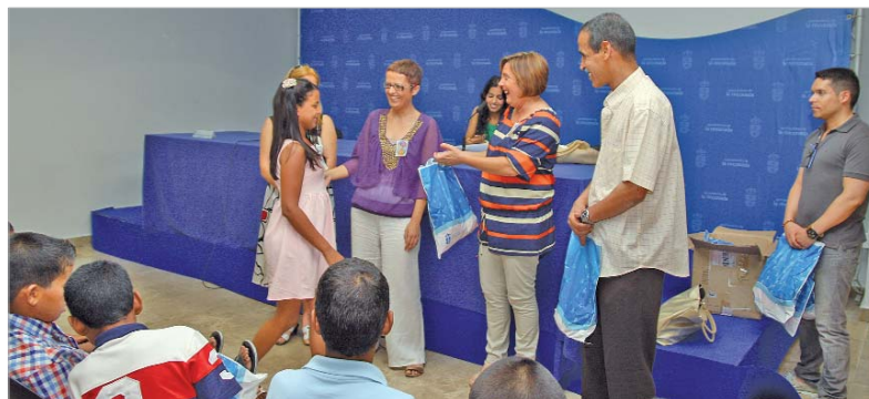
La edil de Cooperación recibió a los niños y niñas saharauis en La Villa.

los campamentos de refugiados del Sáhara pasen dos meses en el muni-