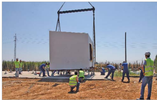
La casa inteligente fue sacada por el techo de la nave.

talaciones y la estructura realizada por los alumnos de su escuela taller, sino que, gracias a su apoyo, otras empresas públicas y privadas se han involucrado en este proyecto, posibilitando que pueda salir adelante". Por su parte Expósito felicitó a los integrantes de Andalucía Team por el trabajo realizado y animó a poner en práctica sus avances en viviendas reales. "Deseamos sumar sinergias para poner en práctica los avances que habéis conseguido y lograr con ello una mejor gestión de la energía que derive en un abaratamiento de los costes y que incida en el crecimiento de la vivienda protegida al alcance de todos". Por último, Expósito les deseó "toda la suerte del mundo" para la final del Solar Decathlon, que tendrá lugar en Madrid.