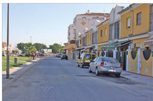
La calle Pilar Miró en el núcleo de La Rinconada.