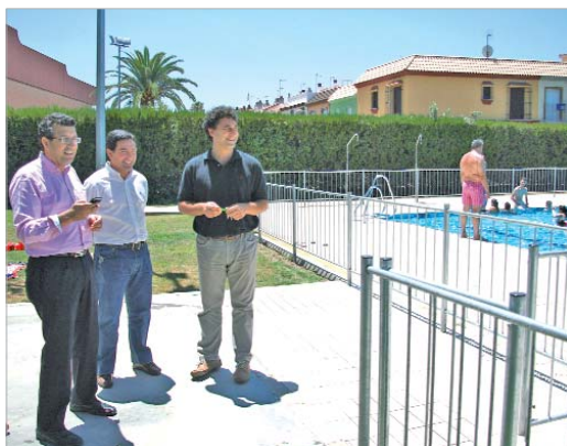
El alcalde y el edil de Deportes visitaron las piscinas al aire libre.

De este modo, de lunes a viernes de 12.30 a 18.30 horas, y sábados, domingos y festivos de 11.30 a 19.30 horas, las piscinas de los polideportivos municipales Francisco Sánchez 'Castañita'