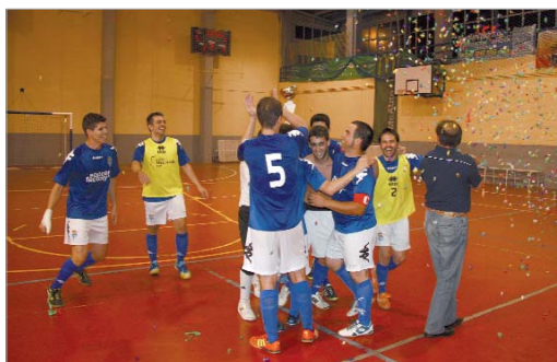
El Tres Calles no sólo ha ganado la Copa Federación, sino que ha ascendido.