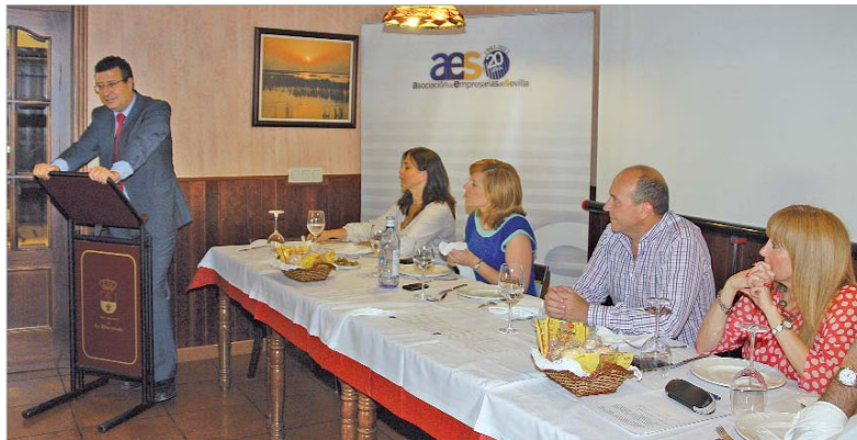
El primer edil ofreció su apoyo y reconoció el trabajo de la asociación.

Durante el turno de intervenciones, el primer edil del Consistorio rinconero ofreció su apoyo al empresariado femenino local, reco-