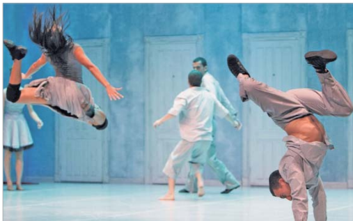
La compañía Teatro del Velador-Chinabaus.