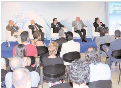
Los tres ponentes en la sala de exposiciones de La Villa.

Los ponentes destacaron su interés por la inversión con empresarios locales