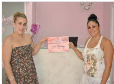
Campaña 'Mis uñas molan más que las tuyas'.