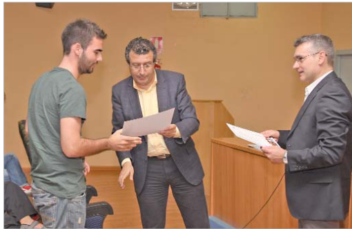
Entrega de las becas universitarias del pasado curso lectivo.