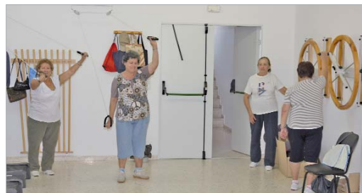
Los participantes de los cursos disfrutaron de las múltiples ofertas.

Por otro lado, están pendientes otras actividades como el curso de informática, y que, como apunta la edil, con ello "los participantes aprendan a estar conectados y puedan utilizar los ordenadores en su día a día".