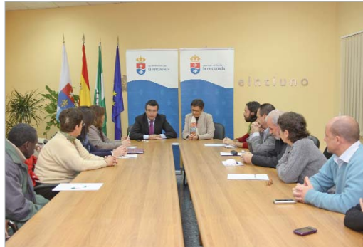
Firma de los convenios de Cooperación Internacional del año pasado.

Por otro lado, en cuanto a proyectos relacionados con la acción social destinado a núcleos desfavorecidos de población procedentes de países empobrecidos a realizar en el municipio, han recibido ayudas la asociación Unidos por el Pueblo Saharaui 'La Rinconada' y la asociación Amigos del Sáhara para el programa