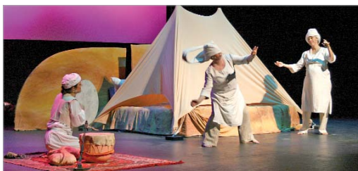
Compañía Búho Teatro.

extraño con ¡cuatro jorobas!. La compañía de Danza Fernando Hurtado traerá a 'Charlie', Premio al Mejor Espectáculo de danza en la Feria Europea de Artes Escénicas para Niños y Niñas, FETEN 2012. Maravilla Teatro y Música narrará una historia donde el inconsciente se transforma en gesto, música y humor. Finalizará PTV-Clown con 'Enamorirse', representación