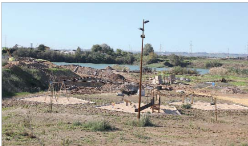
El futuro parque metropolitano tendrá 15 hectáreas para el deporte y el ocio.

La UTE Ceinsa Camarena prosigue las obras de la segunda fase del que está destinado a convertirse en un pulmón verde para el municipio, denominado parque de Las Graveras, que siguen los plazos de ejecución previstos y que deben estar finalizadas a finales del año 2013. Supondrá la creación de un parque metropolitano de 15 hectáreas que dinamice nuevas oportunidades de ocio, cultura y de empleo. El diseño de este nuevo parque de Las Graveras se ha realizado para que integre diversas zonas, todas ellas vinculadas al agua, la naturaleza, el deporte y la aventura.