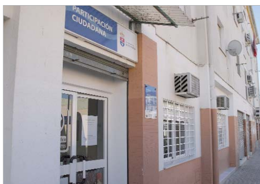
Oficina de la OMIC.

"Vamos a trabajar conjuntamente la OMIC, con la asistencia jurídica de Soderinsa y los informes de Servicios Sociales, para asesorar, en la medida de nues-