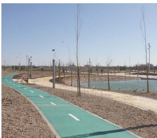
El parque tiene 2,8 hectáreas que incluye diversas zonas de ocio.

Se encuentra situado a pie de la autovía de Acceso Norte y el