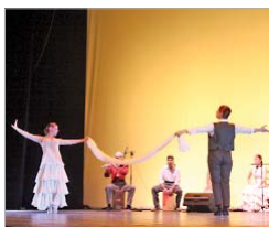
Di Tempo Flamenco.

La segunda quincena de noviembre traerá a Di Tempo Flamenco con 'La venta de los gatos', pieza de baile de esta compañía que emerge del Aula de Baile de Factoría