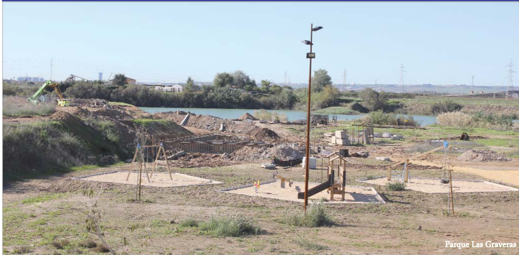
Parque Las Graveras