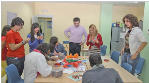
Imagen de la pasada edición de Diversia 180.

Durante cinco fines de semana, los jóvenes mayores de doce años se citan en 'La Estación' para disfrutar de su tiempo libre