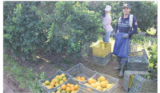
El sector agrícola, uno de los pilares de la economía rinconera.

Consistorio asesorándolo con el objeto de recopilar información, realizar estudios, censos y estadísticas, ayudando con las visitas, eventos y cualquier actividad relacionada con el ámbito rural que se organice desde la concejala, la promoción de productos y productores locales en los ámbitos municipal, provincial, regional, nacional e internacional, llevando el nombre y la 'Marca La Rinconada' como distintivo de