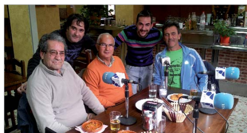
El ciclismo rinconero estuvo en la Tertulia Deportiva en La Paraíta.