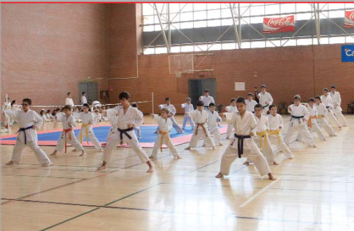
Una de las exhibiciones celebradas durante el Villa de La Rinconada.