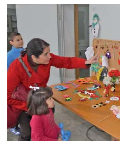
Celebración del día de la Infancia.

de los cinco derechos propuestos desde la organización: derecho a la salud, a la educación, a la alimentación, a no ser discriminado o a la familia. Más tarde, un jurado elegirá a los ganadores siguiendo los criterios de originalidad, presenta-