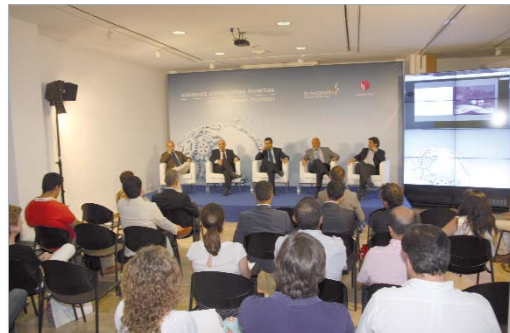
Imagen de una de las Misiones Comerciales Inversas desarrolladas.

comercio e inversiones extranjeras, en clara expansión. Además, de esta labor pública, es consultor internacional en comercio exterior, gran conocedor del país y de la región,