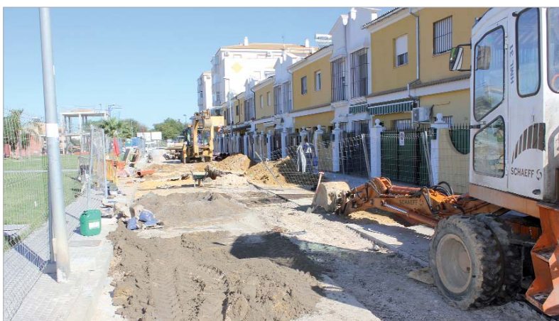
Al contrario que ocurre en otros municipios cercanos, en La Rinconada siguen apreciándose obras en la escena pública.

Las infraestructuras en construcción siguen en marcha a la vez que se potencian otras actuaciones que mejoran el municipio y permiten dinamizar la economía con la creación de puestos de trabajo