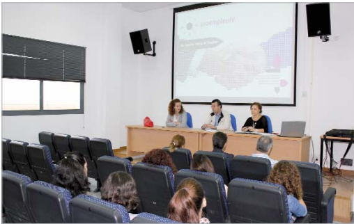
El alcalde, Javier Fernández, y la delegada de Economía, Raquel Vega.

Integraverde incluye acciones tanto de mejora de infraestructuras como de formación, empleo y de sensibilización. La recuperación de la antigua Gravera de Los Labrados es el eje vertebrador de la actuación que se convertirá en un parque multifuncional relacionado con el deporte, la naturaleza y las actividades acuáticas.