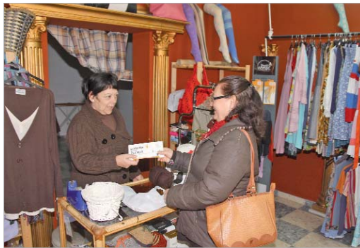
Las compras locales permiten mantener los puestos de trabajo del municipio.

En palabras del máximo responsable de la concejalía, Sergio