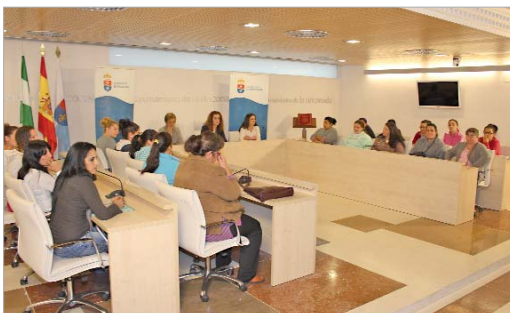
Las ediles de Empleo, Bienestar Social e Igualdad con las beneficiarias.

des para la inserción sociolaboral', "una iniciativa ambiciosa con la que el Consistorio apuesta claramente por la mujer y por su acceso al mercado laboral a