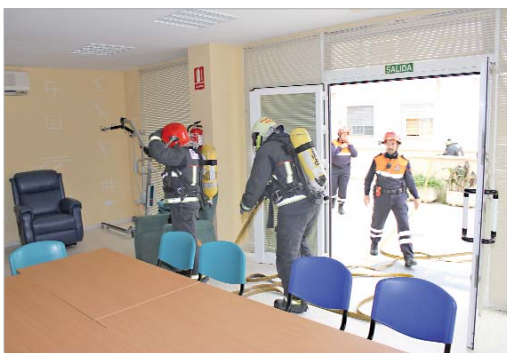
Los bomberos desplegaron sus medios para extinguir el incendio.

Tras dar la señal de alarma, trabajadores y usuarios comenzaron a evacuar el centro ocupacional, la residencia de adultos, la residencia para gravemente afectados y la unidad de estancia diurna, al tiempo que llegaban los primeros agentes de la policía local para controlar