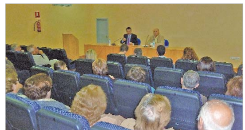
El alcalde y el edil de Urbanismo, en una reunión con vecinos de la zona.

Por otro lado, se están dinamizando distintas partidas que quedan por ejecutar por valor de 620.000 euros y que supondrán el ajardinamiento de zonas verdes, pavimentación de la Avenida principal del segundo tramo y pequeñas partidas para ir cerrando definitivamente la urbanización interna. Para Díez, "nos encontramos en la fecha idónea, según los expertos, para realizar el ajardinamiento se hace necesaria antes de que acabe el invierno para evitar la contaminación de la zahorra de la calle".