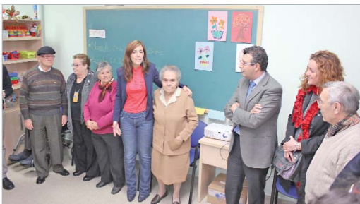
El alcalde acompañó a los usuarios en la inauguración de la sede.

El colectivo dispone de unas instalaciones más amplias y adecuadas a sus necesidades en la planta alta de la escuela infantil Almonazar