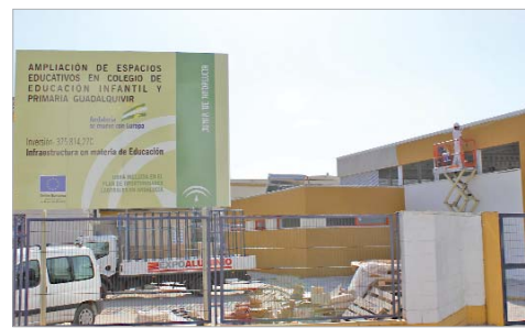
Las obras en el colegio Guadalquivir avanzan a buen ritmo.