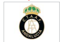
Comité Técnico de Árbitros Sevilla