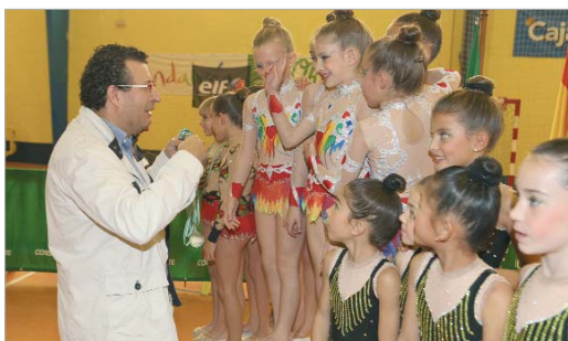
Javier Fernández entrega las medallas de oro al conjunto Benjamín.

El XIV Villa de La Rinconada reúne en el Agustín Andrade a 51 conjuntos de toda Andalucía, con tres medallas para los seis conjuntos de la localidad