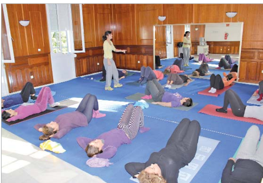
Uno de los talleres mejor acogidos es el de Pilates.

Un total de 12 cursos sobre diferentes disciplinas permiten a las usuarias aprender y disfrutar de momentos de ocio y esparcimiento