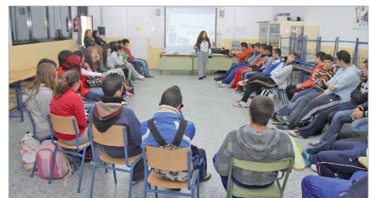
Una de las charlas que tuvo lugar en los institutos del municipio.

parte del amplio programa de actos para conmemorar el Día