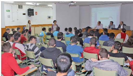
El delegado de Educación estuvo presente en la charla.