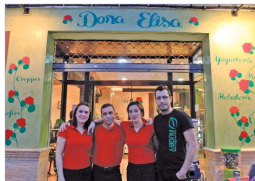
Fachada principal realizada en estuco y decorada con geranios.

trario, han venido personas a felicitarnos expresamente porque les han gustado nuestros productos y, en escasamente un mes, hemos logrado una clientela que vuelve y repite”.