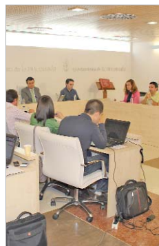
Salón de plenos del Ayuntamiento.

Esta actualización conforme a IPC es una congelación de la presión fiscal en términos económicos, porque las tarifas no suben