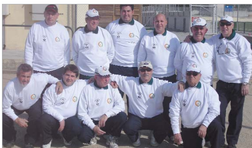
Los componentes del Club Petanca San José han logrado el ascenso.

El Club Petanca San José ha consumado el ascenso a Segunda Provincial de Veteranos tras imponerse al Monumento en el último partido por 3-1. Se confirman así las expectativas de la entidad, que lleva varias semanas esperando cantar el alirón.