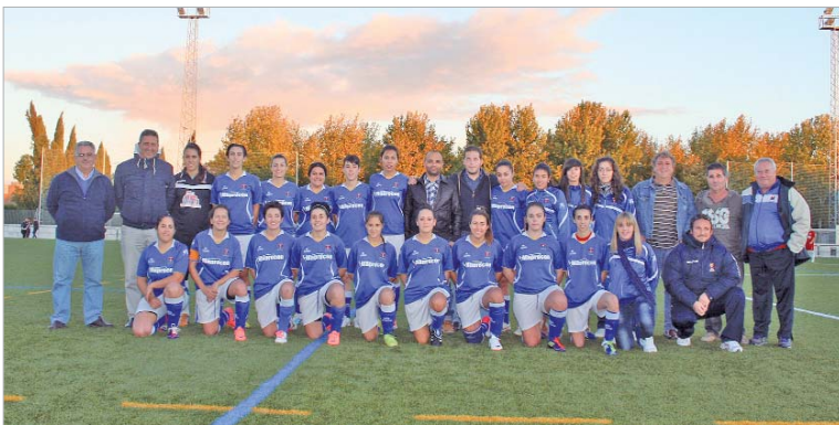
La plantilla del San José femenino, directiva y cuerpo técnico, posa antes del partido ante el Lora (0-5).

Que el fútbol es un deporte de masas es algo que está muy claro, sobre todo en nuestro país. Y un ejemplo de ello es La Rinconada, donde las féminas han demostrado una tremenda pasión por el balompié, que se ha ido fraguando con los años y que ha desembocado en la creación, gracias a la apuesta del San José, de un equipo femenino.