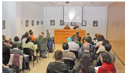
La delegada de Cultura durante la apertura del seminario.

Tras dos años de desarrollo del programa de investigación del cuaternario aluvial local, puesto en marcha por el Ayuntamiento y la universidad Hispalense, se presentó en este foro los nuevos resultados obtenidos de esta campaña, dado el enorme interés que ofrecen los materiales líticos