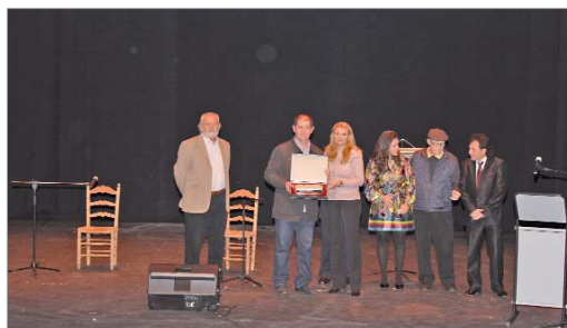
Este año se reconoció al Festival Internacional de 'Lo Ferro'.