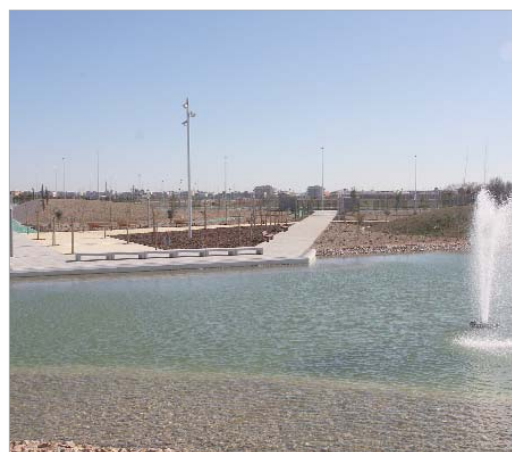
Dispone de itinerarios peatonales y ciclistas y una lámina de agua.