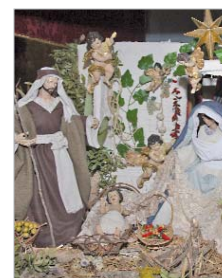
Belén de la pasada edición.

Tenencia de Alcaldía, o bien en el Ayuntamiento, en horario de lunes a viernes de 9.00 a 14.00 horas, o martes y jueves de 16.00 a 18.00 horas. También, pueden hacerlo a través de email a la siguiente dirección: festejos@aytolarinconada.es.