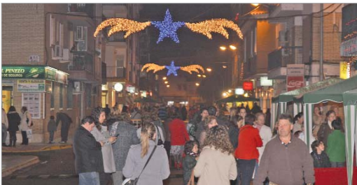
El año pasado el mercadillo tuvo un enorme éxito.

Los comerciantes sacan sus puestos a la calle para ofrecer a los vecinos productos a bajo coste