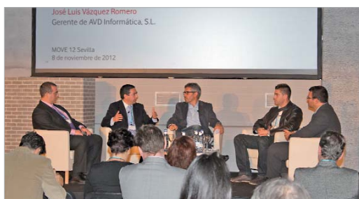
El edil de Servicios Generales explicó la experiencia de La Rinconada.

La empresa Vodafone se encuentra realizando una serie