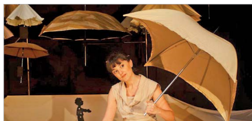
Compañía Maluka Peka.

La Villa recibe cinco puestas en escena de este fantástico festival. Karicat@s Band pondrá música, baile y cante en un show con pinceladas de humor. Le seguirá Búho Teatro con 'Contando jorobas', un bebé camello un tanto