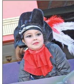
Los pequeños-grandes protagonistas.