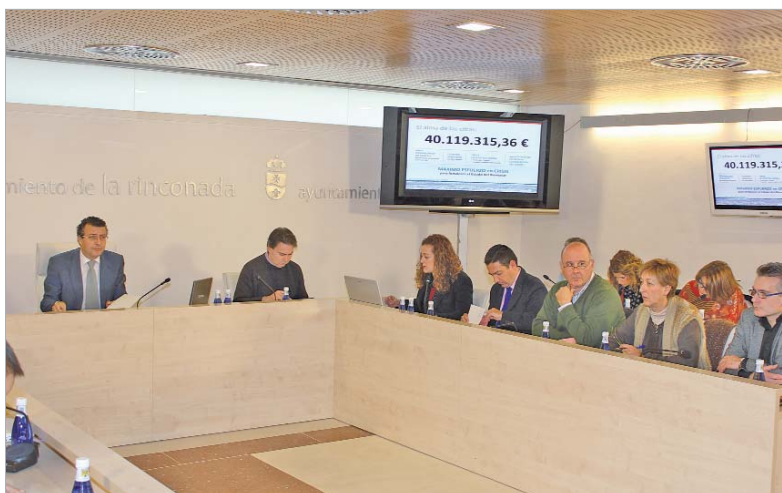
Las cuentas generales se aprobaron en el pleno extraordinario del mes de diciembre.

"Las decisiones fiscales garantizan el reparto entre