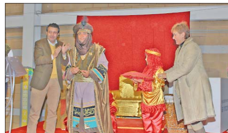
El Cartero Real, organizado por la Calle Santiago, recogió las numerosas cartas de los niños y niñas a los Reyes Magos.