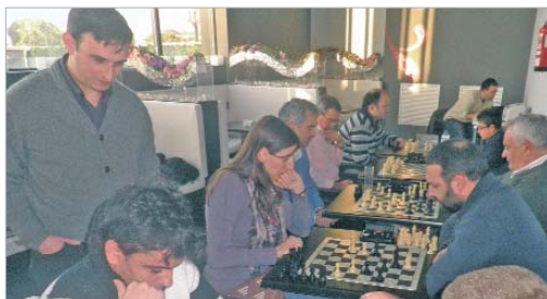
El Circuito de Bares es una actividad que ha cosechado gran éxito.

ya está plenamente institucionalizado, la organización de eventos para concienciar respecto a la violencia de género o los torneos de bares, mediante los cuales salen a la calle para enseñar su deporte