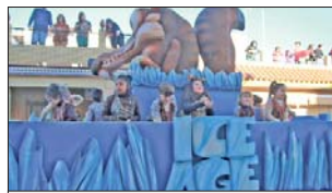
Los dibujos animados de 'Ice Age'.