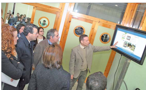
Los alumnos de páginas web han creado una página sobre el parque.