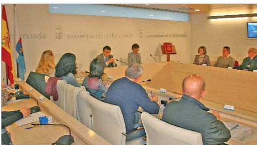
Las ONG's que reciben la subvención se reunieron con el alcalde.

"Son tiempos difíciles para todos, pero seguimos apostando por la cooperación internacional, sin perder la prioridad absoluta de aliviar a nuestros vecinos y vecinas, porque ahora más que nunca es importante compartir. De lo que se trata es de mejorar la calidad de vida de personas que viven en situaciones extremas, de intentar que tengan acceso