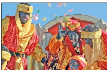
El rey Baltasar estuvo de lo más activo durante el recorrido repartiendo caramelos, balones y regalos.