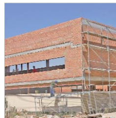
Biblioteca de La Rinconada.