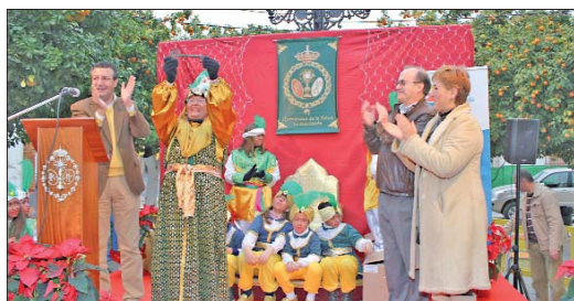
El Visir Real, organizado por la Hermandad de la Salud, recibiendo de manos del alcalde la llave de los hogares rinconeros para repartir ilusión.