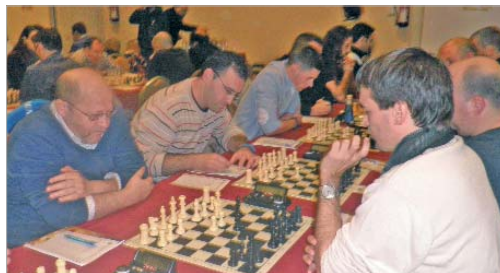
El Trofeo Ciudad de Sevilla es muy importante en el panorama nacional.

Actualmente, hasta once jugadores del San José participan en el Trofeo Ciudad de Sevilla, siendo uno de los clubes que más jugadores aporta a un torneo de enjundia nacional al que acuden, incluso, maestros internacionales atraídos por la gran competencia y por la cuantía de sus premios. Pero la actividad competitiva es sólo una rema más de la actividad de la entidad, que ha hecho de la promoción social de este deporte su bandera y que lleva el ajedrez hasta todos los rincones del municipio a través de iniciativas tan loables como el curso en la asociación de Alzheimer, que