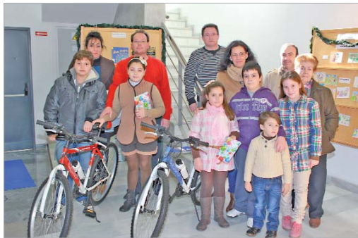
Las ganadoras recibieron un lote de libros y una bicicleta.

"Los usuarios no desconectan de la biblioteca durante las vacaciones participando en este certamen, a la vez que se premia el esfuerzo por el trabajo bien rea-