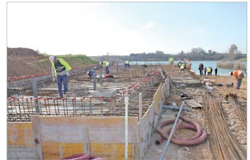
Los delegados de Urbanismo y Desarrollo Económico visitaron la evolución de las obras en el parque.

El parque dispondrá de 15 hectáreas de ocio, cultura y deporte vinculadas al agua