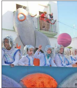
Visitantes del espacio en el cortejo.