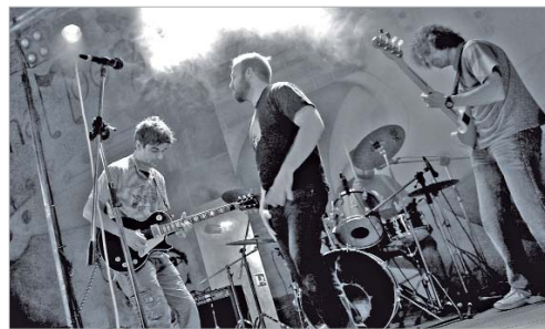
El grupo de Rock Pulse actúa en el Antonio Gala el 18 de enero.

Además, hasta el 3 de febrero, la sala de exposiciones de La Villa recibe la muestra 'Panorámicas del