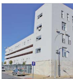
Los dúplex de Rinconada Oeste.