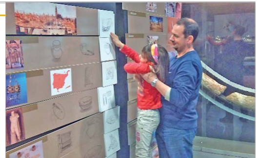
Una de las participantes coloca una pieza en la etapa histórica correspondiente.

conocieron la amplia colección de fósiles, lo que les permitió aprender los antepasados de muchas especies animales y