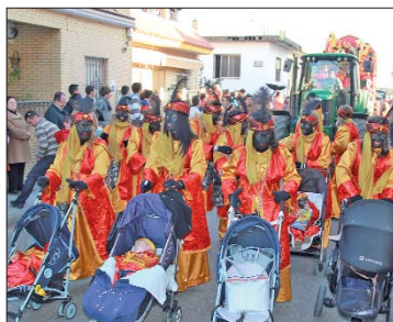
El séquito que acompañaba al rey Baltasar inculca la tradición de los Reyes a los más pequeños.