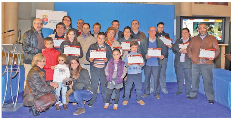
Los belenistas recibieron un diploma en reconocimiento a su labor de creación de belenes.

Una veintena de entidades, asociaciones y particulares participan en esta muestra y enseñan a los vecinos sus nacimientos