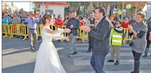
La Estrella de la Ilusión es recibida por el alcalde y la delegada de Fiestas Mayores instantes antes del comienzo de la Cabalgata de Reyes.