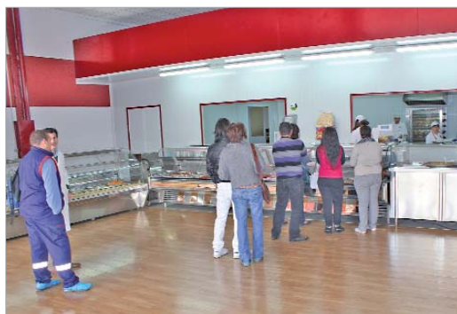
Cada vez más clientes acuden al establecimiento para pedir su comida.

Asimismo, de lunes a viernes, 'Pikoteo's' ofrece menús a 4'95 euros que incluyen un primer plato, un segundo y un postre o la bebida.