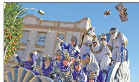
El rey Melchor repartiendo caramelos y juguetes entre la multitud que se agolpaba en las calles para seguir el recorrido.