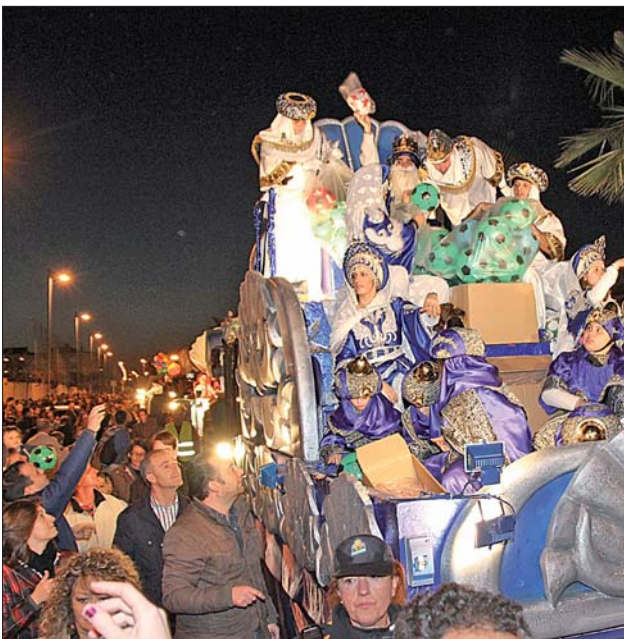
La llegada de la comitiva al Paseo del Almonazar dejó en la retina de todos los allí presentes una de las estampas más bellas y recordadas de la Cabalgata de Reyes 2013.