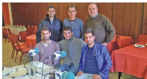
Los hermanos Padilla Gallardo visitaron el Hotel Restaurante Los Arcos.