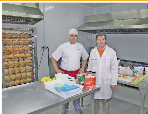
'Pikoteo's' elabora toda la comida en la cocina de sus instalaciones.

ESQUINA CALLE MIGUEL SERVET - P.I. CAÑAMO 1