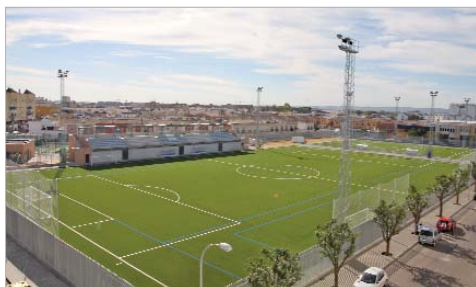
La Rinconada dispone de unas instalaciones modernas y punteras.

La partida presupuestaria para el Patronato Municipal de Deportes disminuye un 0,65 por ciento debido a la optimización de la gestión y de los costes. Seguirá con su programación deportiva de altísimo nivel, variedad y calidad, mantiene las subvenciones a clubes y depor-