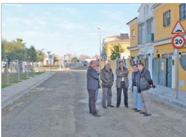
Los ediles de Urbanismo y Vía Pública en una visita.

La empresa pública del agua, Emasesa, procede a la renovación de la red de saneamiento, abastecimiento y pavimentación