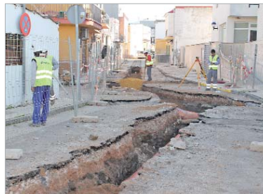
La calle 3 de abril estará a punto en primavera.

Las áreas municipales de Urbanismo y Vía Pública, a través de la empresa pública del agua, Emasesa, se encuentran procediendo a la renovación de los servicios