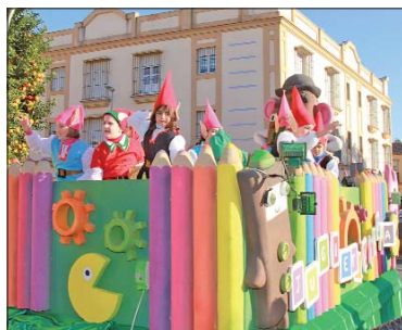
Los pequeños estaban muy animados y se lo pasaron en grande en la carroza de 'Juguetilandia'.