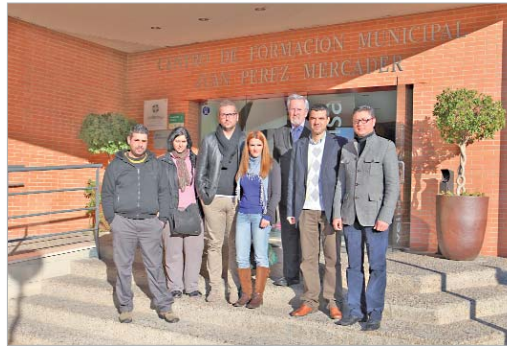
Los premiados junto al edil del ramo y el experto en Comercio.

entre las 32 empresas locales participantes, determinando que el primer premio sea para Perfumería Pétalos, que se lleva 300 euros así como un diploma acreditativo, por su "buen gusto, estética y atractivo". El segundo premio, dotado con 150 euros, ha sido para Arte Floral Altea, por su "magnífica interpretación tradicional de la iconografía navideña y belenista" mientras que el tercero, que conlleva un premio de 100 euros, ha sido para Frutería