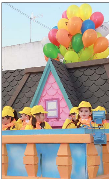
La carroza de 'Up' llenó de colorido el cortejo. Sus globos son ya una seña de identidad del recorrido.