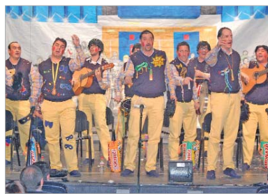
La chirigota de Jorge de la Rosa sigue al pie del cañón.