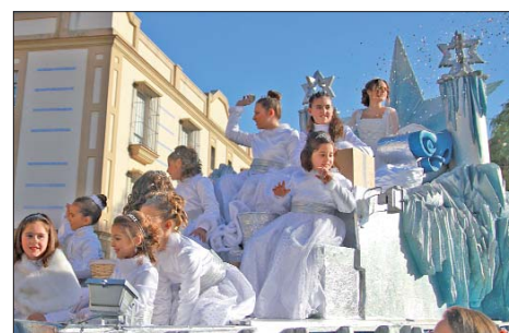
La Estrella abrió la comitiva acompañada de su séquito de pequeñas princesas y guió al resto de carrozas durante el recorrido.