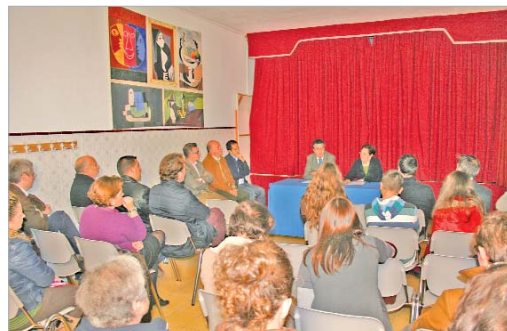
El alcalde firmó el convenio con el centro escolar San José.

La obra, que tiene un valor aproximado de 350.000 euros, estará