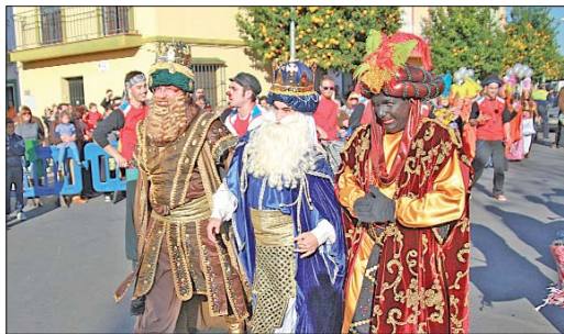
Melchor, Gaspar y Baltasar llegando al parque Quintero León y Quiroga para dar el pistoletazo de salida a la Cabalgata de Reyes 2013.