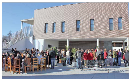
Patronato de Personas con Discapacidad.

El Patronato de Personas con Discapacidad mantiene intacto su presupuesto, sin recortes, consolidando los servicios del centro ocupacional, la residencia de adultos, la unidad de día y la residencia de gravemente afectados. También mantiene todos los programas.