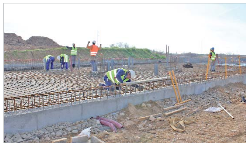
Las obras de Las Graveras permiten la contratación de mano obra local.

Asimismo, se aumentan las partidas para el Plan Extraordinario de Empleo, y el Plan Municipal para el