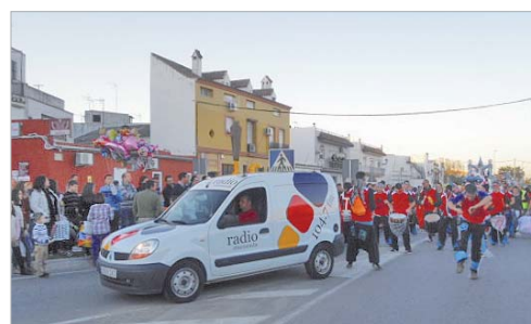
La unidad móvil de la Radio durante el desarrollo del cortejo.

Como es habitual, Radio Rinconada salió a la calle durante la Cabalgata de Reyes para llevar a los oyentes que, por cualquier razón, no podían seguir su desarrollo en directo, la retransmisión de la Cabalgata de Reyes Magos en La Rinconada y San José.