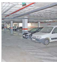
Plazas de garaje de uso particular.