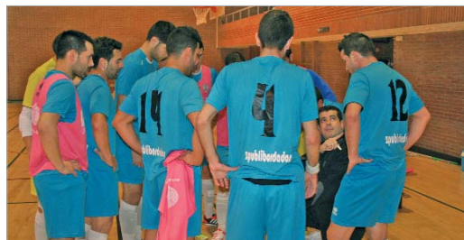
Aspas da instrucciones a sus jugadores durante un tiempo muerto.

El San José Fútbol Sala, después de algunos altibajos en la competición derivados de la ausencia