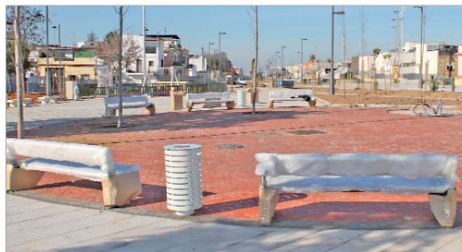
En estos momentos se trabaja en el mobiliario urbano, jardines y asfaltado.

co en una gran oportunidad para el entorno".