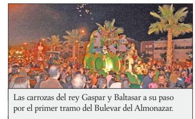
Las carrozas del rey Gaspar y Baltasar a su paso por el primer tramo del Bulevar del Almonazar.