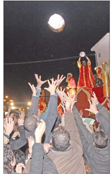
Una estampa habitual en cada cabalgata es la ilusión por hacerse con los balones que lanzan los Reyes.