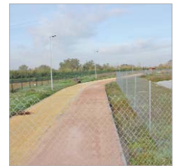
Ampliación de El Majuelo.

se reciben menos fondos de otras Administraciones, el Ayuntamiento aumenta en proporción su esfuerzo y capacidad inversora directa.