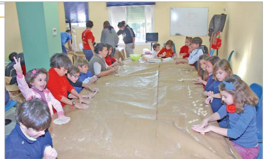
El Centro Joven 'La Estación' acogió esta nueva edición del programa.

distintas actividades como talleres de manualidades, barro, pul-