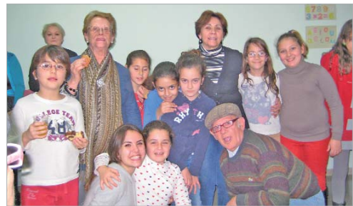
Los usuarios compartieron la jornada con escolares y familiares.

manualidades que los usuarios hicieron relacionadas con la Navidad como felicitaciones o adornos. También tuvo cabida el teatro y se representó una pequeña obra a cargo de los socios titulada 'Ay mi cabeza', donde se esceni-