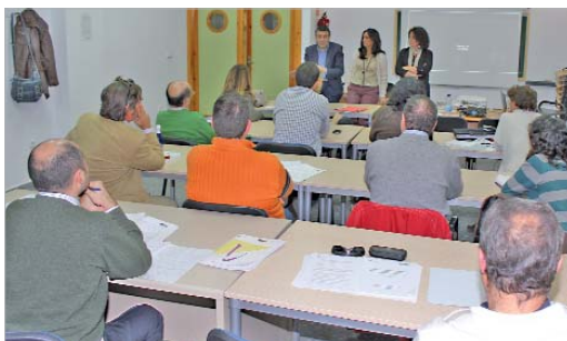
El alcalde y la edil de Igualdad en la clausura del curso.

El área de Igualdad, a través del Centro Municipal de Información a la Mujer, y en colaboración con todas las concejalías del Ayuntamiento de La Rinconada, ha impulsado el II Plan Municipal de Igualdad de Oportunidades, un documento que aboga por la igualdad entre hombres y mujeres a través de una serie de medidas que pretenden concienciar y sensibilizar a la ciudadanía rinconera para conseguir su implicación en la consecución de los objetivos previstos.