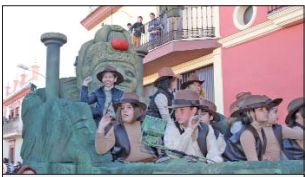
Los aventureros de 'Indiana Jones'.