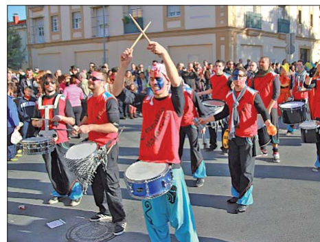
La animación musical fue una constante durante todo el recorrido y la Compañía Majareta uno de sus máximos exponentes.