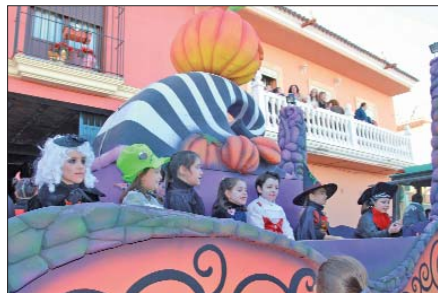
El terror y el miedo también estuvieron presentes en la Cabalgata de Reyes con la carroza de 'Halloween'.