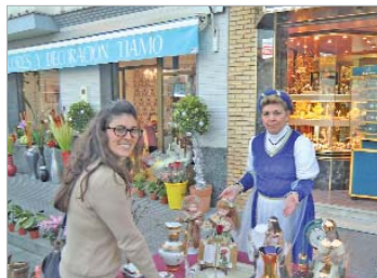
32 negocios participaron en esta iniciativa.