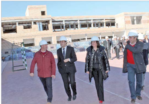
El colegio Blanca de los Ríos tendrá capacidad para albergar a 675 alumnos.