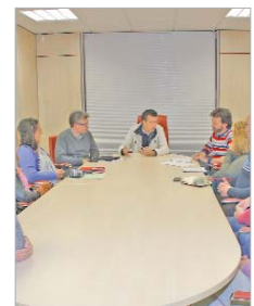
Reunión del alcalde con el AMPA.

El total de las tres actuaciones del OLA (Blanca de los Ríos, Guadalquivir y La Paz) supone una inversión de 1,64 millones de euros y una previsión de empleo de más de medio centenar de puestos de trabajo para el municipio.