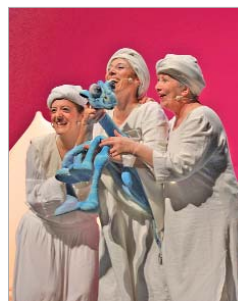
Festival de Teatro para Niños.

El Festival de Circo de Sevilla, Circada, llegó a La Rinconada con dos obras brillantes y el Festival