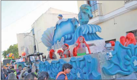
'Las sirenas' abandonaron su hábitat en el fondo del mar y se subieron a una carroza para compartir esta jornada con los vecinos.