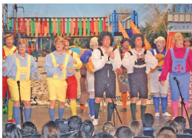
La chirigota de los Surferos. Dos iguales para hoy.