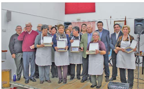
Centro de Día '20 de Julio'.

Durante las meriendas no faltaron los villancicos interpreta-