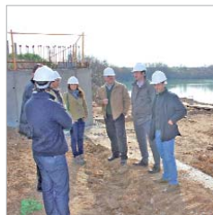
Parque de Las Graveras.

y adecuando los gastos a la realidad de la coyuntura", señala la edil de Hacienda. A pesar de que