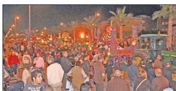
Centenares de vecinos eligieron el Bulevar del Almonazar para ver pasar a SS.MM. los Reyes.