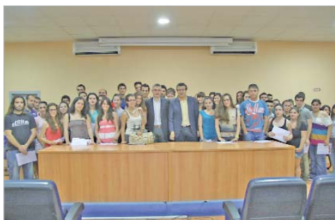
Las becas estudiantiles aumentan un 13 por ciento.

Otras áreas que aumentan son Cultura, 1,40 por ciento, Salud, 0,57 por ciento, Mayor, 5,02 por ciento, Igualdad se mantiene, Juventud, 4,40 por ciento, Sostenibilidad, 1,64 por ciento, Participación Ciudadana, 14,97 por ciento, y Cooperación Internacional que gestionará el mismo presupuesto de alrededor de 122.000 euros.