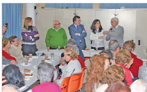
Centro de Día 'Pablo Picasso'.

En el '20 de Julio' se reconoció el trabajo de algunas usuarias por su dedicación e implicación