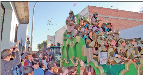
El rey Gaspar fue uno de los más aclamados durante el cortejo. Caramelos, juguetes o balones son solo algunos de los regalos que repartió su carroza.