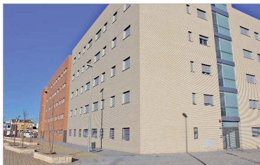
Las cantidades abonadas serán descontadas en el precio de venta final.

Así, desde el área se aboga por el alquiler con opción a compra