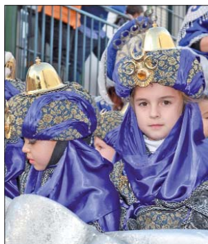
El séquito del rey Melchor contó con muchos jóvenes para repartir ilusión.