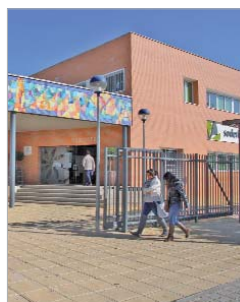
Edificio 'Juan Pérez Mercader'

mundo laboral, lo que repercute también en las distintas áreas municipales, que se benefician de los últi-