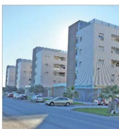
Promoción de Lomas del Charco.

Soderinsa Veintiuno pone en el mercado siete locales ubicados en la promoción de 64 viviendas