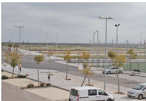
Los solares se encuentran ubicados en la zona de San José Norte.

"Con esta medida ofrecemos a nuestros vecinos y vecinas la oportunidad de construirse su