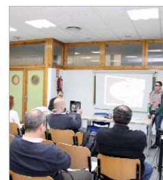
Primera sesión del programa.

El primero de los encuentros se ha desarrollado en el edificio Juan Pérez Mercader, sede de la empresa pública Soderinsa Veintiuno, con la mesa redonda 'Open Government: la vía hacia un nuevo modelo de participación y gestión a través de la red', en la que han participado