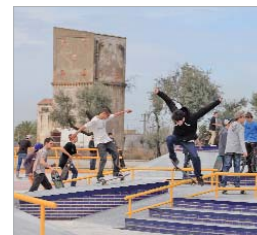
Los skaters disfrutaron estrenando las nuevas instalaciones.