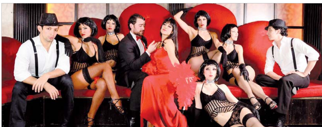
La compañía EBD Theater Group llega a La Villa el 5 de abril.