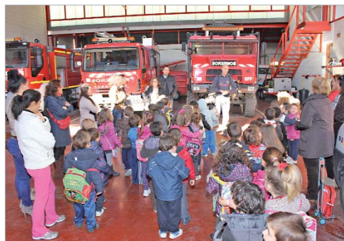
Los niños y niñas disfrutaron del trabajo de los bomberos locales.