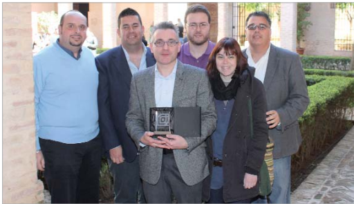
Una representación de Radio Rinconada posa con el galardón.

La emisora local es reconocida por su trayectoria en la difusión de espacios vinculados al consumo