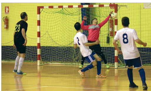
El Tres Calles volvió a ganar ante el Ciudad de Lepe y olvidó su bache.

El Tres Calles y el San José, recién ascendidos a sus respectivas categorías, logran la salvación matemática a falta de varias jornadas para acabar la Liga