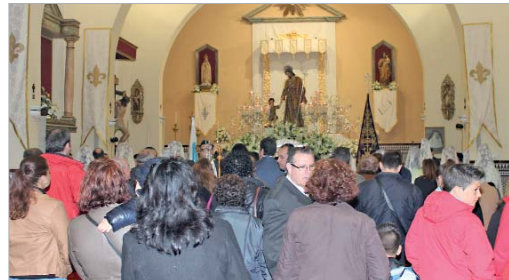
Cientos de vecinos, devotos y fieles visitaron al templo para ver al Patrón.