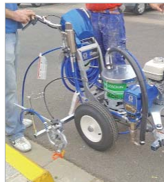
Nueva máquina de señalización.

lización de marcas de tráfico horizontales y viales que "mejora cualitativamente los servicios que se prestan desde la concejalía, ya que se trata de una herramienta moderna y