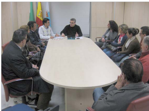
Los ediles de Educación y Comercio con los propietarios de las papelerías.

rias locales, está estudiando la implantación de un nuevo sistema para el reparto de las becas de infantil para material curricular básico que se entregan al principio