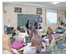
Los institutos dieron charlas.