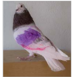
Canela Fina ganó en San José.