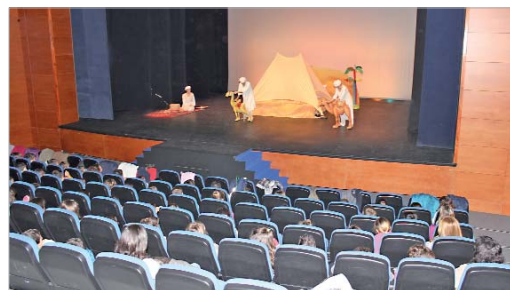
La compañía Búho Teatro en una de sus actuaciones para los escolares.

Además, ha añadido que "para muchos de los asistentes será su primer acercamiento al teatro, su