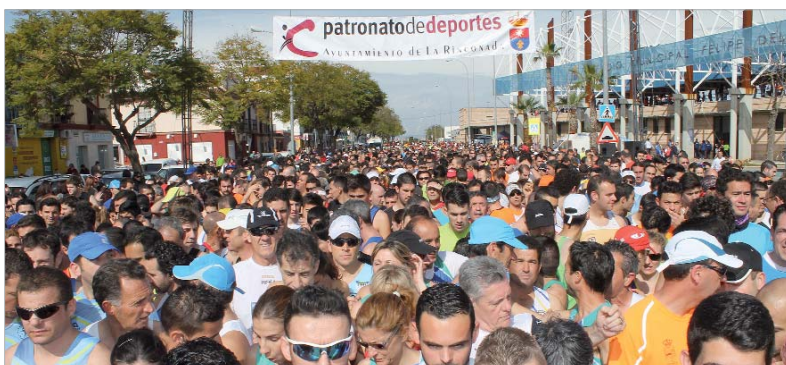
La Carrera Popular de San José reunió a casi 3.000 atletas de todas las categorías y a clubes de toda la geografía nacional.