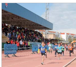
Las gradas del estadio, a rebosar.