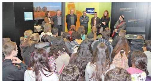
Los estudiantes alemanes en el Museo 'Francisco Sousa'.