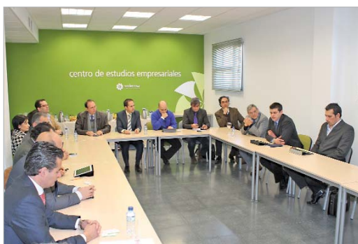
Empresas se reunieron con la consultora especializada en Oriente Próximo.

En los próximos meses, la consultora estudiará con su red de contactos las potencialidades de estas empresas y su posible expansión exterior y tendrán reuniones privadas con aquellas que más interesen al mercado árabe.