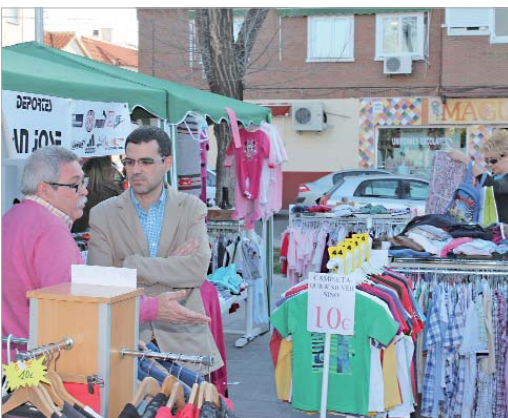
El delegado de Comercio visitó la feria y charló con los comerciantes.

Asimismo, durante el evento tampoco faltó la animación musical y un servicio de bar para que los asistentes pudieran tomar un refrigerio.