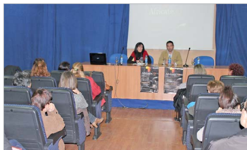
'La Estación' recibió a varios cooperantes que trabajan en países africanos.