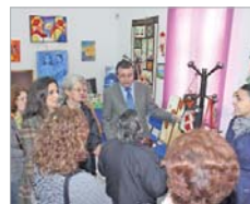
El alcalde visitó la exposición.

La cultura también tuvo cabida con la actuación solidaria de la Escuela de Arte Flamenco Fundación Cristina Heeren de Sevilla, el espectáculo del Centro Andaluz de Danza 'De la voz al cuerpo' o una visita histórica, 'Las mujeres en la historia de Sevilla'.