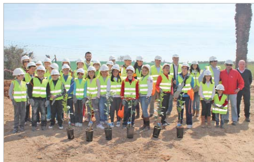
Los estudiantes del colegio Júpiter estuvieron en la gravera 'Cortijo Nuevo'.

El alumnado del instituto Miguel de Mañara y del colegio Júpiter participó en los actos organizados por dos empresas de la localidad vinculadas a ANEFA, como son la explotación minera de Aripresa en su planta de 'El Naranjal' y Occidental de Áridos en la