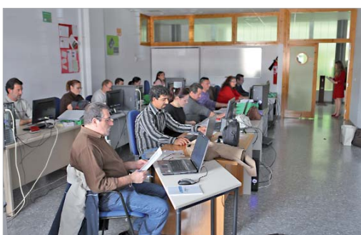
Los alumnos aprenden las herramientas de las nuevas tecnologías.

nologías comparten su experiencia y conocimientos con principiantes