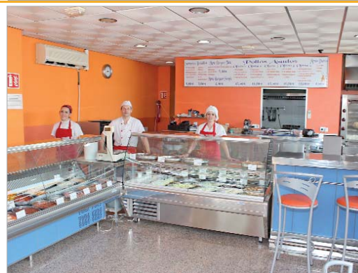
'An' cá la Tata' ofrece a los vecinos comida casera para llevar.

del Registro Sanitario que les permite trabajar y cocinar comida para otros establecimientos, asociaciones y colectivos.