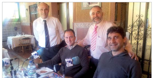
La dirección del Patronato de Deportes estuvo en Horno de Curro.