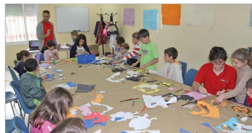
Los chavales participan en talleres de pintura y manualidades.

Más información y solicitudes en 'La Estación', calle San José 38, en el teléfono 95 479 39 00 o enviando un e-mail a juventud@aytolarinconada.es.