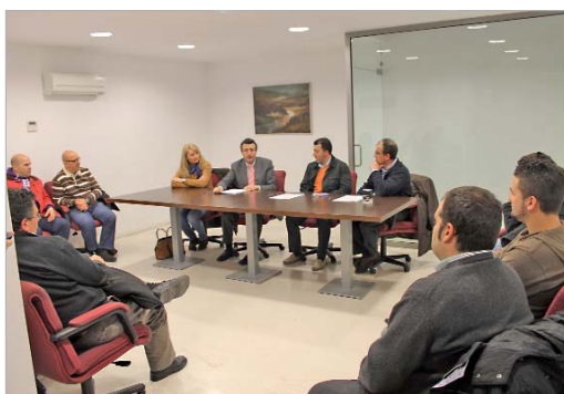
El alcalde y la edil de Cultura durante la firma del convenio.

Desde 1989, el municipio ha contado ininterrumpidamente con la Banda Municipal como representante de La Rinconada, impulsada y fomentada por el Ayuntamiento. Asimismo, la Asociación Cultural Cristo del Perdón, fundada en 1984, es un colectivo musical importante, de raigambre social y cultural, consolidado en la localidad, y financiada desde el inicio por la Hermandad Cristo del Perdón.