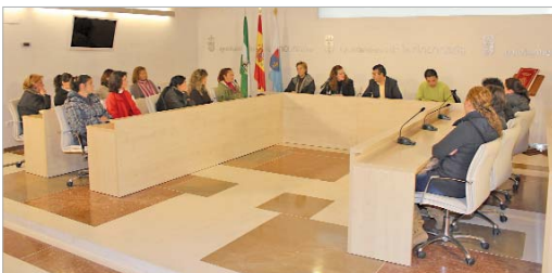
Una nueva remesa de contratadas fue recibida en el salón de plenos.

Como concluye Vega, "la situación que viven muchos vecinos que acuden al Ayuntamiento es delicada y nosotros, con las limitaciones y posibilidades de una administración local, tratamos de ofrecer el máximo apoyo". "El Ayuntamiento se ha adherido a la petición al Gobierno central de otros pueblos andaluces para que otorgue fondos para un Plan Especial de Empleo para Andalucía, que sí se ha concedido a otras comunidades" al tiempo que "se incrementen los recursos para políticas activas de empleo".