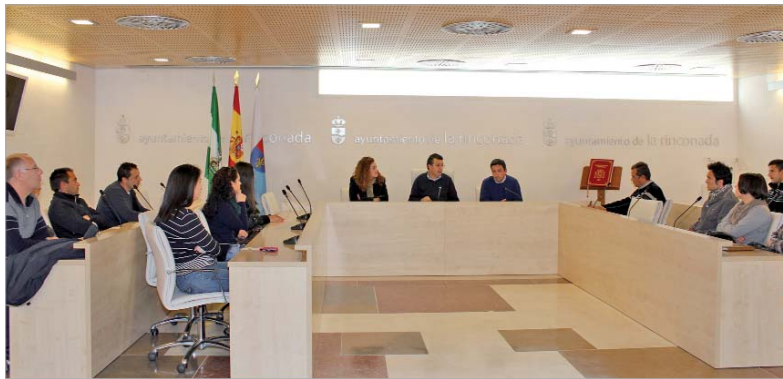
El alcalde y los ediles de Empleo y Vía Pública recibieron a los nuevos trabajadores en el Ayuntamiento.

El objetivo de esta actuación es la de sensibilizar sobre educación en