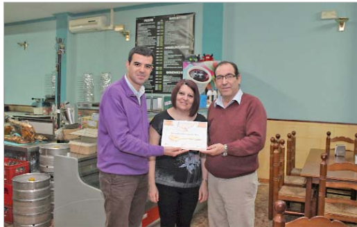
El delegado de Comercio entrega el diploma al ganador del concurso.

mios del I Concurso de Cuchareo, "una iniciativa pensada para que mostráseis al público vuestras mejores recetas y crea-