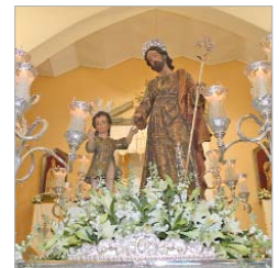
San José ubicado en su paso.

durante más de cuatro horas, costaleros, músicos, fieles y devotos desfilaron por la Parroquia para visitar a San José.