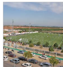
Anexo al Felipe del Valle.

abrió sus puertas el pabellón cubierto Fernando Martín, y el estadio deportivo Felipe del Valle, que reunieron a deportistas de primer nivel para su inauguración. En 1998 se inauguró el pabellón Agustín Andrade 'Gorri' en La Rinconada, con un cuadrangular de baloncesto entre las selecciones de España, Francia, Italia y Lituania y un clínica de Lolo Sáinz. En 1999, el nivel de instalaciones era tan elevado, que La Rinconada fue subse de del Mundial de Atletismo celebrado en Sevilla. En 2005 se vistió de largo la Piscina Cubierta, un complejo natatorio sin precedentes en la provincia, que permitió ade-