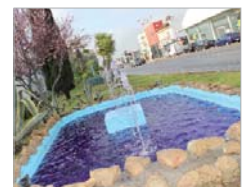
Las fuentes se tiñeron de violeta.