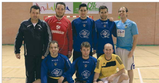
San José Galaxy se está codeando con los mejores en División de Honor.

La Liga Masterauto de fútbol sala sigue reuniendo a un gran número de jugadores y aficionados