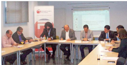
El delegado de Desarrollo Económico abrió el encuentro empresarial.