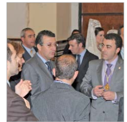
Esperando la decisión final.

Tras la desilusión de un día tan esperado, los miembros de la hermandad realizaron un rezo frente a la imagen del Patrón. Luego,