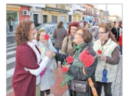
Tradicional reparto de flores.