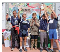
Emotiva entrega de premios.