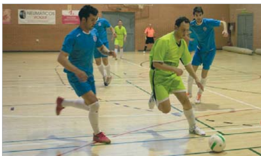
El San José derrotó al Atlético Carmona por un incuestionable 7-0.

Cuando todavía quedan varias jornadas para acabar la competición, los equipos locales de fútbol sala ya pueden estar satisfechos porque han conseguido el objetivo de la permanencia, que era la meta fijada teniendo en cuenta que ambos estrenaban categoría. El Tres Calles, después de un sensacional inicio en Tercera Nacional que le llevó a codearse con los mejores y a soñar con el ascenso, tuvo un bache, fruto de diversas lesiones en algunos de sus pilares y se resintió en la tabla. No obstante, parece que va olvidando la crisis de resultados con dos victorias en los dos últimos partidos frente al Ciudad de Lepe (6-1) y Peña La Lata (5-2). Por su parte el San José, en Primera Provincial, también ha tenido que superar distintos contratiempos en forma de bajas pero, con varios partidos por delante, ya ha conseguido el objetivo. Dos victorias ante Atlético Carmona y Marchena (7-0 y 3-4) y un empate a tres ante Los más Pitufos, son sus últimos resultados.