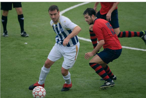
Israel debutó en el Leonardo Ramos ante el Puebla, con una victoria por 3-1.

El último triunfo ante el Puebla (3-1) ha reanudado las esperanzas de la familia del Rinconada