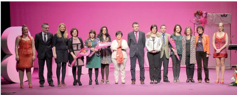
Foto de familia de la XIII Gala por la Igualdad.

La Villa acoge la XIII edición de estos galardones que reconocen la labor desarrollada por personas, colectivos o entidades que contribuyen o destacan en materia de equiparación de géneros