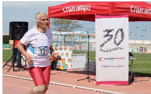
El deporte al alcance de toda la ciudadanía rinconera.

Partiendo de la base de que la práctica deportiva era un derecho y no un privilegio, el Patronato comenzó a poner en servicio instalaciones, programas deportivos y eventos que ofrecieran el apoyo necesario por un lado, a los clubes y deportistas con aspiraciones y