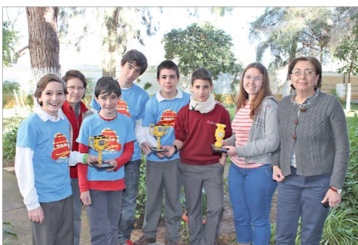
Los estudiantes posan en el colegio San José con los premios obtenidos.

Robótica y Ciencia First Lego League, un grupo de siete estudiantes del centro han vuelto a participar en este evento y han logrado alzarse con el triunfo al