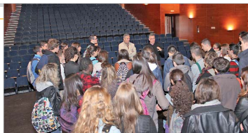
Los alumnos franceses visitando el Teatro de La Villa.