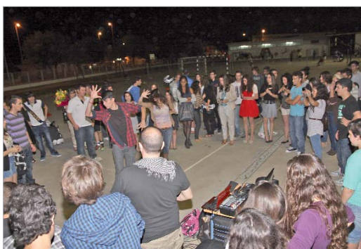
La música, el baile o el deporte, grandes protagonistas de Diversia 180.

Al igual que en la última edición, es necesario tener el Carnet del Club para participar en el programa, el cual podrán conseguir en el centro joven 'La Estación' a partir del 20 de marzo abonando 3 euros. Para acceder al recinto sin carnet tienen que adquirir una entrada por 1 euro.