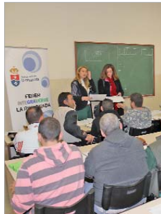
Uno de los cursos de Integraverde.

ficar nuevos yacimientos de empleo para proceder a la elaboración de las líneas estratégicas de actuación a corto, medio y largo plazo que permitan programar