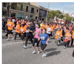
Participantes de la prueba aniversario.