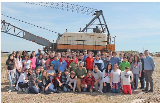
Los alumnos del Miguel de Mañara acudieron a la planta de 'El Naranjal'.

La iniciativa, puesta en marcha por las Empresas de Fabricantes de Áridos, contó con las visitas de alumnos del Miguel de Mañara y del Júpiter a dos graveras del municipio en donde conocieron el funcionamiento de las plantas y plantaron árboles como ejemplo de respeto y concienciación con el entorno natural