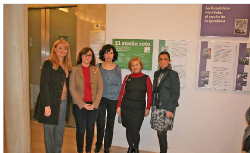
Las edilas de Cultura e Igualdad acudieron a la presentación.

Así, tras unos primeros esbozos en el 2006 y en el 2008, surgió 'El sueño roto', una exposición que han dividido en cuatro secciones: una con datos e imágenes que contextualizan esta etapa histórica, haciendo énfasis en las políticas de igualdad; la segunda 'Mujeres en la vanguardia' en la que los alumnos han seleccionado a 40 mujeres de los dos bandos que se enfrentaron en la guerra civil y que destacaron en múltiples campos, como Clara