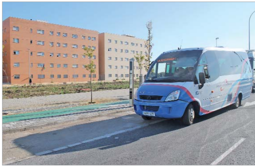
La parada está ubicada frente a los 100 pisos de Acceso a Pago de Enmedio.

de la Unión, en la zona conocida como Acceso a Pago de Enmedio, con el objetivo de "dar servicio a los inquilinos de los nuevos blo-