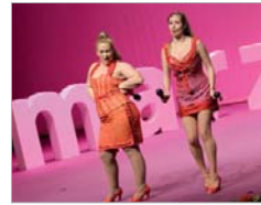
Presentadoras Sinónima y Antónima.