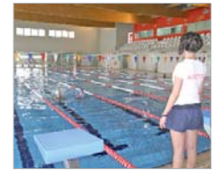
Yacimiento de empleo.

El deporte, además de ser un elemento generador de calidad de vida, es un importante dinamizador económico y una fuente de creación de puestos de trabajo. La Rinconada es un buen ejemplo de ello, con 30 empleos generados directamente desde el Patronato, así como un centenar más de forma indirecta, entre monitores, operarios y conserjes.