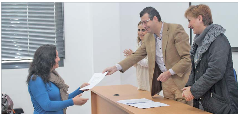
El alcalde y la delegada de Bienestar Social acompañaron a los alumnos el último día de clase y entregaron los diplomas.

El objetivo es desarrollar políticas que generen empleo con una dimensión local, que favorezcan la inclusión social de las personas desfavorecidas, promuevan el avance de las mujeres en el empleo e incrementen su participación duradera en el mercado de trabajo, y fomenten la inserción en el mercado laboral de las personas en situación o riesgo de exclusión social.