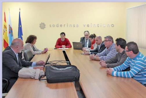
Reunión de la mesa de trabajo del Vive La Rinconada

"Se trata de un programa que tiene un triple objetivo,