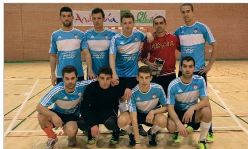
El Drink Team se encuentra en la zona media alta de División de Honor.

En Primera, Bar Pepe y Santa Caridad comandan el grupo, mientras que Los Caxi, que aún no ha puntuado, cierra la clasificación. En Segunda, Aluminios