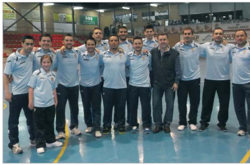
El Tres Calles posa en el feudo del Pozoblanco, al cierre de la temporada.