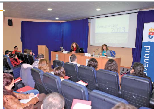
Las delegadas de Formación y Empleo y Juventud en las jornadas.

jóvenes asistieron a diversas ponencias y presentaciones a cargo de los técnicos de la Fundación Andalucía Emprende, que trataron la temática del emprendizaje y la creación de nuevas empresas, ahondando en aspectos como la organización, la planificación y el desarrollo de las estrategias de negocio y ofreciendo las herramientas para abordar los proyectos empresariales con garantía de éxito.