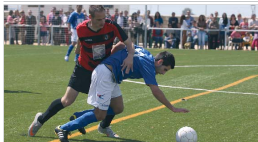
Kiki trata de proteger el esférico ante la presión de un jugador del Gerena.