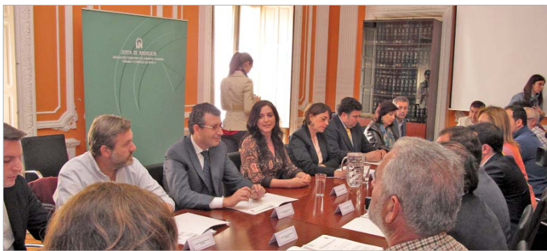
El alcalde firmó el convenio en la Consejería de Fomento y Vivienda.

en Defensa de la Vivienda con el objetivo de asesorar, intermediar