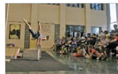
Descuentos para espectáculos.

Para los mayores de 65 años, pensionistas o discapacitados se aplican descuentos en los servicios deportivos de hasta el 50 por ciento que puede llegar al 100 por ciento por la situación económica familiar del usuario. Los estudiantes tienen un 10 por ciento. También se descuenta en el uso de las instalaciones deportivas municipales para deportistas o