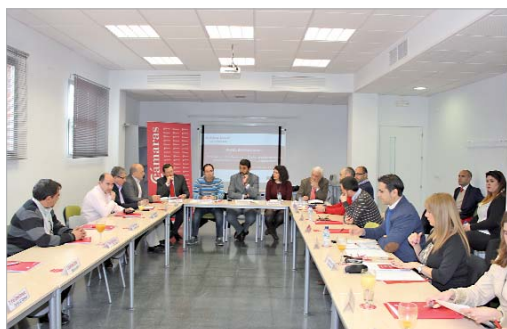
Empresarios y emprendedores acudieron al encuentro.