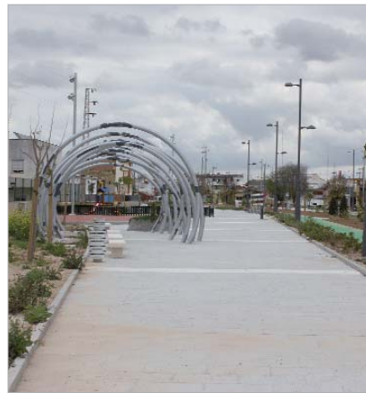
Los vecinos disfrutarán del paseo completo el próximo mes.