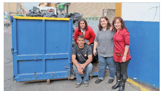
La asociación tiene puntos de depósito en colegios y comercios.