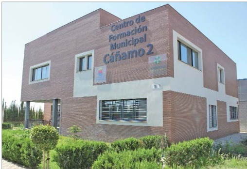
Los cursos se desarrollarán en el Centro de Formación Municipal Cañamo 2.

En concreto se ha abierto el plazo de inscripción para tres cursos de 'Montaje e instalaciones aeronáuticas de estructuras equipadas' cuya fecha de inicio está prevista para el 15 de mayo. Cada una de estas acciones formativas tiene una duración de 660 horas y acogerá a 15 alumnos por curso. Éstos aprende-