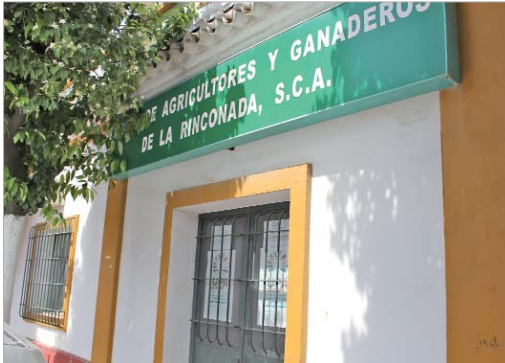
La sede se encuentra ubicada en la antigua cámara agraria de La Rinconada.

encuentra ubicada en la antigua cámara agraria de La Rinconada. Esta organización realiza actividades de asesoramiento técnico y de servicios a los agricultores y