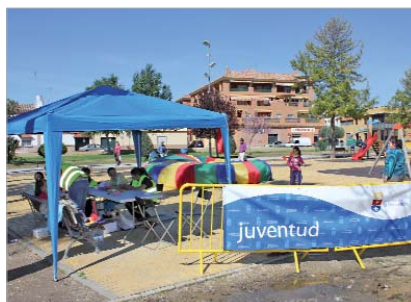
Parque Quintero León y Quiroga, en La Rinconada.