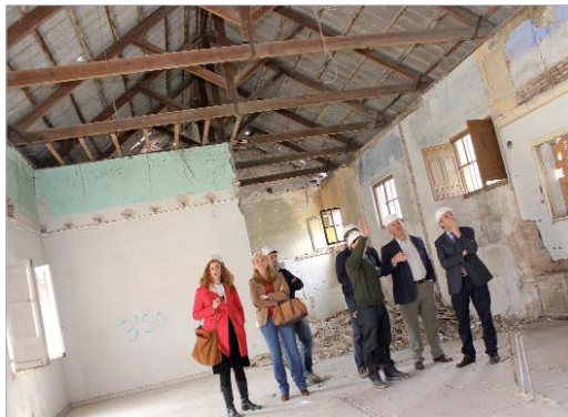
El alcalde y el delgado de Urbanismo visitaron las obras de la Hacienda Santa Cruz.

Por otro lado, en los próximos días comienza el desarrollo de dos talleres de empleo para los que el SAE aporta un montante global de 536.145,12 euros y el