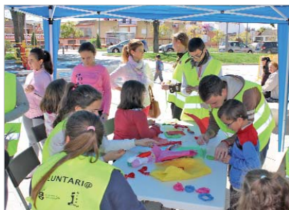
La edil de Juventud visitó las actividades programadas.

Cultural Antonio Gala de La Rinconada, se convirtieron en punto de encuentro para más de 500 niños y niñas de la localidad que compartieron juegos tradicionales como la comba, los saltadores, el tres en raya o los paracaídas, talleres de manualidades o pintacaras, entre otras actividades. Además, tampoco faltaron la animación musical y el baile o las carreras y competiciones, todo siempre bajo la atenta mirada y supervisión de los técnicos y voluntarios del área de Juventud.