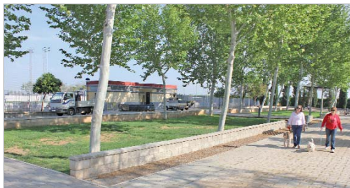
El recinto de ubicará junto a la zona próxima al Anexo al Felipe del Valle.