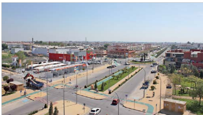
La prioridad del Gobierno local sigue siendo garantizar a la ciudadanía la calidad de los servicios.

La política fiscal del Gobierno local es progresiva y está orientada a que pague más quien más tiene, priorizando el gasto y garantizando el acceso al deporte, la cultura y las diferentes actividades de las áreas municipales a toda la ciudadanía independientemente de cuáles sean sus ingresos