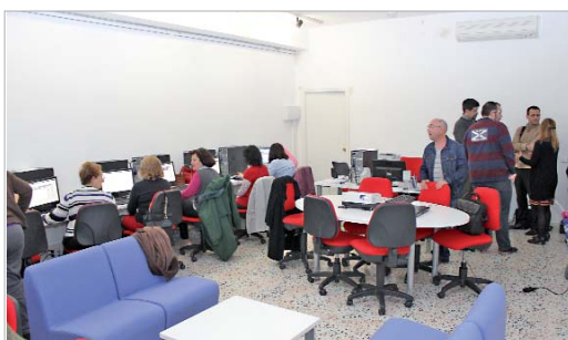
El Capi recibió la visita de la UE para conocer su trabajo.

Durante su visita, los invitados conocieron de primera mano los distintos programas y actividades que emanan del centro y que se adscriben al proyecto de la Red Guadalinfo de acceso a Internet,