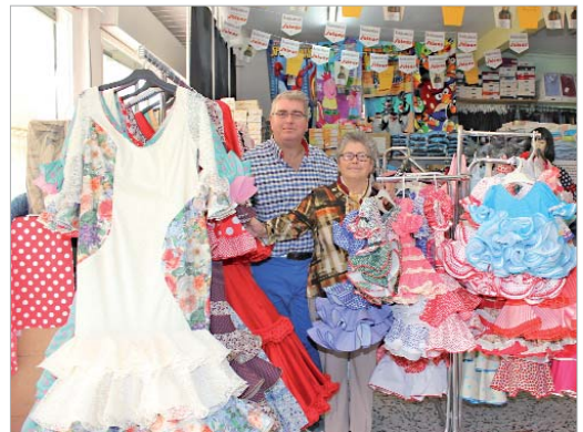
'La Casa de Mary' vende una gran variedad de trajes de flamenca.

aquí siempre van a tener su casa y podrán encontrar todo lo que necesitan con la mejor calidad y a los mejores precios del mercado, sin olvidar ni por un momento la atención personalizada y el trato cercano que nos caracteriza y que es nuestra seña de identidad".