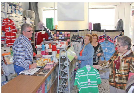
El negocio se moderniza sin dejar de lado a sus clientas de toda la vida.