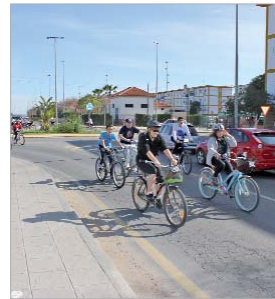
Mayores y pequeños disfrutaron este día.

fiesta donde se reivindicó una red de carriles-bici metropolitana y la intermodalidad bicicleta-