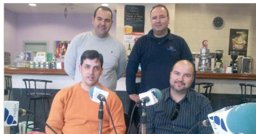
El club Rincopádel estuvo presente en A & C Café Teatro.