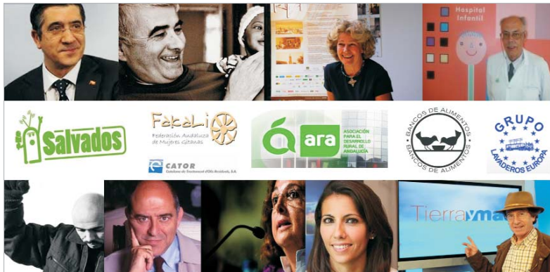
Estos premios resaltan el trabajo de individuos o colectivos en favor del progreso y la libertad.

Estos premios tienen como objetivo llevar a cabo el renacimiento público de entidades, instituciones, organizaciones y