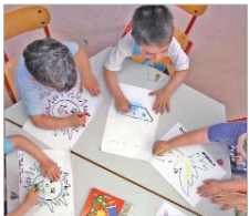
Bonificaciones para guarderías.

En este caso hay bonificaciones que oscilan entre el 75 por ciento y el 25 dependiendo de los ingresos económicos familiares y del número de familiares que asisten a la