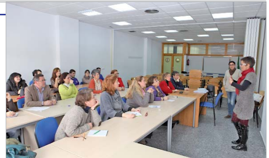
La edil de Participación Ciudadana presentó el taller.

Intervención, tuvo una duración de dos horas y contó con asistentes de diferentes colectivos como la Asociación de Alzheimer de La Rinconada, Flor de Jara, o Amigos del Sahara, entre otras.