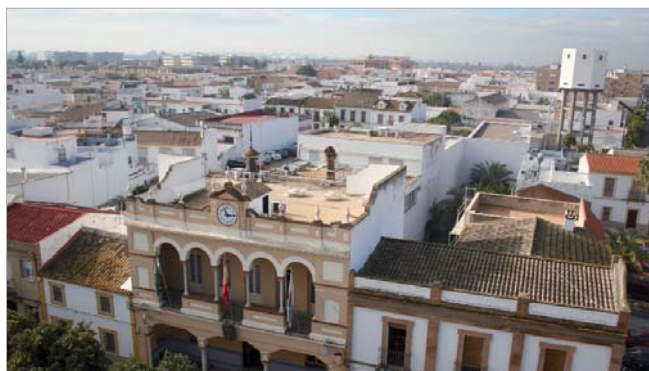
La Rinconada posee una presión fiscal de las más bajas de Andalucía y manteniendo las bonificaciones.