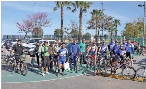
El pelotón salió desde el parque 8 de Marzo en dirección a Rinconada.

En esta edición han participado 3500 personas de un total de 15 marchas ciclistas provenientes de la práctica totalidad de las poblaciones del Área Metropolitana de Sevilla. Una