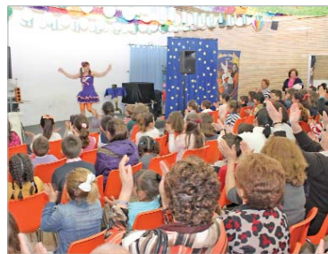
Hubo animación para los más pequeños.

El Centro de Día 'Pablo Picasso' ha organizado recientemente su primer encuentro Día de los Abuelos con el fin de "celebrar una tarde de convivencia entre los abuelos y