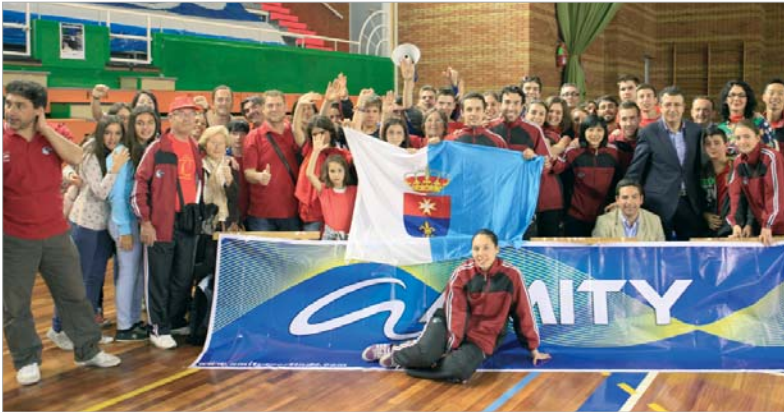
La familia deportiva del Soderinsa posó con las autoridades y sus aficionados después de terminar la final.

"El día que el Soderinsa no gane el Campeonato de España se empezará a valorar la gesta épica que ha conseguido para el deporte de La Rinconada". La frase, múltiples veces acuñada, a partes iguales por políticos, periodistas y aficionados, cobró ayer especial significado con la derrota, doce años después del mejor club de la historia del bádminton español. Después de una temporada aciaga, en la que las lesiones han desgastado enormemente a la entidad, el conjunto demostró su raza clasificándose para una nueva final y llegando vivo al partido de vuelta, pero la machada de conseguir un nuevo entorchado no fue posible ante el potencial deportivo del IES La Orden.