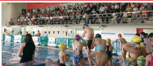
Las gradas de la Piscina Cubierta de La Rinconada vivieron una gran fiesta.

La Piscina Cubierta de San José fue el escenario elegido para la disputa de la Final del Campeonato Provincial de Natación, que reunió en La Rinconada a las mejores marcas del Circuito organizado de forma conjunta por la Diputación de Sevilla y la Federación Andaluza de este deporte, lo que hizo converger en el municipio a deportistas de 28 muni-