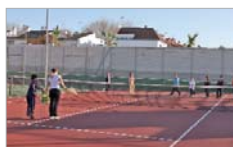
Deducciones en escuelas deportivas.

Novedad importante este año es la creación del bono de 5 usos para cualquier día de la semana, incluidos fines de semana y festivos, para uso