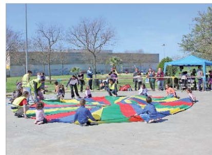
Parque 1 de Mayo, en el núcleo de San José.