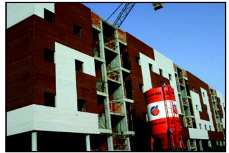
A buen ritmo marchan las obras de las 70 viviendas en régimen especial en venta en El Parque