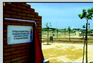
El Cañamo II: en torno a 150 empresas