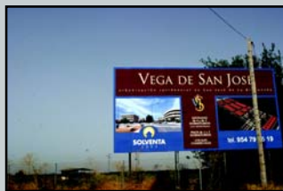
Secadero: 327 viviendas