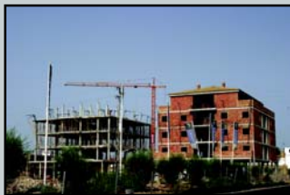
Lomas: 286 viviendas