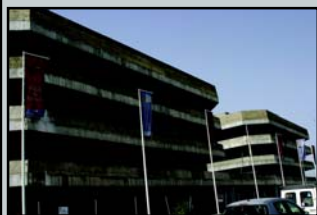
El Santísimo: 300 viviendas

Éstas son algunas de las más significativas actuaciones realizadas en el primer cuatrienio del PGOU; el paso de pueblo a ciudad.