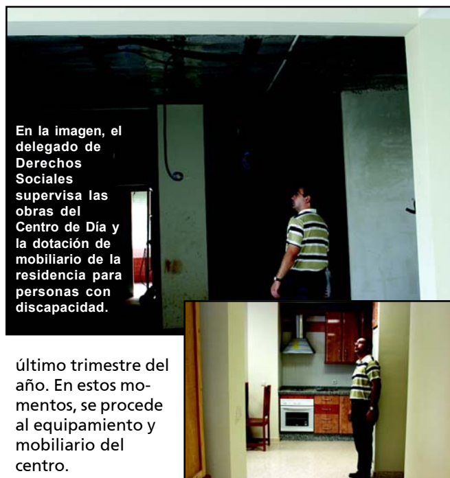
En la imagen, el delegado de Derechos Sociales supervisa las obras del Centro de Día y la dotación de mobiliario de la residencia para personas con discapacidad.