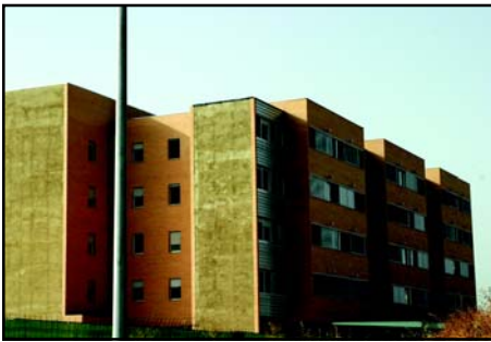
Los 46 pisos en venta en El Mirador se entregarán antes de final de año