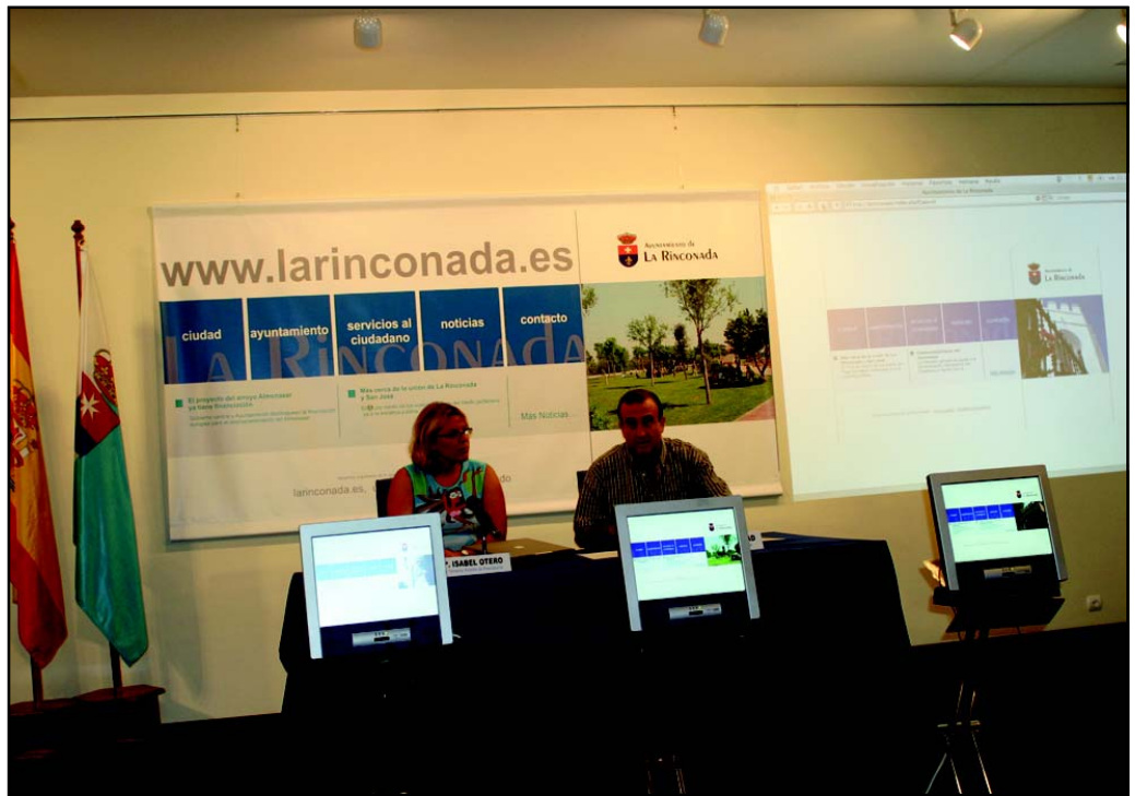
La presentación de larinconada.es tuvo lugar en la sala de exposiciones del Centro Cultural de la Villa, donde no faltaron las nuevas tecnologías ni tampoco una elevada representación de vecinos.