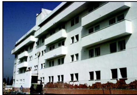
También para antes de final de año se entregarán los 55 pisos en alquiler en Santa Marta