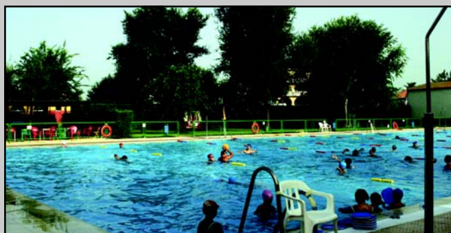
La piscina al aire libre de San José dispone de medidas olímpicas, con un vaso principal de 50 por 22,5 metros. La segunda piscina de la localidad se ubica en el núcleo de La Rinconada. Recientemente renovada, cuenta con unas dimensiones de 25 por 12,5 metros.

♦ SAN JOSÉ: Pabellón Fernando Martín, estadio Felipe del Valle, parque '8 de Marzo', polideportivo municipal, piscina pública al aire libre, complejo cubierto de piscinas.