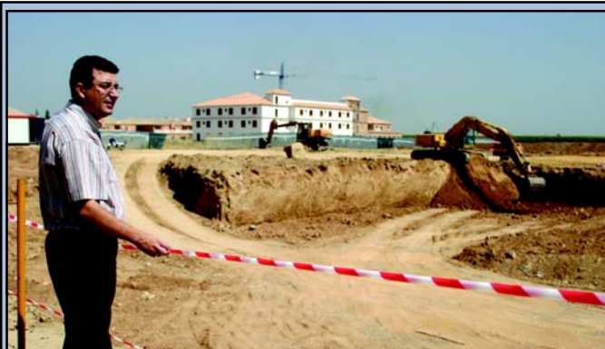
El delegado de Deportes supervisa la evolución de las obras de la futura piscina cubierta.