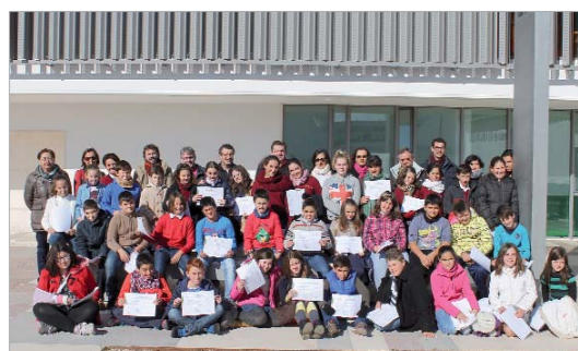
El alumnado preguntó al alcalde y al edil de Educación sobre la gestión local.