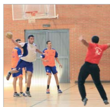
Imagen del duelo ante Lepe.