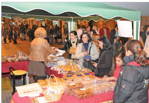
Los vecinos y vecinas disfrutaron de ofertas y descuentos en los negocios.