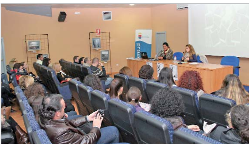
La delegada de Juventud clausuró el curso de fotografía.

Hasta el próximo 30 de diciembre, 'La Estación' acoge una muestra con las mejores instantáneas de los participantes