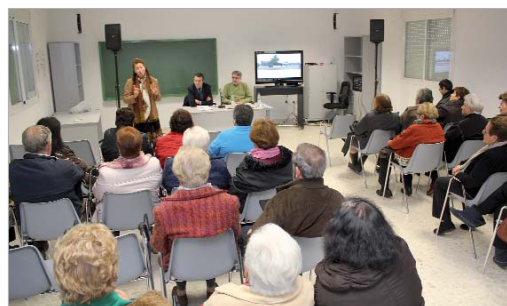
El Centro de Adultos fue el escenario elegido para presentar los proyectos.