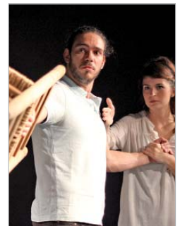
Viento Sur Teatro con 'El Rapto'.

En palabras de Gallardo: "Nuestros centros culturales son entes vivos que respiran, viven y progresan con cada