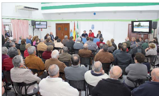
El Centro de Día '20 de julio' acogió uno de los actos.

Por último, Fernández y el resto de ediles de La Rinconada aclararon las dudas que presentaron los asistentes y aportaron más datos sobre la financiación de los diferentes proyectos, tanto con fondos propios, como los que tienen aportación económica de otras administraciones.