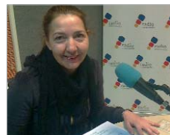
Se trata de la segunda edición.

Por segundo año consecutivo, el bar 'La Paraíta' organiza, con el apoyo del área de Bienestar Social del Ayuntamiento y la Asociación Parroquial 'El Olivo', una campaña para recoger juguetes para los niños y niñas necesitados del municipio. La Radio se hizo eco.