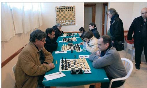
Imagen del duelo frente a Dos Hermanas C, que dio el pase al Play off .

El segundo y el tercer equipo lo tienen difícil para repetir la hazaña de sus mayores.