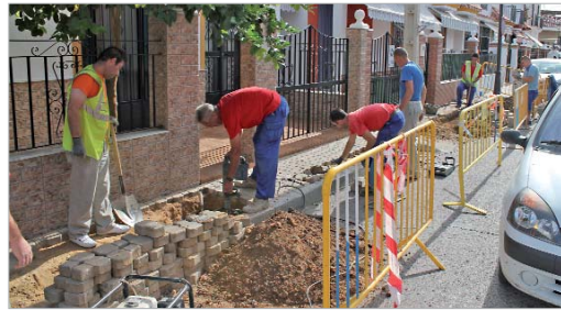
Operarios municipales durante los trabajos de adecuación del acerado.

titución total de la solería existente por otra nueva, junto con la realización de rebajes en los bordillos para facilitar a los vecinos y vecinas el acceso a las cocheras, actuaciones que forman parte de una regeneración integral de la zona en la que también se han reforzado los báculos de las farolas y se han instalado mangueras nuevas de cableado para subsanar aquellas anomalías detectadas en el alumbrado público.