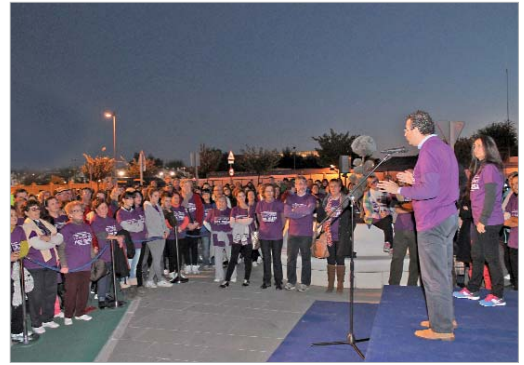
El primer edil y la delegada de Igualdad dirigiéndose a los asistentes.

La fuente de Emasesa se iluminó de color violeta durante tres días para reivindicar este día