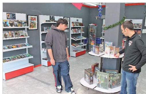
‘Venom Comics’ está ubicada en calle Madrid 94.

Además, la empresa ofrece como incentivo para fidelizar a sus clientes una tarjeta de socio