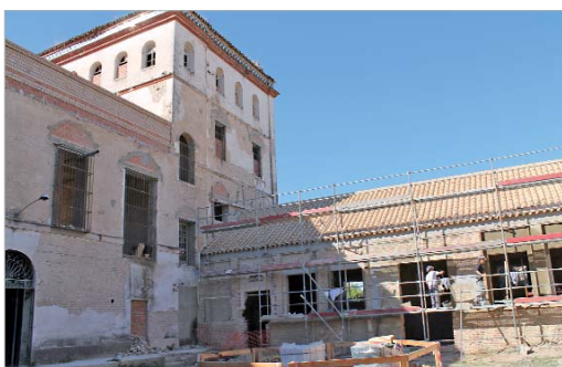
La Hacienda Santa Cruz, una de las principales actuaciones de la Legislatura.

Otra línea prioritaria es la de la atención a la juventud, desde una perspectiva de formación orientada a sectores emergentes y al mismo tiempo la activación de una de las medidas estrella, un nuevo Programa de Incentivos a la Contratación para Jóvenes en empresas privadas con el que el