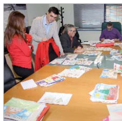
El jurado del Concurso de Dibujo.

se han repartido por los distintos establecimientos del mismo modo que en ediciones anteriores. También aparece el lema y el dibujo en las Cartas a los Reyes Magos que el área ha entregado a los comerciantes para que las repartan entre su clientela y que supone una de las novedades para reforzar una de las prioridades municipales de la actual Legislatura, que permite la creación y mantenimiento de puestos de trabajo en la localidad.