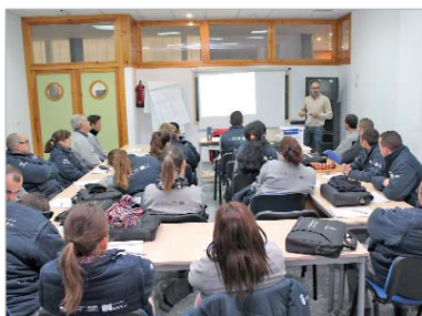
Los alumnos ahondaron en conceptos como el currículum.

'Recuperación de la Hacienda Santa Cruz' participaron recientemente en una jornada sobre búsqueda de empleo a través de Internet.