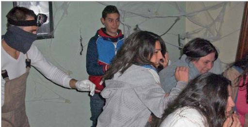
El último día se organizó la 'Casa del terror', una noche de sustos y diversión.

Finalmente, el último día se organizó la 'Casa del terror', una actividad en la que los jóvenes, voluntarios y monitores del área se caracterizaron para compartir una noche de sustos y diversión.