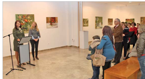
La edil de Cultura presentó a la pintora a los asistentes.