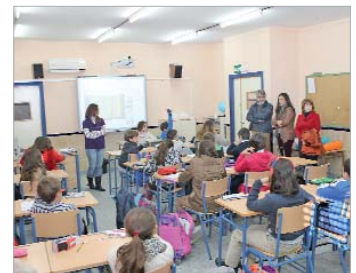
Campaña de sensibilización en los colegios locales.