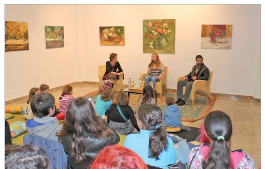
La delegada de Cultura acompañó a la autora y al dibujante en la presentación.

QR que permite acceder a las imágenes reales de esta edificación musulmana.