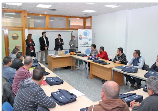
El alcalde y la edil de Empleo acompañaron a los alumnos en su primer día.

Además, esta acción formativa tiene un compromiso de contratación, como mínimo, del 60 por ciento de los alumnos que resulten aptos por un período de al menos 6 meses, ya que "Magtel nos ha manifestado la necesidad de incorporar a su plantilla a técnicos cualificados en este sector por lo que debéis aprovechar