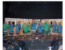
Uno de los grupos participantes.