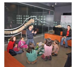
Imagen del Museo.

Por otro lado, el 4 de enero se desarrollará un cuentacuentos en la que los más pequeños viajarán al pasado de La Rinconada