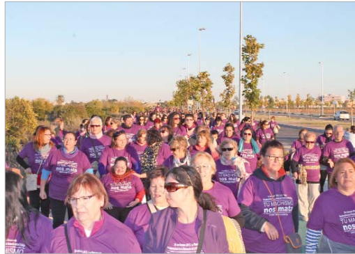
Los vecinos y vecinas del municipio recorrieron la Avenida de La Unión.

Tras el acto se guardó un minuto de silencio por las 45 mujeres asesinadas en España en lo que va de año.