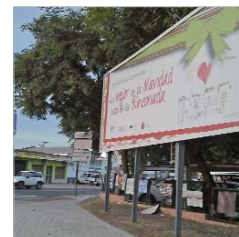
La valla publicitaria luce la campaña.

En palabras del edil del ramo, Sergio Padilla, "queremos que los vecinos y vecinas del municipio