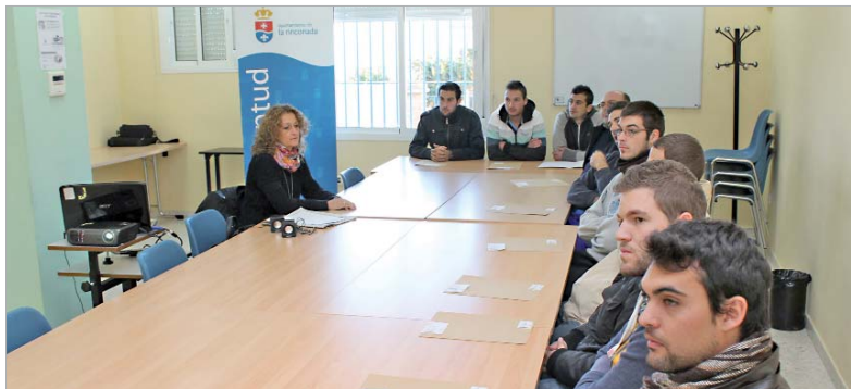
Los estudiantes recibieron información sobre búsqueda de empleo, formación ocupacional, becas o emprendimiento.

Durante tres días, los alumnos han acudido al centro joven 'La Estación' para recibir