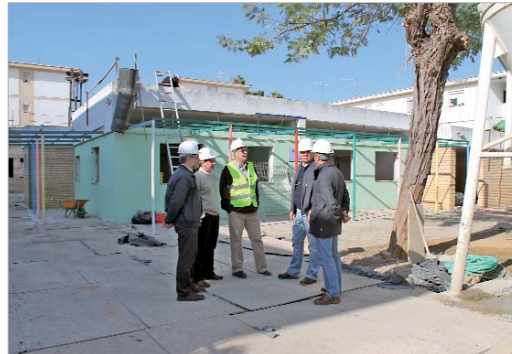
Los ediles de Urbanismo, Vía Pública y Educación visitaron las obras.

escolar reformado y modernizado. Además, hemos mantenido reunio-