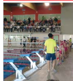
Desfile inaugural en la Piscina.