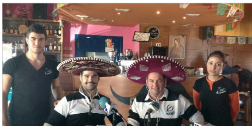
La Estación Rugby Club fue la protagonista en 'El Rincón del Mariachi'.

La Tertulia Deportiva sigue creciendo en lo que a seguidores se refiere. La mezcla entre la buena gastronomía y la actualidad de los clubes deportivos del municipio sigue siendo una fórmula que da resultado y que gusta a la audiencia