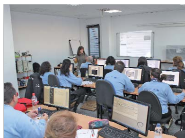
Integrantes del taller de empleo de nuevas tecnologías.

Durante dos horas, los participantes conocieron el amplio abanico de posibilidades que ofrece la Red a las personas en situación de desempleo o de mejora de empleo, propiciando así el acercamiento a las nuevas tecnologías de la información y la comunicación que cada vez tienen mayor preponderancia a la hora de realizar las gestiones administrativas de la vida diaria.