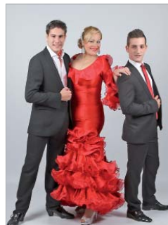
'Sueños de un pueblo'.

unipersonal de Nu cabaret con 'The Lovers' y finalizarán Los Hers con 'La Vida de los muertos', lo que a priori parece un