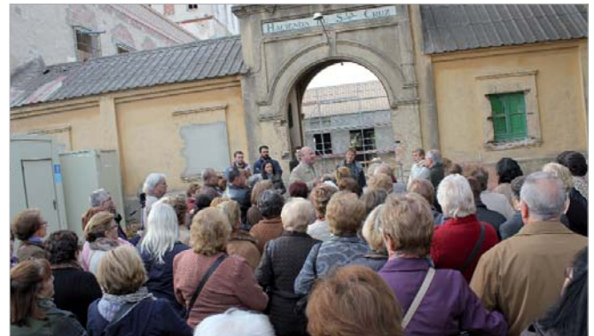
Imagen de la visita a la Hacienda Santa Cruz, que se convertirá en un gran espacio para la cultura.