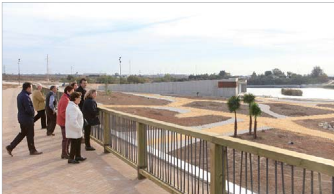
Los visitantes observan desde el mirador la lámina de agua del futuro parque de Las Graveras.