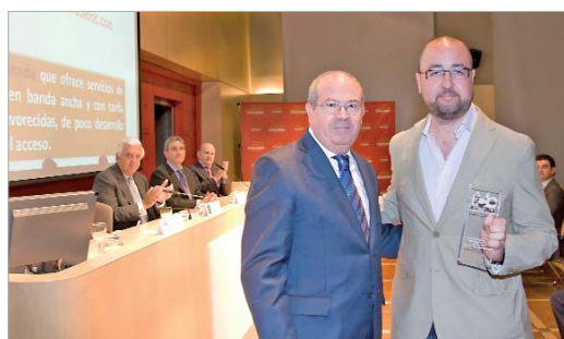
Reconocimiento a ‘Redes TLC’ como finalista del III Premio Cinco Nueves.