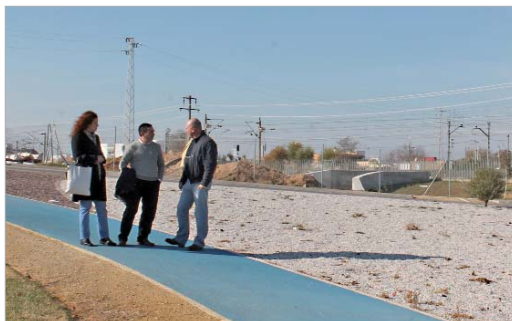
Los ediles de Hacienda, Urbanismo y Vía Pública visitaron la ubicación del carril.

Se espera que a principios de enero se inicien los trabajos que suponen la continuación del carril bici del paseo del Almonazar hasta el Cañamo 3, a través de la inca, y que bordeará el Skate Plaza para llegar hasta el futuro parque de Las Graveras, un pulmón verde de 15 hectáreas que estará disponible para la ciudadanía el próximo año. Serán alrededor de 300 metros de carril bici que se