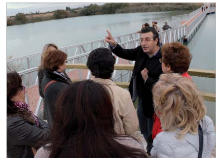
El primer edil explica las posibilidades de la lámina de agua.