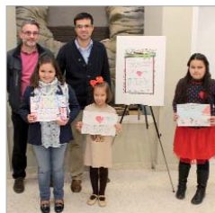
Las ganadoras del Concurso de Dibujo.

sociales con el lema 'Lo mejor de la Navidad está en La Rinconada', acompañado del dibujo que resultó elegido en el I Concurso Escolar desarrollado por la concejalía. Esa iniciativa, que supone una dinamización en sí misma y que ha servido como nexo en común y eje conductor del resto de acciones, se encuentra presente en las vallas publicitarias, carteles y bolsas, que