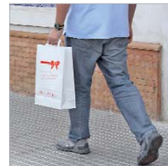
Los comerciantes reparten bolsas.