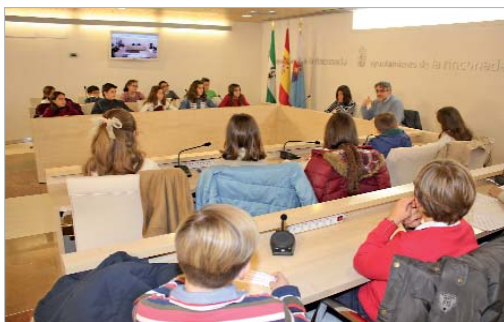
El salón de plenos acogió a alumnos y alumnas de 5º y 6º de Primaria.

"El estar hoy aquí sentados debe servirnos para que valoréis la importancia de la participación democrática, la reflexión, el análisis de los conflictos y el debate constructivo, así como para inculcaros valores y actitudes sociales que os permitan contribuir de manera activa a la mejora del municipio en el futuro", destacó el delegado de Educación, Antonio Marín.