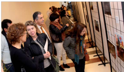
Los asistentes visitaron la muestra fotográfica expuesta en el Consistorio.

que La Rinconada está hermanado, el mantenimiento de la guardería Atachiarare en Togo, dotación de material sanitario para el hospital San José de Ludzi en Malawi, equi-