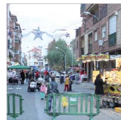
El Mercadillo de la calle Córdoba.

tomen conciencia de que en La Rinconada pueden encontrar todo lo que necesitan para sus compras navideñas a precios tan competitivos como en la capital, estimulando así el comercio local en una de las fechas más señaladas por los empresarios y profesionales del sector". En este sentido, el responsable municipal destacó que "se trata de que los ciudadanos entiendan que comprar en La Rinconada genera un valor añadido que se queda en el municipio y repercute directamente en el mantenimiento