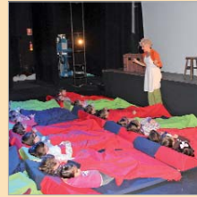
Uno de los espectáculos.

"Educar desde la infancia en el amor al teatro y a todas sus disciplinas artísticas creará a los artistas, autores, directores y público del futuro y permitirá que la cultura siga creciendo y avanzando. Uno de los pequeños que vino a ver