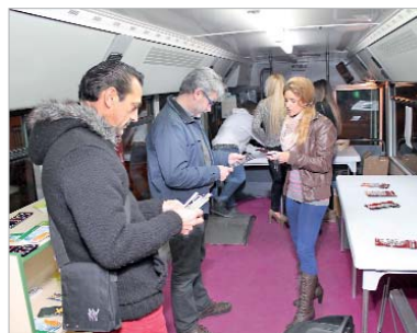
Los delegados de Educación y Juventud en el bus.

Por otro lado, dentro del Programa de Ciudadanía y Fomento de la Convivencia del área de Juventud, se han organiza-