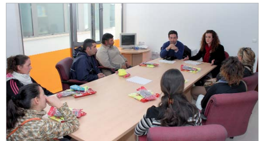
Los ediles de Empleo y Vía Pública se reunieron con los trabajadores.

Las tareas que estos trabajadores desempeñarán consisten en la vigilancia del correcto mantenimiento y limpieza de zonas verdes, parques y jardines del municipio, así como la tarea de concienciación ciudadana