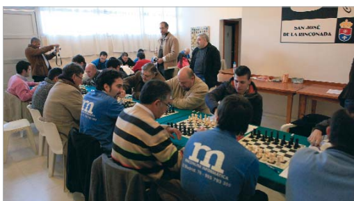
El Rinconline perdió con Tiempo y Mente (2-5) pero le bastó para subir.