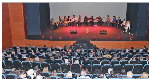
El Centro Cultural de La Villa acogió esta fiesta tradicional.