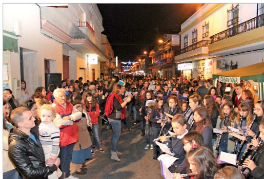
La animación infantil y musical no faltó durante los 3 días del mercadillo.