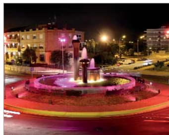
La fuente de Emasesa iluminada durante la noche.