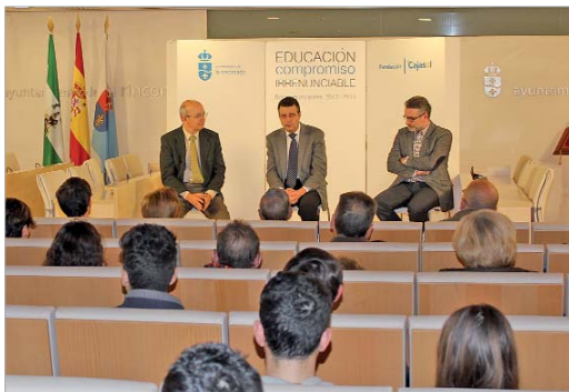
El alcalde y el edil de Educación animaron a los becados a seguir estudiando.

En este año se ha aumentado el importe de las becas pasando de 300 a 400 euros, así como el número de becados que llega a los 80. En total 32.000 euros en ayudas cofinanciadas por el Gobierno Local y la Fundación Cajasol con la que recientemente se firmó un convenio de colaboración.