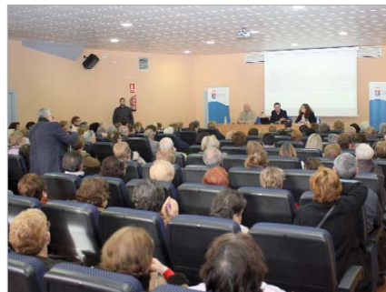
Antes de la visita, los asistentes se dieron cita en La Estación.