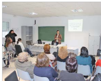
Taller sobre cómo detectar el maltrato sutil.