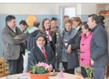
Una muestra recoge sus trabajos.

dad tales como pulseras, collares, cuadros, jabones o jardineras, entre otros.