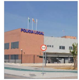
Central Mixta de Seguridad.