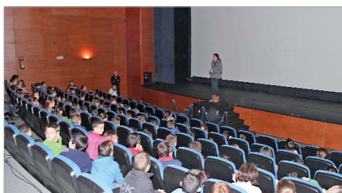
La Villa acogió la proyección de la película de animación 'Rompe Ralph'.