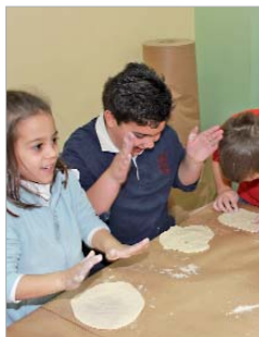
Los pequeños cocinando en Navidad.

"Esta iniciativa ofrece una oportunidad para que los chavales disfruten de su tiempo libre en Navidad compartiendo juegos, actividades lúdicas y diversión junto a otros niños y niñas de su edad, hagan nuevos amigos o simplemente combatan el aburrimiento de quedarse en casa", tal y como apunta la responsable de la concejalía,