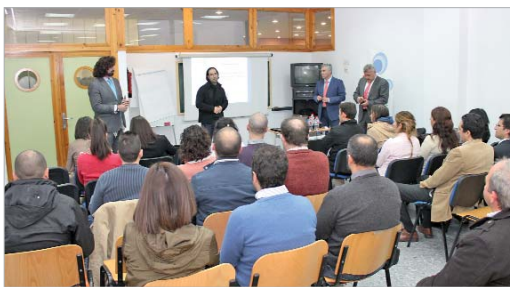
El seminario tuvo lugar en el Centro de Formación 'Juan Pérez Mercader'.

Así, durante la primera hora los participantes recibieron información sobre la aplicación del nuevo régimen fiscal, las operaciones sujetas a él, el devengo del impuesto en las facturas expedidas, las obligaciones formales de los destinatarios de las operaciones o la contabilidad del