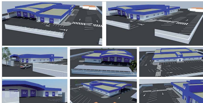
Recreación virtual de la ITV una vez finalizadas las obras.

de las puertas de entrada y salida a la parcela; realización de una nueva distribución de equipos en las líneas de inspección L1, L2 y L3; reubicación de los aparcamientos cubiertos y ejecución de unos nuevos; aplicación de una capa de regularización en la solera de la nave existente y reurbanización de la parcela.