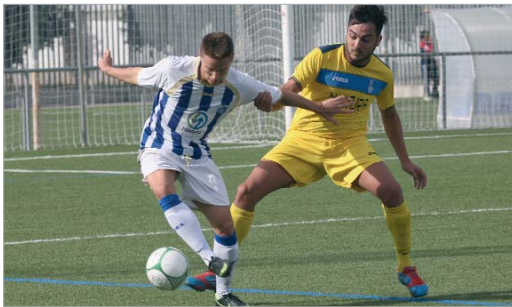
Emi trata de llevarse un balón ante la presión de un jugador del Huévar.