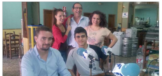
El Club de Tenis de Mesa San José estuvo en 'Pizzburger Nano's'.