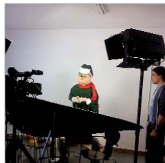
Un video de Navidad promocional.