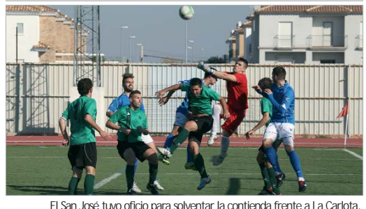
El San José tuvo oficio para solventar la contienda frente a La Carlota.