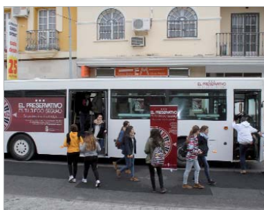
Un autobús informativo visitó los institutos.

"Con esta campaña buscamos concienciar a los jóvenes para que entiendan que si no usan protección ellos pierden. Así, el 80 por ciento de los nuevos casos de sida en España se producen por no tomar medidas de prevención, además unas 11.000 adolescentes se quedan embarazadas al año por no usar o usar mal los métodos anticonceptivos, mientras que las enfermedades de transmisión sexual crecen entre los más jóvenes", señala el delegado de