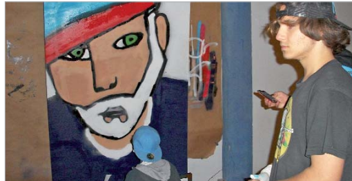
Graffitis, nuevas tecnologías o conciertos se dieron cita en esta edición.