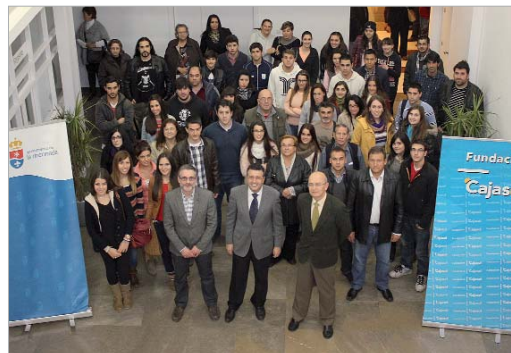
Foto de familia de todos los beneficiarios de la ayuda.

Estas becas pretenden ser una ayuda al transporte y adquisición de materiales y ayuda al estudio, así como complementar las que en su caso hubieran desarrollado el Ministerio de Educación y Cultura y la Consejería de Educación de la Junta de Andalucía.