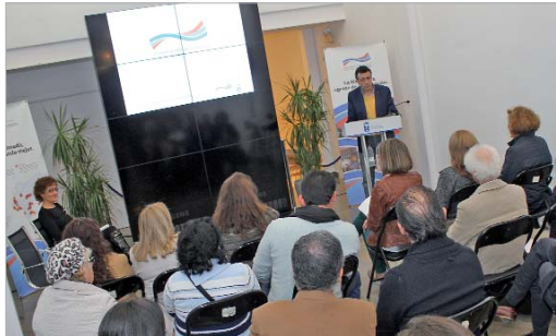
El Ayuntamiento acogió la entrega de las ayudas a los colectivos.

"De lo que se trata es de mejorar la calidad de vida de personas que viven en situaciones de extrema pobreza y no tienen acceso a una educación básica o medicamentos, proyectos que pueden salvar vidas de niños y mujeres", señaló la delegada de Cooperación Internacional,