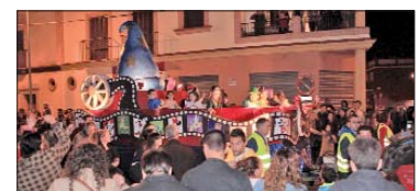
Todos los asistentes, independientemente de su edad, se lo pasaron en grande durante el recorrido.