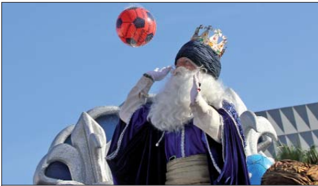
El rey Melchor lanzó infinidad de juguetes, entre ellos muchos balones, que se repartieron a los pequeños de la localidad.