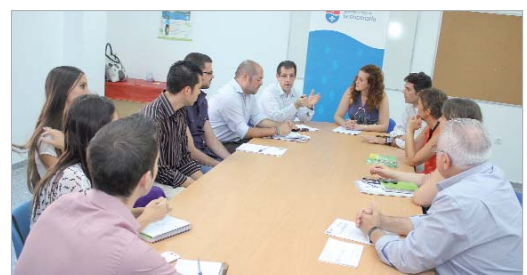
La delegada de Empleo con los agentes de la innovación y empresas.

"De lo que se trata es de lograr un desarrollo sostenido de los servicios