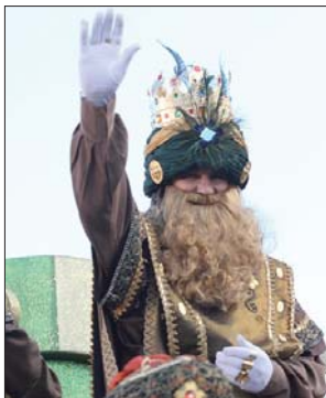
El Rey Gaspar saluda a los pequeños y mayores que había en el recorrido.