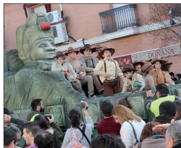
La carroza de Tadeo Jones estaba perfectamente caracteriza y a sus integrantes no le faltaba un detalle.