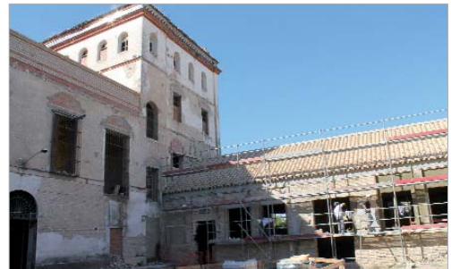
Escuela taller de Rehabilitación Hacienda Santa Cruz.

Además, se continúa con la orientación para la inserción, se incrementan las becas formativas en un cincuenta por ciento, sube el gasto en recursos humanos como "protección y defensa del empleado