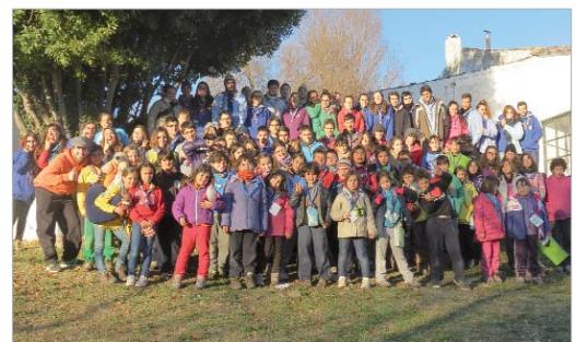
Se reúnen en el antiguo centro de Torreparedones los sábados.