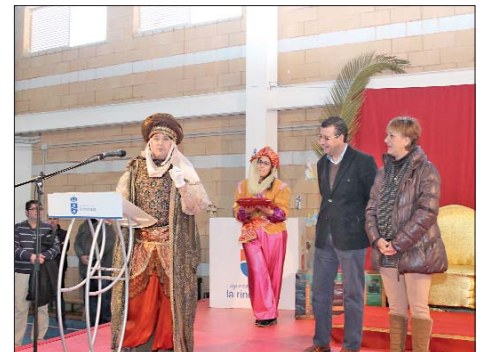
La Agrupación de Vecinos de la calle Santiago se encargó de organizar los actos conmemorativos del Visir Real en San José.