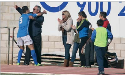
Manu empieza a convertirse en el rematador que necesita el equipo.

El San José ha dejado atrás, con la llegada de Maldonado al equipo, los puestos de descenso en la tabla y, a pesar de que la igualdad en el grupo 2 de