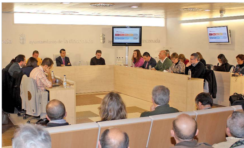
Pleno extraordinario en donde se aprobaron los presupuestos municipales para 2014.

"por mucho que pretendamos tener una determinante influencia en generar oportunidades y proponer soluciones no podemos aislar a La Rinconada de la situación de crisis internacional que vivimos ni de