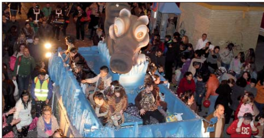
La carroza de Ice Age repartió ilusión durante todo el recorrido, haciendo las delicias de pequeños y mayores al paso de la Cabalgata.