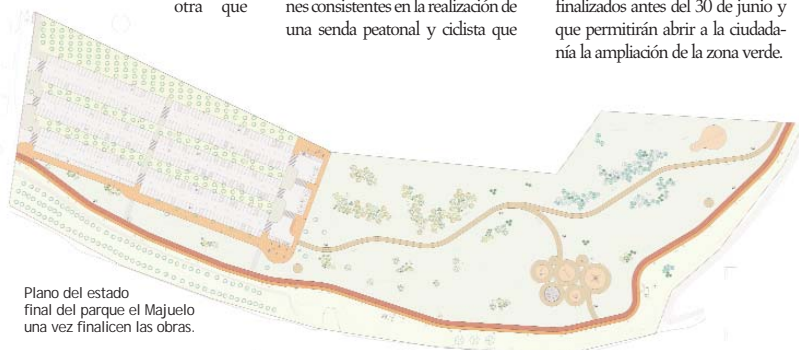
Plano del estado final del parque el Majuelo una vez finalicen las obras.