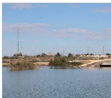
Parque de Las Graveras.

A pesar del fin del proyecto Feder Integraverde, el Ayuntamiento mantiene su carácter inversor. Así, verá la luz el Eje del Agua, que conectará definitivamente, a