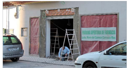
Farmacia Carretera Nueva.