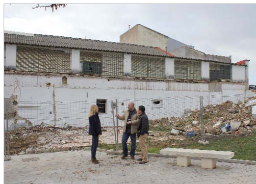
Los ediles de Urbanismo, Vía Pública y Cultura visitaron las obras.

La nueva Casa de la Música se convertirá en la sede de la Banda de Música y la Escuela Cristo del Perdón. Las actuaciones