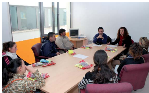
Los edificios de Empleo y Vía Pública en una reunión con las Patrullas Verdes.

de Urgencia Municipal, 203.000 euros, el PAC, 209.000 euros, el Plan Municipal de Empleo Joven, dotado con 100.000 euros, dos actuaciones PER, el de garantía de renta, con 730.000 euros, el Plan de Fomento de Empleo Rural Estable, con un presupuesto de 250.000 euros. Continúan los dos talleres de empleo, de casi un millón de euros, de respuesta social a la dependencia.