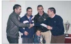
El conjunto de Temasi fue tercero.