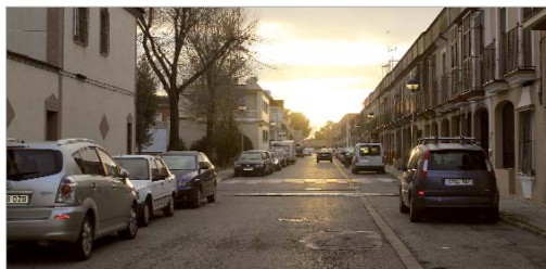
Calle Hermanos Pinzones.

Tras concluir los trabajos de canalización y cableado del alumbrado público en la calle Abeto, el área de Vía Pública está realizando trabajos de reacondicionamiento del alumbrado público en la calle Hermanos Pinzones y zonas aledañas con el objetivo de subsanar algunas averías y cortes de luz detectados en la zona.