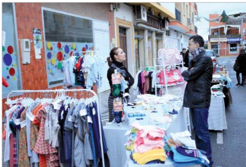
El edil de Comercio visitó a los comerciantes de la calle Málaga.