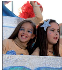
Dos protagonistas de La Sirenita.