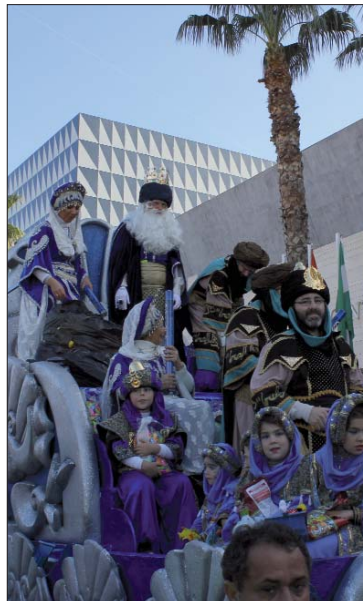
El Rey Melchor; al poco de producirse la salida en San José, junto al Centro Cultural de La Villa.