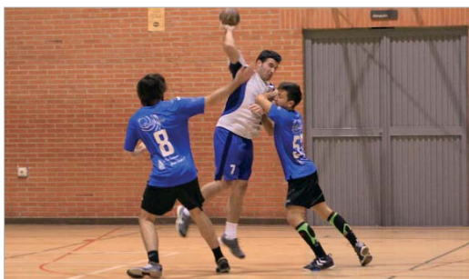
El Fernando Martín acogió la disputa de la primera jornada de Liga.