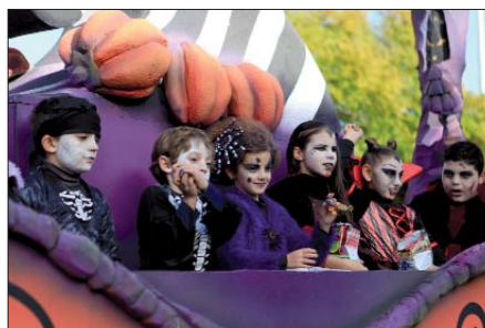
El terror y el miedo también estuvieron presentes en la Cabalgata de Reyes con la carroza de 'Halloween'.