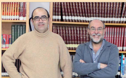
Los bibliotecarios de San José posan para las cámaras de TN.

En esta ocasión el proyecto ganador ha sido 'La casa de las palabras. Érase una vez dos hermanos...' en el que además de recoger parte de las actividades