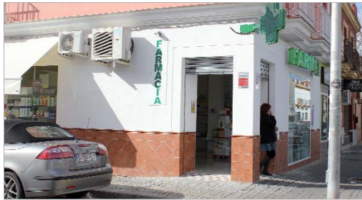
Farmacia ubicada en El Mocho.

calle El Mocho y en breve abrirán sus puertas las de Carretera Nueva