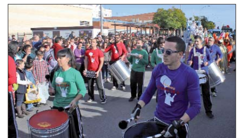
La compañía Majareta amenizó el global del recorrido con distintas actuaciones que hicieron las delicias de los asistentes.