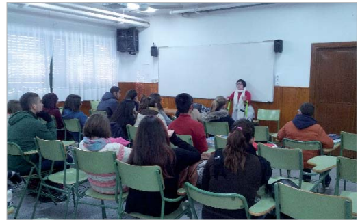
Los niños y niñas disfrutaron de juegos.