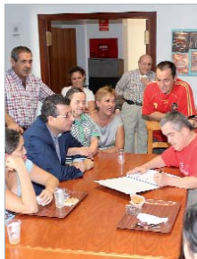
Usuarios del Patronato.

Bienestar Social y Atención a la Discapacidad vuelven a incrementar su presupuesto con respecto a 2013 y disponen de 4 millones de euros (+4%). Se revalida el apoyo a las entidades sociales en todas las áreas de influencia ciudadana como educación, depor-