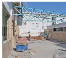
Colegio La Paz.

través del Paseo del Almonazar y de la Avenida de La Unión, el Parque de Las Graveras, que finalizará su inversión de más de 2 millones de euros en el primer cuatrimestre del próximo año, pero también la ampliación del Majuelo, la finalización de las obras que recientemente han sido reanudadas por la Confederación Hidrográfica del Guadalquivir para la culminación de las obras complementarias en el Arroyo Almonazar consistentes en la adecuación de las vías verdes, la inca y la consolidación de las estaciones de bombeo. En el ámbito de la Cultura, destaca la nueva Casa de la Música que