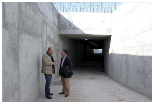
Los edificios de Urbanismo y Vía Pública junto a la inca o paso subterráneo.