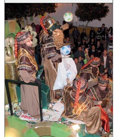
El Rey Gaspar dejó a su paso un reguero de caramelos de gominolas, balones y demás juguetes.