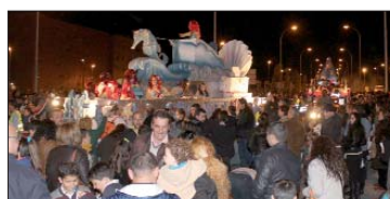
La llegada de la comitiva a La Rinconada a través de la Avenida de La Unión, una imagen para el recuerdo.