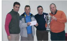
BMW San Pablo Motor.