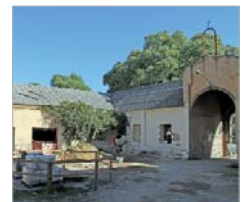
Hacienda Santa Cruz.

Santa Cruz. Por otra parte, se añaden los huertos ecológicos para mayores, la construcción del futuro Colegio Público, adecuamiento de las zonas de esparcimiento en la entrada del núcleo de La Rinconada, la remodelación del parque de la Barriada La Estacada, o el arreglo de caminos rurales y la ampliación de la red de carriles bici. En esta línea de apuesta pública y en coordinación con otras Administraciones aunque no formen parte de estas cuentas es imprescindible resaltar la remodelación del colegio La Paz, actualmente en obras, así como la próxima licitación en materia de Medio Ambiente por