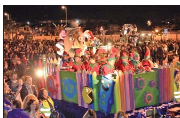
La carroza de Juguetilandia permitió el disfrute de los pequeños que iban sobre ella, y de sus padres y madres.