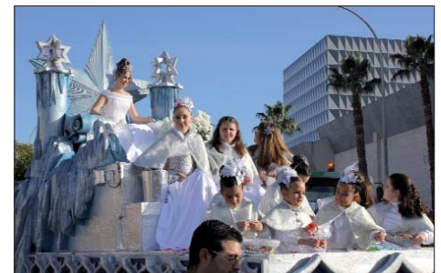
La Estrella abrió la comitiva acompañada de su séquito de pequeñas princesas y guió al resto de carrozas durante el recorrido.