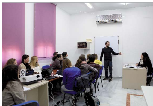
Los participantes han mantenido reuniones informativas sobre el corto.

para relaciones de desigualdad, o detectar el grado de conciencia que los jóvenes tienen sobre la