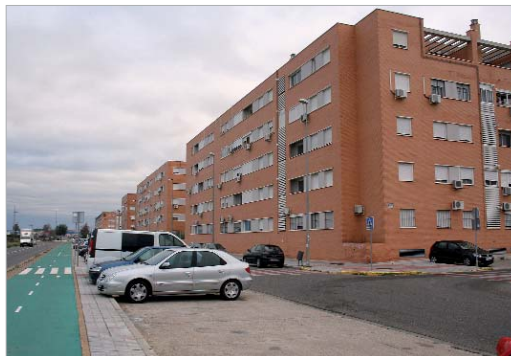
Las viviendas se encuentran ubicadas en la urbanización El Mirador.

exige el PIMA para ofrecerles esta posibilidad. El alcalde de La Rinconada, Javier Fernández, ha destacado al respecto que "desde el Gobierno de España se han retirado