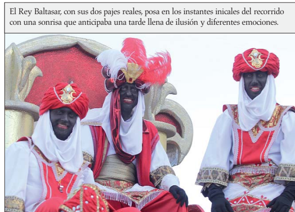
El Rey Baltasar, con sus dos pajes reales, posa en los instantes iniciales del recorrido con una sonrisa que anticipaba una tarde llena de ilusión y diferentes emociones.