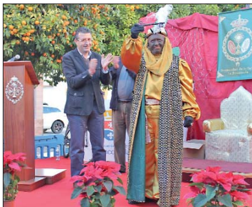
El Visir de La Rinconada estuvo organizado por el Grupo Joven de la hermandad de la Salud.