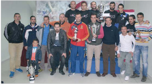
Foto de familia con todos los galardonados en la VII Liga de Veteranos.