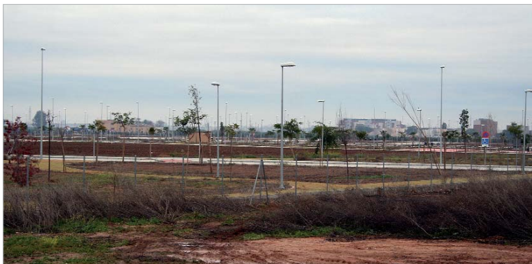
Los huertos de San José están ubicados en una parcela contigua al cementerio.

junio. Así, después de que el Ayuntamiento llevara a cabo los procesos pertinentes para habilitar