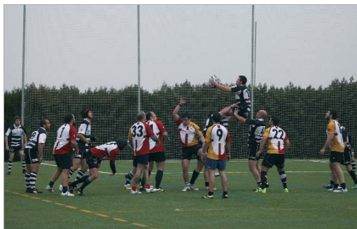
Uno de los instantes del duelo entre La Estación y el Mezquita Córdoba.

conjunto gaditano, y ante el Mezquita de Córdoba que empezó más fuerte y tomó una renta en el marcador que, a la postre, fue insalvable para los de German Camino, que terminaron encerrando a su rival para apurar sus opciones, si bien no lograron mover el tanteo de 3-15.