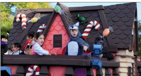
Los integrantes de La Casita de Chocolate se lo pasaron en grande durante todo el recorrido. Lástima que el decorado no fuera comestible. Parecía riquísimo.