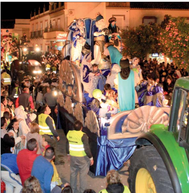
La llegada de la comitiva a la Plaza Rodríguez Montes concentró a los tres Reyes Magos rodeados de pequeños y mayores para recoger los regalos que quedaban en las carrozas.