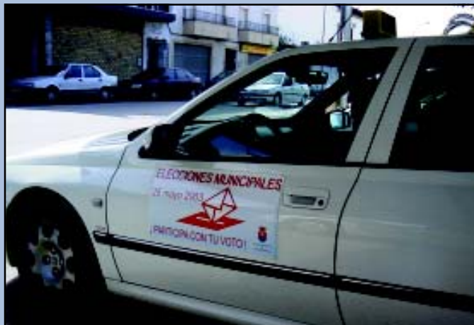
La incentivación a la participación democrática viaja ahora con los taxis.

Esta línea de actuación ha sido calificada por el primer