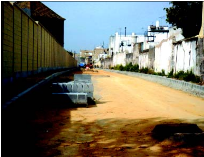
Dos imágenes de las obras correspondientes a la nueva arteria que aliviará la congestión de tráfico del casco histórico de San José. Esta vía llevará el nombre de Los Azucareros, como testimonio del importante número de trabajadores que han pasado por la empresa que hoy dirige el grupo Ebro-Puleva desde la fundación de la misma, el siglo pasado.

La arteria Los Azucareros ha supuesto una inversión superior a 300.000 euros, financiados desde los Planes Provinciales para obras y servicios del ejercicio económico de 2002.