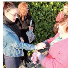
Flor de Jara en la calle Cultura.