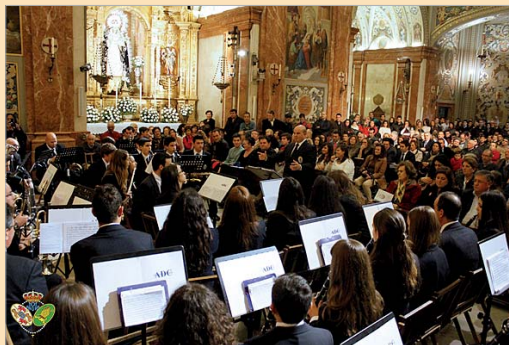
Concierto en la Macarena. Autoría: NHD* Sandra Arenas.

La Hermandad celebra cada año un ciclo de conciertos de marchas procesionales y en el que participan las mejores bandas de la Semana Santa sevillana. Todo un