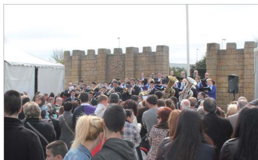
La Banda Municipal y la Coral entonaron el himno de Andalucía.