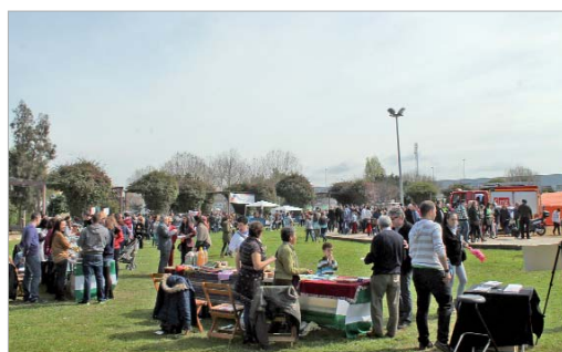
Diversos colectivos expusieron sus trabajos en una zona del parque.