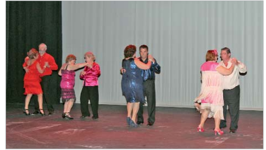
Los participantes demostraron lo aprendido en los talleres de baile

Fernández destacó que "ver como los mayores pierden la vergüenza y demuestran su arte en este certamen delante de amigos y familiares es para nosotros un orgullo y un ejemplo a seguir y nos impulsa desde la concejalía del Mayor a continuar desarrollando nuevas propuestas que mejoren su calidad de vida y contribuyan a un envejecimiento activo". En este sentido se pronunció también la delegada territorial, quien insistió en los beneficios de los programas de envejecimiento activo. "Refuerza su autonomía personas a la par que reduce su dependencia, a la par que refuerza la cooperación entre generaciones que traducido resulta más calidad de vida y mejor imagen ante la sociedad".