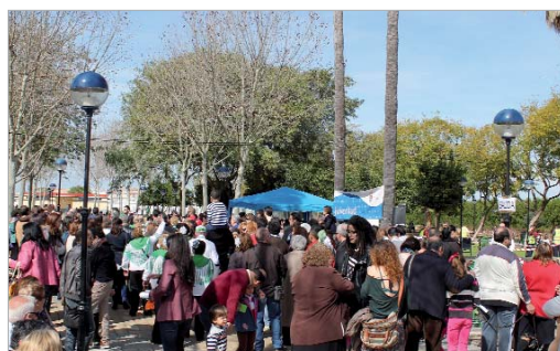
Un numeroso público participó en las actividades propuestas.