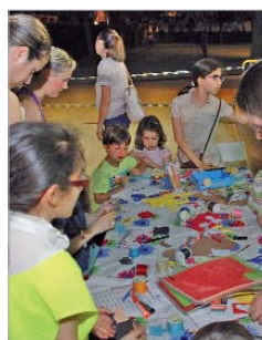
Talleres del Club Diversia.

"Diversia sigue siendo un reclamo excepcional para inculcar en nuestros jóvenes que hay