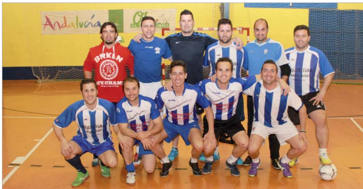
El Resurrexit en la presente campaña tiene muchos viejos conocidos del deporte rinconero.

El Resurrexit es el equipo más antiguo de cuantos compiten en la Liga Local de fútbol sala.