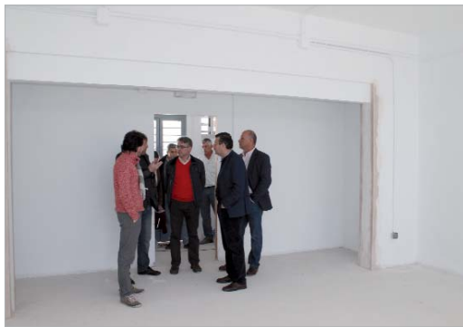
El alcalde y los ediles de Educación y Urbanismo visitaron las obras junto con miembros del Ampa y del centro.

ción integral de los aseos del centro, la revisión y mejora de la impermeabilización de las cubiertas, suelos, la sustitución de placas de fibrocemento de las mismas y la sustitu-