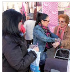
La asociación Azahar en el Mercadillo.