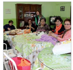
Mujeres Progresistas 2000.