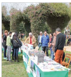
Uno de los stands del parque.

Un año más el parque de la Dehesa Boyal, fue el escenario escogido para celebrar en La Rinconada el Día de Andalucía. A lo largo de todo el recinto, se distribuyeron diferentes espacios donde grandes y pequeños pudieron disfrutar de distintas actividades. Torneo de ajedrez, bailes, lanzamiento en tirolina, reciclaje, marionetas, cuentacuentos, batuka y distintas modalidades deportivas salpicaron todos los rincones del la