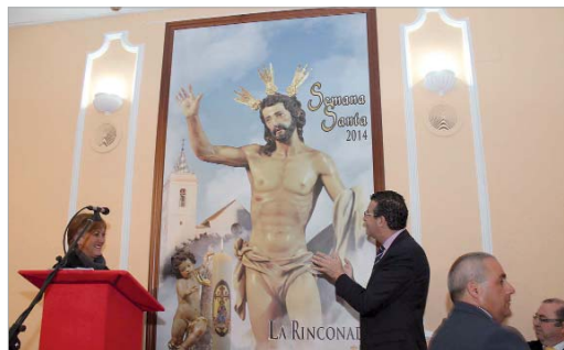
El alcalde y la edil de Fiestas Mayores descubrieron el cartel.

cartel que ilustrará la Semana Santa rinconera como el nombre de la persona encargada de glosar en su pregón sus recuerdos, vivencias y emociones vinculados a la Semana de Pasión de la localidad.