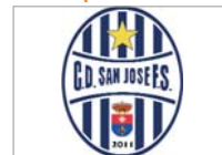
C.D. San José Fútbol Sala

El conjunto cañamero no cesa en su empeño de acercarse a los puestos de ascenso a Tercera Nacional, a pesar de tenerlo difícil por las diferencias de puntos con los líderes de la tabla.