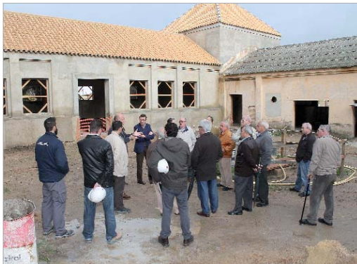
El Centro de Interpretación del Agua se ubica en las alas norte y este de la Hacienda.