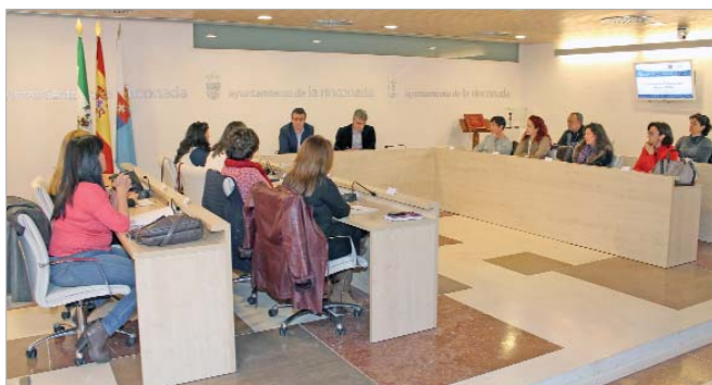
El alcalde y el edil de Educación se reunieron con las Ampas en el Ayuntamiento.

Para este año, el área de Educación cuenta con un presupuesto de 1,7 millones de euros con un importante refuerzo en becas de comedor, de material infantil y universitarias, así como, la de Ampas y centros educativos. También se incrementa en un 20 por ciento el mantenimiento de centros educativos y se mantiene el servicio de auxiliares de apoyo Infantil. Asimismo destaca el nuevo colegio de Infantil en el núcleo de Rinconada, en obras en estos momentos, que estará listo para el curso que viene, y cuyo coste asume el Ayuntamiento, cerca de un millón de euros.