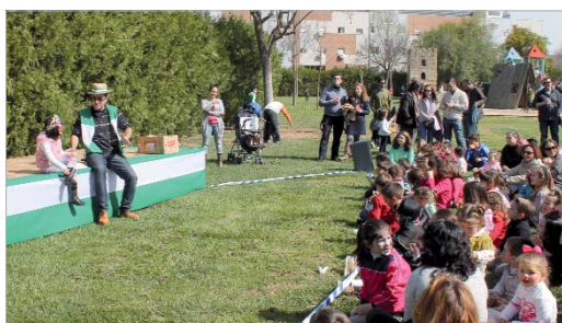
Hubo sesión de cuentacuentos.