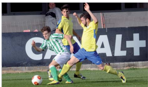
El joven futbolista rinconero se ha ganado a pulso una oportunidad.