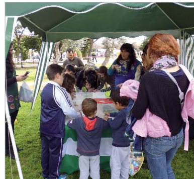
Ecoeduca explicó el proyecto en el 28-F en el Dehesa Boyal.

Los itinerarios estarán debidamente acotados mediante señalética horizontal y vertical