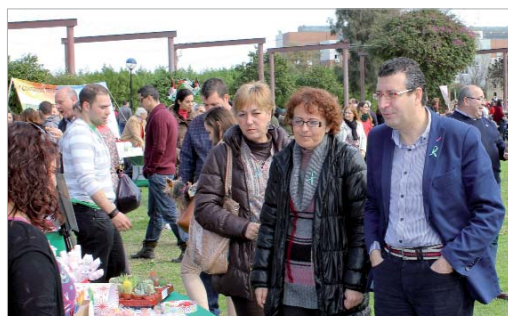
El alcalde y las ediles de Fiestas Mayores y Participación en el parque.