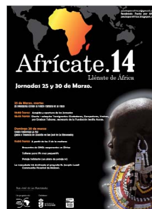
Cartel anunciador del Afrícate 2014.

nos...". Por otro lado, el domingo 30, a partir de las once de la mañana, el Centro Comercial la Paz y su entorno albergarán el encuentro anual de ONG's con proyectos de cooperación en África. También tendrán lugar diferentes talleres infantiles y un potaje solidario del que todos los asistentes podrán disfrutar por el precio simbólico de un euro. Como viene siendo habitual, todo lo recaudado en esta jornada irá destinado al proyecto que Pacto por África desarrolla en el hospital St. Joseph en la región de Luzzi, en Malau.