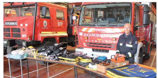
Nueva dotación entregada por la Diputación de Sevilla