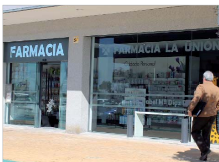
Farmacia de la Avenida de la Unión, cerca del Centro de Seguridad