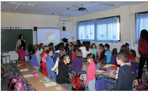
SuperLola se proyectó en los distintos centros de Infantil y Primaria de la localidad.

Con motivo del 8 de Marzo, Día Internacional de las Mujeres, el área de Igualdad ha puesto en marcha un amplio programa de actividades que involucra a colectivos del municipio, centros educativos y a la sociedad en general.