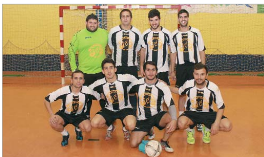
La plantilla del Tapeando Sí o Sí posa para TN antes de un encuentro.

El actual campeón de la Liga Local, La Estacada, sigue firme en su camino a un nuevo título. De momento, ganó a Boca Junior, su perseguidor, y ningún equipo de División de Honor es capaz de seguir sus pasos.