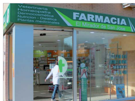
Farmacia de calle Ermua esquina con Jardín de las Delicias