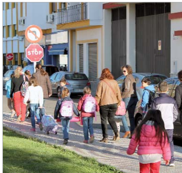
Alumnos y alumnas de camino a clase.

La idea consiste en el establecimiento de itinerarios seguros y adaptados a los escolares que les permitan desplazarse desde su vivienda hasta el centro de estudios sin la necesidad de usar vehí-