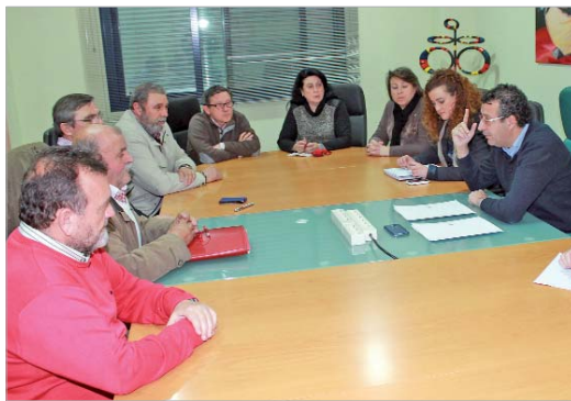
El alcalde y la edil de Empleo junto con los representantes sindicales.

Los representantes sindicales expresaron su respaldo a este plan que promueve el abaratamiento de la contratación de jóvenes de entre 18 y 39 años de la localidad, en una línea de incentivos directos del Ayuntamiento a empresas privadas que inserten a personas desempleadas que reúnan este requisito