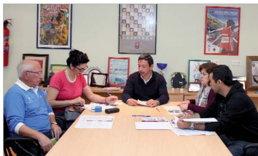
El delegado de Deporte suscribió con los clubes la renovación

Cinco clubes deportivos de la ciudad seguirán disfrutando de las dependencias situadas en el polideportivo Castañita como sedes de referencia