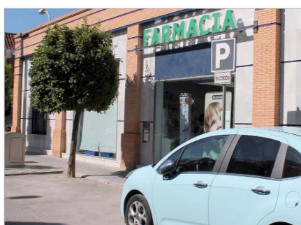
Nueva farmacia en la calle Ruben Darío