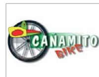
Cañamito Bike Ciclismo

La factoría de jóvenes ciclistas de la localidad ha sido reconocida en la Gala de la Federación en Alcalá de Guadaíra, por el segundo puesto en Principiantes.