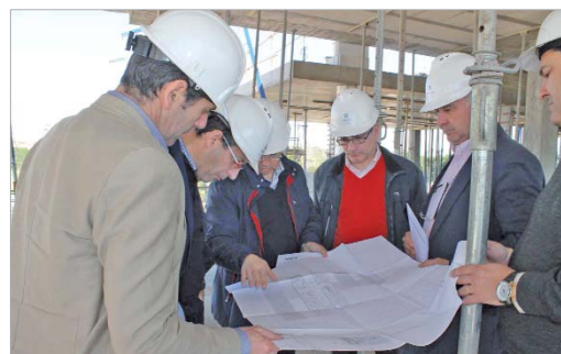
El alcalde visitó las obras con parte del equipo de Gobierno y técnicos.

La construcción de esta infraestructura lleva acompañado un nuevo impulso al empleo, con la contratación de la mano de obra para acometer el centro, cumpliendo así la finalidad transversal de todas las áreas municipales, que no