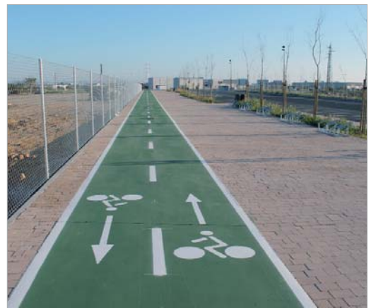
Imagen del nuevo trazado.