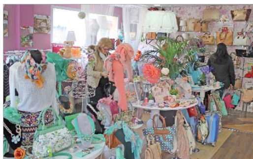
Una gran variedad de artículos de decoración y complementos.

Aires de Sevilla, un auténtico balcón desde San José de La Rinconada a Triana y al río Guadalquivir.