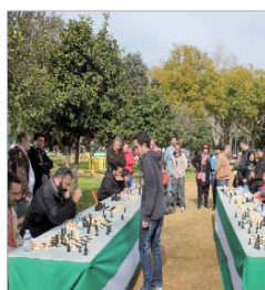
Club de ajedrez.