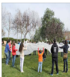
Grupo Scout Kudu XIII.

zona verde. Como es habitual, la emisora municipal Radio Rinconada, instaló en el parque un estudio para que los asistentes pudieran ver cómo se hace un programa en directo. Por los micrófonos del medio local, fueron pasando distintas personalidades del mundo de la cultura y de la política local. El momento donde mayor público se reunió alrededor del escenario principal llegó en torno al mediodía, cuando la Coral Virgen de las Nieves acompañada por la banda municipal Cristo del Perdón, entonó primero Flor de Lis, el himno de La Rinconada y a continuación el de Andalucía al que se sumó el público asistentes.