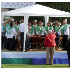
El coro del Hogar 'Pablo Picasso'.