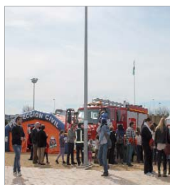
Participó Seguridad Ciudadana.

La Banda Municipal y la Coral Nuestra Señora de las Nieves entonaron el himno de Andalucía