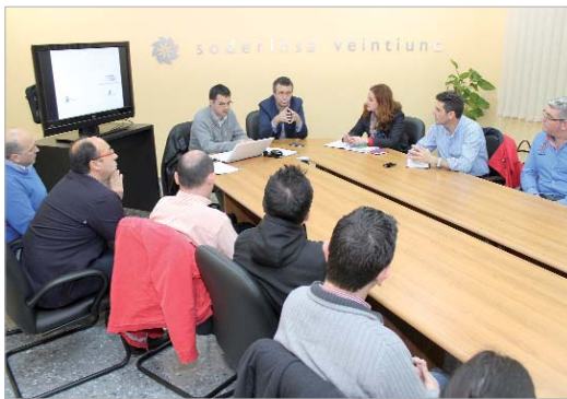
El alcalde se reunió con comerciantes para explicar el nuevo programa.

Así, se va a proceder a visitar las distintas zonas comerciales para conocer, de primera mano las necesidades y potencialidades de que