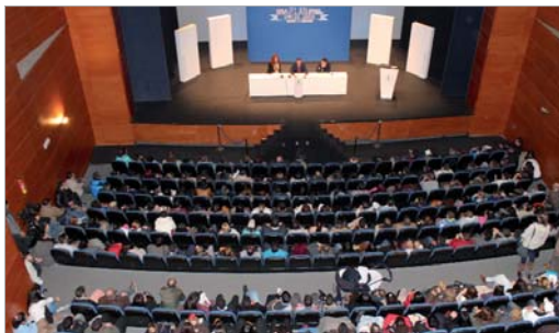
El Plan de Empleo Joven tiene una valoración positiva por todas las partes.

Cabe recordar que, hasta el próximo 26 de mayo, las empresas beneficiarias deberán ser de la Rinconada aunque, a partir de esa fecha, si quedan recursos de los fondos aportados por el Consistorio -100.000 euros-, el abanico se abrirá a la comarca y a la provincia, con la idea de que llegue al máximo de vecinos y vecinas de la localidad. El proceso es por orden de solicitud de entrada, sin influir la