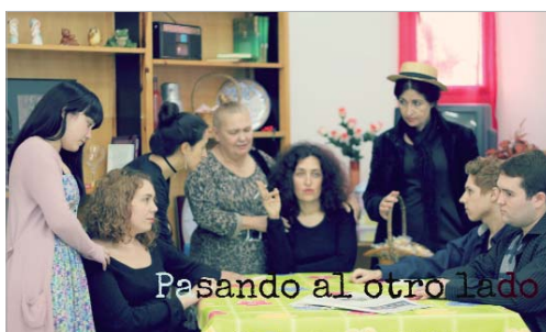
Cartel del cortometraje.

"La idea de realizar este cortometraje surge un día como otro cualquiera. Teníamos la ilusión y las ganas de realizar un proyecto