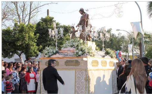
El Patrón procesionó por las principales calles de la localidad.

Los días 16, 17 y 18 se celebró el Solemne Triduo, mientras que el mismo día 19 se ofició la Función Principal a cuya conclusión se rezó la Salve a María Santísima en su Mayor Dolor. Posteriormente, durante el fin de semana, los días 22 y 23, el Patrón quedó expuesto en Besamanos en la parroquia, entre las 17 y las 20 horas.