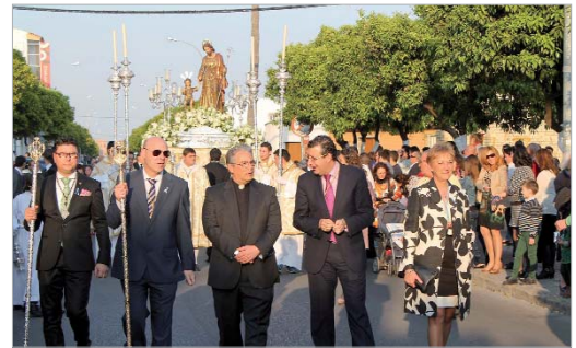
Una representación institucional acompañó al santo.