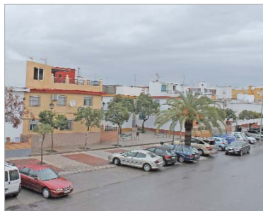
Tienen preferencia las viviendas unifamiliares.

El Ayuntamiento de La Rinconada puso en marcha el pasado mes de febrero el I Plan Municipal de Adecantamiento y Obras Menores en Viviendas con la idea de, por un lado, establecer un marco de ayudas económicas que permitiera a la ciu-