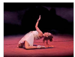
Imagen de la actuación.

gato a la ilusión y la esperanza en un mundo gris y pesimista. Una historia en la que se plantea una dualidad que todos llevamos dentro: por un lado nuestro Minotauro interior, que refleja nuestros deseos más pasionales, nuestro lado emprendedor, arriesgado. Y por otro lado nuestro Teseo, que refleja lo común, lo correcto, lo previsible.