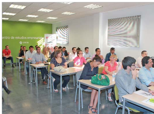
Distintas acciones formativas se han desarrollado con cargo a Feder Integraverde.

Los momentos actuales suponen un desafío enorme tanto para emprendedores que quieren iniciar un nuevo proyecto de negocio como para las empresas ya existentes, des-