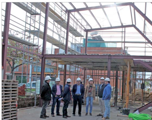
La Casa de la Música se convertirá en la nueva sede de la Banda y la Escuela Cristo del Perdón.