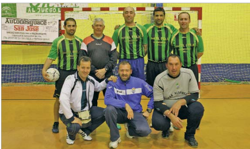
El Campo Arena lucha por la permanencia en División de Honor.

Aunque parecía que La Estacada cogía impulso y podría tener una Liga plácida, el final de la primera vuelta ha generado un bache para los rinconeros que han aprovechado sus perseguidores, especialmente Máster Rápido que, tras imponerse en el duelo directo (5-2), se ha situado en cabeza. Por abajo, el Campo Arena, en la imagen, remonta posiciones y cree en la salvación.