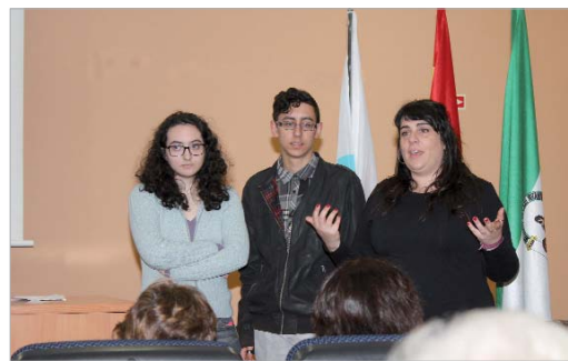
El corto se proyectó en el Centro Joven 'La Estación'.

como género y cine. En total, han participado 23 personas, que se dividen en 18 estudiantes de entre 14 y 16 años, un padre, una madre y tres personas más en produc-