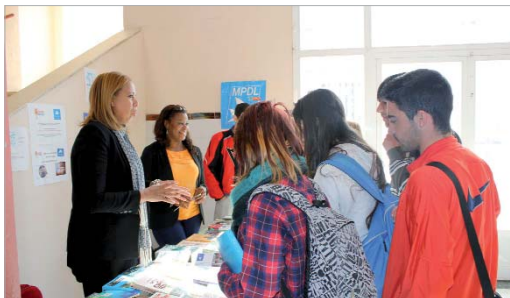
Biblioteca itinerante con libros contra el racismo.

Bajo el lema No Hate Speech, elegido por el Consejo de Europa para movilizar a la ciudadanía, especialmente a los jóvenes, para que debatan y actúen juntos en defensa de los Derechos Humanos, un autobús informativo ha recorrido las calles del municipio haciendo paradas en los distintos centros de Secundaria de la localidad, para repartir en su interior información al respecto, proyectar vídeos y música contra el racismo y adarar las dudas de los estudiantes. Todo ello se ha llevado a cabo con la colaboración de