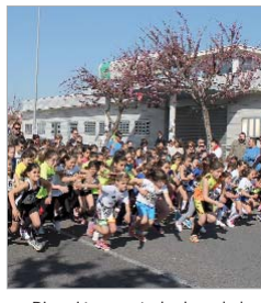
Diversión para todas las edades.

había distintas cámaras captando imágenes del recorrido y no faltaba la animación en directo en la pista del Felipe del Valle. Todo ello, unido a la inscripción on line o a la ubicación de stands de distintos comercios locales en las inmediaciones, generó muy buen ambiente tanto en el plano de participación como de público.