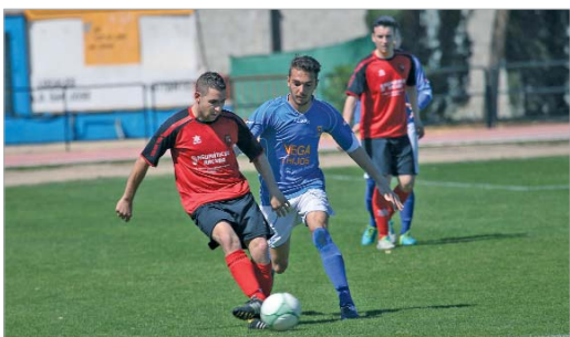
Plusco gozó de ocasiones para marcar frente a La Voz, pero no vio puerta.

Desde que cayera ante La Barrera por 1-2, el San José se ha hecho fuerte en casa, donde sólo ha sumado victorias frente al Ciudad de Lucena (2-1), Osuna (3-0) y La