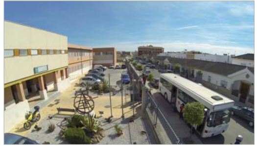
Un autobús informativo visitó los centros escolares.

acciones en la biblioteca pública de San José, como una biblioteca itinerante de libros que abarcan la temática del racismo y la xenofobia, y se ha desarrollado un flashmob en el parque de Los Pintores en el que han participado voluntarios de la concejalía y jóvenes de la localidad, centrado en la concienciación de avanzar hacia una sociedad libre de actitudes racistas, el desarrollo de iniciativas