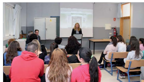
La edil de Cultura durante la presentación de la muestra a los alumnos.

Este trabajo consiguió en el 2011 el primer premio Rosa Regás concedido por la Consejería de Educación de la Junta de Andalucía.