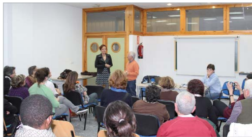
La inmigración fue el tema de la charla de esta edición.

El Ayuntamiento de La Rinconada ha aprobado recientemente las bases reguladoras para la concesión de ayudas por un valor de 95.000 euros. Para la co-financiación de proyectos de Cooperación al Desarrollo y la Solidaridad con los países empobrecidos se destina un 81% del total. En estas mismas bases, también se reserva un porcentaje del 2% para proyectos de educación y sensibilización a realizar en La Rinconada y otro porcentaje del 17% para proyectos destinados a núcleos desfavorecidos de población procedente de países en vías de desarrollo. La ejecución de los mismos deberán tener una duración máxima de un año y el importe se realizará en dos pagos, un 75% tras la resolución y el 25% restante tras justificar la totalidad de la subvención recibida. Las entidades dispondrán de un plazo de 30 días a partir de la publicación de estas bases en el Boletín Oficial de la Provincia.