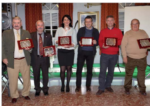
Los presidentes que ha tenido el Club junto al alcalde, con sus premios.

Se reconoció la labor de los distintos presidentes que ha tenido la entidad, así como del Ayuntamiento