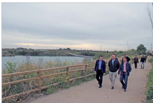
El alcalde con los ediles de Urbanismo y Vía Pública en la visita.

El protagonista central es el lago artificial, un acuífero producido por las excavaciones de grava, que hay en el centro y para el que se va a crear una escuela deportiva y en el que se podrá practicar remo o piragüismo. Asimismo, se dispone de dos circuitos principales que bordean la balsa de agua por su cara interior y exterior, que a su vez se desdoblán en caminos secundarios en las zonas más utilizables, generando distintas estancias de juegos de niños, adultos y merenderos, entre otras. También dispone de embarcadero y de miradores con las mejores vistas paisajísticas.