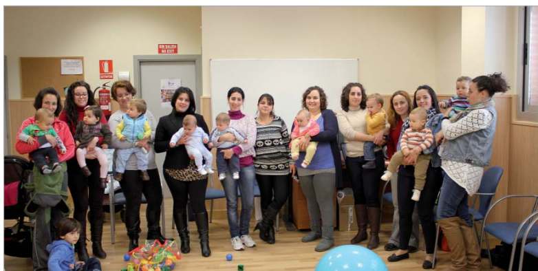
Algunas de las integrantes de la nueva asociación en su asamblea constituyente.

La sede de la nueva asociación constituida queda establecida en el Centro de Salud El Mirador