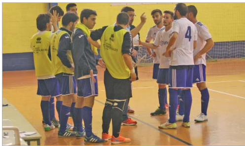
El Tres Calles seguirá un año más en Tercera Nacional tras vencer al Real.

Los rinconeros llevaban la batuta del juego, creaban las ocasiones, pero iban por detrás.