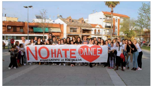
El parque de Los Pintores acogió un flashmob de voluntarios del área.

enfocadas al apoyo y la solidaridad con personas y grupos objeto de la expresión de la intolerancia y el odio.