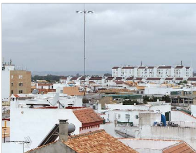
Nueva iniciativa para adecentar las viviendas.

La idea es seguir reactivando el sector de la construcción al tiempo que se lleva a cabo el proceso de estudio y validación de las solicitudes presentadas