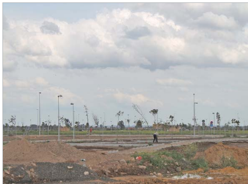
Espacio donde se ubicarán los huertos del núcleo de San José.

En ambos núcleos, las zonas de huertos se complementan con