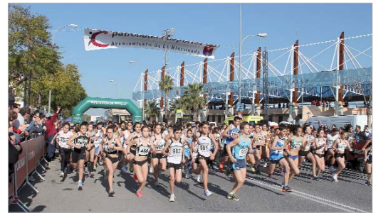
Antes de la prueba reina se produjeron las salidas de las de cantera.