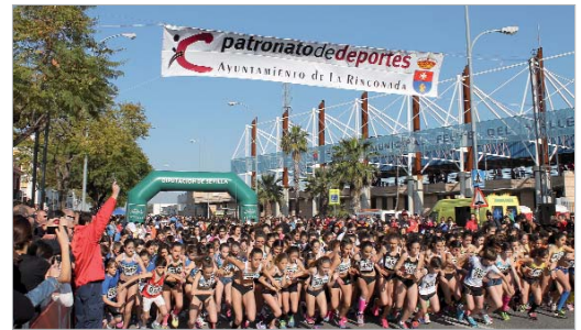
Numeroso público se dio cita para animar a los corredores y corredoras.