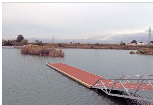
El gran lago central es uno de los principales atractivos del recinto.

#FORMACIÓN reducir la brecha digital entre generaciones