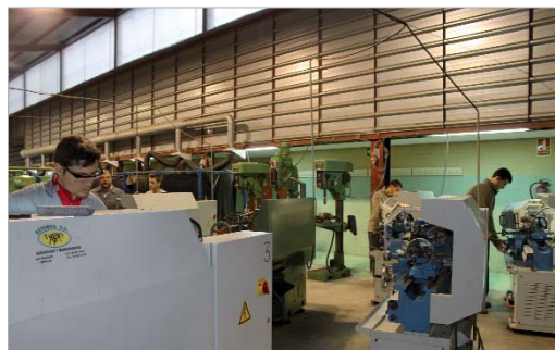
Módulo de Producción por Mecanizado del IES Antonio Ulloa.

puesto de trabajo controlando todas las necesidades y requisitos que solicitan las empresas, con unos conocimientos y apti-