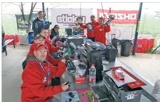
El Club Automodelismo San José prepara sus coches para empezar a competir.

El San José se instala en la dualidad de ganar en casa y perder fuera del Felipe del Valle, lo que podría acercarle a la permanencia a tenor de la gran igualdad existente si mantiene esa tónica