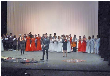
El CRAES interpretó a 'Hamlet' de Shakespeare.

La premiada fue la encargada de leer el mensaje de Bailey. Tras esta lectura el CRAES representó su primera obra teatral, 'Hamlet' de William Shakespeare ya que este año se cumplen los 450 años del nacimiento del dramaturgo anglosajón.