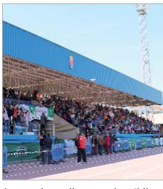
Las gradas se llenaron de público.