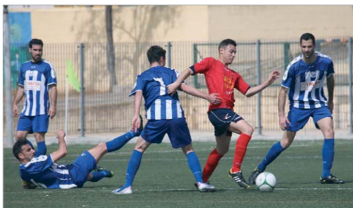
El juvenil Lobo se ha convertido en un fijo en el equipo de Maldonado.