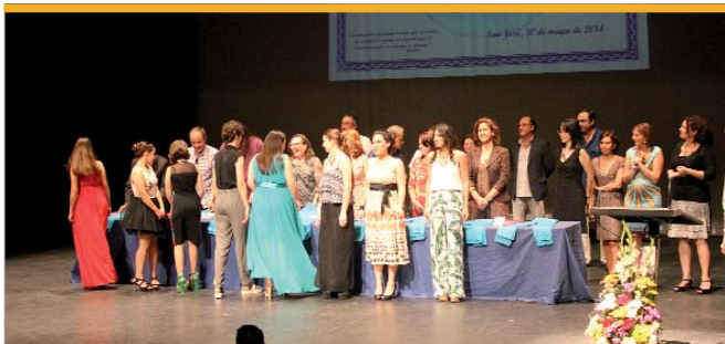
El IES San José escogió el Centro Cultural de la Villa para despedir a sus alumnos de enseñanzas medias en el acto de graduación