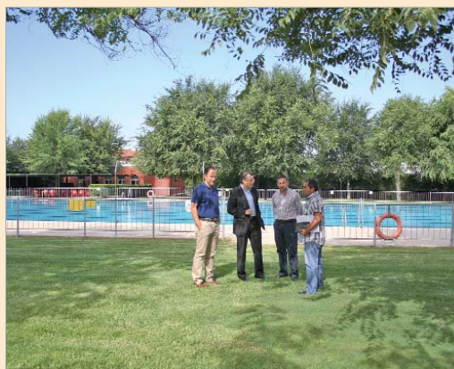
Instalaciones de la piscina Francisco Sánchez 'Castañita'