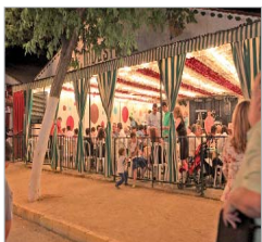
El ambiente no faltó en las casetas.