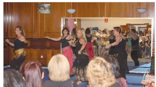
El curso de Danza Oriental ha sido muy bien acogido por las usuarias.