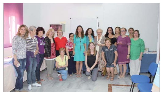
Foto de familia de las participantes en las diferentes actividades.

mos, nos ayudamos y nos entendemos." Durante el acto de clausura se ha destacado lo importante que es para la impartición de los talleres el hecho de poder disponer de espacios propios como son los situados en Carretera Bética y en la antigua biblioteca de La Rinconada. También se ha destacado el hecho de que mientras en otros ayuntamientos los recortes se están llevando por delante gran parte de las programaciones en materia de Igualdad, en La Rinconada se mantiene el firme compromiso de seguir adelante con el desarrollo de estas actividades y servicios que se gestionan desde el Centro Municipal de Información a la Mujer.