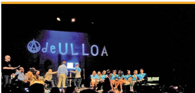
El centro cultural Antonio Gala acogió el acto de graduación del alumnado del IES Antonio de Ulloa

vuestra formación y no perder de vista que los mejor preparados tienen más fácil el acceso al mercado laboral" El edil repasó ante el auditorio las políticas en materia de empleo juvenil puestas en marcha por el Ayuntamiento como el Plan Empleo Joven, las becas o la posibilidad de hacer prácticas en dependencias municipales" Todas las ceremonias estuvieron marcadas por la alegría pero al mismo tiempo por la nostalgia y la tristeza de dejar atrás compañeros y recuerdos.