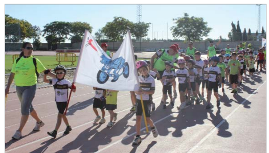
Momento del desfile inaugural en el estadio deportivo Felipe del Valle.