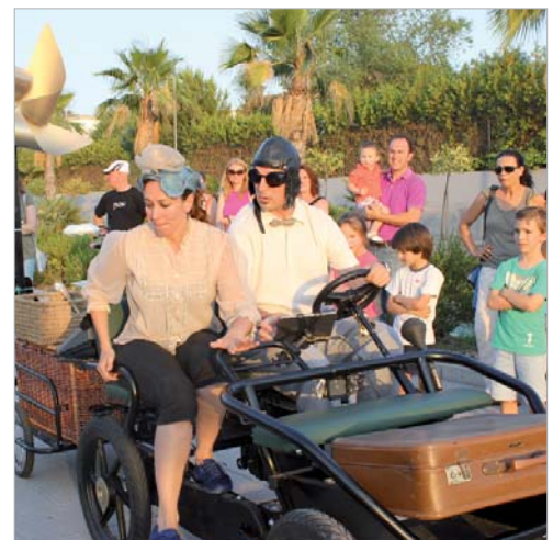
La Calabaza Danza ofreció a los asistentes 'El artefacto'.