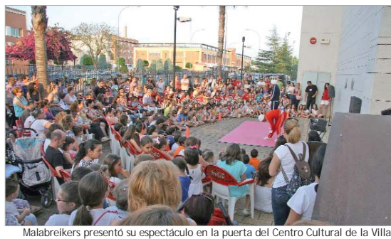
Malabreikers presentó su espectáculo en la puerta del Centro Cultural de la Villa.