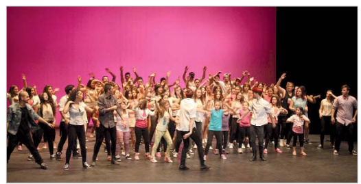
Los alumnos de Danzari celebraron el final de temporada con una gran gala.

Tras la vuelta del verano, Danzari inaugurará una nueva temporada en la que según cuentan, "intentarán seguir progresando y elevando el nivel de la danza en La Rinconada".