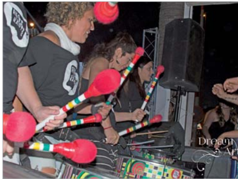
Diferentes imágenes de conciertos y actuaciones que La Dstylería en las que han demostrado el buen rollo que transmiten con su música.