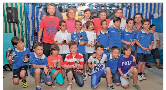
Reconocimiento al equipo Benjamín C cañamera en la Jira de San José.

Por otro lado, como es tradición, el domingo de Jira el cuadro azulino reunió a sus diferentes escalafones inferiores para entregar los