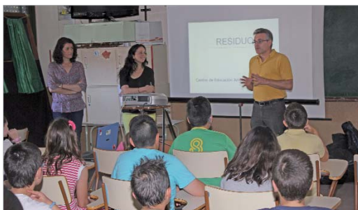
El Ayuntamiento ofreció una charla sobre tratamiento de residuos cotidianos.

El Consistorio colaboró con la impartición de un seminario sobre tratamiento de residuos