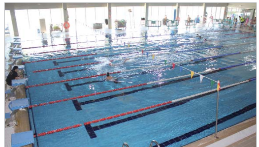
La piscina cubierta albergó la competición de natación.