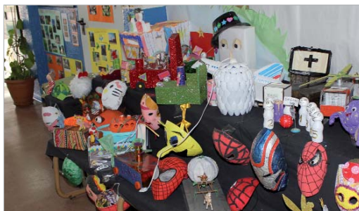
Parte de la exposición en el hall del colegio.

dad mostrada a la hora de elaborar los juguetes y construcciones a base de materiales reciclados. En su visita, el edil de Educación destacaba la importancia de este tipo de actividades pues "la Educación no es sólo la transmisión de conocimientos sino también despertar desde las edades más tempranas el respeto al medio ambiente como elemento transversal de las materias impartidas en las distintas asignaturas."