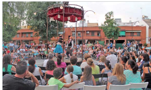
En el parque de los Pintores, la compañía La Industrial Teatrea.