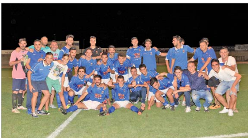
El plantel posa tras el partido frente al Antoniano en el Felipe del Valle.

El San José cerró una campaña que, al final, aunque irregular, puede catalogarse de muy positiva ya que, aunque la entidad cer-