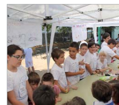
Toda la comunidad ha participado

#EDUCACIÓN compromiso con el medio ambiente