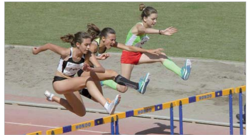
Los 220 metros vallas femeninas dejaron dos medallas al conjunto local.

Siete deportistas del CAR Rinconada estuvieron en las finales del Campeonato de Andalucía de Atletismo Alevín e Infantil, que se han celebrado