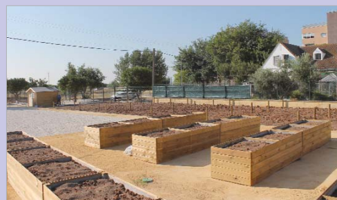
Zona de los huertos en el núcleo de La Rinconada.

canso. Destaca en la zona un lago que además de una finalidad estética tiene una importante función en el sistema de drenaje de las aguas pluviales del entorno. En total se han invertido veinte millones de euros de forma conjunta entre el Ayuntamiento y la Empresa Pública del Suelo de Andalucía. Con esta nueva dotación natural, se avanza en el compromiso de la administración local con el medioambiente y la sostenibilidad.