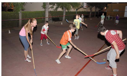
El CEIP Júpiter ha acogido diversas actividades adaptadas a todos los gustos.

des, actividades deportivas, exhibiciones o gymkhanas han sido sólo algunas de las actividades programadas para el disfrute de los más jóvenes del municipio.