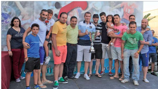
El Trillo La Tronera suma su segunda Liga Local y desbanc a La Estacada.