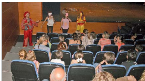
La gran fiesta del Cuentacuentos hizo las delicias del público asistente.

Durante todo el espectáculo hubo una gran interacción con el público no sólo del Cuentacuentos, sino de los diferentes personajes del mundo del circo, como la mujer bala o el forzado, entre otros, que