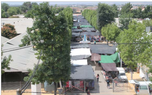
El Mercadillo de San José, en los terrenos donde se celebra la Jira.

El Área de Vía Pública ha trasladado el mercadillo de San José dentro del recinto ferial, dejando así libre el acceso de la calle Rafael Alberti y estableciendo un mejor dispositivo para frenar el montaje de puestos ilegales