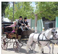
Paseo de caballos.