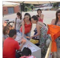
El público se agolpaba para probar suerte.