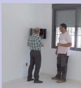
Los técnicos supervisan el interior.