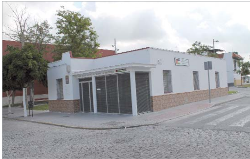
El exterior de la sede Amigos del Sahara en la calle Cristo del Perdón.