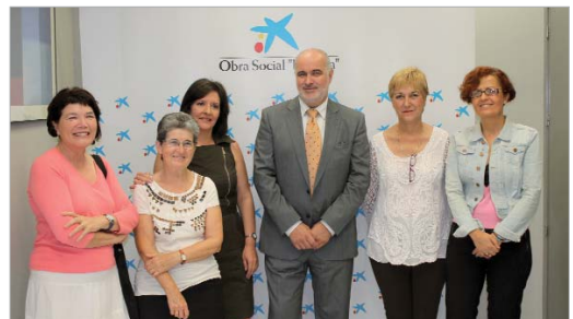
A la firma del convenio asistieron representantes del gobierno municipal.

#BIENESTAR SOCIAL convenio de colaboración