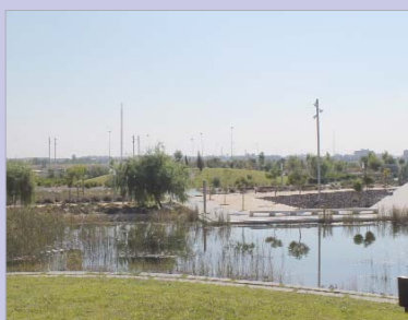
El parque de La Unión suma una nueva zona verde.

En el horizonte y con las obras a buen ritmo y siguiendo los plazos establecidos, la Hacienda Santa Cruz y el Parque de La Gravera como proyectos que también afrontan ya su recta final.