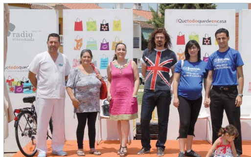
Comerciantes del entorno de Santa Cruz y El Malecón.