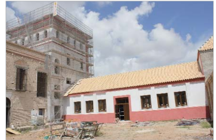
El Centro de Interpretación del Agua irá ubicado en La Hacienda