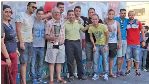
El equipo de Máster Rápido acabó en segunda posición en División de Honor.

El Patronato de Deportes entregó los premios de la Liga Local de Fútbol Sala, que cumple un cuarto de siglo y que celebró en