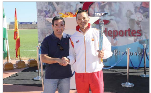
El piragüista Olímpico en Atenas, Damián Vingés, encendió el Pebetero.

Por su parte, Romero Campos quiso agradecer a los técnicos municipales, monitores, operarios y voluntarios el trabajo realizado. "Con el granito de arena de todos contribuimos al crecimiento del deporte en La Rinconada".