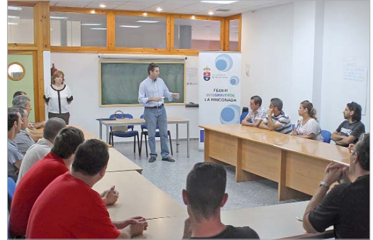
Soderinsa acogió la presentación de esta acción formativa.

El proyecto Integraverde, incluido dentro del Plan Municipal de Empleo, busca fomentar un desarrollo local sostenible y favorecer la regeneración urbana, en busca de una mayor cohesión económica, territorial y social en torno al eje transversal de la dinamización económica y la generación de empleo en el municipio.