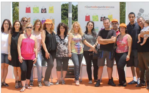
Foto de familia de los comerciantes de La Rinconada.

Los comerciantes siguen viendo en esta iniciativa una buena herramienta para dar a conocer la rica oferta comercial que presenta la localidad e incentivar el consumo en los establecimientos de las zonas visitadas