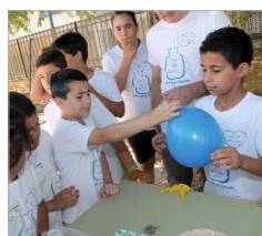
Experimentos de aire