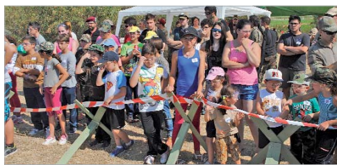
Numerosos participantes se acercaron a conocer el funcionamiento del club.