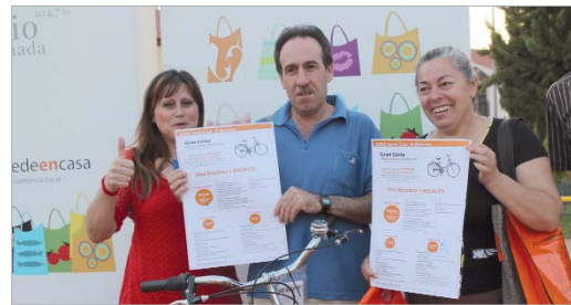
Los ganadores que estaban presentes mostraban orgullosos sus regalos.

El área de Comercio del Ayuntamiento de La Rinconada mantiene su campaña de apoyo al comercio local con el que sigue recorriendo las seis zonas comerciales en las que dividió la localidad. En las últimas semanas, dos han sido los entornos visitados, por un lado el núcleo de La Rinconada y, por otro, la barriada Santa Cruz en San José.