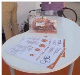
Preparando el sorteo.