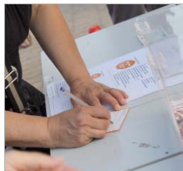
Cientos de personas rellenan su cupón.