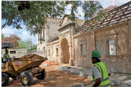
Las obras suponen una importante fuente de empleo