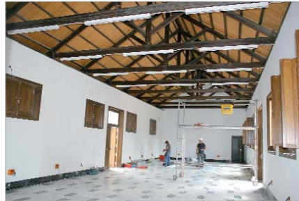
La Hacienda albergará una gran biblioteca universitaria