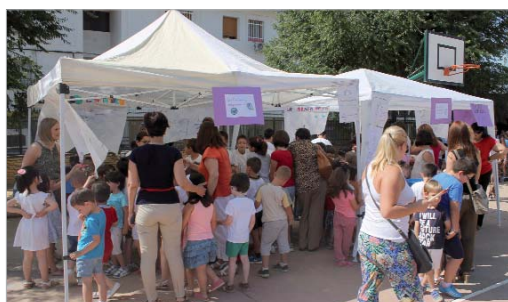
Uno de los stands instalados en el patio del centro.