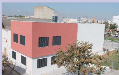
Cara exterior de la Casa de la Música en el Bulevar del Almonazar.

tación de reclamaciones, este proyecto enmarcado dentro del programa de envejecimiento activo ya está listo para entrar en funcionamiento. Las parcelas tienen una extensión de 50 metros cuadrados con opción de cultivo en altura para personas con movilidad reducida.