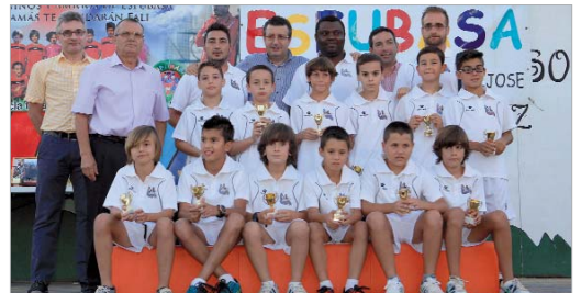
El Esfubasa se ha especializado en las categorías de edades más pequeñas.