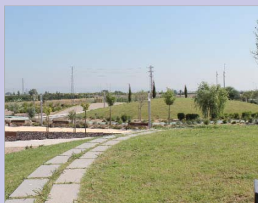
La infraestructura abrirá a la ciudadanía próximamente.