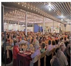
Recepción a los pensionistas.

horario y recorrido específico del microbús. A este respecto, destaca el incremento de viajeros que han utilizado en algún momento de la Jira el transporte público interurbano. En total más de seiscientas personas lo han empelado lo que supone un incremento superior al 33 por ciento en número de viajeros destacando la noche del sábado al domingo cuando esta