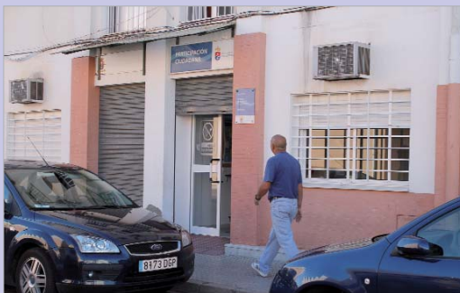
Desde el uno de diciembre de 2012 la oficina antideshucios está en marcha.

Al respecto, se han buscado abogados de oficio y se ha negociado con las diferentes sucursales bancarias para intentar alcanzar un acuerdo lo más ventajoso posible para los vecinos y vecinas del municipio. Pero el asesoramiento pronto trascendió de lo referente a las distintas etapas que conforman el proceso para un desahucio, y se exten-