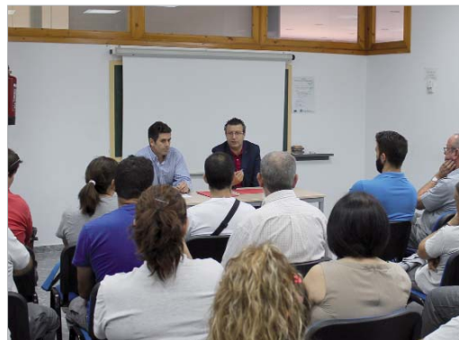
El alcalde y el vicepresidente ejecutivo SODERIN clausuraron el curso

Concretamente esta escuela taller ha acometido entre otras actuaciones la finalización del ala oeste de la Hacienda Santa Cruz. Durante la entrega de diplomas acreditativos, el primer edil,