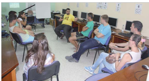
Una veintena de jóvenes participaron en esta nueva acción formativa.

Iniciativa de las áreas de Participación y Cooperación Internacional, en colaboración con la asociación Mujeres en Zona de Conflicto