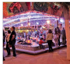
La zona de atracciones.