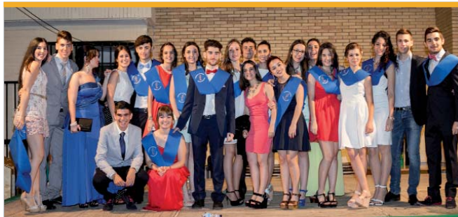
El parque del mismo nombre, sirvió como escenario para la graduación de los estudiantes del IES Miguel de Mañara