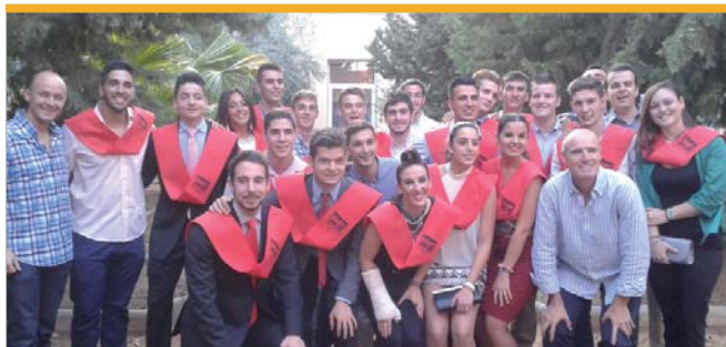
El ciclo de Actividades de Animación Físicas y Deportivas junto al resto de estudiantes del Carmen Laffon también inician una nueva etapa