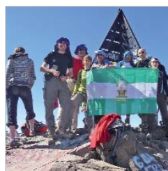
Imagen de la última expedición.