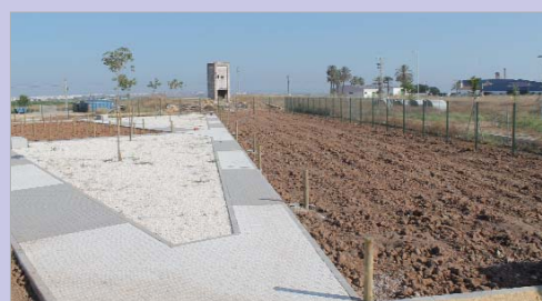
Los huertos de San José están tras el cementerio.