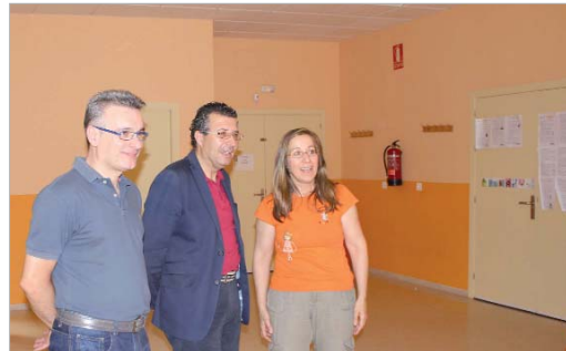
Un momento de la visita a la escuela infantil Elephas.