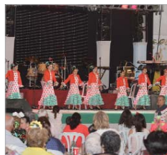
Escuela de Antonia de los Santos.