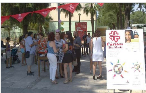
Los voluntarios y voluntarias de Cáritas abrieron las puertas de su asociación.