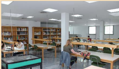
Sala de estudio de la biblioteca de San José.

hablar de un programa consolidado y que se enmarca coincidiendo con las temporadas de exámenes en la que los estudiantes demandan espacios para poderse preparar sus exámenes. Desde el área se han ido adaptando a las demandas y la nueva biblioteca de La Rinconada, también se suma a esta iniciativa. "Ofrecer a los jóvenes y las jóvenes espacios de calidad donde concentrarse para estudiar y sacar adelante sus exámenes es una muestra más del compromiso de esta administración con la formación de los más jóvenes. Más de cien estudiantes usan este servicio nocturno sin que tengan que desplazarse a las bibliotecas universitarias