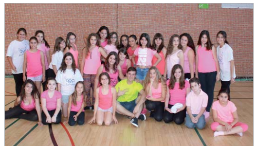
Las participantes en la actividad de baile moderno en el Fernando Martín.