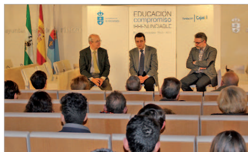
Cajasol contribuirá a la financiación de las becas universitarias.

De este modo, Cajasol contribuye a cofinanciar con 50.000 euros los proyectos locales dotados además de fondos municipales para becas universitarias de ayudas económicas a estudiantes del municipio para transporte y material del curso, el programa de Becas Primera Oportunidad para la realización de prácticas en las diferentes Áreas municipales, el Plan de Empleo Joven Municipal, líneas de ayudas de emergencia social