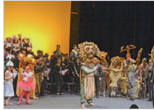
Banda Municipal Cristo del Perdón.