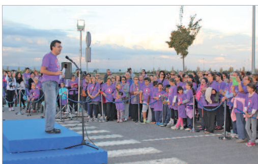
El alcalde destacó el compromiso del municipio contra la violencia de género.

Por segundo año consecutivo, La Rinconada ha celebrado una marcha reivindicativa por el Día Internacional de la Eliminación de la Violencia contra la Mujer. Equipados con camisetas de color violeta, serigrafadas con el lema de la campaña de este año 'Pon freno al Machismo', alrededor de 1.500 vecinas y vecinos de la localidad, junto con colectivos deportivos, sociales y culturales par-