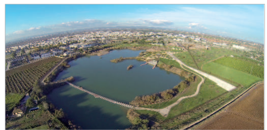
Imagen aérea del parque.