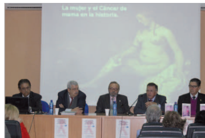
El Centro Joven La Estación albergó la presentación del proyecto.

La empresa trabaja con el Consistorio en un sistema de asistencia gratuita a mujeres sin recursos de la localidad