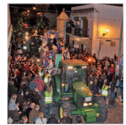
Voluntariado velando por la seguridad

tos, donde los chicos pueden ayudar a otras personas o aprender cómo valerse por sí mismos. Actualmente han abierto un área para adultos que consiste en rutas de senderismo y talleres, entre otras actividades.