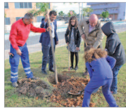
El alcalde, Javier Fernández.