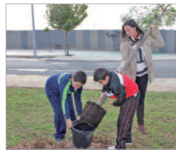
Momento de la siembra de un árbol.