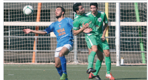
Plusco pelea con dos jugadores de La Barrera por llevarse el esférico.

El San José ha pasado en sólo cinco semanas de ser líder a mirar más a la zona complicada de la tabla que hacia arriba, después de sumar un punto de quince posibles y no haber marcado en esos cinco envites. Las bajas en ataque ha cercenado todo el poderío ofensivo cañamero, lo que ha destapado otras carencias, como la fragilidad del centro del campo y ha dejado ver los primeros errores defensivos de