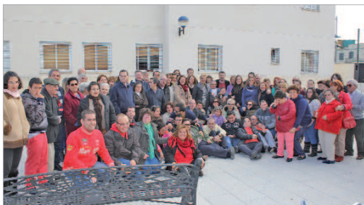
Foto de familia de los usuarios con el alcalde y la edil de Bienestar Social.

sido incluido en el Circuito de la localidad. Fernández ha señalado que "el enorme recorte en políticas para personas con discapacidad que ha realizado el Gobierno de España no se ha notado en La Rinconada, porque tanto la Junta como el Consistorio tienen un compromiso irrenunciable respecto a este sector de la población". "Fuera de Andalucía hay zonas en las que el recorte ha sido tal, que los centros de personas con discapacidad han cerrado sus puertas y a los usuarios y usuarias los han mandado a casa". En ese sentido -prosiguió el alcalde-, "La Rinconada no sólo no va a dar un paso atrás, va a mantener el global de su plantilla y programas en este sentido, e incluso vamos a seguir avanzando tratando de hacer cada día más fácil la vida de los usuarios y sus familiares". Por último, Fernández compartió un desayuno con los asistentes y sus familiares.