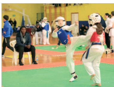
En total, más de 400 personas participaron en el evento.

La tercera edición del Trofeo La Rinconada de Taekwondo fue todo un éxito de participación y público en el Agustín andrade 'Gorri', donde confluieron 338 deportistas de veinte clubes de toda Andalucía, así como técnicos y árbitros, y un gran número de público que abarrotó las