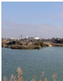
El lago artificial.