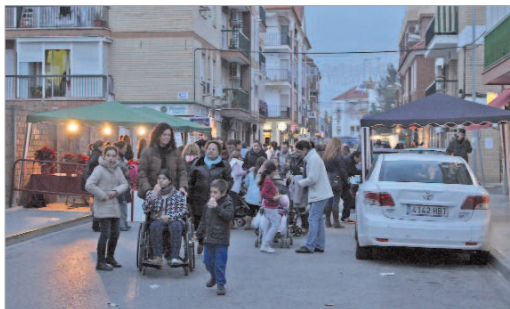
Los comerciantes de la calle Córdoba salieron un año más a la calle.

Se trataba de una cita obligada para la ciudadanía ya que, además