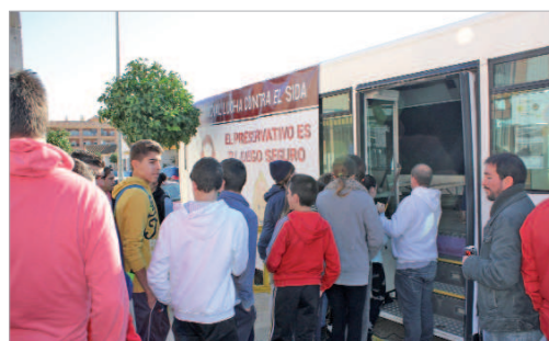
Autobús informativo sobre la campaña de prevención.

A continuación y ya en el exterior, los alumnos de bachillerato de Arte del IES Carmen Laffón interpretaron una performance sobre una adolescente que contraía la enfermedad por no emplear preservativo durante sus relaciones sexuales y por