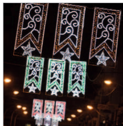
Elemento decorativos en San José