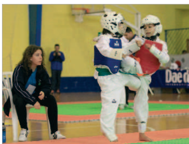
El Ditae cuenta con numerosas promesas del taekwondo.