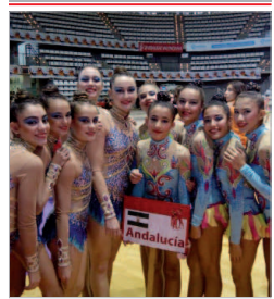
Imagen del conjunto Cadete.