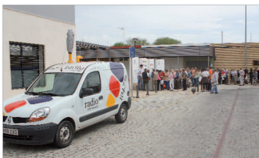
La Radio multiplica la actividad para promocionar el comercio local.