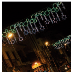
Iluminación en La Rinconada

Por su parte, en San José se han adornado las calles Madrid, Córdoba, Cultura, San José, Alberto Lista, Carteros, Málaga, Casa del Sueño, Emilia Pardo Bazán y Carretera