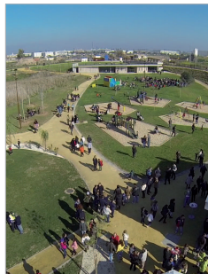
Numerosos vecinos en la apertura.