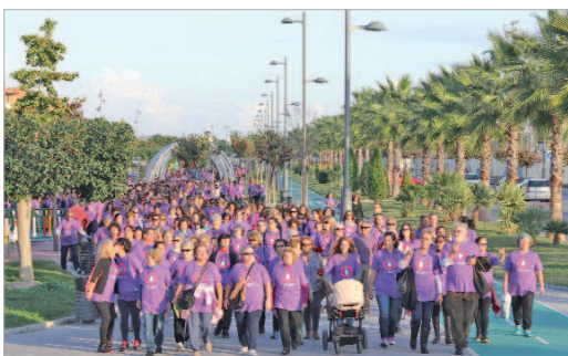
Imagen de la marcha en el Paseo del Almonazar.

Bajo el lema 'Pon freno al Machismo', La Rinconada ha reivindicado el Día Internacional de la Eliminación de la Violencia contra la Mujer con una marcha en la que han participado alrededor de 1.500 personas