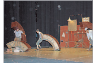
Cia Vaiven Circo.