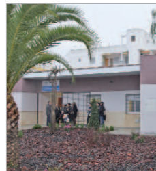
Centro de la Mujer.

Los objetivos de esta jornada han sido profundizar en la cultura de la coordinación interinstitucional y la