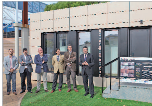
El alcalde acudió a la presentación de este prototipo de vivienda.