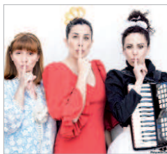
Cía Del Puchero.

La Villa tomará el relevo en el mes de marzo y lo hará con la