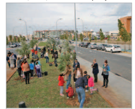
El municipio cuenta con nuevos árboles.