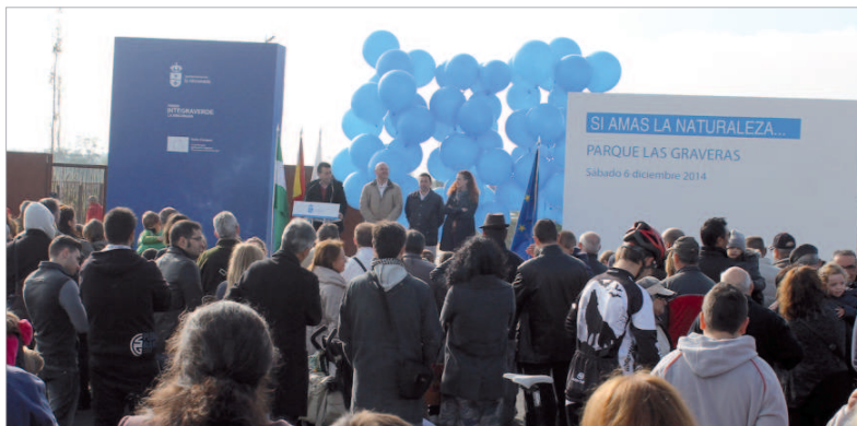
El alcalde y su equipo de Gobierno durante la inauguración del parque.

con La Jarilla, aparcamientos e itinerario de carril bici perfectamente comunicado con el del resto del municipio, así como acceso a la futura ronda sur. Asimismo, para seguridad de los ciudadanos, se ha regulado el acceso al parque con un semáforo y un paso de peatones.