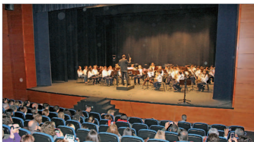
La Villa acogió el concierto de Navidad.

Los alumnos y alumnas deleitaron al público con un repertorio variado que abarcó desde fragmentos de bandas sonoras de películas, pasando por canción española, para finalizar en los tradicionales villancicos