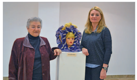
La edil de Cultura junto con la artista de la muestra.

Además es posible contemplar una colección de trajes de