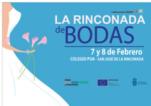
La feria se celebrará en el colegio PUA en el mes de febrero.

vestidos de novias, alquiler de vehículos, joyerías, músicos, diseñadores de invitaciones o fotógrafos son algunos de los sectores que