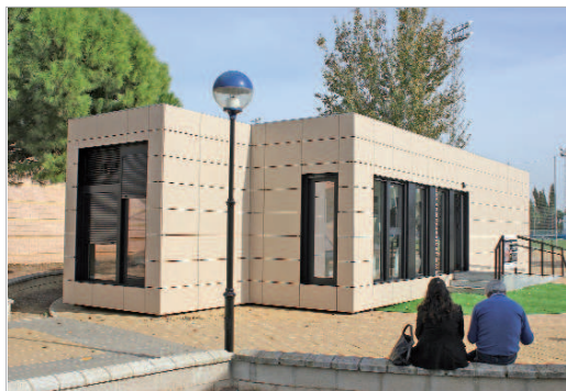
La casa se encuentra junto al Felipe del Valle.

tienen nada que envidiar a las viviendas de construcción tradicional. Además, no son viviendas prefabricadas con unos modelos estándar cerrados sino que la persona puede diseñar su casa modular en función de sus gustos y sus necesidades. El proyecto ConteneDomus propone una edificación modular industrializada, flexible, con diseño, calidad, de bajo impacto ecológico y de rápida ejecución. En este tipo de construcciones, el precio es menor que una tradicional, ambas con los mismos niveles de calidad, se puede llegar a abaratar entre un 30 y un 50%. También se reducen los plazos de entrega en torno al 60%.