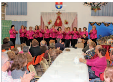
Actuó el Coro 'Pablo Picasso'.