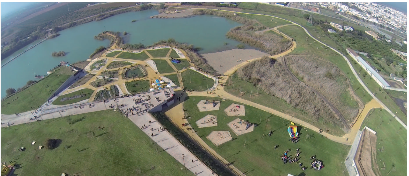
El parque de Las Graveras recibió a numerosos vecinos el día de su apertura, en la que no faltaron las múltiples actividades.

Con un presupuesto de algo más de 2 millones de euros con cargo a Feder Integraverde y al Ayuntamiento se convierte en el gran pulmón del municipio sumándose a los más de 630.000 metros cuadrados de espacios verdes municipales