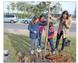
Disfrutaron la experiencia.