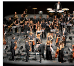
Joven Orquesta Filarmonía Sevilla.

Y es que un año más los Centros Culturales Antonio Gala y La Villa volverán a ser testigos de propuestas escénicas origina-