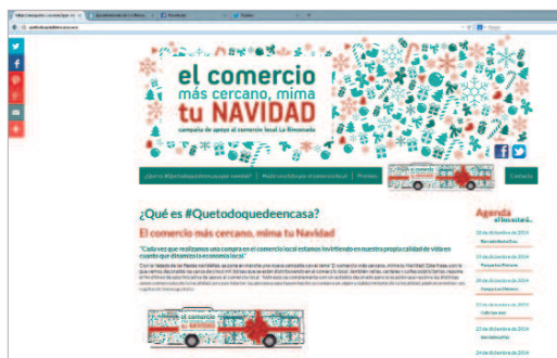
El Ayuntamiento desarrolla una extensa campaña para incentivar el consumo.