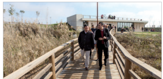
Una de las pasarelas que se ubican en el recinto.