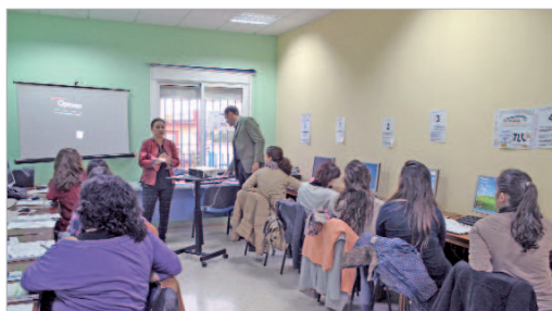
La Estación acoge el curso de Prodetur de Operaciones Internacionales.

El Centro Joven La Estación acogió recientemente la inauguración del curso 'Gestión Administrativa de Operaciones Internacionales' que se impartirá en esas mismas instalaciones. Las 15 personas cumplen el requisito de nivel formativo mínimo de Formación Profesional Grado Superior de la Rama de Administración y Finanzas y poseen un nivel básico de inglés. Tras haber superado las pruebas de selec-