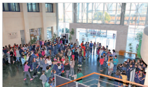
La Villa acogió la proyección de la película.

La actividad central consistió en la proyección de la película 'Zipi y Zape y el club de la canica', un filme que cuenta la historia de los dos traviesos mellizos, creados por el cómic de Escobar, que son internados en el Esperanza, un colegio donde los juegos están prohibidos. Allí fundarán el Club de la Canica, la resistencia infantil que desafiará la autoridad de los adultos. Gracias a su inteligencia, su valentía y su inquebrantable fe en