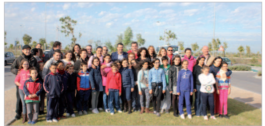
Los escolares de la localidad posan en la Avenida de La Unión.