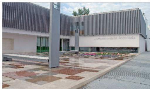
Ayuntamiento de La Rinconada.

Destaca que un año más, el Ayuntamiento vuelve a asumir la subida del IVA (de hasta 13 puntos en algunos servicios) impuesta por el Gobierno