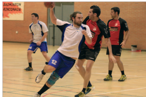
Los locales arrebataron el liderato al Valverde al vencerle en su estadio.