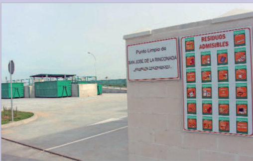
Esta nueva infraestructura recoge todo tipo de residuos.

Un nuevo Punto Limpio ha abierto sus puertas a la ciudadanía en el núcleo de San José, en lo que supone el tercero instalado en el municipio. Ubicado en una parcela contigua al cementerio y con más de 2.700 metros cuadrados se trata de un lugar acondicionado adecuadamente para la recepción y acopio de residuos domésticos, aportados por particulares y que no deben ser depositados en contenedores habituales situados en la vía pública.