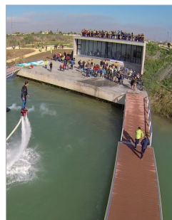
Actividad acuática en el lago.