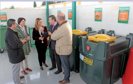
El alcalde y la consejera inauguraron el punto limpio.

Un nuevo ejemplo de colaboración entre la Administración Local y la Autonómica, se ubica en el núcleo de San José y supone un paso más en la apuesta por la sostenibilidad del Ayuntamiento