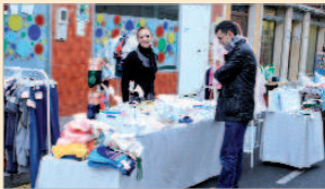
La primera semana del año se celebra la acción.

Por otro lado, la mayoría de los comercios de la calle Málaga, así como otros que se incorporarán