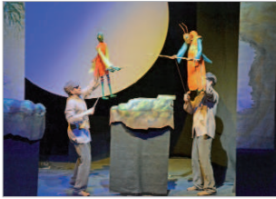
Cia Buho & Maravillas.