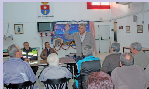
Los mayores atienden a la charla del experto en tráfico.

El Centro de Día '20 de Julio' acoge una jornada sobre seguridad vial