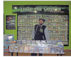
Todas las novedades del mercado.

mundo de los videojuegos es propio de jóvenes o adolescentes y eso es un error. Yo tengo seguidores en mi canal de personas de más de 60 años que disfrutan en su tiempo libre." Tampoco comparto la idea de que todos los afi-