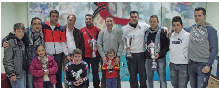
Foto de familia de todos los equipos y jugadores galardonados.