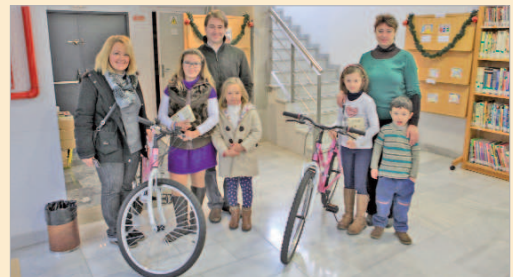
Las ganadoras con sus familiares y premios.

La biblioteca de San José ha organizado, como ya viene siendo tradición, el Concurso de Tarjetas de Navidad, que este año ha vuelto a contar con numerosos participantes. Como señala la delegada de Cultura, Nadia Gallardo, "con este certamen la biblioteca pretende que el usuario infantil y juvenil no desconecte del centro durante el período vacacional navideño, además intentamos que los participantes desarrollen sus actividades pictóricas y su imaginación creando su propia tarjeta". Cada año, desde la biblioteca recomiendan a los profesores que dirigen los trabajos de los participantes, que éstos sean originales y no se intenten copiar los modelos de dibujos