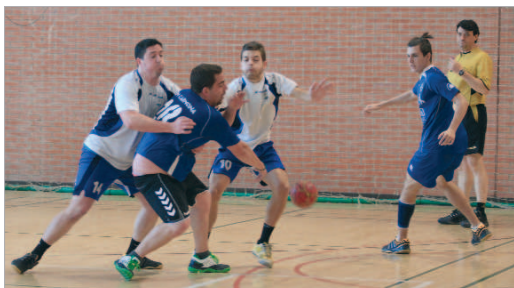
El Carmona, colista del grupo, nunca tuvo opciones ante el cuadro rinconero.