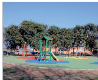
Parque 1º de Mayo.