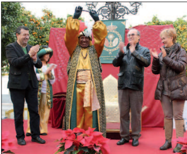
El Visir de La Rinconada estuvo organizado por el Grupo Joven de la hermandad de la Salud.