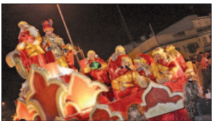
El rey Baltasar en el núcleo de San José.