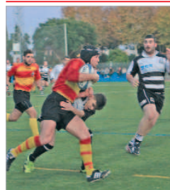
Partido La Estación-Utrera.