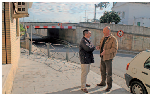
Los ediles de Urbanismo y Vía Pública en calle San José donde irá la pasarela.