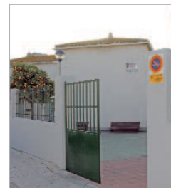
Centro de Adultos de San José.

Con el fin de dar a conocer la labor que se realiza en el centro se va a realizar el próximo 29 de enero a las 18.00 horas en el salón de actos de la sede de San