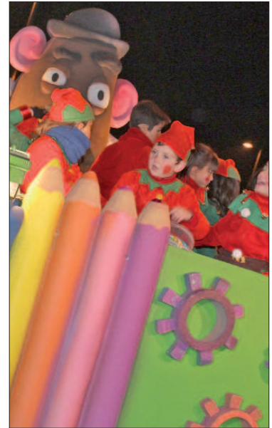
La carroza de Juguetilandia permitió el disfrute de los pequeños que iban sobre ella, y de sus padres y madres.