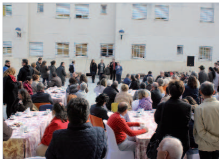
Encuentro familiar en el centro ocupacional.

A todo esto hay que sumar la apuesta por la educación con más becas (14% más), por la sanidad, los mayores y la igualdad.