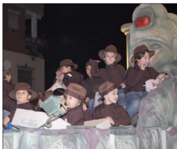
La carroza de Tadeo Jones estaba perfectamente caracteriza y a sus integrantes no le faltaba un detalle.