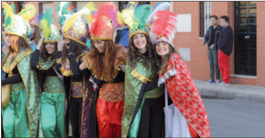
Los beduinos forman parte del cortejo de Sus Majestades de Oriente llenando de colorido las calles del municipio