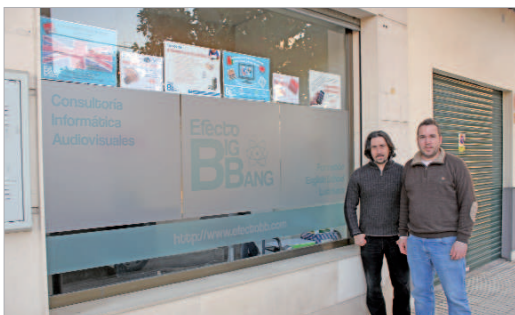
Efecto Big Bang Consultores está ubicado en Carretera Bética, 8.

En definitiva, un servicio especializado que garantiza profesionalidad que ofrece un amplio abanico de posibilidades a la ciudadanía de La Rinconada y que, aunque se ha instalado recientemente, ya es una referencia en sus campos de actuación.