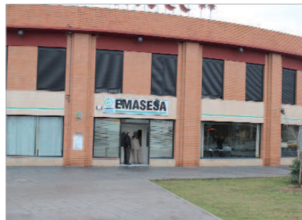
Coordinación con Emasesa para bono social suministro agua.