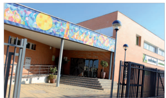
Centro de Formación 'Juan Pérez Mercader'.