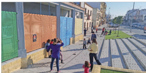
Los participantes en Animateka en Blanco disfrutaron de juegos tradicionales

Las vacaciones de Navidad son más divertidas gracias al programa