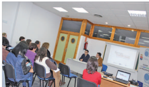
Reunión con las firmas participantes

Una de las líneas de trabajo con la que el área de Comercio del Ayuntamiento de La Rinconada busca incentivar y promocionar el comercio local, es la celebración de ferias comerciales. Según el calendario previsto por esta delegación, se van a celebrar tres eventos diferentes por un lado una primera edición de 'La Rinconada de Bodas' que ya tiene fecha de celebración los próximos días 7 y 8 de febrero en el PUA. En total han sido unas veinticuatro las empresas que han presentado la solicitud para participar en este evento. Agencias de viajes, floristerías, estudios fotográficos, salones de celebraciones y trajes de ceremonia entre otras empresas del sector van a acudir a la cita. Durante la celebra-