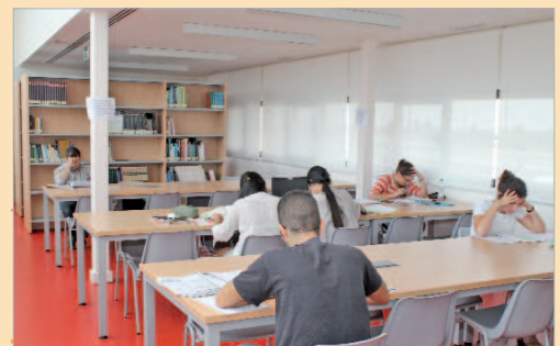
Sala de estudios de la biblioteca de Rinconada.

El programa también facilita el estudio a aquellas personas que compatibilizan trabajo con formación ya que "entre los usuarios de este programa hay personas que se están preparando oposiciones o que trabajan y aprovechan las últimas horas del día para avanzar en sus estudios".