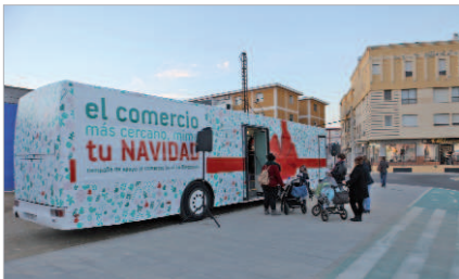
El autobús en una de sus ubicaciones

Uno de los momentos más destacados de esta campaña tuvo lugar el pasado 3 de enero en el entorno de la calle Málaga donde se llevó a cabo el sorteo de seis estupendos viajes gentileza de las agencias de viajes de la localidad. Todas las personas que posaron para las más de mil fotografías que se hicieron optaban a uno de los seis premios. Rincotur, Tour Oasis, Viajes Geyser, Viajarteve, Viajes Cata-lejos y Trismatour Costa Este sortearon viajes a diferentes destinos del Sur de la península sumándose a esta campaña.