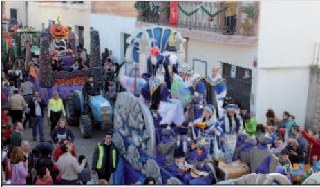
El rey Melchor lanzó infinidad de juguetes, entre ellos muchos balones, que se repartieron a los pequeños de la localidad.