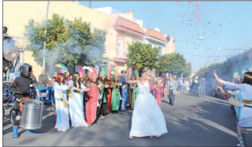
La Estrella de la Ilusión brilló durante todo el cortejo con un luminoso traje blanco y una sonrisa perenne.