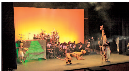
Concierto de Navidad de la Banda Municipal.