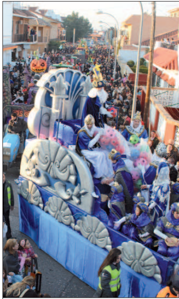
Numeroso público se dio cita en las calles más emblemáticas.