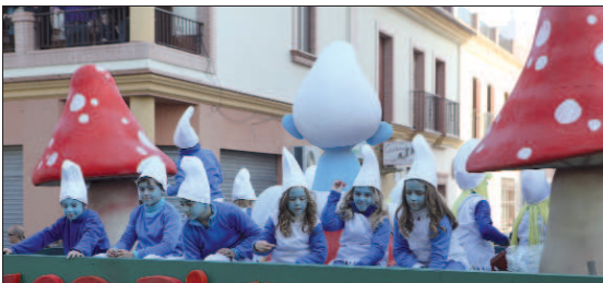
Los Pitufos tiñeron de azul el desfile de la Cabalgata. Los más pequeños repartieron caramelos al público asistente.