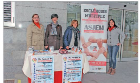
Socias de Asjem en una mesa informativa.

Asjem nació en el mes de octubre de este año, es una entidad sin ánimo de lucro cuya misión es ser punto de encuentro de enfermos con esclerosis múltiple. Para colaborar o formar parte de la asociación: 600323837. También está en Facebook: Asjem - Esclerosis M. - San José de la Rda. o en Twitter: @Asjem_Sj.