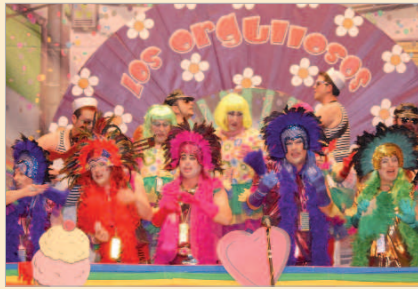
La chirigota de Utrera Los Orgullosos, actual primer premio.

El XXVIII Concurso de Agrupaciones reunirá en el Antonio Gala a un total de 31 agrupaciones, repartidas en trece comparsas y dieciocho chirigotas, siete de ellas de la localidad