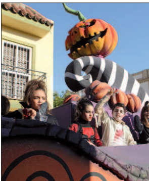
La carroza de Halloween repartió caramelos con los pequeños caracterizados.