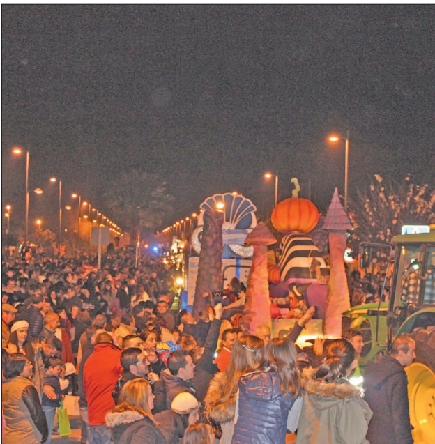
La llegada de la comitiva al Paseo del Almonazar concentró a numeroso pequeños y mayores para recoger los regalos en las carrozas.