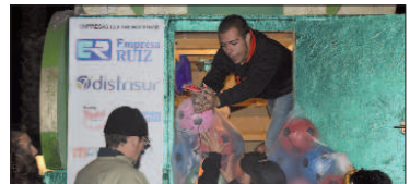
Todos los asistentes, independientemente de su edad, se lo pasaron en grande durante el recorrido.