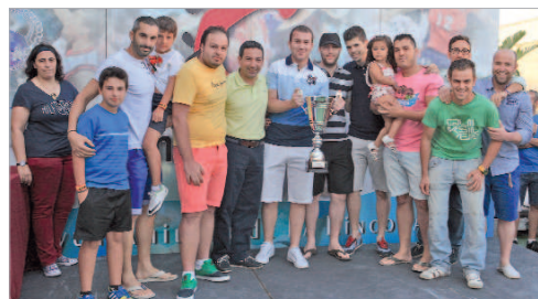
Los componentes del Trillo La Tronera, campeón de la Liga Local 2014.

La última semana de enero echará de nuevo a rodar la Liga Local de fútbol sala, que cumple veintiséis años y que se estructura, como es habitual, en cuatro divisiones, con 66 equipos en liza y en torno a 800 participantes, siendo el evento, netamente local, junto con el Día de la bicicleta, que más personas acumula.