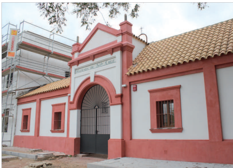
Hacienda Santa Cruz, futuro centro cultural y educativo.

El presupuesto sigue diez ideas fuerza como son: impulso al empleo, el mayor esfuerzo del Consistorio en toda su historia; impulso a la acción social con nuevas líneas y programas pioneros; a la juventud con un plan integral en todas las áreas; a la dinamización; a la escena urbana y su embellecimiento; potenciación de sectores emergentes como aeronáutica, fibra óptica o nuevas tecnologías; apuesta por las políticas de igualdad; más impulso al medio ambiente; honradez, eficiencia y austeridad y segunda congelación de impuestos consecutiva.