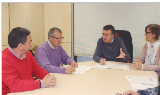
El alcalde junto con el edil de Deportes y el presidente del club en la firma.

entrega de llaves el importante papel que desarrolla la entidad. "La Rinconada tiene una amplia tradición deportiva y, en las edades que trabaja el Esfubasa, las enseñanzas en fútbol se complementan con una formación y educación en valores". El alcalde aprovechó para poner en valor el importante tejido asociativo