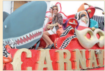
La carroza de la Diosa del Carnaval durante el año pasado.

El área de Fiestas Mayores del Ayuntamiento de La Rinconada ultima los preparativos para una nueva edición del Carnaval, que volverá a inundar de luz y color las calles del municipio y que celebrará diferentes actos, entre los que destaca el XVIII Concurso de Agrupaciones Carnavalescas, que reunirá en el Antonio Gala a un total de 31 agrupaciones, repartidas en dieciocho chirigotas y trece comparsas, desde el domingo, 1 de febrero, hasta el sábado día 7. Durante el certamen, habrá cuatro funciones preliminares, dos semifinales y la gran final.