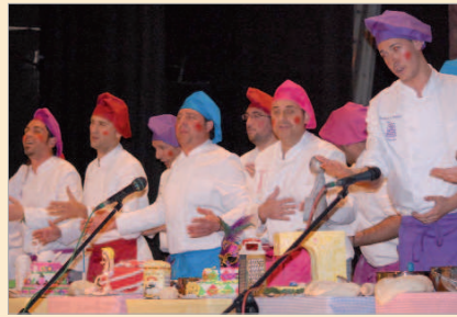
La comparsa alcalaña El Obrador logró el primer puesto.