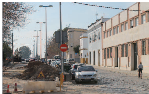
El nuevo carril bici llegará hasta la Hacienda Santa Cruz.