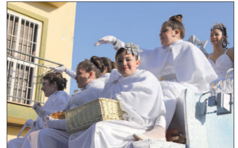
La Estrella abrió la comitiva acompañada de su séquito de pequeñas princesas y guió al resto de carrozas durante el recorrido.