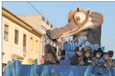
La carroza de Ice Age hizo la delicia de los más pequeños con uno de sus dibujos animados favoritos.