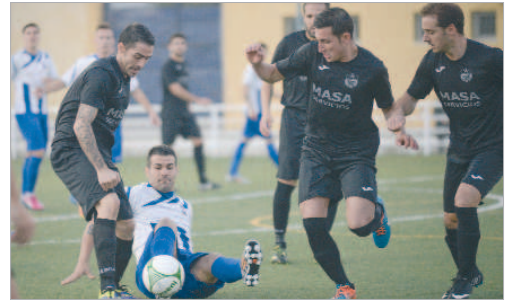
Gallardo y Andrades tratan de llevar el balón ante un jugador del Nervión.