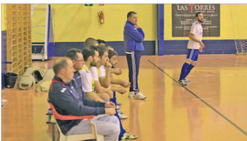
Colegui no pudo sentarse en el banquillo por sanción ante el Alchoyano.

Dos empates que no sirven a nuestros equipos para abandonar la zona de descenso pero que, al menos, cambian la dinámica en el lado del