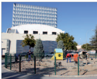
Parque Carmen Colomé Carranza.