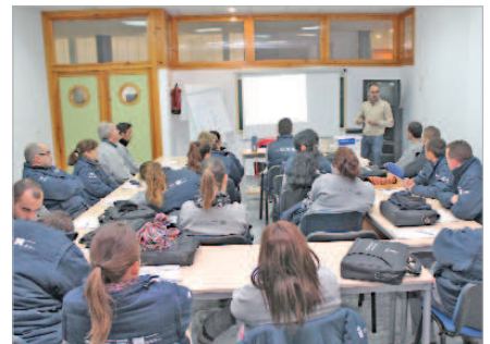
Se pondrán en marcha talleres de empleo.