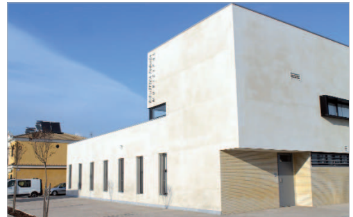
Biblioteca de Rinconada.

horas podrán acudir al centro acompañados de un adulto. Se visualizarán las películas 'Los pingüinos de Madagascar', 'Nimh: el ratoncito valiente' y 'Frozen'.