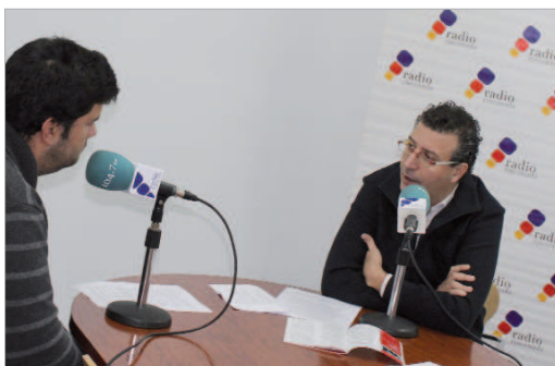
El alcalde analizó la actualidad municipal en los micrófonos de la Radio.