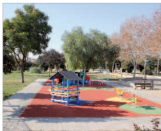
Parque Dehesa Boyal.