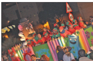
La carroza de Juguetilandia permitió el disfrute de los pequeños que iban sobre ella, y de sus padres y madres.