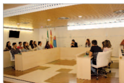
Incorporaciones del Emple@ Joven.