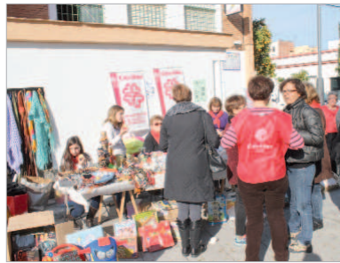
Agüera con uno de los colectivos participantes.

El parque del Pueblo Saharaui acogió por segundo año consecutivo la celebración