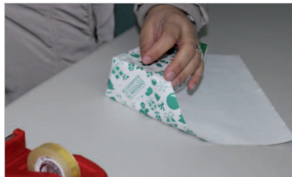
En el interior del autobús envolvían los regalos