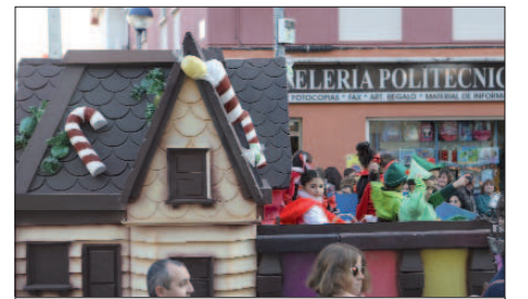
Los cuentos populares también tuvieron cabida en la fantástica cabalgata repartiendo ilusión.