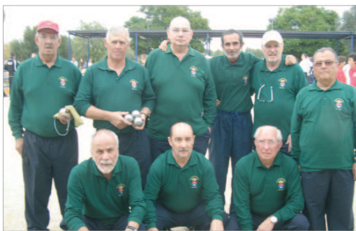
Formación del conjunto del Club Petanca San José, antes de un partido.

El equipo, que alterna sus entrenos en el parque Félix Rodríguez de la Fuente y el Francisco Sánchez, 'Castañita', donde compete, sigue mejorando sus registros año tras años y demostrando una gran precisión. Enhorabuena.