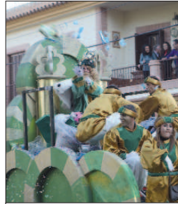
El rey Gaspar derrochó simpatía.