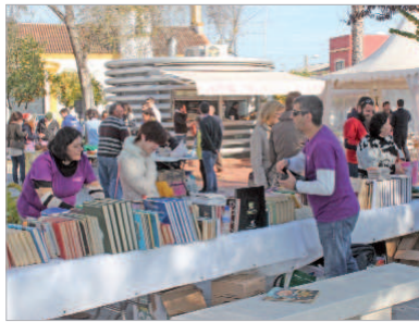
Un público numeroso acudió al mercadillo.

Un nutrido grupo de asociaciones participaron en esta cita prenavideña creando un espacio de convivencia entre las distintas entidades que pusieron a la venta de diversos artículos para su autofinanciación