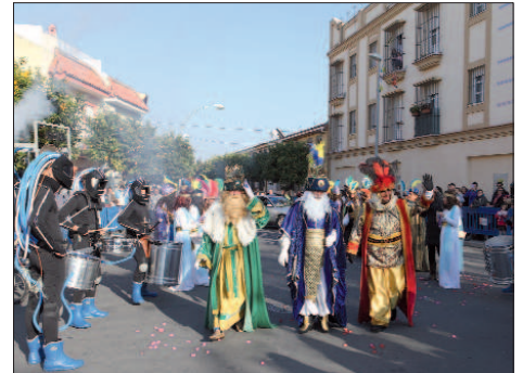
Los Reyes Magos llegaron a la plaza Quintero León y Quiroga para iniciar la cabalgata.