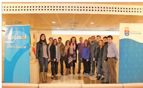
Jóvenes participantes en las Becas Primera Oportunidad (Imagen archivo).

El Ayuntamiento ultima los detalles para la convocatoria de una nueva edición de la Becas Primera Oportunidad, con las que pretende abrir una puerta al mercado laboral para jóvenes de la localidad que implique el estreno de su experiencia laboral. Como indica la delegada de Formación y Empleo, Raquel Vega, "la juventud se enfrenta a un grave problema de paro en este país y desde el Consistorio queremos apoyarlos en la medida de nuestras posibilidades porque ellos son el futuro del municipio". Al respecto, Vega subrayó que "un problema añadido es que las empresas demandan perfiles con experiencia y las personas que acaban su formación