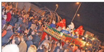
Los Pitufos a su llegada a San José dispuestos entregar ilusión por las calles rodeados de mucho público