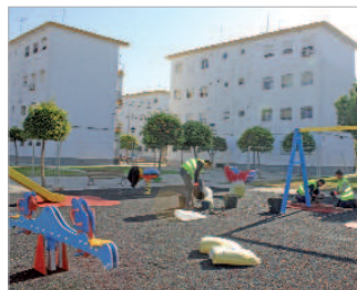
Parque Galileo Galilei.