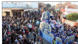
La ciudadanía no quiso perderse el evento.