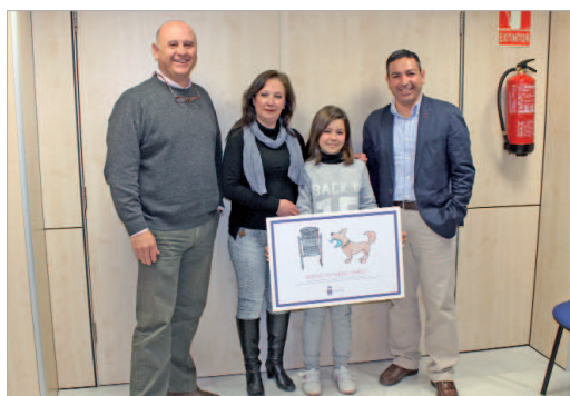
Los ediles de Vía Pública y Medio Ambiente con la ganadora del concurso.

"El objetivo de este certamen es seguir concienciando en la obligación, por parte de los propietarios de perros, de recoger los excrementos de la vía pública, y en este caso en los más pequeños para que tomen conciencia sobre la educación cívica y el respeto en