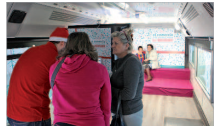
Más de mil fotos a lo largo de la campaña

#FERIA COMERCIAL cita para el sector de las bodas