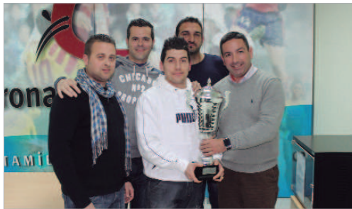
El conjunto de Los Talegas se hizo con el Campeonato por primera vez.

El equipo logró treinta puntos, fruto de diez victorias y sólo dos derrotas, frente a Bar El Quique (5-4) y frente al Bar Pepe, en la última jornada cuando ya era, matemáticamente, campeón. Patisquines acabó muy bien pero acusó su mal inicio con derrotas ante los Talegas y Temasi, mientras que Bar El Quique sumó 4 de los doce