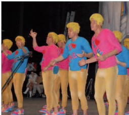
La chirigota 'Los bellos de punta'.

que las agrupaciones más destacadas de la provincia regalen sus coplas a los aficionados que vivan el carnaval desde las butacas del Antonio Gala y desde la pantalla ubicada en la carpa anexa al coliseo de La Rinconada".