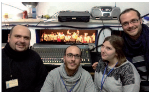
El equipo de Radio Rinconada en la pechera del Antonio Gala.

La semana previa al Concurso de Agrupaciones se emite 'Camino del Carnaval' con los protagonistas de la fiesta y, posteriormente, el certamen de coplas en directo