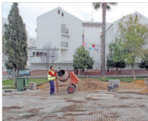
El parque La Estacada va a ser sometido a una profunda renovación.