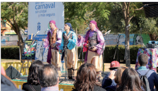
Voces del Carnaval amenizó la celebración del 'Carnavallito'.

Una representación de Voces del Carnaval de Cádiz amenizó una cita en la que se desarrolló el tradicional sorteo de entradas para el Concurso del Antonio Gala