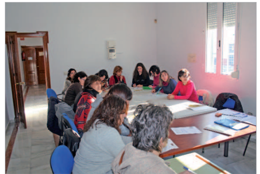
Las alumnas aprenden herramientas de crecimiento personal.

Así, las usuarias aprenden a disminuir síntomas de malestar tanto físico como psicológico, incrementan la habilidad para relajarse, conocen cómo reducir niveles de malestar e incrementar la habilidad y conocimiento para afrontar el dolor, desarrollan estados mentales positivos, incre-