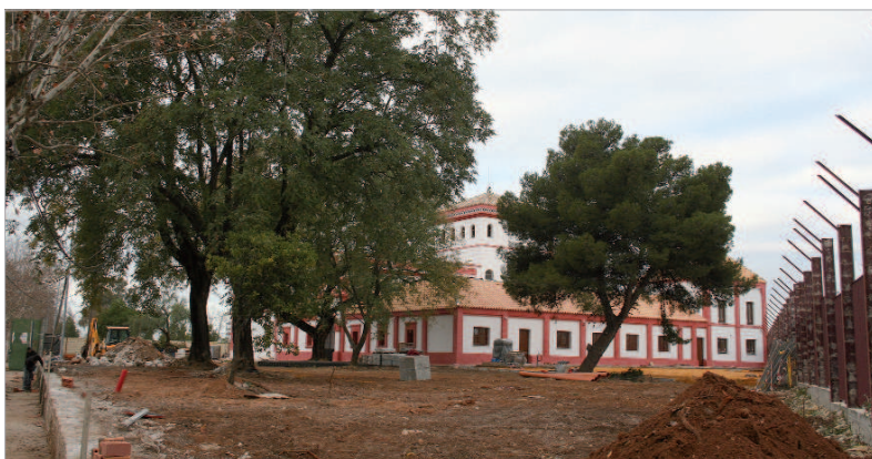
El antiguo muro está siendo sustituido por un cerramiento metálico.

Se está sustituyendo por un cerramiento metálico color caldera a tono con la fisonomía del edificio