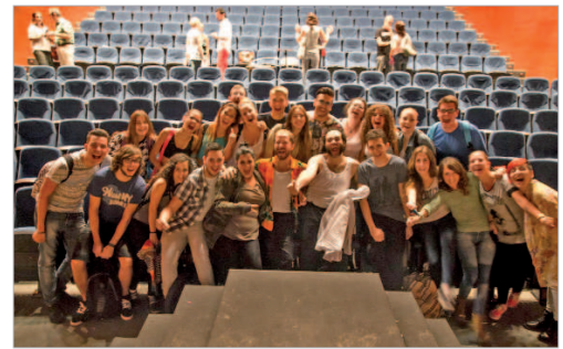
Alumnos del IES Laffon con los protagonistas de 'Patente de corso'.

Así, desde el año 2000 existe la Nave 19 dedicada a la creación de espectáculos de teatro de objetos, títeres y marionetas de pequeño y mediano formato dirigidos, en su gran mayoría, al público infantil. Las compañías residentes que hacen uso de ella son Búho Teatro, Teatro de las Maravillas, Flash Teatro, Desguace Teatro y Maluka