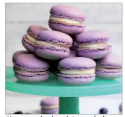
Macarons de chocolate y arándanos.