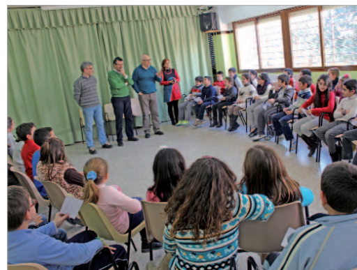
El alcalde mantuvo una charla distendida con el alumnado.