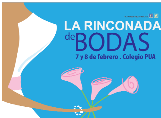
Fin de semana del 7 y 8 de febrero en el colegio PUA.

En "Rinconada de Bodas", se espera la participación de cerca de 60 empresas y entidades vinculadas al mundo de los eventos nupciales desde salones de celebración al alquiler de vehículos y carruajes. Para dar cabida a tan numeroso grupo de firmas,