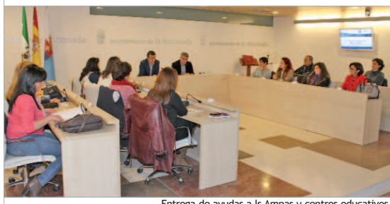
Entrega de ayudas a las AMPAS y centros educativos.

El nuevo programa Erasmus, aprobado por el Parlamento Europeo a principios de año, se enmarca en la estrategia Europa 2020, en la estrategia Educación y Formación 2020 y en la estrategia Rethinking Education, y engloba todas las iniciativas de educación, formación, juventud y deporte. En materia educativa abarca todos los niveles: escolar, formación profesional, enseñanza superior y formación de personas adultas.