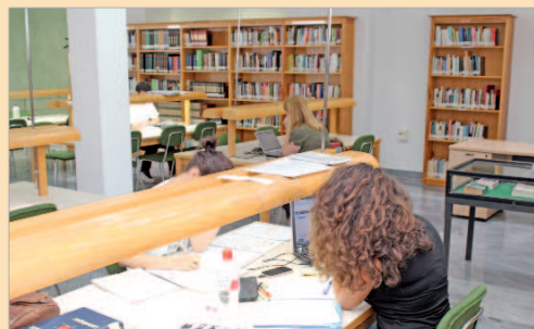
Estudio Abierto de la biblioteca de La Rinconada.

"Ampliar el programa a los fines de semana ha sido todo