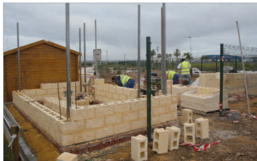
Obras de los aseos de los huertos del núcleo de San José.

Construcción de un aseo masculino, femenino y para personas con movilidad reducida