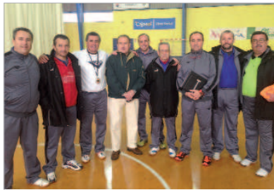
Foto de familia en las instalaciones del Agustín Andrade.

El estadio deportivo Felipe del Valle y el pabellón municipal Agustín Andrade sirvieron de escenario para la realización de las pruebas físicas de casi 200 árbitros provenientes de toda Andalucía. Así, en el feudo del San José se concentraron en torno a 140 personas, entre árbitros de Tercera y Primera andaluza, así como asistentes de