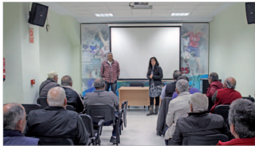
La edil del Mayor estuvo presente en la apertura de la jornada.

La agricultura ecológica es un sistema de producción de alimentos que combina las mejores prácticas ambientales, un elevado nivel de biodiversidad, la preservación de recursos naturales y una producción conforme a las preferencias de determinados consumidores por productos obtenidos a partir de sustancias y procesos naturales. Así pues, los métodos de producción ecológicos desempeñan un papel social doble,