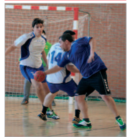
Reciente encuentro rinconero.