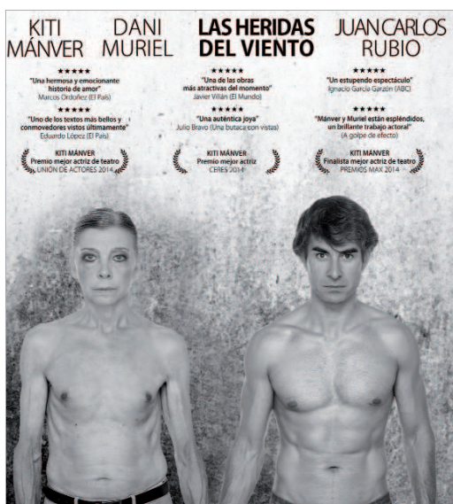
Uno de los espectáculos adheridos al Enredate de la próxima temporada.

Permitir que todos los ciudadanos tengan acceso a la cultura es una de las principales premisas que dictan las decisiones del área en cuestión. Así, La Rinconada forma parte de tres circuitos cul-