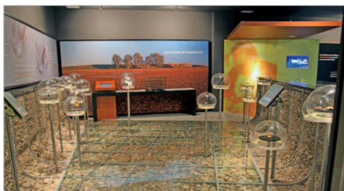
Imagen del interior del museo.

La inscripción se puede realizar hasta el jueves 19 de febrero en el museo, los miércoles, jueves y viernes de 17.00 a 20.00 horas; sábados de 10.00 a 14.00 y de 17.00 a 20.00 horas; domingos de 10.00 a 14.00. También es posible en: museo@aytolarinconada.es .