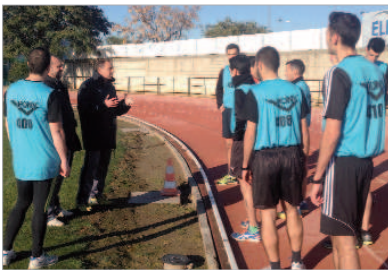
Momento durante las pruebas en el Felipe del Valle.