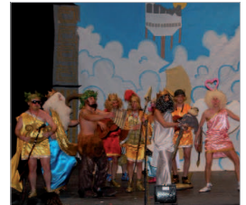
Si no lo creo, no me véis.