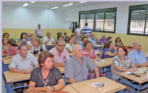
Imagen de archivo de una de las promociones de Aula Abierta de Mayores.

Así, este programa ofrece un programa formativo a la población mayor para que se enriquezcan mutuamente con la aportación del saber y de la experiencia de las personas mayores; propicia el acceso a los bienes culturales y al aprendizaje activo; facilita un espacio de debate cultural, social y científico que posibilite que puedan desarrollar permanentemente sus capacidades personales, intelectuales y sociales para potenciar su autovaleoración y autoestima, una actitud de preparación constante y una mayor capacidad para responder a