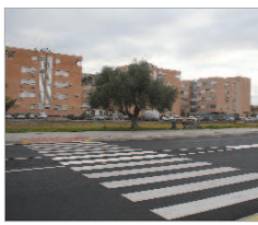
Avenida Jardín de las Delicias.

En el núcleo de San José, las actuaciones serán en las calles Madrid, Juan de la Cueva, Jorge Manrique, Carretera Bética, San José, Avenida Jardín de las Delicias, Avenida del Cádiz, Vereda de Chapatales, Boyeros, Los Carteros,