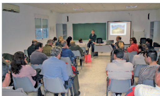
Jornada de puertas abiertas del centro de adultos.

El municipio cuenta con el Centro de Adultos 'Cerro Macareno' que dispone de dos sedes en ambos núcleos de población, en La Rinconada en la calle Pura y en San José en Virgen de la Esperanza. El centro ofrece la posibilidad de sacar el título de Graduado Escolar en la ESO, inglés básico con posibilidad de certificación académica oficial por la Escuela de Idiomas, preparación de la prueba de acceso al Grado Superior de Formación Profesional, preparación de la prueba de competencias básicas con posibilidad de obtención de certificación profesional, español para inmigrantes, iniciación a la informática, grupos de alfabetización y neolectores para aprender y mejorar la lectoescritura y grupos de Patrimonio Cultural para la inserción de la sociedad en la cultura autóctona.