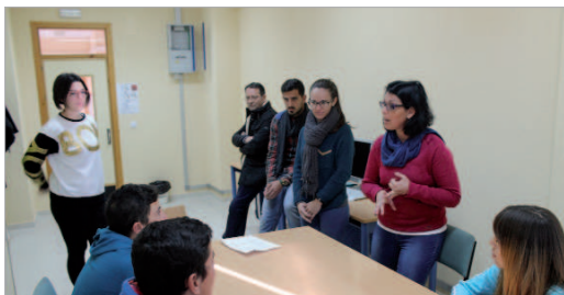
Dos voluntarios y un profesor del centro trabajan con el alumnado.

Las siglas JUMCA responden a Jóvenes Universitarios para la Mejora de la Convivencia en las Aulas. Este es el nombre de un programa que el área de Juventud viene desarrollando en el IES Antonio de Ulloa el pasado curso 2013/2014 y que en este nuevo curso también se va a desarrollar en el Miguel de Mañara.