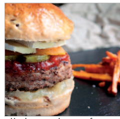
Hamburguesa de quesos franceses.