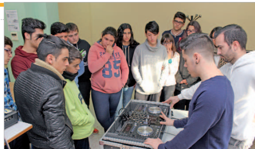
Los jóvenes observan al profesor en la master class.

mundo de la música electrónica pero que además aprendan qué es la auténtica música electrónica que, en su opinión, está últimamente muy deteriorada para el gran público. Los asistentes pudieron presenciar cómo se desarrolla el proceso de una pro-