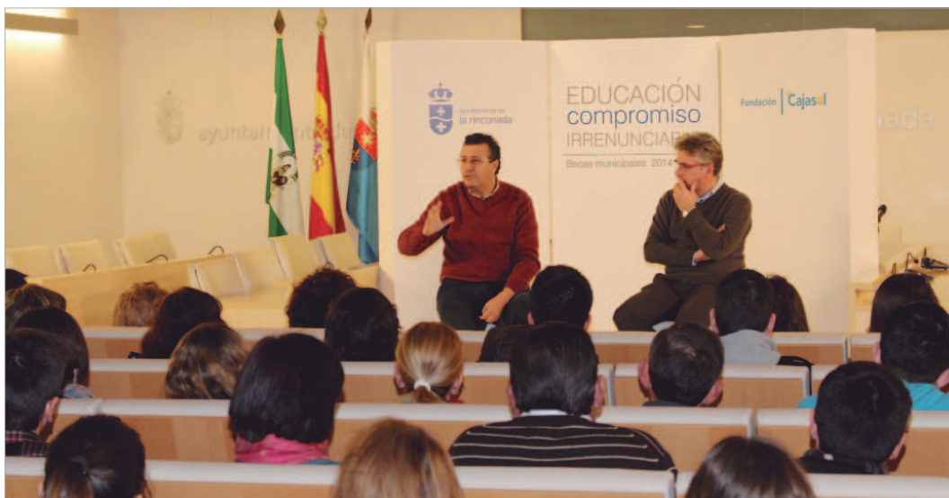
100 estudiantes universitarios se han beneficiado de las becas de ayuda al transporte y a material de estudio.

Pero la inversión del Ayuntamiento en educación pública no se limita a las becas, sino que también atiende inversiones, como la actualización del sistema contra incendios y de seguridad, el mantenimiento de los centros educativos para que estén en perfecto estado de revista y contribu-