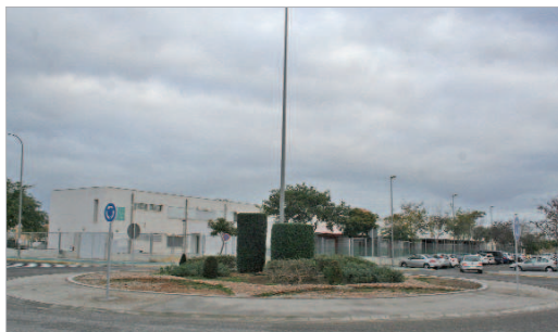
Imagen de la rotonda en obras.

Las obras consisten en la colocación de césped artificial y diferentes elementos ornamentales