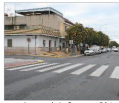
Imagen de la Carretera Bética.