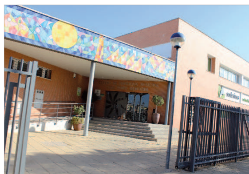
Centro de Formación 'Juan Pérez Mercader' donde se ubica el programa.

A través de este programa se ofrecerán las claves y herramientas necesarias para fomentar y poten-