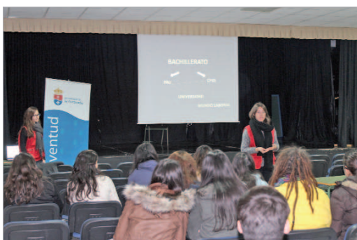
Momento de la jornada en el IES Miguel de Mañara.

Para ayudar a la toma de decisiones, el área de Juventud ha puesto en marcha la III edición de las Jornadas de Orientación Educativa. Con estas jornadas se