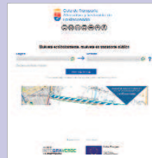
Imagen de la aplicación web.

viaje para que el sistema le muestre la ruta contemplando únicamente los servicios que operan en ese horario. Pulsando 'nueva ruta' el sistema empieza a calcular cual es la mejor forma de llegar al punto de destino utilizando únicamente transporte público y trayectos a pie. El sistema se sirve de información introducida manualmente de la línea urbana de La Rinconada, las interurbanas del Consorcio de Transportes y los datos ofrecidos por otros servicios como Google Maps.