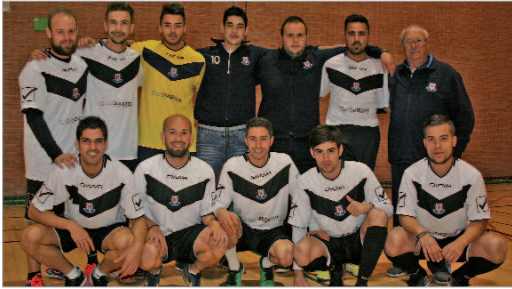
El equipo Máster Rápido tuvo opciones de triunfo hasta el final del año pasado.