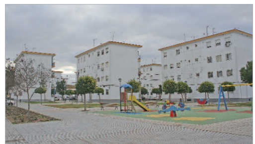
Parque Galileo Galilei finalizado.