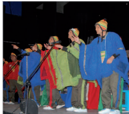
Los Surferos traen 'Los A'guasiestas'.