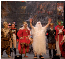
Chirigota 'Los máquinas del tiempo'.