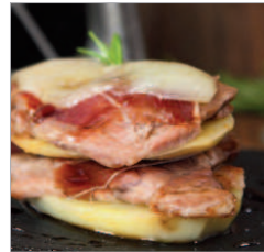
Milhojas de patatas e ibéricos.