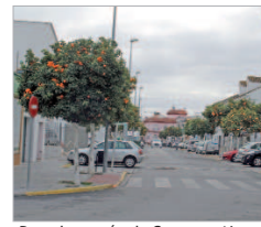
Paso de peatón de Carretera Nueva.

Paseo del Almonazar, Córdoba, Avenida de La Unión, Diego Martínez Barrio, Foro de Ermua, Avenida Ain Beida y Alberto Lista, mientras que en el núcleo de Rinconada, las vías sobre las que se