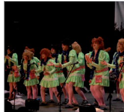
'Estrella Fugá', de Jorge de la Rosa.