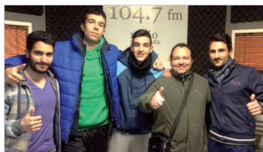
La chirigota local 'No sé pa' que me meto', en los estudios de la Radio.

El próximo 7 de febrero, a partir de las 11:00 horas, el 104.7 FM repondrá la final del Carnaval