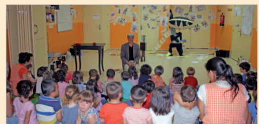
Espectáculo de Abecedaria en la Escuela Infantil Santa Cruz.

Los espectáculos contemplan diversos géneros y temáticas, creados por compañías y formaciones musicales de reconocido prestigio. Además, cada obra va acompañada de una guía didáctica elaborada por los asesores de la consejería, especialistas en distintas etapas y modalidades para que los asistentes puedan trabajar en clase sobre la obra en cuestión.