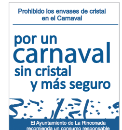
Imagen de la campaña.

En el núcleo de Rinconada, desde el lunes, 9 hasta el jueves 12 de febrero, podrán recogerse las botellas de plástico en el Antonio Gala, en horario de 18:00 a 20:00 horas. El viernes se iniciará la