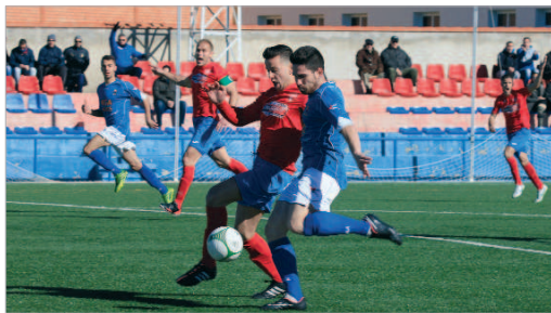
Saborido volvió ante el Peñarroya, pero se retiró del campo lesionado.

Tras el reencuentro con la victoria frente al Lora y el contundente triunfo en Villanueva, el San José parecía tener un tramo de