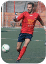
Plusco Jugador del San José

El delantero cañamero no está teniendo fortuna de cara al gol. Tuvo varias ocasiones inmejorables ante La Barrera que, todo hay que decirlo, él mismo se fabricó, pero no fue capaz de batir al meta Carlos a pesar de la claridad de los remates.