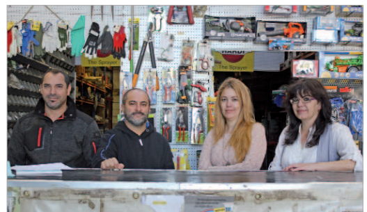
En Asema se puede encontrar gran variedad de herramientas y maquinaria.

#COMERCIO LOCAL mobiliario y decoración para todo tiempo de clientes