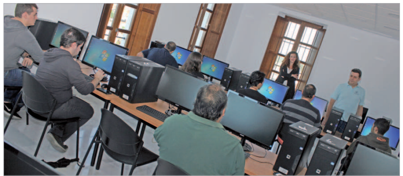
La delegada de Formación y Empleo visitó a los usuarios de uno de los cursos.

Vega señala que "las temáticas de los cursos son en sectores con perspectiva laboral emergente y éstos dan una primera visión e iniciación en el tema que después se pueden completar con otras acciones formativas". Andalucía Compromiso Digital trabaja en una red de alianzas con empresas mecenazas, entidades colaboradoras y adheridas e instituciones que impulsan el proyecto en las comunidades. Asimismo, tiene un amplio catálogo de cursos gratuitos presenciales, on line o personalizados y también servicios enfocados a la mejora de la empleabilidad con un alto componente de nuevas profesiones TIC.