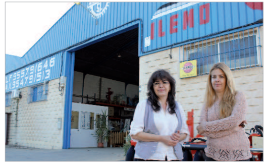
Su sede de La Rinconada se encuentra en Ctra. A-8005, km. 7,5.

En estos momentos, cuentan con una sede en La Jarilla y otra en Portugal, y manteniendo las miras puestas en alto, con el propósito de superarse y seguir creciendo juntos.