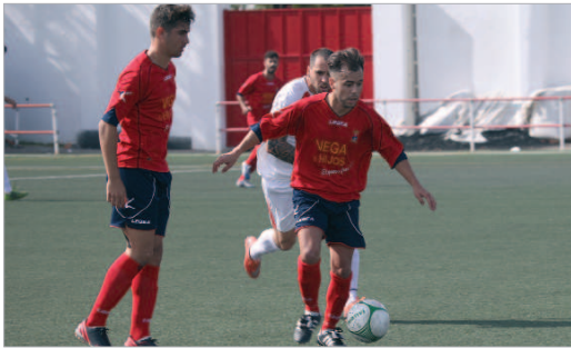
Paquito, procedente del Torre de la Reina, ha sido el último en llegar.

Los cañameros dejan escapar puntos ante rivales teóricamente inferiores que le alejan de la pelea por los puestos que dan opción a Tercera división