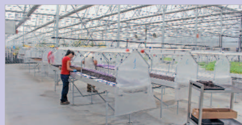
Las nuevas instalaciones de Pioneer.

Un claro ejemplo de que La Rinconada es una ciudad para invertir y que se trabaja desde el Consistorio en ese sentido es la vuelta al municipio de Pioneer, que se encuentra desarrollando un centro de investigación sobre el girasol que permitirá la creación de 80 puestos de trabajo.