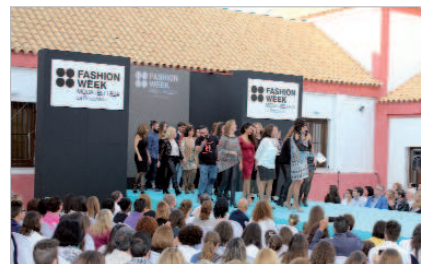
Los comerciantes participantes subieron a la pasarela.