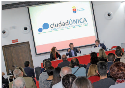
Presentación a los colectivos y ciudadanía de 'Ciudad Única'.