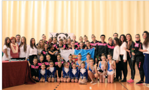
La familia del Oso Panda con los ediles de Deportes y Protección Civil.

poco, también hubo un photocall para que todos los conjuntos, bajo la mirada del Oso Panda que da nombre al club, pudieran tener su foto recuerdo. En lo meramente deportivo, también fue una delicia ver el magnífico ambiente y la convivencia existente entre todos los conjuntos participantes. Respeto absoluto, deportividad extrema y hermandad entre los asistentes. Y sobre el tapiz los olés y los aplausos se repartieron entre todas las participantes, si bien sonaron más fuerte cuando participaban los diferentes conjuntos de la entidad rinconera. Cinco medallas fue el bagaje del Oso Panda, que tiene como mérito añadido que cuatro de ellas fueron en categoría Absoluta. Así, el Junior obtuvo la plata, mientras que el Benjamín, Infantil y Senior obtuvieron el