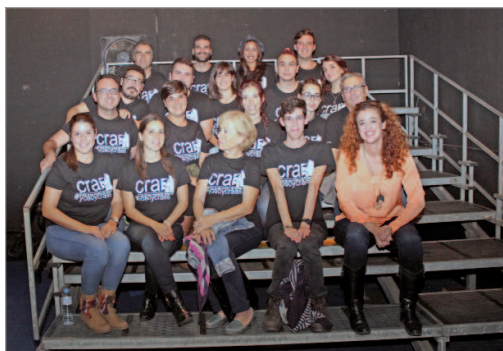
La familia del Craes posa con Vega en el Gala.

Abrevadero, y continuará el 28 del mismo mes con el espectáculo 'Hérase una vez' del grupo de danza artística y veteranos del CRAES, Teansari.