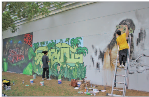
Imagen del concurso de graffiti de la edición anterior.

El sábado 7 de noviembre comenzará con el concurso de graffiti en la hinca, ubicada en el tercer tramo del Paseo del Almonazar desde las diez de la mañana. El objetivo es mostrar a la población en general la creación cultural de los jóvenes y promover el graffiti como actividad de creación cultural entre los