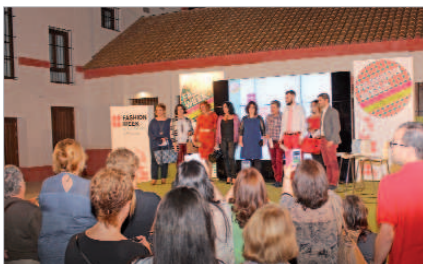
Algunos afortunados disfrutaron de un cambio de look gratuito.