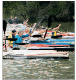
Una de las pruebas disputadas.