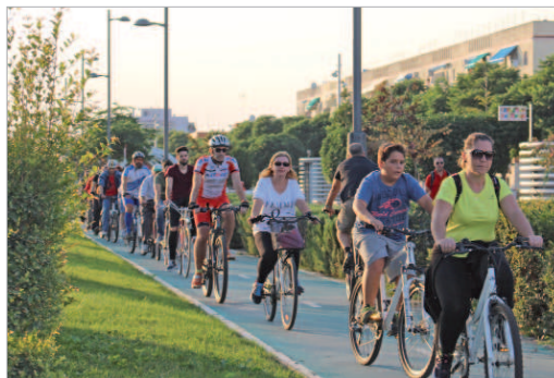
Los ciclistas conocieron la red de carriles bici local.

Un año más, los centros escolares se han volcado con la iniciativa. Así los alumnos de Sexto de Primaria de los nueve centros de la localidad, han participado en la realización de diversas charlas para explicar la