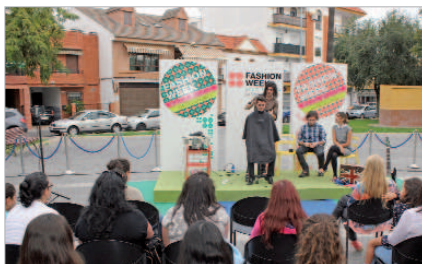
Tres empresas realizaron demostraciones de belleza en la calle.