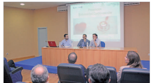
El Centro Joven 'La Estación' acogió la primera charla saludable.

comienzo de esta jornada de que en los próximos meses se impartirán “ponencias como la de hoy, sobre envejecimiento activo, prevención de lesiones en el deporte y medicina deportiva, efectos perjudiciales del dopaje sobre la salud en el deporte competitivo y popular; nutrición humana, fibromialgia, efectos perjudiciales de las drogas sexuales y planificación familiar; enfermedades de transmisión sexual, alteraciones de la piel causadas por el sol y prevención, enfermedades degenerativas, cáncer y su prevención y todos los temas relacionados con la salud que repercutan o interesen a la ciudadanía”.