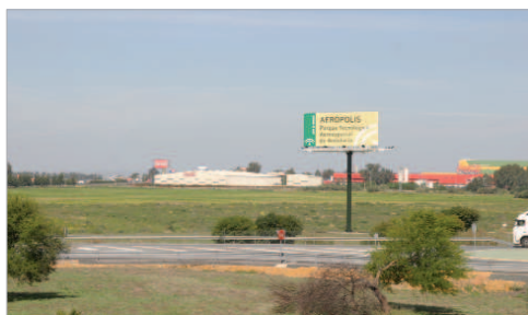
Los terrenos ubicados junto a la N-IV, donde se asientan grandes empresas.

Con la apertura de la nueva Autovía, La Rinconada refuerza su condición de ciudad atractiva para el asentamiento de empresas. No sólo sale reforzado el polígono 28 de Febrero, sino que también resultan beneficiados El Malecón, Majaravique o las zonas que se destinan a uso terciario en la zona de Pago de Enmedio. Sin embargo, los suelos industriales del municipio son mucho más amplios, con zonas como los Cañamos, donde se concentran pequeñas y medianas empresas de