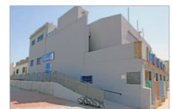
Centro Joven 'La Estación'.

"Tanto 'La Estación' como 'El Rincón' son espacios propios para que la juventud del municipio lo hagan suyo, disfrute y aprenda con las actividades propuestas