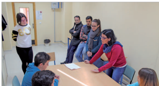
Más información en La Estación y El Rincón.

Más información en el Centro Joven 'La Estación', Punto Joven 'El Rincón', en el teléfono 954793900 o en el email fomacionjuvenil@ayto-larinconada.es