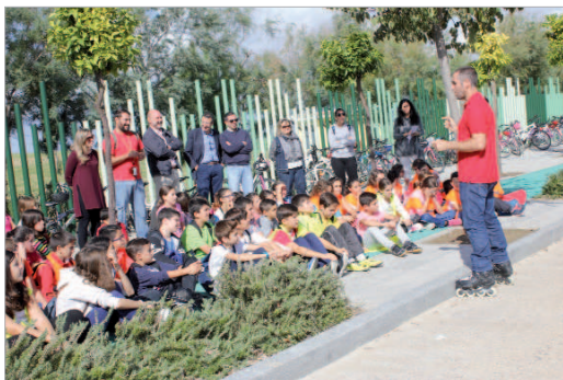
El alcalde visitó las actividades dirigidas a los colegios de la localidad.

El Ayuntamiento celebra una nueva edición de la Semana de la Energía para concienciar a la ciudadanía, especialmente a los escolares de la localidad