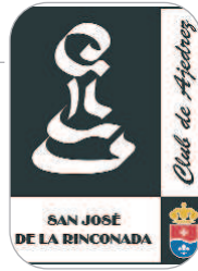
San José Ajedrez

Volvía después de varias semanas sin jugar por culpa de una lesión y tuvo que ponerse bajo palos por la expulsión de Dani cuando no había portero suplente. Tuvo valor y encima salvó un punto parando el penalti en el último minuto.