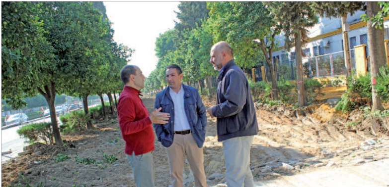
Los ediles de Urbanismo y Vía Pública visitaron las obras de la segunda fase de la avenida 28 de Febrero.

Abarcan unos 6.500 metros desde la esquina de la calle Goya hasta la rotonda de entrada en La Rinconada y se financian con cargo al Plan Supera