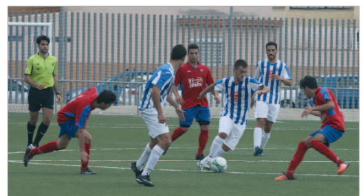
El Rinconada logró una remontada épica ante el Puebla.