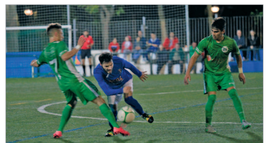
Barriga es un fijo en la medular cañamera cuando le respetan las lesiones.

punto. El marcador final (1-2), aleja a los de Maldonado de una pelea por el ascenso en la que Espeleroño no falla y en la que los perseguidores no se dejan puntos en casa ante rivales de abajo.