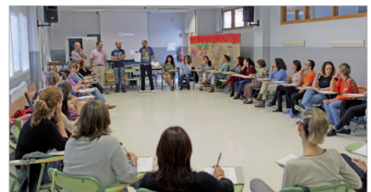
La comunidad educativa se dio cita en el primer día del programa.

este centro a la hora de aplicar el programa es el de trabajar conjuntamente con los Centros de Primaria, para así poder hacer un seguimiento de las habilidades socializadoras conseguidas por el alumnado en Primaria y la evolución de su posterior tránsito a Secundaria. Además, con el desarrollo de este programa se promoverá una educación en valores como la empatía, la tolerancia y el diálogo, propuestas para afrontar los conflictos dentro de un comporta-