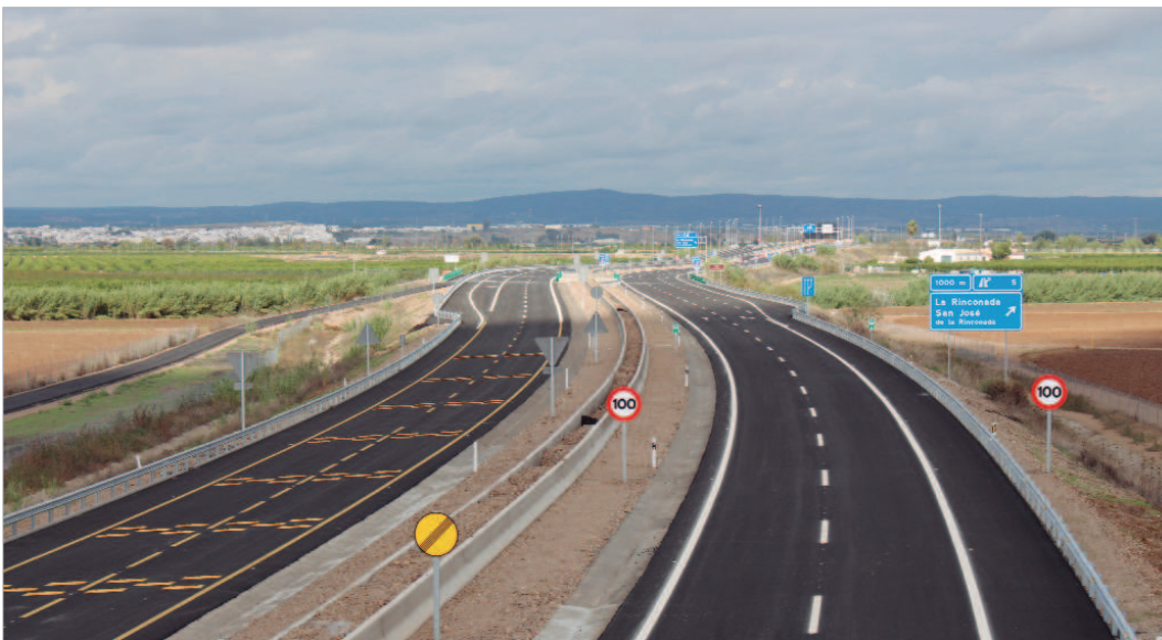
Con esta segunda fase se suman 4,8 kilómetros a los 5,6 kilómetros de la primera fase.

Las obras pulen los últimos detalles y pondrán en servicio una nueva infraestructura que no sólo mejorará las comunicaciones con los pueblos vecinos y con la capital, sino que favorecerá la atracción de empresas con la consecuente dinamización económica y creación de puestos de trabajo