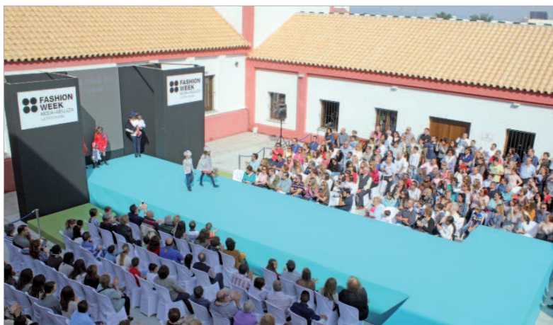
El desfile familiar puso el broche de oro a una semana de actividades relacionadas con la moda y la belleza local.

Además de la afluencia de personas en los actos, se ha elaborado una intensa estrategia de comunicación, no sólo para anunciar fechas y horarios, sino para dar a conocer a las empre-