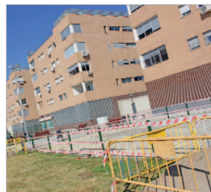
Se va a construir una pista polideportiva.

La experiencia de instalar pistas deportivas al aire libre se ha hecho con éxito anteriormente en zonas como el Bulevar del Almonazar y, en este sentido, desde el consistorio se está trabajando en esta línea en otras zonas del municipio. "Gracias a los fondos provenientes del programa Aepsa Garantía de Rentas, estamos avanzando en zonas deportivas con estas características, que