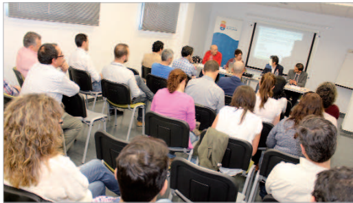
Los empresarios conocieron los trámites para contratar con la Administración.

Los asistentes fueron asesorados por un técnico de la Administración local que explicó los procedimientos de licitación públicos