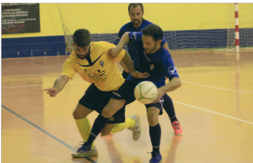
Toni trata de proteger la pelota ante un jugador del Aquasierra.

La victoria en Dos Hermanas ante el Nazareno refuerza la clasificación de los rinconeros