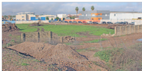
Se pondrán en servicio 10.000 metros cuadrados productivos más.