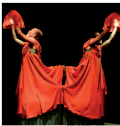
DA. TE DANZA.

El área de Cultura del Ayuntamiento de La Rinconada pone en marcha la 21ª edición del Festival de Teatro para niños y