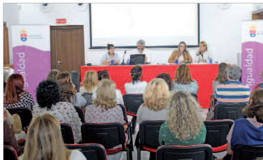
La guía fue presentada en la Hacienda Santa Cruz.