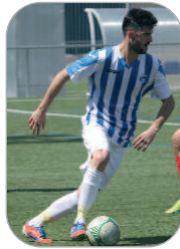
Ávalos Jugador del Rinconada

El delantero cañamero no está teniendo fortuna de cara al gol. Tuvo varias ocasiones inmejorables ante La Barrera que, todo hay que decirlo, él mismo se fabricó, pero no fue capaz de batir al meta Carlos a pesar de la claridad de los remates.