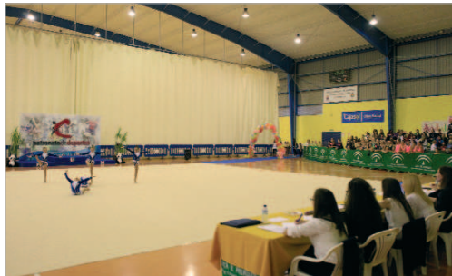
El conjunto Alevín de Base, en pleno ejercicio en el Agustín Andrade.

bronce. Por si esto fuera poco, en la categoría de Base, el Alevín se llevó el oro ante los vítores del público. Ahora empearán a sucederse tor-