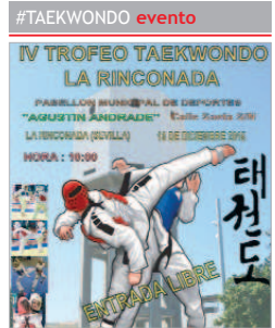
Cartel del evento.