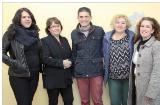
Las empresas subvencionadas se reunieron con el delegado de Comercio.

empresas locales las que han presentado su solicitud de petición para estas ayudas, para cuya adjudicación se han tenido en cuenta en los criterios de valoración el coste de participa-