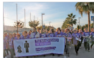
La marcha se inició en el bulevar Almonazar.