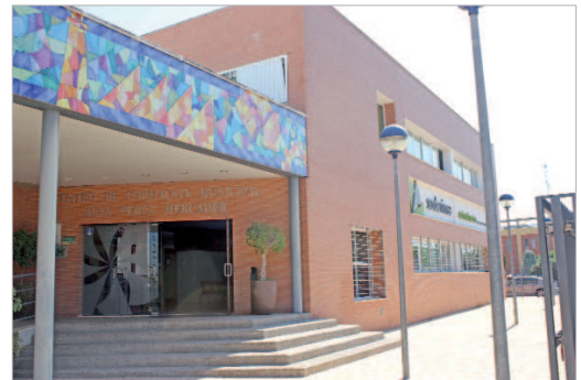
Centro de Formación Municipal Juan Pérez Mercader.

En la edición anterior del Programa Andalucía Orienta tuvo lugar desde diciembre de 2014 hasta julio de 2015, fueron realizadas un total de 1722 aten-