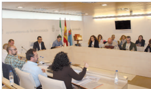
Pleno en el que se aprobaron las ordenanzas fiscales de 2016.

Por otro lado, recientemente se aprobaron las ordenanzas fiscales para el 2016 caracterizadas por la congelación general de impuestos,