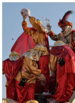
Rey Baltasar en La Rinconada.

Como cada 5 de enero, la Cabalgata de Reyes repartirá caramelos y alegría a los niños y mayores que la esperan con ilusión en las calles de la localidad.