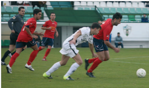
Negro tuvo que retirarse lesionado en Pozoblanco tras una dura entrada.