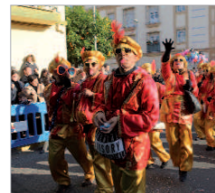
Beduínos en La Rinconada.