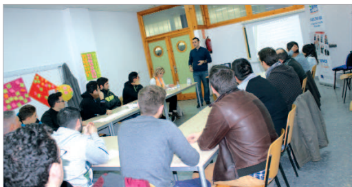
Uno de los cursos impartidos por los alumnos de Vives Emplea.

En estos cinco talleres realizados por Vives Emplea La Rinconada se ha transmitido información sobre contenidos Smart, de marca personal o procesos selectivos a alrededor de 40 personas