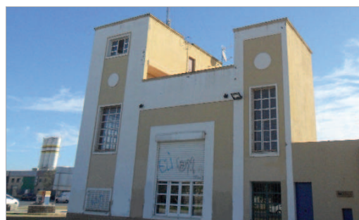
Radio Rinconada volverá a trabajar de la mano del comercio local.

Radio Rinconada participará de forma activa en la promoción de las distintas actividades que el comercio local el municipio realiza con motivo de la campaña de Navidad. Así, tanto a nivel de cuñas publicitarias como de información al respecto -con recordatorio de horarios y entrevistas a