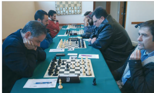
El Club Ajedrez San José logró el título tras empatar con Tussam.

De hecho, el club sigue en la actualidad con su labor de promoción y se encuentra inmerso en el quinto Circuito de Bares, en