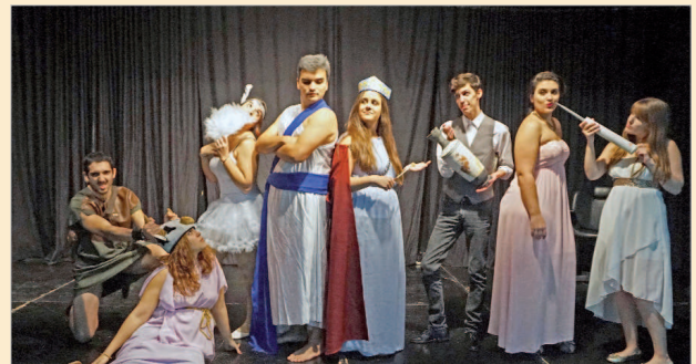
Teansari caracterizado como su última obra.

El precio de la entrada es de tres euros, de los que uno irá destinado a 'Crecer Jugando' y también a la entrada de la gala habrá un stand donde todo aquel que quiera podrá entregar un juguete para 'Cruz Roja' que irá destinado a todos los niños que no tengan juguete estas navidades.