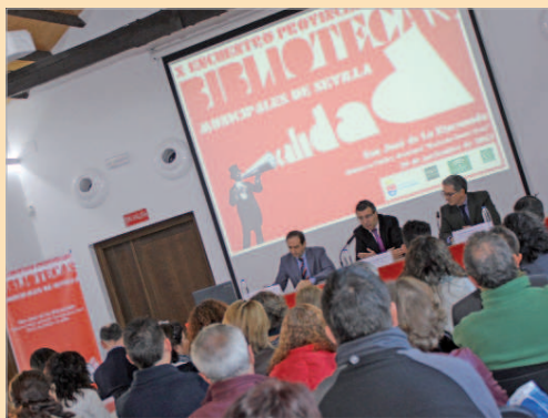
La Hacienda Santa Cruz acogió este encuentro.

El primer edil rinconero ha dado la bienvenida a los asistentes a la