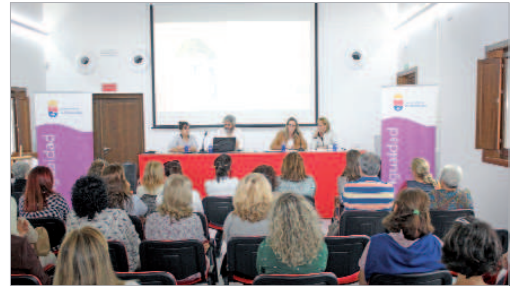
Presentación de una guía sobre el maltrato.

procesos de ruptura, orientación y preformación para el empleo a mujeres y organización, promoción y puesta en marcha de cursos E.P.O.