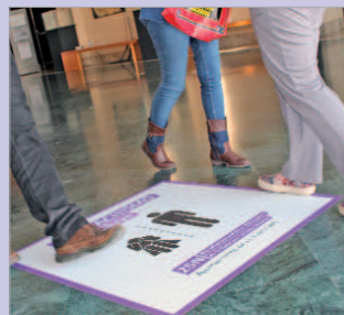
Vinillos puestos en los edificios públicos.