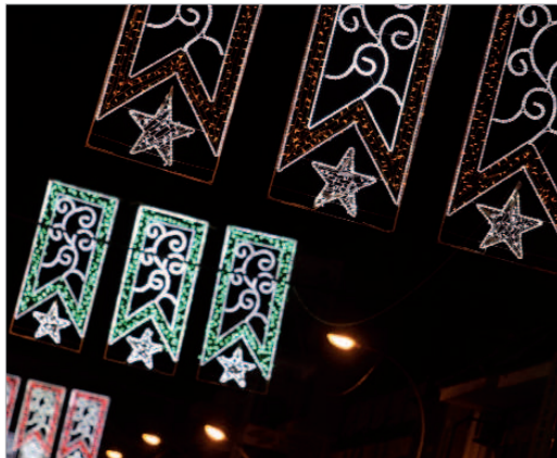
Las luces de colores serán las protagonistas de las calles.

Para esta ocasión, el Ayuntamiento de La Rinconada ha utilizado una vez más bombillas de bajo consumo