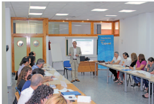
Imagen del curso de Liderazgo e inteligencia emocional.

Y el plan de Ayudas para la Formación no Reglada ya se encuentra en su tercera convocatoria, colaboración público privada con la que se pretende ayudar a las personas demandantes de empleo a financiar cursos en centros homologados que les permita mejorar su empleabilidad.