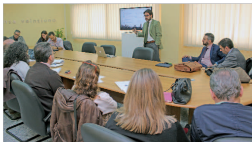
El seminario contó con expertos en la temática a impartir.