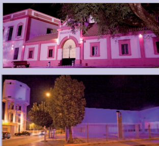
Edificios municipales iluminados en color morado.