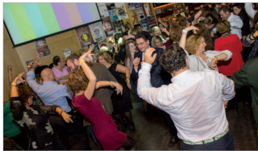
Un instante de la celebración en la sala Vintage.

La próxima edición permitirá celebrar el 40 Aniversario de la institución y, por ello, sus integrantes han decidido llevar a cabo una serie de actos conmemorativos, que