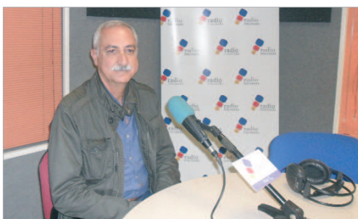
La Radio colabora en la difusión de la campaña del Banco de Alimentos.

La Gran Recogida de Alimentos, como se denomina esta acción, tuvo lugar el fin de semana pasado en los principales hipermercados de la localidad. El resultado fue muy positivo y se batieron los kilos logrados el año pasado, lo que volvió a poner de manifiesto