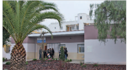
Centro de Información a la Mujer en la barriada La Paz.

miento de relaciones y cauces de participación con colectivos e instituciones en aquellas actividades relacionadas con el género femenino, fomento del movimiento asociativo, estudio e implantación de programas de actuación para la mujer en las distintas áreas municipales y adecuación de los existentes a las necesidades detectadas, realización de actividades de sensibilización, divulgación y formación ciudadana que promuevan la Igualdad de Oportunidades entre mujeres y hombres, así como la erradicación de la violencia de género, atención y Asesoramiento Jurídico y Psicológico a mujeres víctimas de violencia de género o inmersas en