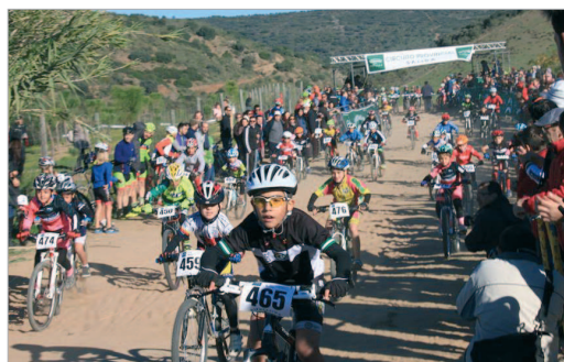
Integrantes del Cañamito Bike en Villaverde durante el Circuito Provincial.