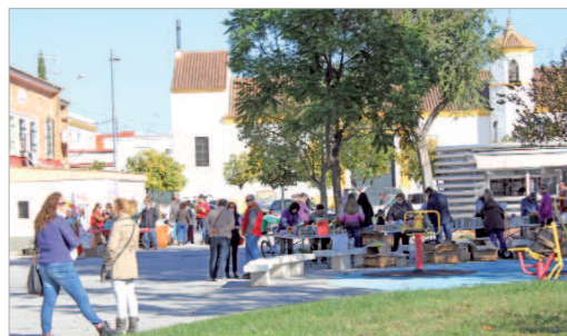
El parque del Pueblo Saharaui acogió el mercadillo.