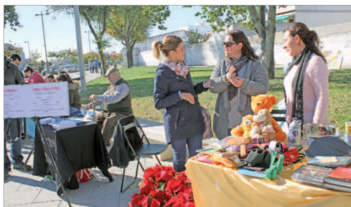
La edit de Cooperación Internacional acudió al mercadillo.

pudieron comprar aquellas personas que se acercaron al mercadillo donde además se pudo disfrutar de un ambiente plenamente navideño ambientado con villancicos.