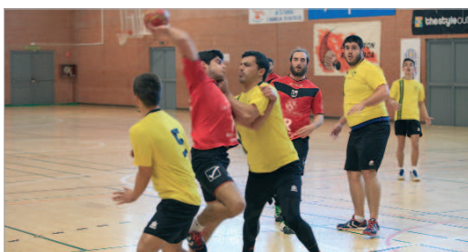
El duelo ante el Lauro fue más complejo de lo esperado.

Puede que algunos rivales le pongan en más aprietos y la renta en el mar-