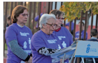
Lectura del manifiesto del 25N.

Por tercer año consecutivo, La Rinconada ha celebrado una marcha reivindicativa por el Día Internacional de la Eliminación de la Violencia contra la Mujer. Equipados con camisetas de color violeta, serigrafiadas con el lema de la campaña de este año 'Tu machismo te excluye', alrededor de un millar de vecinas y vecinos de la localidad, junto con colectivos deportivos, sociales y culturales participaron en esta marcha que comenzó en la fuente de Emasesa, en el primer tramo del Paseo Almonazar y que finalizó en la Hacienda Santa Cruz en donde se leyó un manifiesto institucional contra la violencia de género apro-