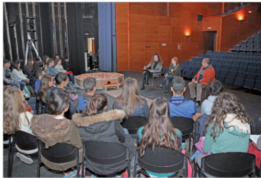
La actriz acompañada de la edil de Cultura y un profesor del instituto.

La intérprete charló con los jóvenes acerca de su profesión. Así, señaló que "la versatilidad en el actor tiene que ver con uno mismo, más que versatilidad es humanidad. El trabajo de actor es una profesión y ha ser entendido así, esto es técnica, hay inspiración, arte, muchos elementos que uno tiene o no, pero para potenciarlo es necesario la técnica". También destacó