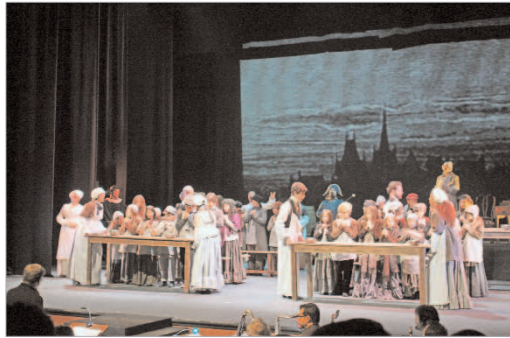
La Tarasca presentó 'Oliver Twist' en el festival.