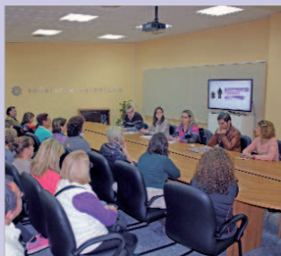
Presentación de los colectivos del programa.

relatos escritos por mujeres con el fin de conseguir un mayor empoderamiento sobre sus vidas. Además, el Instituto Andaluz de la Mujer ha puesto en marcha la campaña 'El amor no se mide' que se está realizando a lo largo del mes de noviembre y diciembre con los cursos de ESO del Instituto de Educación Secundaria San José. También con un firme objetivo de concienciación social, los Centros Culturales de La Villa y el Antonio Gala son el escenario de una nueva edición del Cine Forum, en la que se proyectan películas de temática social y de igualdad entre géneros, como por ejemplo 'Solás' o 'En tierra de hombres'. Como colofón a esta programación que pone en marcha el área de Igualdad, el día 3 de diciembre en el Centro Cultural de La Villa a las 19:00 horas se proyecta el corto 'Ángel' que trata un caso de violencia de género basado en hechos reales.