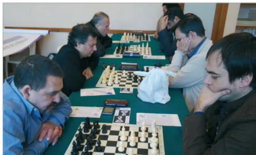
Los rinconeros aprovecharon su ventaja previa al compromiso para ganar.