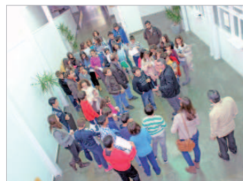
Recorrido por las dependencias municipales.