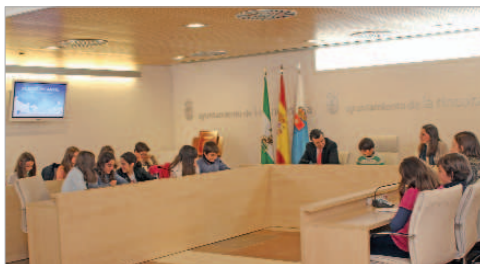
Los alumnos se convirtieron en políticos por un día.