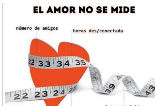
Campaña centrada en la igualdad de género.

Con esta finalidad se les ha presentado a los adolescentes la aplicación para smartphones 'DetectAmor', basada en los estudios del departamento Andalucía Detecta y que consta de 10 juegos con los que se aborda el amor, el sexismo o el machismo.