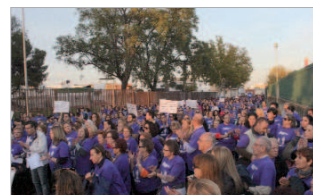
Un millar de personas acudieron a la marcha.