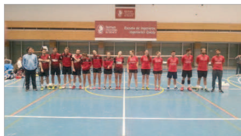
Formación del cuadro rinconero antes del duelo ante Ténnum.

El Soderinsa Rinconada ha agotado su margen de error si quiere repetir los logros del año pasado, en el que fue finalista del Campeonato de España. Los