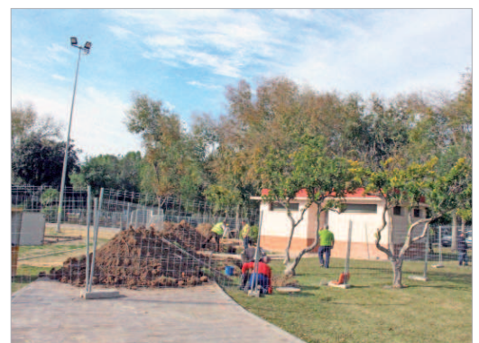
Actualmente, se está renovando la red de saneamiento de El Majuelo.

Así, en el parque El Majuelo, ya están en marcha las actuaciones para la mejora de la red de saneamiento así como de los aseos públicos, mientras que no ha comenzado aún, pero lo hará próximamente con cargo a este plan la puesta en servicio de un parque para perros. Por su parte, en el Dehesa Boyal, también se están ampliando ya los aseos públicos de forma paralela al kiosko-bar. En este recinto, lo que queda pendiente que dé comienzo es la ampliación y mejora del parque canino existente, con la dotación de nuevos elementos de