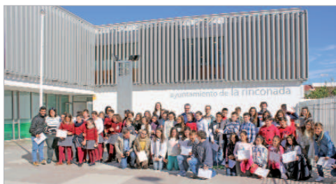
Foto de familia en el patio exterior del Ayuntamiento.