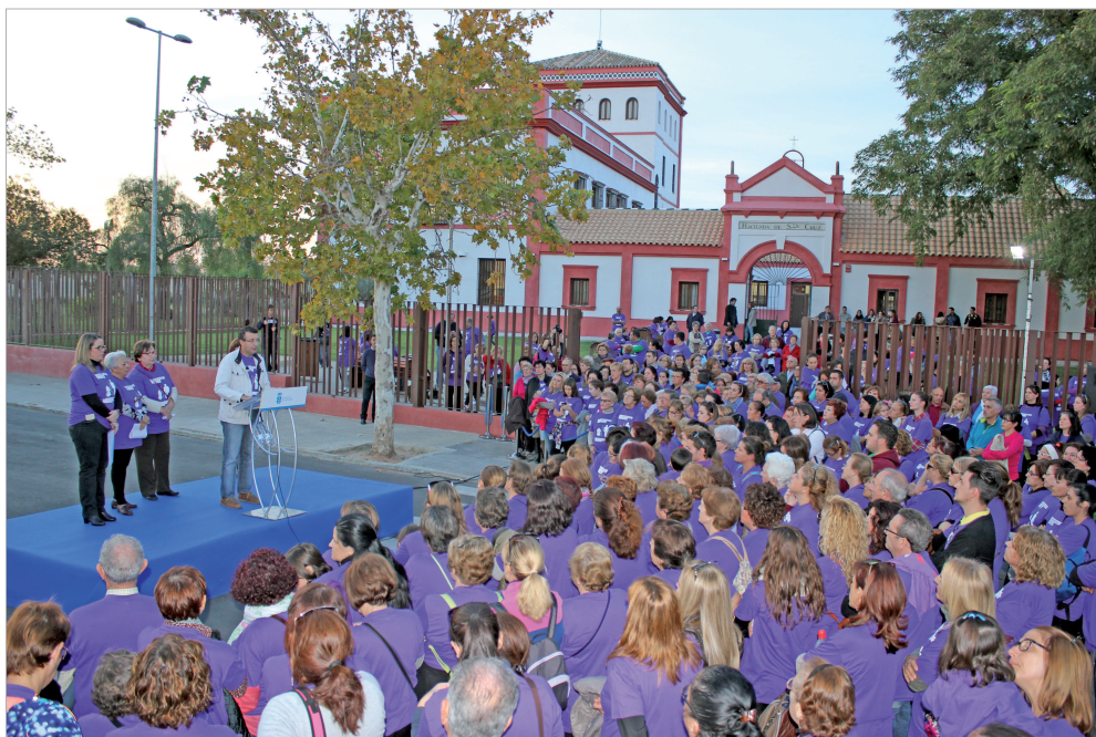
La Hacienda Santa Cruz acogió el final de la marcha en la que el primer edil destacó la solidaridad rinconera con todos los temas sensibles socialmente.

Con motivo del Día Internacional de la Eliminación de la Violencia contra la Mujer el Ayuntamiento de La Rinconada, a través del área de Igualdad, ha creado un amplio programa de actividades con las que concienciar e implicar a la población en la lucha contra esta lacra social que cuesta la vida a cerca de 3 millones de mujeres y niñas en el mundo