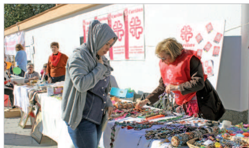
Los colectivos participantes expusieron sus artículos para su venta.