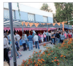
Barriada de La Paz.