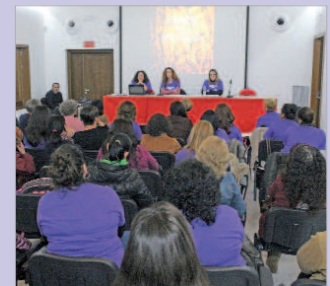
Clausura del taller 'Somos el mundo'.