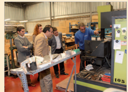
Muestra de las labores de los técnicos de Andalplast.