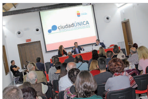
Taller transversal con colectivos y ciudadanía.

las mismas; favorecer la transición a una economía baja en carbono en todos los sectores; conservar y proteger el medio ambiente y promover la eficiencia de los recursos y promover la inclusión social y luchar contra