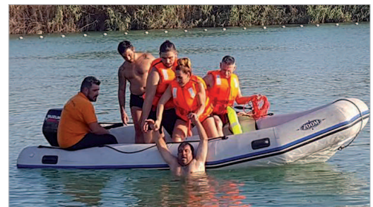
Los integrantes de Protección Civil durante la formación.