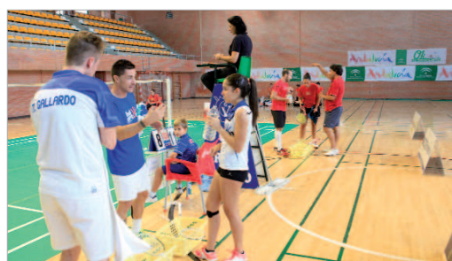
Los técnicos dan instrucciones a sus pupilos en el cambio de set.