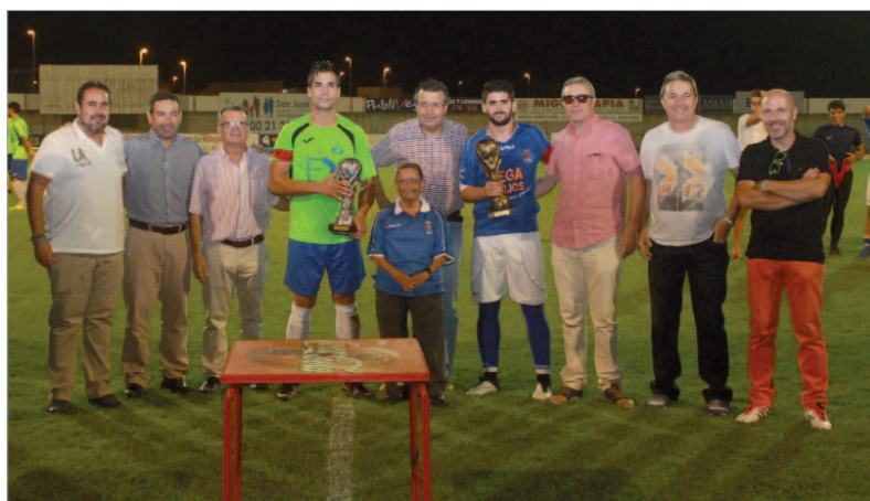
Foto de familia de los capitanes de ambas escuadras y los responsables directivos tras la entrega de los trofeos.

El San José impone la diferencia de categoría en la segunda parte, tras un primer tiempo igualado y se lleva el IX Trofeo Radio Rinconada