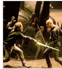
'Hamlet' en La Villa.

años de la muerte del dramaturgo inglés, la compañía ofrece el "ser o no ser" de este príncipe de