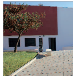
Casa de la Música.

Este año como principal novedad la Casa de la Música incorpora clases