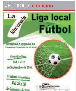
Cartel del evento.