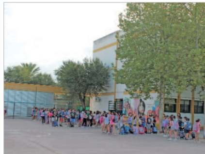
Los escolares esperan en fila la hora de entrada a clase.