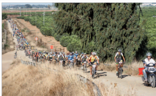
Una de las últimas ediciones de la Ruta Cicloturística de La Rinconada.

En un contexto en el que La Rinconada sigue ampliando el trazado de carriles bici, no sólo con una finalidad lúdica, sino como una apuesta decidida por la movilidad sostenible con la bicicleta como alternativa a los medios de transporte tradicionales, la V Ruta Cicloturística contará con ciclistas que, llegados desde todos los rincones de la provincia, Huelva, Cádiz, Córdoba, Granada y Badajoz, harán deporte, disfrutarán y