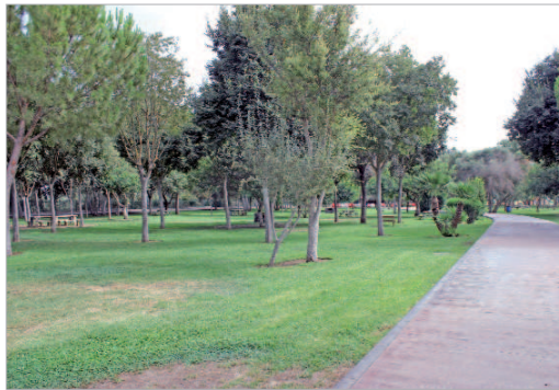
Espacio verde del parque El Majuelo.

mantener los puestos de trabajo de los once operarios que, en la actualidad, prestaban servicios en las tres empresas que desarrollaban esta