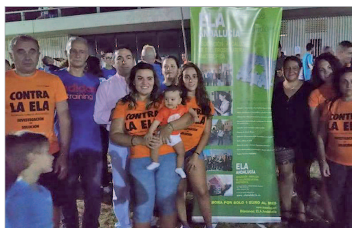
Imagen de algunos de los participantes en la III Quedada solidaria.

la atención sobre la Esclerosis Lateral Atrófica (ELA), una enfermedad para la que no existe curación. Para ello, reunió en el parque de Las Graveras a 350 corredores de 30 clubes de atletismo para junto a familiares de enfermos, lanzar una llamada de atención acerca de la misma.