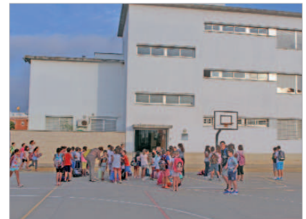
Los centros estaban preparados para acoger a los escolares.