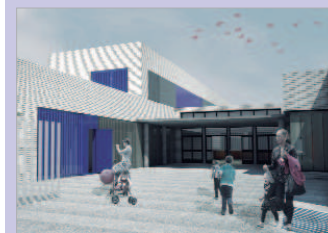
Infografía del nuevo colegio de Primaria.

Con un plazo de ejecución de diez meses, desde el área de Educación señalan que estará en servicio para el curso próximo, un colegio bilingüe que se suma a los nueve centros restantes del municipio. El presupuesto, que corre a cargo de la Junta de Andalucía, se sitúa en tono a los dos millones y medio de euros y la actuación se desarrolla sobre 2.895 metros cuadrados de superficie.