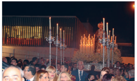
La Virgen de los Dolores estuvo arropada por los vecinos.