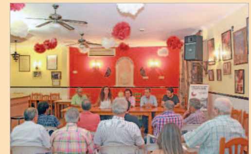
Presentación del cartel del festival en la sede de la peña.

Como señaló la edil de Cultura: "Este año se afianzan los cambios de lugar y fecha que el año pasado demostró ser una decisión acertada. Se consolida una nueva etapa enmarcada en un lugar con duende como es la Hacienda y que puede