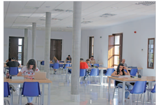
La sala de estudio de la Hacienda Santa Cruz es de las más demandadas.

de 1.826 estudiantes hicieron uso de las salas durante el incremento de su horario habitual. "Retomar los estudios en vacaciones para enfrentarse de nuevo a los exámenes requiere de un gran esfuerzo, por lo que desde el área, para apoyarles y facilitarles la tarea, hemos vuelto a poner a servicio de los estudiantes un