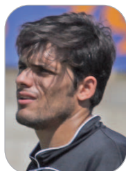
Linares Portero San José

El futbolista llegado del Lora se convirtió en el héroe de Chapín al salvar a su equipo con varias intervenciones de auténtico mérito. El arquero, que compite con Sebas por la meta azulina, está respondiendo a las expectativas.