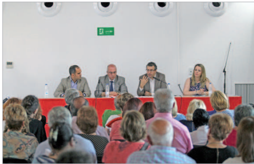
Clausura de la edición anterior del Aula de la Experiencia.

El plazo de inscripción para la nueva edición del Aula de la Experiencia que desde el Ayuntamiento de La Rinconada, a través del área de Mayores, junto a la Universidad de Sevilla han puesto en marcha está a punto de abrirse. Será desde el 20 de septiembre al 11 de octubre cuando toda persona interesada, mayor de 50 años que desee acceder a la formación y la cultura general, pueda solicitar su inscripción en el área de Igualdad, Ayuntamiento o Tenencia, en horario de 9 a 14:00 horas. Las listas de admitidos se hará pública el 14 de octubre y del 17 al 21 se formalizarán las matrículas.