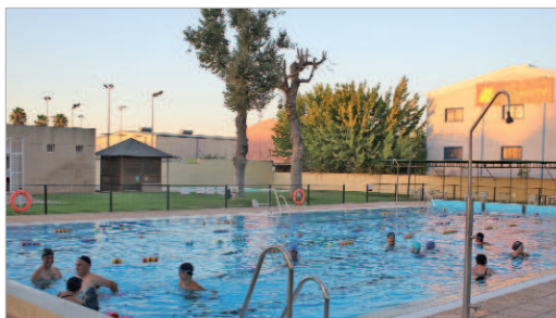
Los cursos de natación de verano.

Este año la política de precios se ha simplificado con respecto a años anteriores quedando las entradas a 2,5 euros entre semana y a 4 euros los fines de semana.