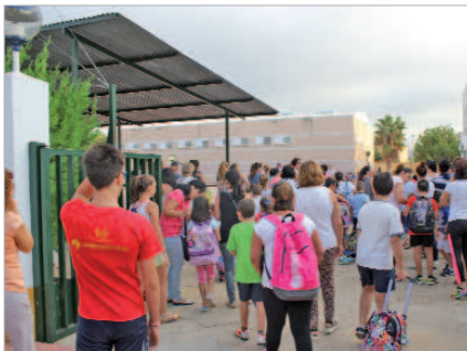
Los alumnos acompañados por sus padres en el primer día.

"Toda esta labor está encaminada a que cuando los estudiantes del municipio vuelvan a las aulas lo encuentren todo en perfecto estado, adecuado a una educación pública de primer nivel, de calidad y que permitan el normal desarrollo del curso", apunta Marín.