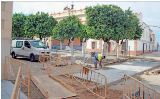
La Plaza de España está en pleno proceso de remodelación.