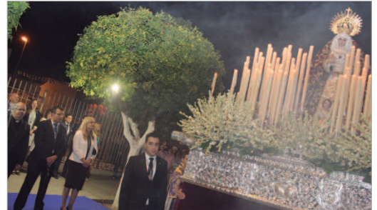
La corporación municipal recibe a la patrona.

cional besamanos en su Capilla, poniéndose punto y final a estas fiestas patronales.