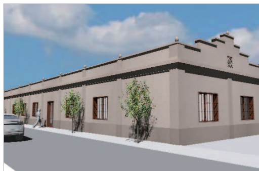
Recreación virtual del centro de atención a enfermos de Alzheimer.

Se trata de una parcela de unos 250 metros cuadrados sobre el que se levanta un antiguo edificio que se va a reformar y a adaptar como edificio público, lo que va a permitir triplicar las instalaciones existentes en la actualidad y que se pretende que en el futuro consiga la homologación de las plazas con la Junta de