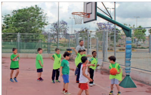
Se ofertan múltiples disciplinas para todas las edades.

malizar las renovaciones e inscripciones serán Piscina Cubierta Municipal, así como en el cajero automático ubicado en el recinto, y Polideportivo Municipal Anexo Piscina Cubierta en San José, y Pabellón Municipal 'Agustín Andrade' en el núcleo de La Rinconada.