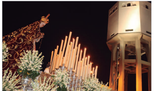
Recorriendo las calles de la localidad.