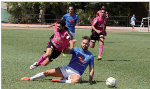
Ernesto ha vuelto al San José para reforzar la retaguardia cañamera.

Los cañameros sacan un valioso punto ante el favorito Xerez, pero caen en casa ante el Ciudad de Lucena en un partido marcado por el arbitraje