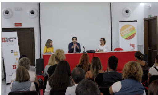
El delegado de Comercio se reúne con los comercios adheridos.

Durante todo un mes, un amplio abanico de acciones se desarrollará tanto en la Hacienda Santa Cruz como a pie de calle y en los establecimientos adheridos. Sesiones de fotos profesionales en photocalls, streetstyles, descuentos especiales, sorteos, masterclass y diversas actividades que los propios comerciantes proponen en sus locales. Además,