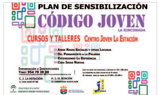
Cartel del programa 'Código Joven'.

Le seguirá el curso 'Amor, redes sociales y otras locuras' con el que se pretende que la juventud adquiera conocimiento sobre las redes sociales y su correcto uso, identifique las nuevas formas de riesgo en la red y pre-