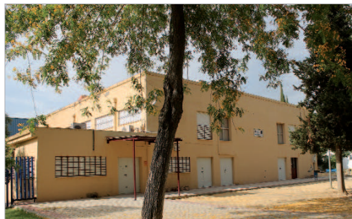
El Hogar del Pensionista de La Rinconada será remodelado.