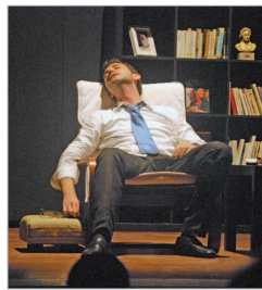
Obra 'La espera'.

déjà vu en el que vivir los grandes momentos de la movida de los 80, su música, ambientes,