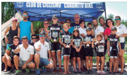
Los jóvenes campeones de Cañamito Bike posan con sus títulos.

Los jóvenes ciclistas del Cañamito Bike se encuentran inmersos en la competición por tie-