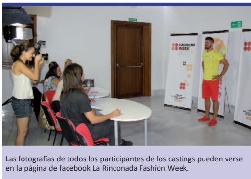
Las fotografías de todos los participantes de los castings pueden verse en la página de facebook La Rinconada Fashion Week.

actos sino dar voz a todos los comercios participantes, mostrando sus establecimientos y dando a conocer los productos y servicios que ofertan. La fuerte difusión en redes sociales, que puede lograr más de 200.000 impactos, logrará una campaña de publicidad con grandes resultados en la localidad y también en el exterior.