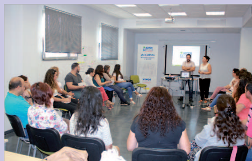
La tercera edición ya ha comenzado.