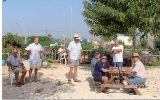
Un grupo de mayores posan en sus huertos ecológicos.

Arando la tierra para una nueva siembra, así se encuentran los miembros de la Asociación de Huertos Familiares San José, formada por los adjudicatarios de las parcelas destinadas al cultivo ecológico que el Ayuntamiento de La Rinconada puso a disposición de sus vecinos mayores de 60 años.