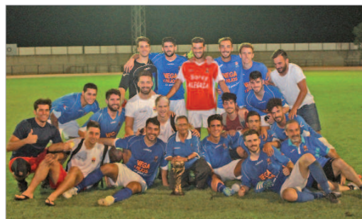
Los jugadores del San José posan con el título conquistado.