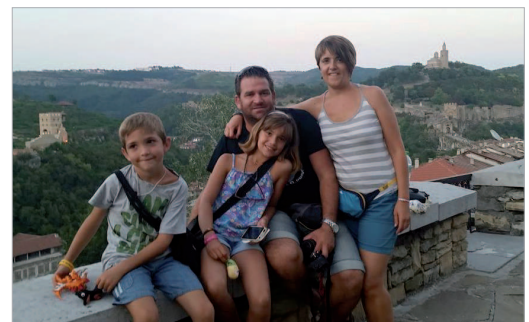
La familia viajera posa al completo en una de sus paradas.

Hasta el momento, han visitado Francia, Italia, Eslovenia, Croacia, Albania, Grecia, Macedonia, Montenegro, Bulgaria, Rumanía y Hungría, donde se encuentran en la actualidad conociendo algunos rincones menos turísticos antes de llegar a