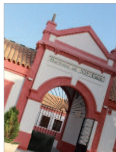
Hacienda Santa Cruz.

Además, los asistentes podrán conocer los resultados de investigaciones desarrolladas por la Universidad en materia de agricultura de precisión y se presentarán, en exclusiva, algunas de las últimas soluciones comerciales en