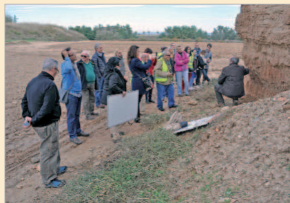
Visita al yacimiento del Cerro Macareno.