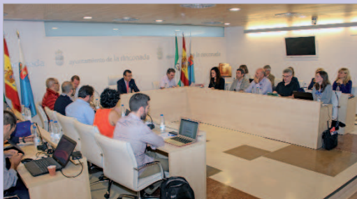
Los impuestos se congelan un año más en La Rinconada.

La Rinconada mantiene las bonificaciones fiscales, que se recogen en las ordenanzas: las de carácter social, la de los pensionistas, para mayores, para personas desempleadas, para estudiantes, de protección del medio ambiente, para promover el transporte no contaminante, para fomentar la generación de empleo y para la construcción de vivienda pública.