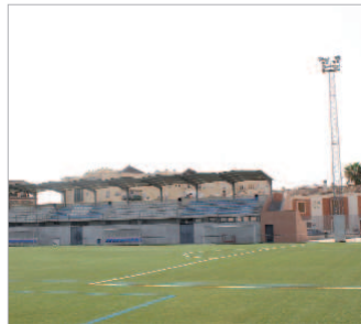
Las torres de iluminación serán más seguras.