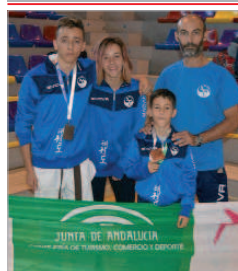
La delegación local en Antequera.