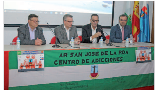
Imagen de la mesa inaugural del VII Congreso FESAR.