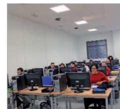
Uno de los cursos de ACD.