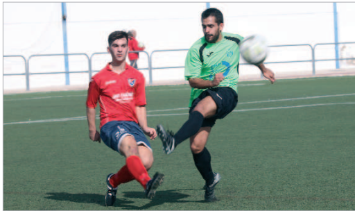
Los rinconeros hicieron los deberes y sacaron el triunfo en La Campana (1-3).