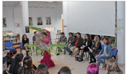
Momento de una actuación en la apertura del curso.