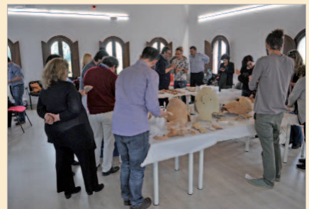
Mesa de trabajo de hallazgos arqueológicos.