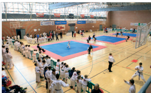
En torno a 350 deportistas tomaron parte en el XXIV Villa de La Rinconada.