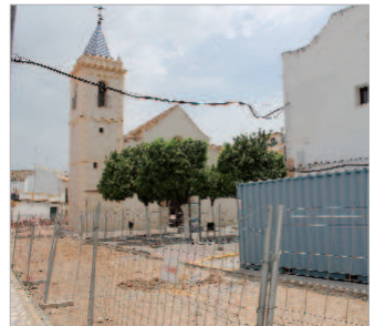
En pleno proceso la mejora de Plaza España.