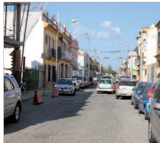
La calle Del Mocho será reasfaltada.