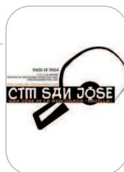
CTM San José Tenis de Mesa

Avisaba el técnico blanquiazul del potencial del Alcalá del Río en el derbi comarcal, y no se equivocó. El cuadro rinconero perdió el partido, el liderato y salió de la zona de ascenso a Primera Andaluza, en un partido que no fue brillante.