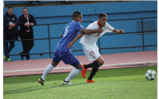
Imagen del partido entre el Sevilla y la Juventus en el Felipe del Valle.