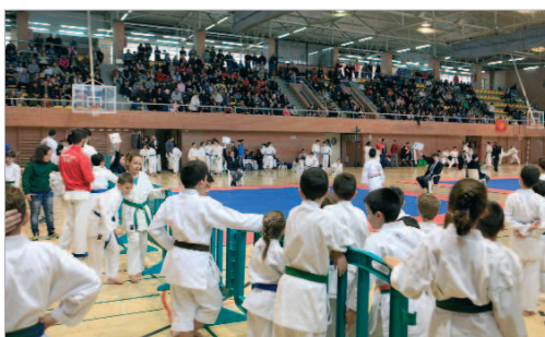
Las gradas del Fernando Martín registraron un lleno absoluto.