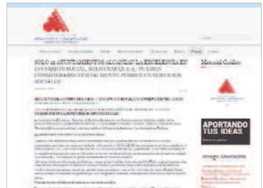
La Rinconada logra la excelencia en inversión en gasto social.

lleva trabajando desde que llegó". En este sentido, el primer edil se refirió a que "queremos ser un gran pueblo para vivir e invertir y, para ello, queremos que la gente se sienta orgullosa del municipio y que, quienes se encuentran en una situación más delicada, sepan que su