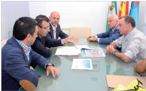
La Rinconada no subirá el recibo del agua para 2017.

Y es que a mayores de todo esto, el Ayuntamiento de La Rinconada lleva desde el año 2002, a través de su área de Bienestar Social, destinando partidas presupuestarias para ayudar a los vecinos y vecinas que lo necesitan a pagar los suministros básicos, como el agua o la electricidad. "Para 2017 volveremos a tener partidas presupuestarias para Bono Energético Social, para garantizar que nadie en La Rinconada pueda quedarse sin suministros (agua y