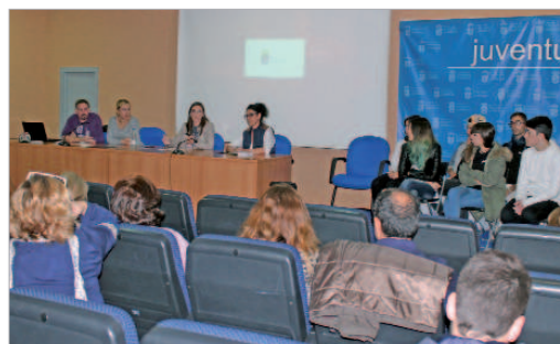
Los participantes acudieron al estreno en el Centro Joven La Estación.

Los participantes, de 13 a 20 años, han realizado talleres de cámara, de dirección, iluminación, montaje, sonido, interpretación, producción y maquillaje, conociendo así las distintas facetas y departamentos que componen un equipo de rodaje de la mano de grandes profesionales.