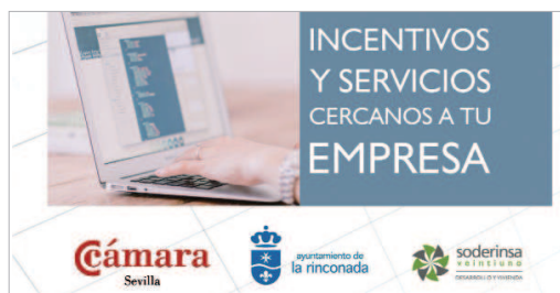
Cartel de la jornada sobre incentivos a empresas.