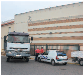
Se actuará en la fachada del Antonio Gala.