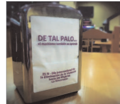
Campaña de servilletas en bares.

taller 'Las paredes hablan' en el que 20 adolescentes de la localidad trabajan la igualdad. Junto con la concejalía de Cultura se representó 'Compás de espera' de Choni Compañía Flamenca y '¿Por qué John Lennon lleva falda?' de La Palabra Teatro, un espectáculo concertado con los insti-