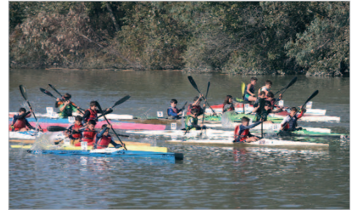
Imagen de una de las pruebas que tuvieron lugar en El Majuelo.

La Rinconada sigue apostando por el deporte y, en este ocasión, pudieron comprobarlo todos los amantes del piragüismo que tomaron parte en el IV Trofeo La Rinconada que organiza el club local 'El Majuelo' en el parque del mismo nombre. Como es habitual, el trofeo consistió en distintas pruebas de todas las edades, desde los más jóvenes (alevines) a la categoría de veteranos.