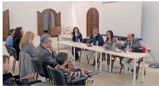
La Hacienda Santa Cruz acogió la presentación del evento.

Grupo Lautrec con el que produjo y dirigió los video-films '¿Dónde quieres que te lleve esta mañana?' (1988), 'Mi madre espera con frío que amanezca' (1990), 'Los reinos posibles' (1995), 'La canción mía' (1996) y 'Recuerdo haber hecho el amor en primavera' (1997), realizaciones que han participado de muestras nacionales e internacionales. En cuanto a su obra literaria, en 1999 publica 'El último consuelo' un libro de cuentos cortos y poemas, e 2005 'Cuadernos de la intimidad', recopilación de relatos cortos y poesías, en 2010 la novela 'La mansión' y le seguiría la trilogía 'La hija del jardín', 'La hija del fantasma' e 'Hija del mundo'. Por 'La hija del jardín' sería finalista del Premio Fernando Lara de Novela.