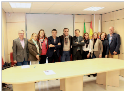
Foto de familia de los presentes en la firma del acuerdo.

"Este ascenso facilitará el día a día de personas con movilidad reducida", dice el primer edil rinconero