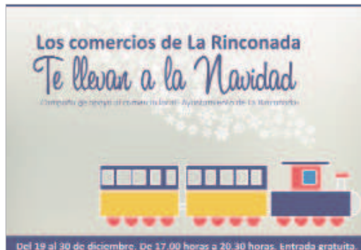
La campaña del área de Comercio para la Navidad está lista.

sociales y en la calle a través de folletos, carteles, bolsas, valla publicitaria, cuñas de radio y