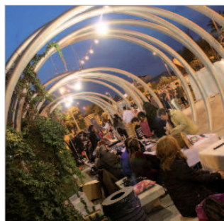
El Bulevar lució sus mejores galas.