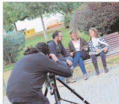
Imagen de grabación del vídeo.