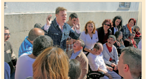
Jorge Cadaval durante su encuentro con los usuarios del centro.