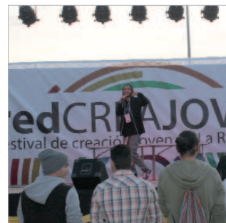
Imagen de uno de los conciertos.