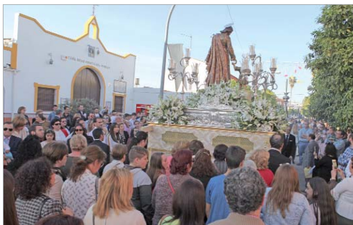
Numerosos vecinos y vecinas acompañaron al Patrón en su recorrido.

tejo en el que había numerosos niños y niñas, así como las autoridades municipales y los Hermanos Mayores de cada una de las Hermandades del Municipio. La Banda Municipal Cristo del Perdón acompañó el recorrido procesional de un Patrón que lució un exorno floral compuesto por aléjies y lirios blancos.