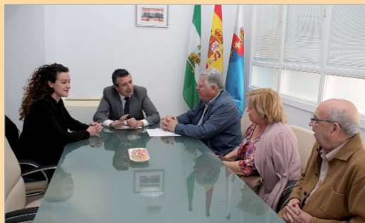
Firma del convenio entre el Ayuntamiento y la Coral.

agrupación recibirá ayuda para desarrollar sus actividades y para las actuaciones acordadas en el Día de Andalucía, a la finalización del curso del Aula de la Experiencia y a la celebración de los actos conmemorativos de la Patrona de La Rinconada.