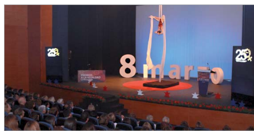
La Gala contó con un espectáculo circense como metáfora del ‘Circo de la vida’.

dad y denunció que “pese a que se han dado pasos, éstos han sido insuficientes y la crisis y determinadas políticas no han hecho sino ralentizar los avances. Hemos dado pasos atrás en igualdad salarial, acceso a puestos de responsabilidad, conciliación, libertades o reparto de tareas, por todo ello debemos ser inconformistas”. Además el edil rinconero señaló que “debemos hacer autocrítica, no sólo debemos mirar a los demás, a los gobiernos, a las instituciones, a la sociedad, a los responsables educativos, debemos paramos a pensar en qué hacemos nosotros y nosotras para poner nuestro granito de arena para una sociedad igualitaria. Repasemos las acciones de nuestros hijos e hijas y preguntémonos si estamos educando en igualdad, si les estamos atribuyendo a nuestros hijos el rol patriarcal. Como eduquemos a nuestros hijos y a nuestras hijas será como ellos y ellas educuen a sus descendientes. Cuando seamos conscientes de todo ello estaremos construyendo un futuro en igualdad”. Y es que tal, en palabras de la presentadora de la Gala: “Seguiremos siendo equilibristas del día a día, malabaristas hasta el ocaso, domadoras de bestias salvajes... seguiremos luchando. Sólo queremos poder volar a la misma altura, iguales”.