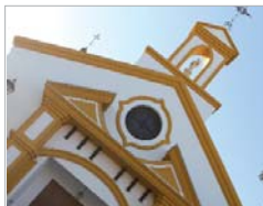
Fachada de la iglesia San José.

El área de Vía Pública, con medios propios y, por tanto, sin repercusión económica para las áreas municipales, ha estado trabajando en el adecuamiento de la fachada de la iglesia San José con motivo de la salida procesional del Patrón del municipio, que tuvo lugar el pasado 19 de marzo y