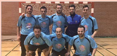
Sólo el Trillo la Tronera le ha rascado un punto al líder.

El Venta Los Mellizos sigue intratable en la Liga Local, sólo ha empatado un partido y cuenta por