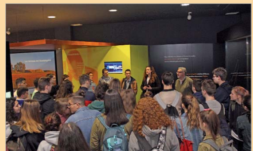
Estudiantes alemanes estuvieron de intercambio en La Rinconada.

Vega les dio la bienvenida al municipio y resaltó la situación geoestratégica y económica del mismo, así como, la importante acción cultural de La Rinconada, referente a nivel provincial y que es pionero en programas propios destinados a todos los sectores de la población. Tras el recibimiento, los estudiantes hicieron un recorrido por el teatro y visitaron el Museo de Arqueología y Paleontología "Francisco Sousa". Además, durante su estancia también visitaron Sevilla capital, Cádiz y Córdoba.