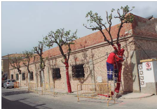
El actual centro triplica las instalaciones del que ahora está en uso.

En la actualidad, se están desarrollando las diferentes instalaciones y los revestimientos en las paredes interiores