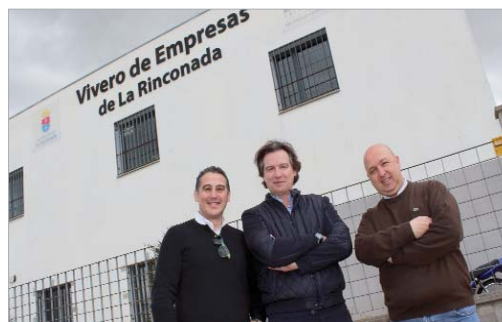
El equipo de iAlergenos.com en su sede ubicada en el vivero de empresas.

Este proyecto cosecha premios como el II Concurso de Proyectos e Ideas Empresariales de La Rinconada y ser finalista en los premios RED INNprende de la Fundación Cruzcampo 2017