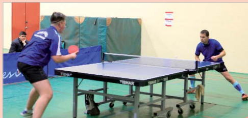
El CTM San José está a un triunfo del primero que se salvaría.

El CTM San José logró una importante victoria ante el CTM Sevilla que le ha colocado a un sólo