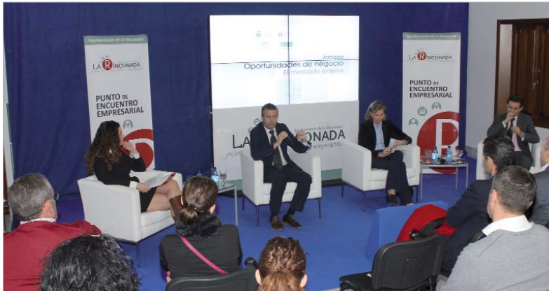
La primera jornada ha tratado sobre oportunidades de negocio en el mercado exterior.

La primera jornada de este programa ha tratado sobre 'Oportunidades de negocio: el mercado exterior' y ha contado con las