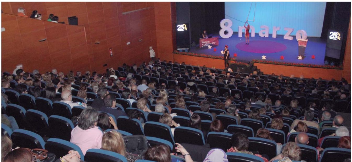
La Villa fue el escenario de la celebración de la Gala que reivindica el 8 de Marzo, Día Internacional de las Mujeres.

Con motivo del 8 de marzo, Día Internacional de las Mujeres, La Rinconada ha celebrado la decimoséptima edición de los Premios a la Igualdad, que reconocen la labor de personas, instituciones y colectivos que luchan por ella