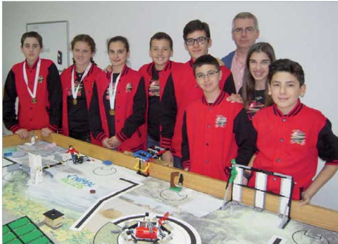
El equipo posa con su tablero de juego en el local de ensayo.