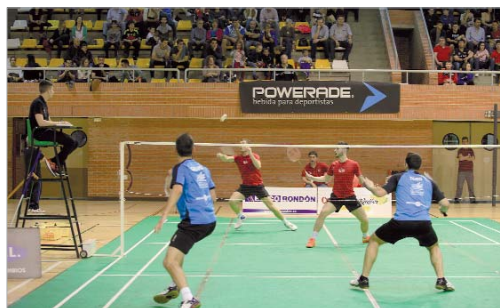
El Bádminton Rinconada derrotó a Benalmádena y ya está en la final.