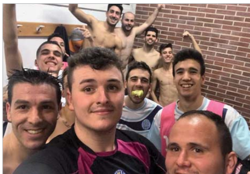
Los jugadores del San José FS celebran la victoria conseguida en Cádiz.

El Tres Calles se aleja de las esperanzas de meterse entre los dos primeros tras perder en