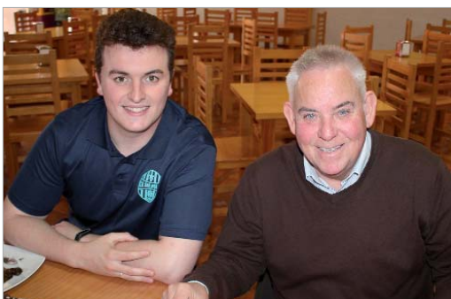
El San José FS estuvo en La Torre hablando de sus opciones de ascenso.

El abanico de opciones deportivas que ofrece el Patronato, el cercano ascenso del San José FS y el nuevo entrenador del Rinconada, en el 104.7