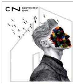
Imagen del Caravan Next.

'Marat/Sade' será la función encargada de poner el cierre al