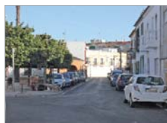
Una de las vías asfaltadas.

Las obras para la renovación del asfaltado en diferentes vías del municipio han llegado a su fin tras más de veinte actuaciones. Recientemente, se finalizaron las obras en el núcleo de La Rinconada, donde se ha actuado en las calles Pinsapo, Virgen de las Nieves, Higuera, Ciruelo, Morera y Avenida