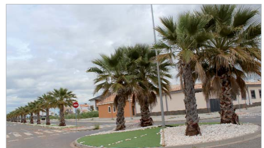
San José Norte, una de las principales zonas de expansión del municipio.