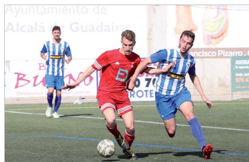
Mario se lleva el balón ante el acoso de un defensor del Estrella San Agustín.

Por otro lado, el San José sigue trabajando en la incorporación de