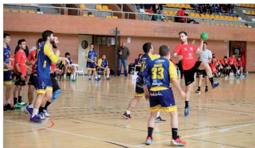
Un lance del último partido de la Liga Regular en casa.