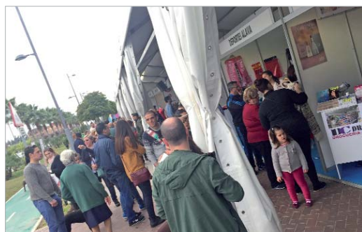
Numerosos comercios montaron su stand en el Bulevar del Almonazar.

Para ediciones próximas, el objetivo pasa por aumentar el número de participantes y convertir a la feria en referencia provincial.