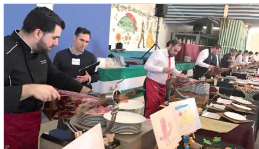
La Caseta Municipal registró una gran entrada y hubo muy buen ambiente.

El Alcalde de La Rinconada, Javier Fernández, y la delegada de Participación Ciudadana y Fiestas