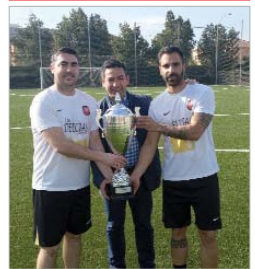
Una de las entregas de trofeos.