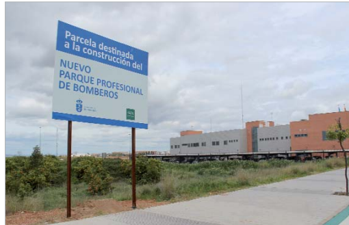
La valla indica el lugar donde se ubica el futuro parque de bomberos.