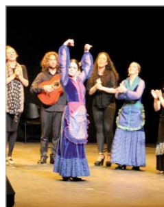
La Villa acogerá el espectáculo.