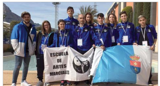
Los participantes del Ditae, antes de comenzar la competición en Alicante.

El Club Ditae de La Rinconada acudió con seis participantes que, aunque no consiguieron medalla, sí cuajaron una gran participación y dejaron muy alto el nombre de La Rinconada y de su club.