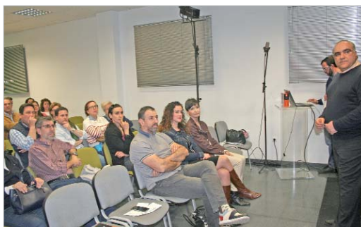
La presentación del CRJ4 tuvo lugar en el Centro de Estudios Empresariales.

En el Centro de Estudios Empresariales de la localidad estos emprendedores mostraron a la ciudadanía su nuevo producto "inventado y patentado por nosotros, sin competidor en el mercado" expusieron. El CRJ4 es un sistema de seguridad, un cerrojo bloqueador que evita "al 100 por cien" los robos en viviendas. "Es la solución definitiva a sistemas de robo como el 'bumping', 'resbalón' o 'ganzúa', que por desgracia están tan de moda a día de hoy causando verdaderos estragos a muchas personas". Este dispositivo, totalmente invisible a los ladrones desde el exterior de la vivienda, funciona