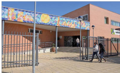
El centro de Formación Juan Pérez Mercader.

Dentro del Departamento de Orientación Sociolaboral del Ayuntamiento de La Rinconada (DOSLA), se están desarrollando distintas acciones de formación y mejora de la empleabilidad. Los integrantes del Programa Emple@joven y Emplea30+ de la Junta de Andalucía, financiado por el Fondo Social Europeo y gestionado por el Ayuntamiento de La Rinconada, vienen realizando semanalmente dos sesiones grupales con personas inscritas en el DOSLA con el motivo de mejorar la empleabilidad de los mismos, centradas en elaboración de CV, autoconocimiento y marca personal, realización de entrevistas, dinámicas de grupo y killers questions , portales de empleo, redes sociales de empleo y networking, conocimiento y funcionamiento de la página web del SAE.