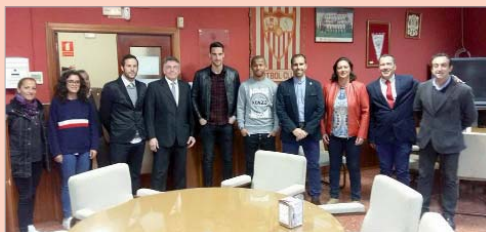
Sergio Rico y Mariano, con la directiva de la Peña Sevillista.

Los jugadores del Sevilla, Sergio Rico y Mariano, han visitado la Peña Sevillista San José de La