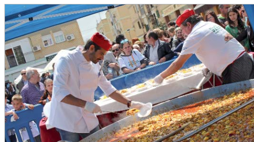
La patata nueva es una de las señas de identidad del municipio.

La Rinconada tiene en su haber ser uno de los mayores productores del país de patata nueva. El clima