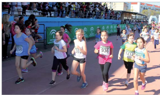
La cantera demostró que el futuro del deporte está asegurado.

tería, dentro del objetivo transversal de todas las áreas municipales de contribuir en este aspecto en la medida de su campo de actuación y sus posibilidades.