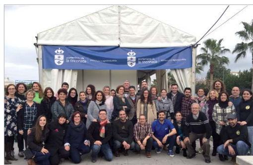
La valoración de los comerciantes ha sido muy positiva.