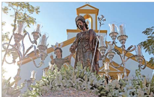
San José procesionó por las calles del municipio.

Los días previos tuvo lugar el tradicional Triduo y la función principal en la mañana del domingo