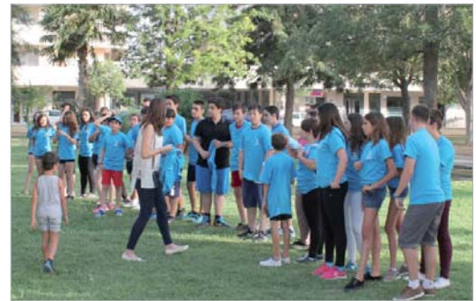
Juventud sigue ofreciendo actividades atractivas.

Será el próximo viernes 31 de marzo a las 19 horas cuando los jóvenes se batan en duelo y demuestren su habilidad e ingenio para ir resolviendo pruebas y acabar en lo más alto de la clasificación.