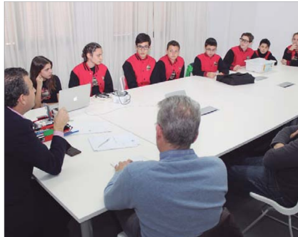
El alcalde recibe al equipo para deseearle suerte en el campeonato.