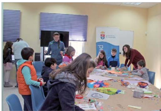
Numerosos jóvenes realizan actividades en 'Animatega en Blanco'.

Más información en el Centro Joven 'La Estación', calle San José 38, en el teléfono 95 479 39 00 o enviando un e-mail a juventud@aytolarinconada.es.