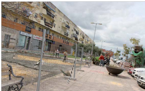
El parque 'El Palmar' en pleno proceso de renovación.