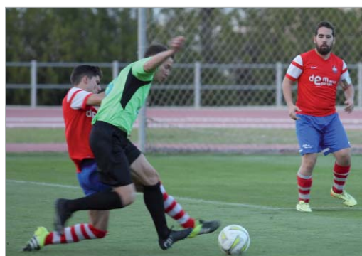
Emi se reencontró con el gol en Herrera, pero éste no dio el triunfo.

El Rinconada ve como se le escapa el ascenso. Aún hay tiempo pero los rinconeros siguen desangrándose respecto a los de arriba. El último traspasó tuvo lugar en casa, como casi siempre esta cam-