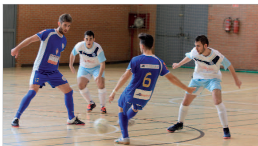
El San José FS, ya ascendido como campeón, ganó a Utrera (4-6).

El Club Deportivo Tres Calles de Fútbol Sala ha finalizado la temporada en Segunda Andaluza en un meritorio cuarto puesto. Lo cierto es que la temporada de los pupilos de Josemi Fresco ha sido bastante