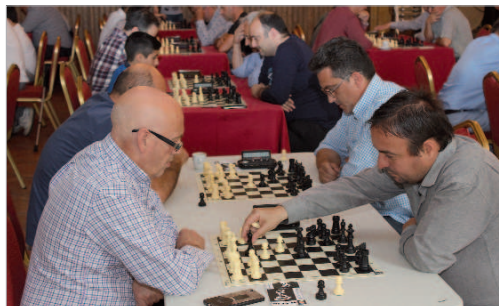
Los Salones del Rey Fernando fueron el escenario del torneo.