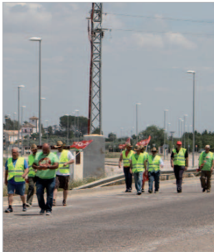
La marcha agrícola llega a La Rinconada.