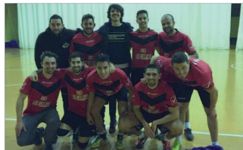
La plantilla del 'Venta Los Mellizos', antes de un partido.

La Local está decidida con cuatro partidos aún por disputar. Y es que 'Venta Los Mellizos' ha puesto la directa y saca once puntos al 'Bruhash FS', que sigue siendo segundo, con sólo doce por disputar. Aunque la igualdad era máxima entre estos dos equipos, la victoria de los primeros en el duelo fratricida entre ambos hizo que la brecha se abriera a favor del líder, a la vez que supuso un mazazo definitivo para el otro contendiente.