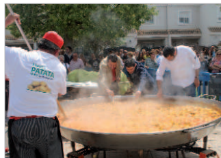
El público degustó patatas con pollo.