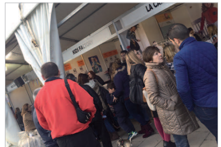
El comercio es un referente en la creación de puestos de trabajo.