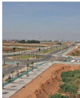
La Rinconada es ideal para invertir.

Este eje movilizará recursos propios y de la UE para esta finalidad que persigue también un aumento de la empleabilidad.