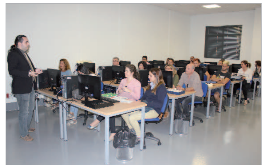
Las sesiones se realizan en el Centro 'Juan P rez Mercader'.

Las inscripciones se realizar n, hasta completar aforo, en la web http://www.soderin.com/cys1.php