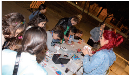
El Club Diversia se celebra en el CEIP Pepe González.

programado multitud de actividades, que van realizando en función de la temática de la semana. Tienen talleres de manualidades o creación, en los que podrán construir lapiceros, marcos de fotos, caretas, accesorios de joyería, broches y carteras, entre otras cosas, un taller de cocina, videojuegos y juegos de mesas, zona de baile, espacio deportivo y cultural, donde se harán exhibiciones de karate, flamenco o títeres, se proyectarán películas y se divertirán con un montón de juegos al aire libre. Las instalaciones en las que se concentra el Club Diversia es el CEIP Maestro Pepe González. Los viernes, en horario de 21.00 a 00.00