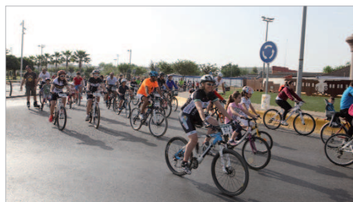
El pelotón de ciclistas al poco de tomar la salida.

Tras los sorteos, muchos optaron por quedarse en el parque, otros volvieron a sus domicilios en San José y los participantes del núcleo de La Rinconada regresaron a casa escoltados por un dispositivo en el que se volvió a poner de manifiesto la importancia de la Policía Local y Protección Civil, del mismo modo que la coordinación de los diferentes clubes ciclistas de la localidad, para el seguro y correcto desarrollo de la prueba.