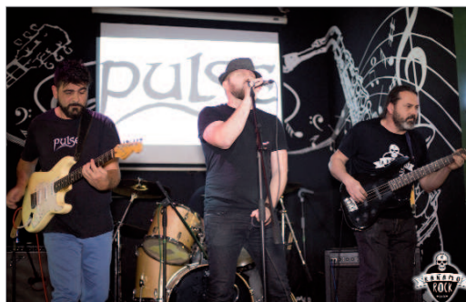
'Pulse', uno de los grupos que participó en Káñamo Rock.

Durante el evento, además, se realizaron actividades paralelas como sorteos y rifas, a la vez que se