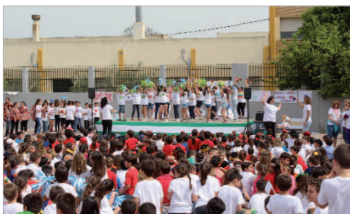
El parque Dehesa Boyal acogió la Semana Cultural del PUA.

Si la ciudad de Sevilla se transformó para la Expo 92, el colegio Nuestra Señora del Patrocinio no se ha quedado atrás en su II Semana Cultural. Los pasillos, puertas y paredes del centro se han convertido en auténticos pabellones, donde todos los países han quedado representados, y donde con la vuelta de Curro han conseguido sumergir a los visitantes en el espíritu de la Expo. No sólo los alumnos sino todo el equipo docente, el AMPA y los familiares de los pequeños, se han visto involucrados en un viaje