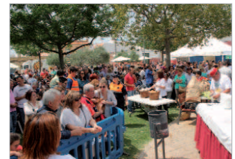
Numerosos vecinos fueron al parque Gines.