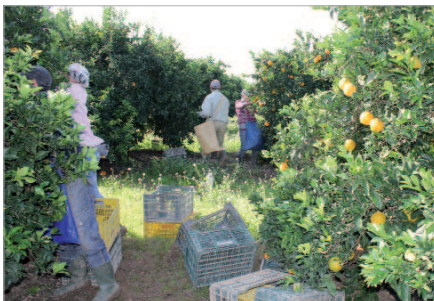
La Rinconada no olvida su larga tradición agrícola.

transporte. Por último, en relación al sector servicios, el apoyo al comercio es continuo y un pilar de acción. Actuaciones como 'Que todo quede en casa', actualmente en vigor, así como numerosas ferias y medidas encaminadas a potenciar y fidelizar el consumo en el municipio y a dinamizar este sector como yacimiento importante de autoempleo. Todo ello, además, coordinado desde la Mesa del Comercio Local, en la que los propios empresarios del sector están representados y construyen conjuntamente la estrategia de actuación dentro de las necesidades que ellos mismo observan, en busca de multiplicar las potencialidades y plantar cara a la crisis minimizando los inconvenientes existentes.