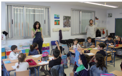
El CEIP La Unión acogió esta iniciativa para fomentar la coeducación.

La finalidad de este programa es trabajar la expresión emocional y la autoestima, incidir en la resolución de conflictos y la prevención de la violencia de género.