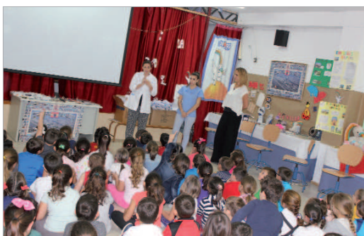
Una de las actuaciones que realizó la empresa Vitaldent.

Más de 1.000 niños y niñas han aprendido buenos hábitos de higiene y de alimentación de manos de los profesionales de Vitaldent y Dental Company