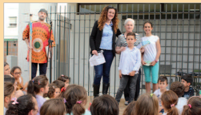
Reconocimiento a los mejores lectores en San José.