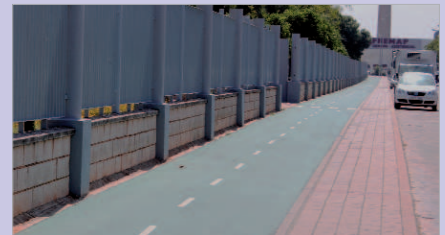
Remodelación de carriles bici.