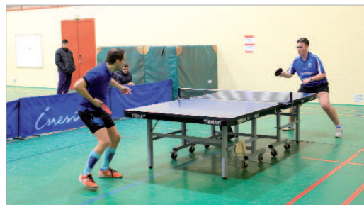
El CTM San José está a la espera de la repesca para seguir en Segunda.

ra una plaza disponible la próxima temporada para ser repescados al grupo X de la Segunda Nacional o, en caso contrario, competir en categoría Autónoma el próximo ejercicio. El mal arranque y las bajas durante buena parte de la tempo-