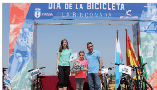
Se realizaron diversos sorteos entre los participantes.