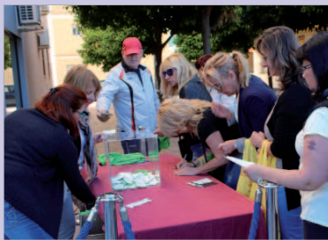
Comprar en La Rinconada tiene premio.

La siguiente zona comercial donde se va a llevar a cabo la campaña #QueTodoQuedeEnCasa, será el entorno de la calle Málaga y la barriada de La Paz los días 17 y 18 de mayo. El día 17 se instalará en Correos y el día 18 en el tramo de la calle Andalucía perpendicular a calle Málaga.