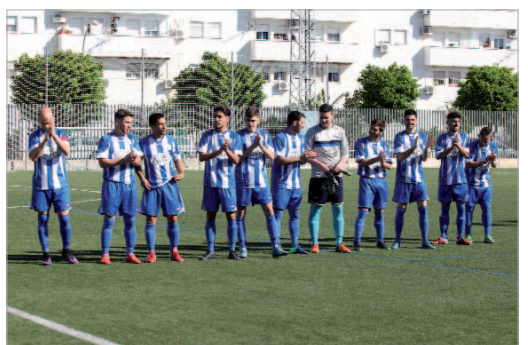
El parón motivado por la Feria de Abril ha frenado la racha rinconera.

La próxima jornada es propicia para recortar, ya que los rinconeros reciben a un diezmado Ibarburu, mientras que hay un duelo fratricida entre Villaverde y Alcalá, y el Cazalla tiene la difícil visita al Miguel Román de Dos Hermanas donde, independientemente del momento en el que se encuentren los nazarenos, siempre es difícil