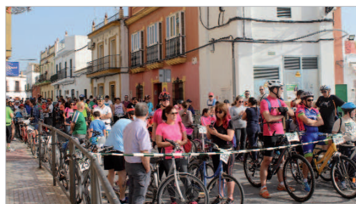
Los participantes del núcleo de La Rinconada, a la espera de partir.