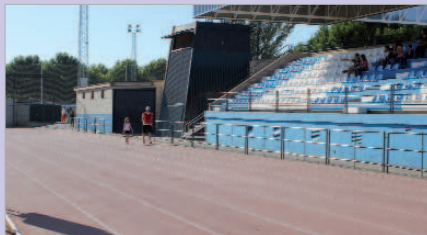
Pista de atletismo Felipe del Valle.

Por último, dos calles de las más antiguas del municipio, como son San Isidro Labrador y Cristo del Perdón, también van a ser remodeladas. Recientemente, el entorno de estas vías fue objeto de actuación para modernizar la zona y ahora se procede también a reformar dichas vías. En concreto, este espacio mantendrá su calificación de viario público, si bien se mejorará su aspecto y se facilitará su posterior mantenimiento, suponiendo además una mejora de las condiciones de accesibilidad peatonal y de tráfico rodados. La vegetación actualmente existente se respetará, tratando de ajustar la colocación de los nuevos elementos a las especies ya presentes y a los elementos de infraestructuras igualmente preexistentes en el entorno. El plazo de ejecución es de tres meses y el presupuesto cercano a los 230.000 euros.