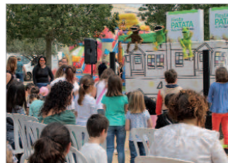
Hubo numerosas actuaciones infantiles.