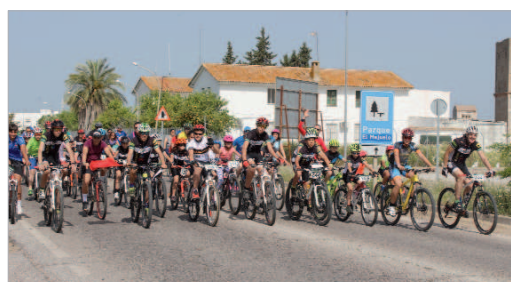
Último tramo del recorrido antes de alcanzar Las Graveras.