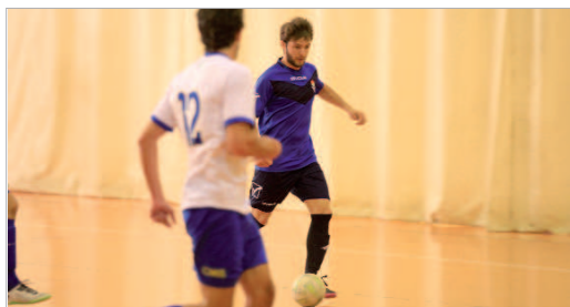
El Tres Calles finaliza la temporada en cuarta posición.