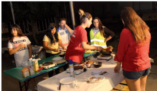
Imagen de Diversia, que tiene lugar en el IES Carmen Laffón.

La noche de los viernes está marcada en los calendarios de los jóvenes con multitud de talleres y actividades ideadas para el disfrute del ocio y el tiempo libre de forma saludable.