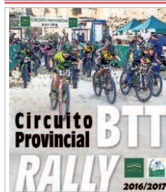
Imagen de una de las pruebas.