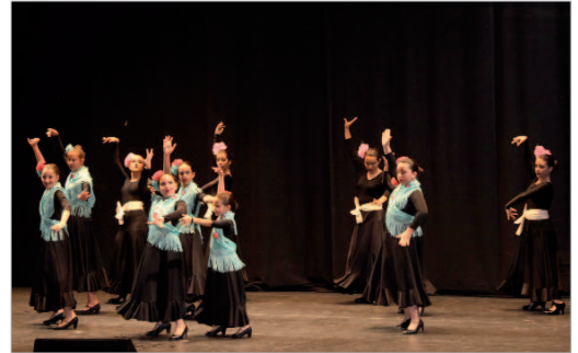
Factoría Creativa cumplió 25 años en las tablas del Centro Cultural de La Villa.