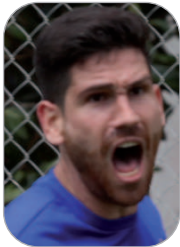
Saborido Jugador San José

El delantero cañamero, que se estrenaba en el Arturo Puntas Vela de Rota, debutó con dos tantos que, además, sirvieron al San José para remontar y llevarse los tres puntos en el partido frente a la Roteña. Llega para quedarse y aportar gol.