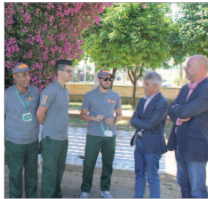
El nuevo servicio de guardeses actúa principalmente por los parques públicos del municipio.

Empleo de la Junta de Andalucía Emple@Joven y 30+, que velarán principalmente porque se cumpla la normativa vigente en cuanto a la tenencia de mascotas y recogida de excrementos en la vía pública, así como prevenir el vandalismo, informando a la ciudadanía y, en el caso que fuera necesario, a las fuerzas de seguridad del municipio. Otra de sus funciones, también informativa, aunque en este caso vinculada al área de Servicios Generales, será la de comunicar posibles desperfectos o deterioros del mobiliario urbano, con el fin de que puedan subsanarse.