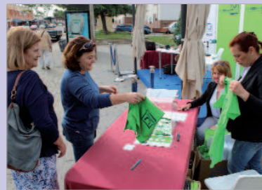
Numerosos vecinos pasaron por el stand.