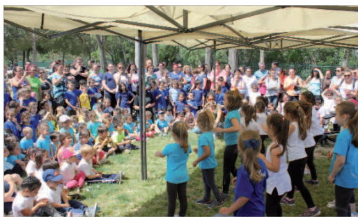
Una de las actividades que tuvieron lugar en el parque El Majuelo.

se convirtió en una fiesta para los niños y niñas de Los Azahares. Disfrutaron de juegos cooperativos planeados por el área de educación física, el AMPA propuso un concurso gastronómico y pudieron realizar un taller de percusión a cargo de la Compañía Majareta. Además asistieron a un espectáculo de magia, y se llenaron de ritmo con coreografías de zumba y bailes latinos. Un sinfín de actividades con las que consiguieron el objetivo de disfrutar juntos y unidos.