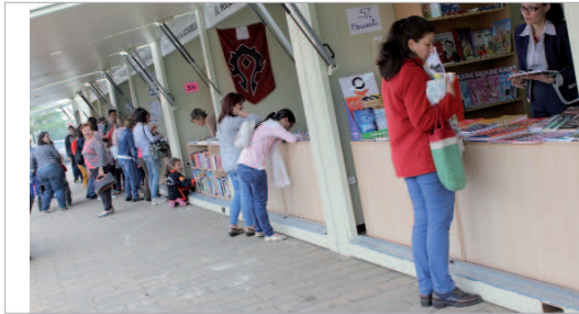
Hasta doce stands de librerías y papelerías locales se ubicaron en La Villa.

Numerosas actividades llenan de cultura los espacios públicos y los centros culturales, acercando a toda la ciudadanía teatro, danza, música y demás artes