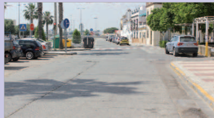
Asfaltado en diferentes calles de la localidad.