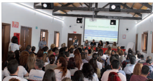
La Hacienda Santa Cruz fue el escenario elegido.

Entre los diversos talleres y dinámicas de grupo que los asistentes estuvieron realizando durante todo el día, destacan actividades para reconocer técnicas eficaces y herramientas útiles de búsqueda de empleo y ampliar la red de contactos. Además, responsables de departamentos de recursos humanos de diversas empresas, orientaron a los participantes sobre cómo dirigir de manera exitosa su trayectoria profesional, así, se echó un vistazo al mundo de la consultoría de selección, a sus procedimientos, los perfiles que se demandan y se realizaron entrevistas de trabajo in situ con los asistentes.