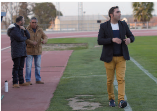
Tres jornadas tiene el Rinconada por delante para acabar la Liga.

El Rinconada suma tres victorias consecutivas. Nueve de nueve en los últimos partidos que le hacen mantenerse en la quinta plaza, aunque lejos de los dos primeros puestos, que son los que