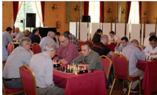
Cuarenta jugadores tomaron parte en el V Memorial Mariano Mimbbrero.