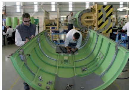
Aerópolis sigue siendo un referente en el sector industrial.