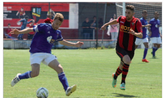
Chidana, Lora y Cádiz B son los rivales que le quedan al San José.

La última jornada, el San José visitará al Cádiz B, ya matemáticamente campeón, en un partido que podría disputarse en el Carranza, como aquel encuentro que dio el ascenso a la escuadra que por