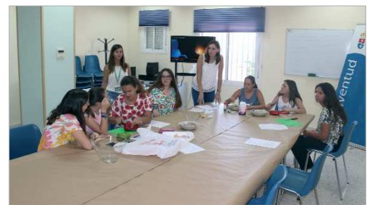
Los participantes en la última edición de Verano Joven Activo.

puesto que en este programa se han realizado también excursiones a Aquopolis, a Isla Mágica y a la factoría Coca Cola.