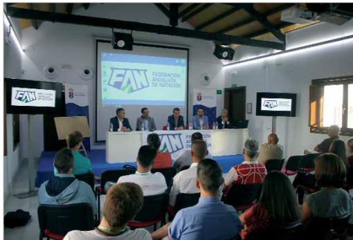
Presentación de las jornadas en la Hacienda Santa Cruz.

La Rinconada es un municipio referente para muchas cosas, entre ellas el deporte. La capacidad organizativa y el nivel de instalaciones existentes en el municipio lo convierten en un lugar atractivo para acoger eventos, como el que tuvo lugar el pasado fin de semana con epicentro en el parque de Las Graveras. Se trataba, en concreto de la I Convención de la Natación Andaluza, una iniciativa pionera en España organizada por la Federación Andaluza de Natación y que reunió a todos los estamentos representativos del sistema de la natación Andaluza para compartir, exponer, estudiar y conducir sobre su propia realidad. Un nuevo espacio de