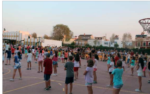
El CEIP Júpiter fue el encargado de acoger el Campamento Urbano.

actividades especiales como la visita al Museo de La Rinconada, salidas a la piscina municipal, convivencia en el parque Dehesa Boyal y en el Majuelo, talleres de arte, creación, cerámica, cocina y nuevas tecnológi-