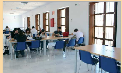
La Hacienda Santa Cruz, una de las sedes del programa 'Estudio Abierto'.

tes nocturnos, 170 han sido mujeres mientras que 160 han sido hombres. Por su parte, la sala de estudios de La Rinconada ha recibido durante la duración del programa la visita de 285 estudiantes que han usado este servicio para dar el último repaso a sus exámenes. En total, 3.129 plazas para el estudio se han ocupado a lo largo de la extensa franja horaria prestada por este programa consolidado ya dentro del Plan Joven de La Rinconada y abierto a las demandas y sugerencias de los estudiantes.