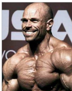
'Tapa', en plena competición.

En 2011 el trabajo empezó a dar sus frutos. Se proclamó Campeón de Sevilla y de Andalucía Absolutos. Antes, en 2008, había sido Subcampeón de España en categoría Body Classic, digamos una categoría inferior. En 2015 alcanza el Subcampeonato de España Absoluto y, en 2016, se pro-