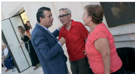
El alcalde, Javier Fernández, saluda a vecinos durante la inauguración.