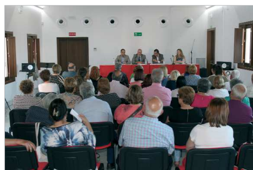
La Hacienda Santa Cruz acogerá el desarrollo de las clases.

Las clases comenzarán el próximo 7 de noviembre y se impartirán en la Hacienda Santa Cruz