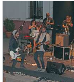
La Familia Corleone.

carácter más íntimo a las representaciones, el ambiente vivido cada noche ha sido especial, inde-