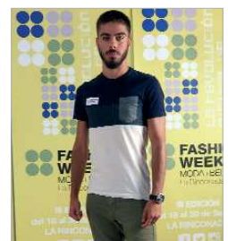
Imágenes de los castings.