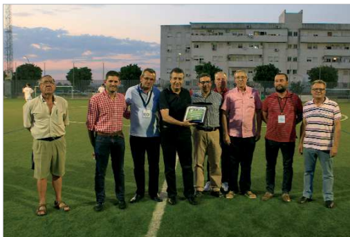
El Ayuntamiento fue reconocido por el Rinconada en el inicio del duelo.