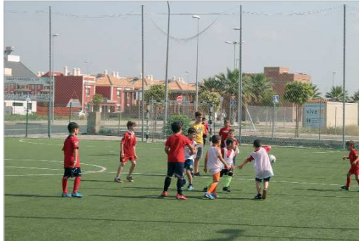
Las Escuelas Deportivas acercan el deporte desde edades tempranas.

Entre las opciones también hay oferta de actividades acuáticas (para bebés de 5 meses a 5 años; para menores de 6 a 15 años y para adultos y mayores) y actividades