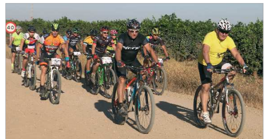
Imágenes del desarrollo de la prueba.

a los participantes, destacó que "La Rinconada sigue demostrando su capacidad para organizar eventos que proyectan la imagen del muni-