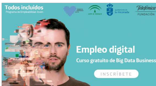
Cartel de esta nueva acción formativa.

cionales. La recopilación y análisis de estos datos, permite que las empresas obtengan de manera rápida y fiable información destinada a satisfacer las necesidades y demandas del público. También en base a la información obtenida de esos datos, las empresas toman decisiones y encuentran nuevas oportunidades de negocio por lo que el Big Data es de extraordinaria importancia para las empresas. Los cursos que está previsto que se impartan serán tres. El primero de ellos de septiembre a noviembre es Big Data for Business para conocer bien las posibilidades técnicas que brinda un entorno big data y además saber cómo explotar el potencial de negocio de estas tecnologías.