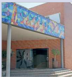
El edificio Juan Pérez Mercader.

Lo que destaca de estas prácticas es que son remuneradas, así para las personas beneficiarias de estas becas suponen la realización de prácticas en diferentes áreas municipales relacionadas con su formación, recibiendo una contraprestación económica de ayuda al estudio de 400 euros brutos durante