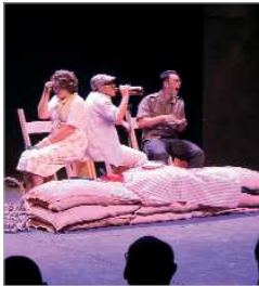
Picnic, de Abrevadero Teatro.

La segunda edición de 'La Hacienda Encantada', el programa que desarrolla el área de