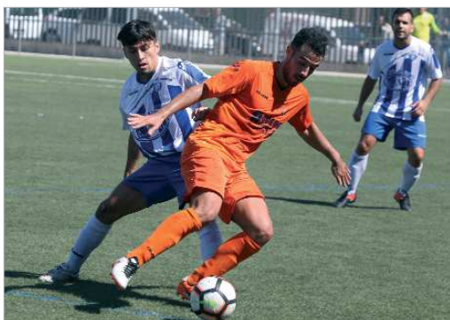
El Alcalá del Río se llevó los puntos del Nuevo Ramos Yerga.