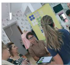
Uno de los eventos celebrados.

A partir del 18 de septiembre algunos de los establecimientos participantes están siendo escenario de microeventos enmarcados en la Fashion Week e igualmente relacionados con el mundo de la moda. Algunas de estas actividades en establecimientos incluyen presentación de colecciones, jornadas de puertas abiertas con algún tipo de degustación, sorteos, días sin IVA, actuaciones musicales en directo e incluso exhibiciones de bailes latinos. Todos estos microeventos están favoreciendo la visibilidad de los negocios de forma muy original además de enriquecer la oferta que la Fashion Week ofrece.