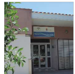
Centro de Información a la Mujer.

Por otro lado, también se va a desarrollar un curso de Asistencia Documental y de Gestión en Despachos y Oficinas, cuya finalidad es asistir a la gestión de despachos y oficinas, así como a departamentos de Recursos Humanos, de forma proactiva, organizando y apoyando la gestión administrativa y documental de los mismos, y realizando las gestiones de comunica-