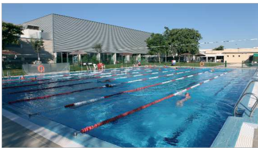
Uno de los cursos de natación desarrollados en la piscina 'El Mirador'.

En la campaña deportiva de verano participaron además 3.850 personas