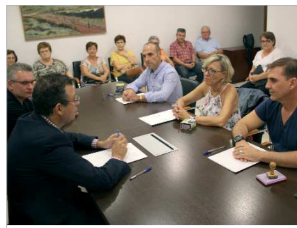
Convenio con las Cáritas municipales.