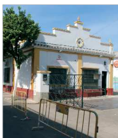
Imagen del edificio previo a las obras.

La Rinconada cuenta desde principios del mes de septiembre con un nuevo Centro de Estimulación Cognitiva destinado principalmente a personas enfermas de Alzheimer y de otro tipo de demencias. El espacio cedido por el ayuntamiento en la calle Manuel de Rodas, estará gestionado por la Asociación Alzheimer de la Vega y ocupa el antiguo edificio de la Cámara Agraria. Cuenta con una superficie total de 250 metros cuadrados mul-