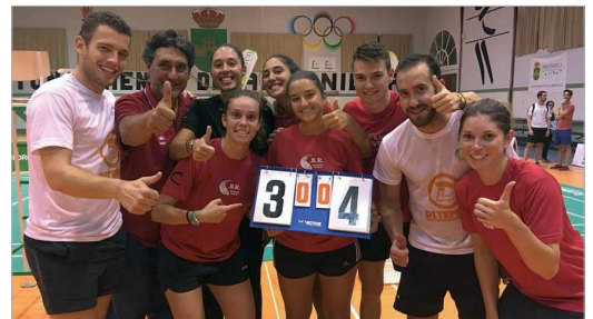
El Bádminton Rinconada logró una ajustada victoria en su debut en Arjonilla.