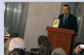
Premio a la apuesta por el Bienestar.

posible debido a la situación saneada de las arcas municipales.