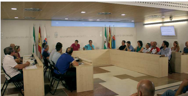
El alcalde y el edil de Deportes con los responsables de los distintos clubes del municipio.