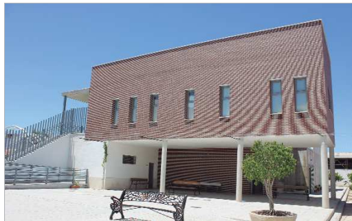
Centro Municipal de Atención a Personas con Discapacidad.

Como destaca el alcalde rinconero, "las políticas sociales son el cuarto pilar en los sistemas de bienestar, junto con la educación, la sanidad y las pen-