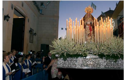
La Virgen de los Dolores, a su salida de la iglesia N.S. de las Nieves.

El paso de gloria de la Virgen de los Dolores adornado con varas de nardos que pusieron el aroma a la noche, entraba en la plaza de España a los sones de Caridad del Guadalquivir interpretado por la Banda Municipal Cristo del Perdón tras recorrer las primeras calles de su recorrido. Allí la esperaba multitud de personas. A su paso por la puerta del Ayuntamiento, fue recibida por la corporación municipal que procedió a la ofrenda floral que tradicionalmente se le hace a la