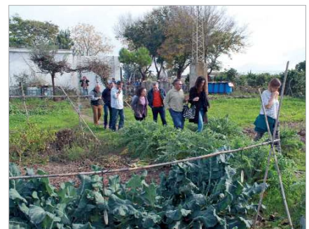
Un proyecto de ACAT vinculado al empleo.