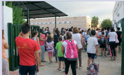
El Consistorio sufraga una importante línea de becas.

universitarios, el plazo de solicitud es desde el 1 al 31 de octubre y en este curso académico 2017-2018 se han incrementado en cuarenta y cinco con lo cual serán 145 las becas a conceder por un valor de 400 euros cada una. Para acceder a esta beca, es necesario acreditar que la persona solicitante está llevando a cabo estudios universitarios