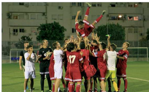
Los jugadores del San José festejan la consecución del X Trofeo.