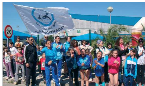
La plantilla del conjunto británico con el edil de Deportes.

El club 'Los niños del barrio' celebrará el próximo 29 de septiembre en el parque de Las Graveras, su quedada anual con fines solidarios. En años anteriores han realizado proezas atléticas para recudar fondos y poner el foco en enfermeda-