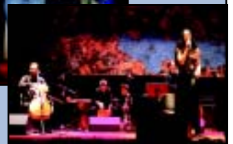
'Igualdad en lo rural' y 'Co.labora.com' desarrollaron cerca de 40 acciones destinadas a la eliminación de las desigualdades sociales. El cierre y presentación de resultados de ambos EQUAL convocó a gran número de personas y contó con la actuación de la cantante, Clara Montes.