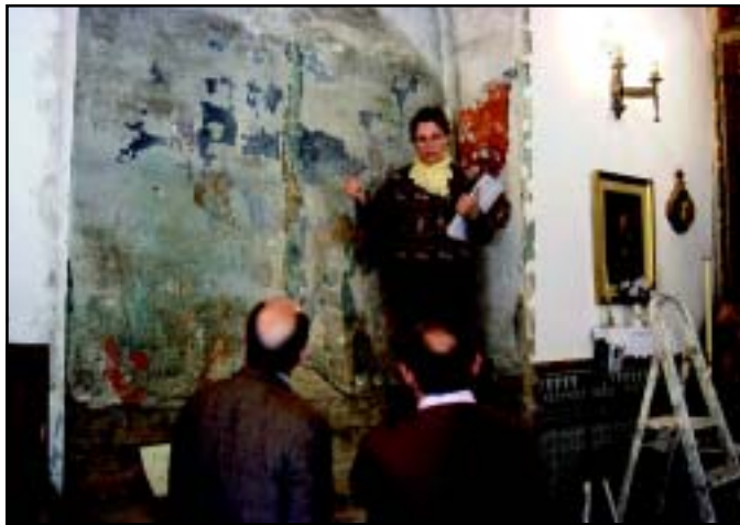
Expertos de la Consejería estudian y analizan los restos encontrados.

Tras los análisis pertinentes, los expertos apuntan a que no sólo hay una pintura sino dos. La primera responde a una escena de Cristo atado de manos a una columna en su presentación, escoltado por dos