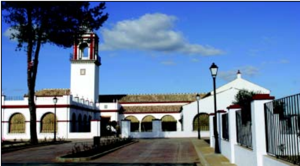
AL DETALLE. Los trabajos de urbanización y rehabilitación del edificio han sido minuciosos y han conseguido cuidar al detalle el aspecto rústico de lo que, en otro tiempo, fue una hacienda agrícola. Aparcamientos, juegos infantiles y el entorno rural junto a la exquisita cocina son los principales reclamos de este nuevo complejo turístico.