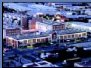
La siguiente entrega prevista será de los 70 pisos en venta junto al parque de la Dehesa Boyal (izquierda). En alquiler, se trabaja ya en la redacción de un proyecto novedoso que para construir 70 pisos para jóvenes.

metros cuadrados con dos, tres y cuatro dormitorios.