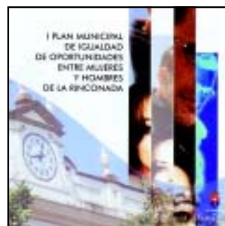
Imagen corporativa del Plan de Igualdad de Oportunidades.