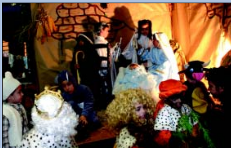
Belén viviente del colegio Maestro Antonio Rodríguez.