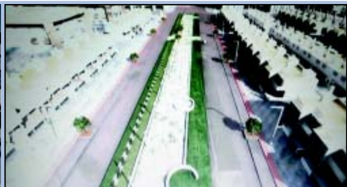
Los visitantes a la feria de los pueblos fueron los primeros en conocer cómo quedará definitivamente el casco urbano de San José tras el soterramiento del arroyo gracias a un 3D fidedigno del proyecto. Una recreación aproximada avanzó también el estado final del proyecto de unión a través del Pago.