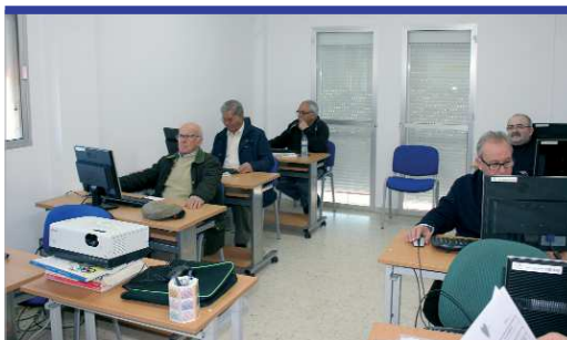
Usuarios del taller de informática del '20 de Julio'.