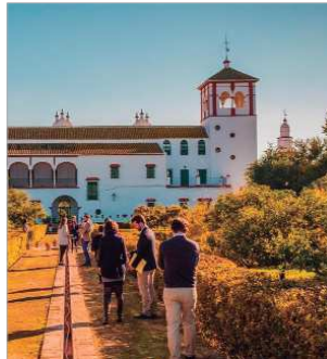
Hacienda Guzman en La Rinconada.

Se une de este modo al conjunto de entidades que, impulsadas por la Fundación Juan Ramón Guillén con sede en La Rinconada, solicitarán ante el organismo internacional la equiparación del paisaje olivar andaluz con enclaves como el Camino de Santiago.