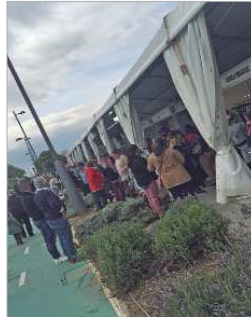
Feria del Stock del año pasado.

El área de Comercio del Ayuntamiento de La Rinconada volverá a celebrar en marzo su segunda edición de la Feria del Stock y las Oportunidades, una nueva campaña de apoyo al