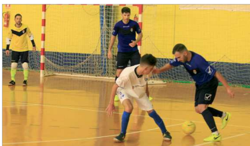
El Tres Calles se acerca al Multisport y, con ello, al ascenso.