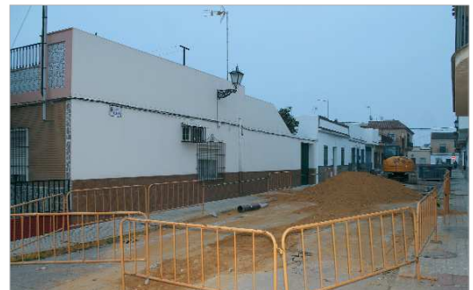
La calle Almería es una de las vías en las que se actúa en la actualidad.