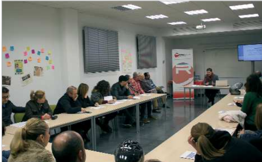
El edil de Comercio presentó a los comerciantes la feria.

Tras el éxito del pasado año, el segundo tramo del bulevar del Almonazar acogerá la feria los días 9, 10 y 11 de marzo