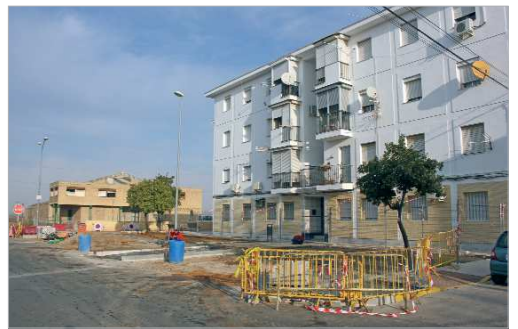
Las obras se realizan en una zona de albero en desuso.