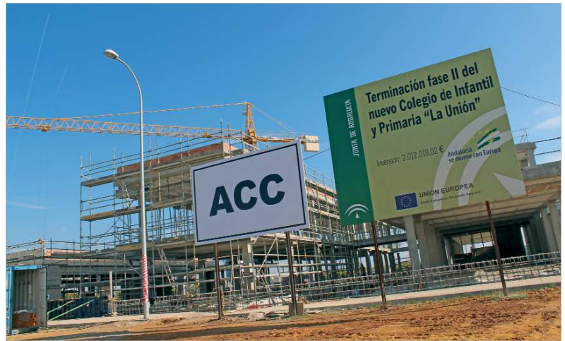
El unidad de Primaria de La Unión estará listo para el próximo curso.

primera fase de construcción del colegio, que llevó a cabo el Ayuntamiento de la localidad, se crearon los espacios para el alumnado de Educación Infantil. La nueva actuación implica la construcción de casi 3.000 metros cuadrados de nueva superficie sobre una parcela de 9.469 metros. La zona docente de primaria estará compuesta por doce aulas, cuatro aulas de pequeño grupo y un aula de educación especial con aseo adaptado. La construcción incluirá, además, un comedor escolar con cocina de oficio y un aula-gimnasio con vestuarios. Asimismo, el edificio contará con biblioteca, salón de usos múltiples, sala de recursos, espacios para alumnado y AMPA, almacén general, aseos de alumnado y profesorado, vestuarios para el personal no docente y espacios complementarios de limpieza, almacén e instala-