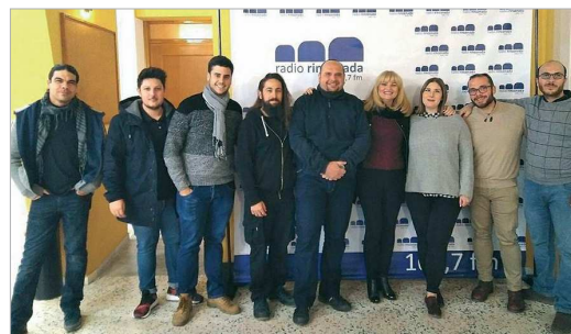
El equipo de la Radio en el Centro Cultural Antonio Gala.

La Radio ofrece en riguroso directo el XXXI Certamen de Comparsas y Chirigotas desde el Antonio Gala