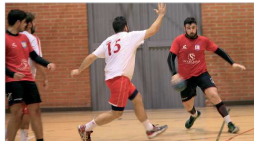
El Balonmano San José espera recuperar el liderato esta jornada.