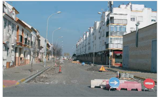
Imagen de la calle Natividad Morales Muñoz, una en las que se actúa.