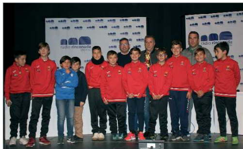
El equipo Alevín de Fermín del Esfubasa, estuvo a punto de ascender.

compañerismo, la solidaridad, la importancia de no rendirse y la capacidad de superación. Como destaca el alcalde,