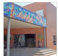
Centro Formación P. Mercader.

Los participantes recibirán formación en pintura industrial en construcción y peribirán durante todo el año de formación el Salario Mínimo Interprofesional íntegro. El proceso de selección se gestiona a través de Servicio Andaluz de Empleo (SAE)