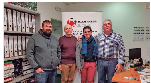
Junta directiva de Rinconada Glob@l con el delegado de Comercio.

Durante la reunión, la junta directiva del colectivo expresó su satisfacción por las actividades planteadas y mostró su compromiso