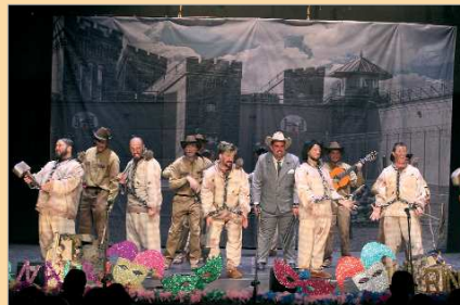
'Los Picapiedra', de Juan Manuel Mera 'Bola'