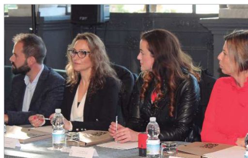
La edil de Cultura en la firma de convenios en San Telmo.