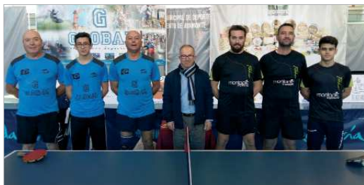
El CTM San José antes de comenzar el partido ante el Reina del Guadiana.