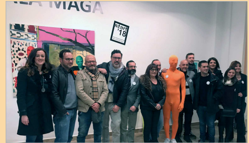
Foto de familia de los participantes de Start'18.