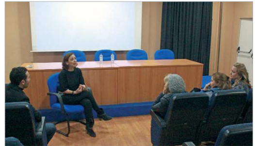
Ponencia sobre donación de sangre, médula y órganos.

La Unidad de Gestión Clínica La Rinconada -Brenes da esta charla en la que habla acerca de donar sangre, médula y órganos