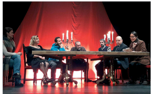
Uno de los momentos osbre las tablas del Antonio Gala.