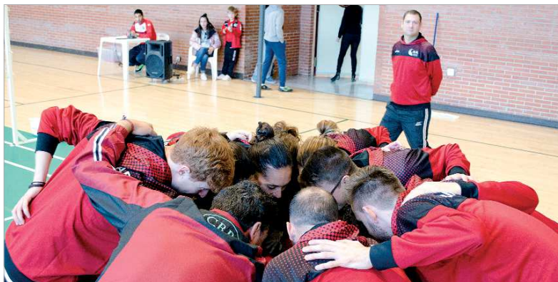
El equipo rinconero se conjura antes del comienzo del partido ante Oviedo.

Las modalidades de individuales que tantos quebraderos