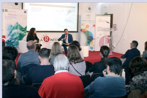
La edil de Economía y el delegado Territorial en la ponencia.

Después del éxito obtenido por esta iniciativa en 2017, el presente año prosigue con nuevas acciones, como la que sirvió de apertura, que analizaba un tema como es la financiación de nuevas oportunidades empresariales. En concreto, la cita consistió en ofrecer toda la información referente a las nuevas órdenes de incentivos de apoyo al desarrollo empresarial y la investigación de la Agencia IDEA, que cuentan con un presupuesto de más de 240 millones de euros. Estar al día en materia de captación de recursos es siempre una necesidad y obligación y por ello, esta jornada fue de interés para el empresariado local y de algunas localidades del área metropolitana, que llenó la sala habilitada para la actividad.