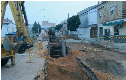
La Carretera Bética está viendo renovada la red de abastecimiento.

Emasesa está actuando en la zona para mejorar el servicio a los vecinos de la zona