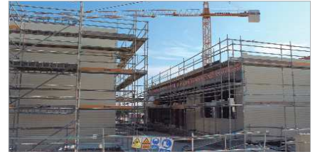
El CEIP La Unión albergará en torno a 400 alumnos y alumnas.