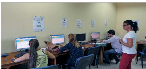
Jóvenes inscribiéndose en Garantía Juvenil en La Estación.

Si estás interesado acude al Centro Joven 'La Estación' y pide cita.