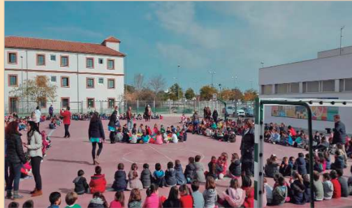
Alumnado del Blanca de los Ríos en el Día de La Paz.