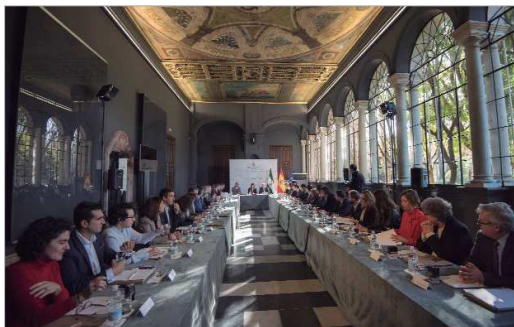
Mesa de trabajo con la presidenta de la Junta de Andalucía.