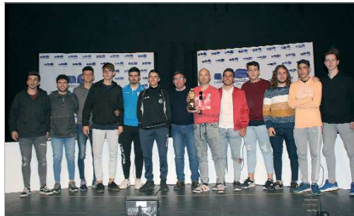
El conjunto Juvenil del Rinconada, cuajó un buen año.

como personas y como futbolistas. Los logros llegan, y los equipos Infantil del San José, Juvenil del Rinconada o Alevín de Esfubasa, son un claro ejemplo de ello, pero a estas edades el éxito competitivo está por detrás del trabajo con los chavales para inculcarles otra serie de valores, como el