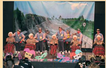
Jorge de la Rosa vuelve con 'El que la empuja la entiende'.