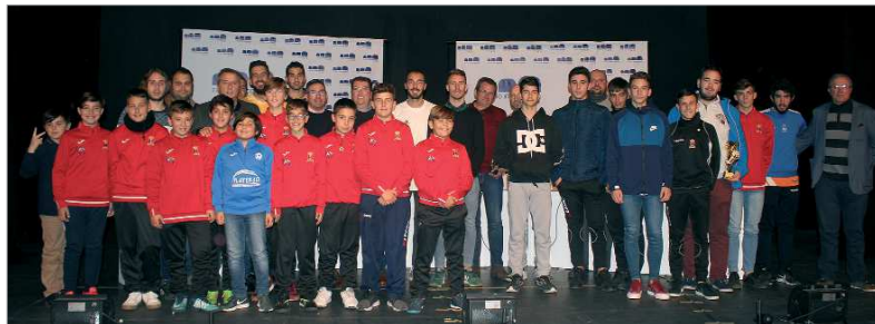
Foto de familia con todos los galardonados en la XVI edición.

La Radio se vuelca un año más con el Carnaval de La Rinconada y entrega una nueva edición de los premios 'Jugamos en Casa'