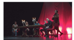
El público elegía qué iba a pasar.

sido una experiencia absolutamente pionera en el mundo de las artes escénicas y es que considero que en las propuestas culturales