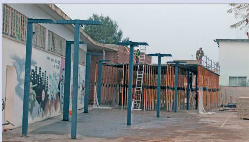
Obras del futuro comedor del colegio Maestro Pepe González.

aseos, oficio, vestuario y cuarto para la limpieza. Por otro lado, los del Pepe González usan la Sala de Usos Múltiples, habilitada para ello, que se encuentra además en la primera planta. La nueva ubicación será en la zona cubierta existente en el patio del centro, lo que va a implicar la creación anexa de otra zona cubierta para el uso de los escolares en el recreo. Como señala el edil de Educación “los nuevos comedores beneficiarán a alrededor de 200 alumnos y alumnas, no será necesario hacer turnos y en el caso del Pepe González dispondrá durante todo el día de su Sala de Usos Múltiples para lo que desee. Con estos nuevos espacios mejoramos notablemente el servicio de comedor, del que disponen todos nuestros colegios, y que no sólo son dotaciones educativas, sino también dotaciones para la conciliación familiar”. Las obras están siendo ejecutadas por Soderin XXI con cargo a los Planes de Fomento del Empleo Agrario, Aepsa Estable, y como valor añadido se está llevando a cabo con mano de obra local.