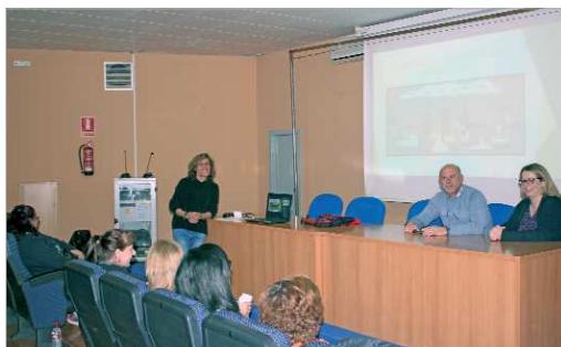
Los ediles de Medio Ambiente e Igualdad en uno de los talleres.

Hasta la fecha, las participantes han trabajado el Día del animal en el que han dado un taller de