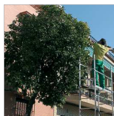
Poda de árboles.