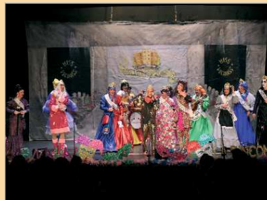
'Miss Vecinas' no estará en la final el sábado.

'Los Surferos' traen este año la sala de espera del Centro de Salud de La Rinconada. Médicos, enfermeras, pacientes y hasta el conductor de la ambulancia, en un escenario donde no falta un detalle. Los autores de 'Por mi puesto', el primer premio del año pasado, cantaron sus pasodobles al funcionamiento del ambulatorio, aludiendo al