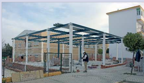
Obras del comedor del colegio Maestro Antonio Rodríguez.