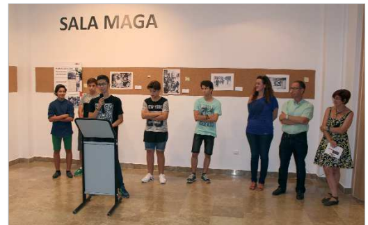
Actividad del año pasado sobre exilio republicano.

El área de Memoria Histórica viene trabajando en los últimos años en diferentes temáticas con las que “se ha querido dar a conocer esta etapa de la historia de España al