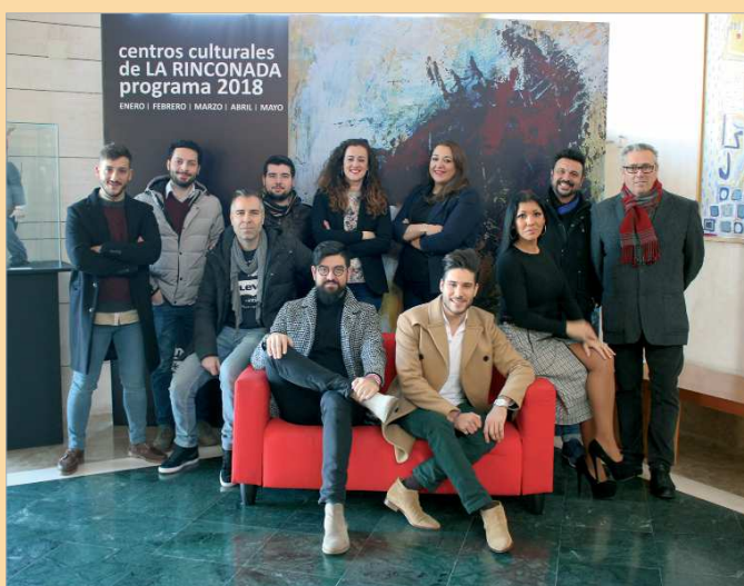
Foto de familia de la mayor parte de artistas participantes en la programación de este semestre.

por profesionales, a menudo premiados a nivel nacional e internacional y con financiación pública. Convenios esenciales en el apoyo a la industria cultural y para la oferta en nuestros espacios escénicos de una programación de mucha calidad. Enrédate supone la cofinanciación del 50 por ciento por parte de la Junta de Andalucía, y trabajamos unidos y unidas para hacer de la Cultura un motor". En este año, el municipio recibe 11 espectáculos de 'Enrédate': Irene de Paz, 'La madeja' (circo); Marcos Vargas y Chloé Brûle, 'Naufragio universal' (danza); El Espejo Negro, 'La cabra' (teatro); La Ejecutora/Teatro a Pelo, 'Las Dependientas' (teatro); Alejandro Cruz Benavides, 'Mujeres Luz' (música); Mía Lam, 'Reinvention Tour' (teatro); Histrión Teatro, 'Lorca. La correspondencia personal de Federico García Lorca'; Fundición Producciones, 'El primer concierto' (teatro); Escenoteca, 'El desván de los hermanos Grimm' (teatro); Cal y Canto Teatro, 'Los dog... perro perdido' (teatro); A Zaranda, 'Ahora todo es noche' (teatro). Para el primer semestre del año 'Abecedaria' trae a Producciones Yllana, 'Primitals'; Zum-Zum Theatre, 'La gallina de los huevos de oro'; Proyecto Nana, 'Nana, una canción de cuna diferente'; Fundición Producciones, 'El primer concierto' y Compañía Danza Mobile, 'En vano'.