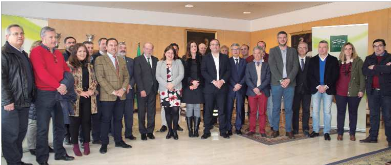
Consorcio de Bomberos de Sevilla.