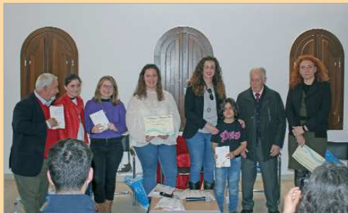
Ganadores del Concurso de Relato y Poesía 'Gloria Fuertes'.