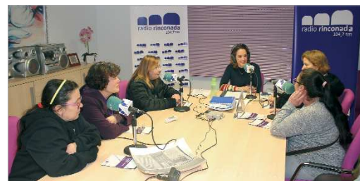
Más invitadas en el programa especial por el 8 de Marzo.