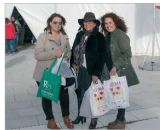
Visitantes de la Feria en exterior de la carpa.