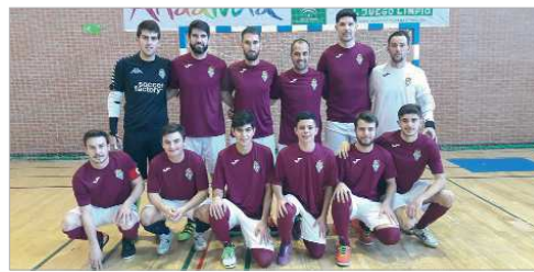
La plantilla del Tres Calles, plagada de juveniles, posa antes del envite.