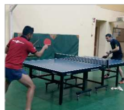
Imagen de un encuentro.