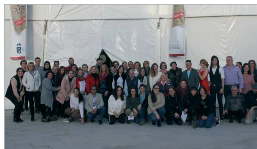
Participantes en la II Edición de la Feria Comercial y Empresarial.