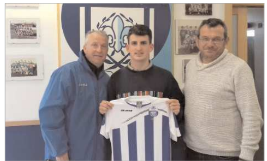
Tres refuerzos intentarán sumar para conseguir el milagro del ascenso.