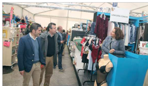
El alcalde visitó a los y las comerciantes participantes.

incidencia. Además, ha dicho que, "una vez evaluadas las ventas podemos decir que han superado los 45.000 euros de forma directa, más de un 50 por ciento más que el año pasado", mientras que la eva-