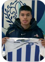
Will Jugador del Rinconada

El técnico, cuyo cese estuvo encima de la mesa, parece recuperar crédito gracias a las victorias ante la Valverdeña y el Cartaya. Sin embargo, la derrota ante el Algabeño hace que el duelo ante el Rota sea decisivo para su propia tranquilidad en el banquillo.