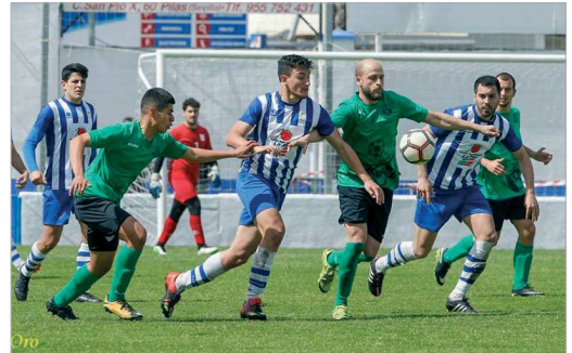
El Rinconada cuajó un partido serio en Pilas.

Además, la entidad se ha hecho eco del mensaje del entrenador y ha movido ficha para intentar apurar sus opciones, por mínimas que sean. Así, el club ha acudido al mercado y se