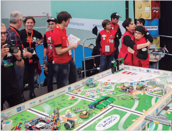
El equipo Tecno San José durante el concurso en Logroño.