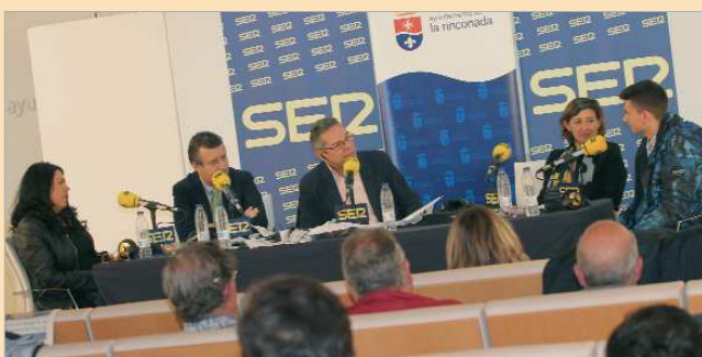
El salón de plenos acogió el programa 'Hoy por Hoy Sevilla'.

fía de trabajar con el alumnado, dándoles voz y participación en la elaboración de esta iniciativa. En una segunda sesión, se han desarrollado las "Intervenciones psicoeducativas para el fomento de relaciones en igualdad", como continuidad a la anterior, se trata de profundizar en las dificultades que se dan en una relación de pareja, ahora ya sin unos personajes con los que identificarse. Los y las participantes representan y entrenan sobre sus propios conflictos, (celos, control, falta de confianza, baja autoestima), facilitándoles herramientas para conocer sus reacciones y comportamientos y para desenvolverse mejor en las relaciones de pareja y en las relaciones en general. Esta actividad está subvencionada por la Consejería de Educación, Cultura y Deportes de la Junta de Andalucía dentro de la Línea de Subvención a Proyectos de Coeducación de las Asociaciones de Padres y Madres del alumnado (AMPA Cervantes de La Rinconada) para el fomento de la Igualdad entre hombres y mujeres.