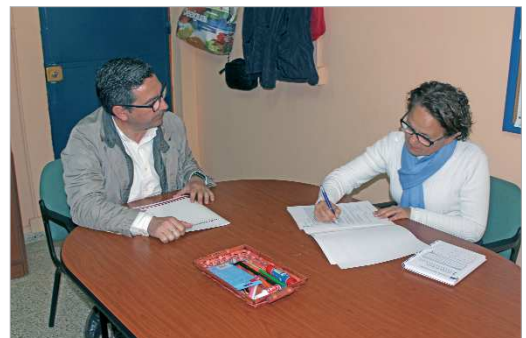
El edil de Deportes y la directora de Los Azahares.