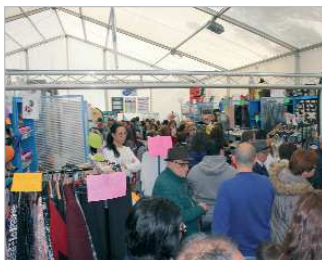
Un numeroso público acudió a la Feria.