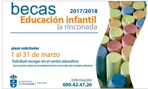
Cartel de Becas Educación Infantil.

Desde el 1 al 31 de marzo permanecerá abierto el plazo para solicitar ayudas municipales para el estudio en el segundo ciclo de Educación Infantil. Con esta iniciativa, el Ayuntamiento de La Rinconada vuelve a manifestar su compromiso con una educación pública gratuita y de calidad con la concesión, un año más, de becas para la adquisición de material curricular básico para alumnos y alumnas de 2º ciclo de Infantil. Esta ayuda está destinada a las familias con menos posibilidades económicas, para las que el Consistorio pondrá a disposición de los destinatarios una cuantía para la adquisición del material