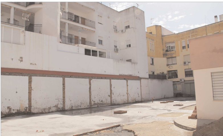
El nuevo edificio albergará las diferentes actividades y talleres que se imparten en el CMIM.