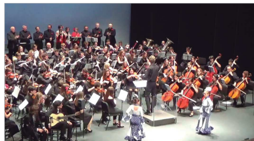
Orquesta Filarmonía de Sevilla.

abril. En ella se recogen alrededor de 50 imágenes realizadas durante la Gala Flamenca del 18 de abril de 2017 en el Centro Cultural de La Villa. Estas fotografías captan la ilusión, el sentimiento y el arte del alumnado del 'Proyecto Flamenco' del IES Carmen Laffon.