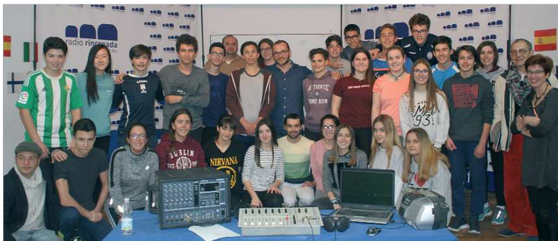
Foto de familia de los participantes en el programa especial