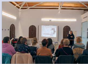
Taller sobre ‘Andaluzas que abren camino’.

‘Andaluzas que abren camino’, ‘Mujeres ejemplo: haciendo historia’, mesa redonda ‘Mujeres rumbo a Gaza’, clase de meditación y yoga del despertar y un curso de formación en género e igualdad ‘Las olas del feminismo’.