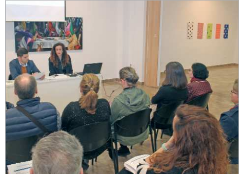
Reunión de organización de la Feria del Libro.