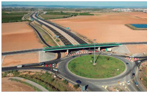
Imagen panorámica de la glorieta de Acceso Norte a Sevilla.