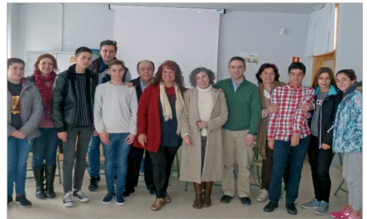
Participantes del proyecto Ecoescuela.

tarjeta: roja, amarilla o verde (dependiendo del nivel de logro conductual). Al final del curso se obtiene la Ecoaula Verde. Asimismo, el centro educativo está inmerso dentro de un proyecto susceptible de cambios y mejoras, tanto a nivel ecológico como social, coherentemente con los principios de la Educación Ambiental e impulsado