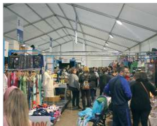
La carpa protegió a los comercios de la lluvia.