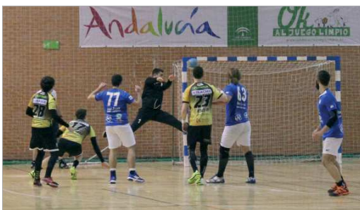
El club dio la cara ante el filial del único equipo andaluz de la ASOBAL.

El año que viene el equipo tendrá la difícil misión de la permanencia en un año en el que la plantilla será mucho más madura y experimentada para conseguir el objetivo de asentarse entre los mejores.