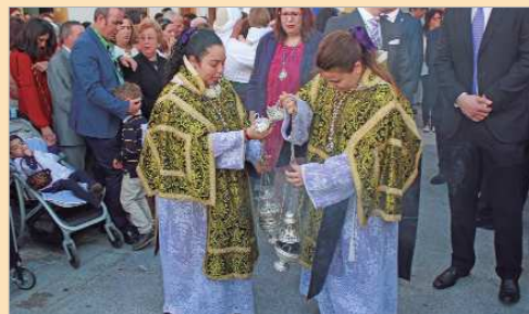
Imagen de archivo de la Semana Santa 2017.

Por último, el Domingo de Resurrección, a las 18 horas, hará su salida la Hermandad de Resucitado, que pondrá el broche de oro a la semana de Pasión rinconera.