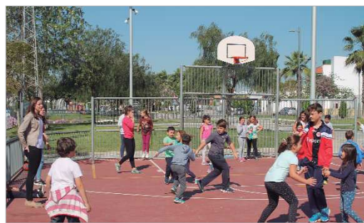
Imagen de archivo del programa Animateca.