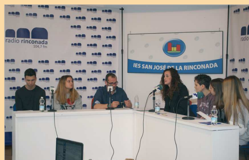
Programa especial de radio en el que se habló de autonomía.

pantes en este proyecto ya han empezado a trabajar los contenidos en clase a través de la búsqueda, recopilación y análisis de información de todo el