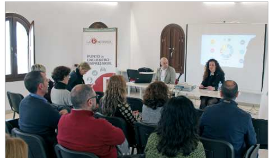
La delegada de Economía presentó al ponente de Feicase.

cribirse en la web www.feicase.com ; otra fase de formación en la que tras el análisis previo de la situación de cada participante, se emprende un recorrido formativo por tres áreas de desarrollo empresarial: la organización digital, la comunicación 2.0 y la experiencia de cliente, a lo largo de tres sesiones, con una duración de tres horas cada una; y por último, el acompañamiento, en el que una vez evaluada la empresa y conocida su realidad, se realiza un informe individualizado, protagonizado por las propuestas de mejora en relación a los aspectos analizados. Como afirmó Parodi, "el pro-