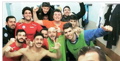
Celebración del San José FS en vestuarios tras ganar en Arahal.

cilio al Multisport. Por su parte, el San José, vencia a domicilio en la última jornada al Polígono Norte Arahal y cierra definitivamente la permanencia en la categoría.