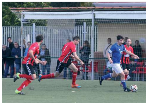
Jurado se lleva la pelota entre tres jugadores del Cartaya.

Las victorias ante la Olímpica Valverdeña y ante el Cartaya habían dado aire al San José. Ciertamente era que las diferencias respecto al peligro eran exiguas, pero el equipo había escalado hasta la