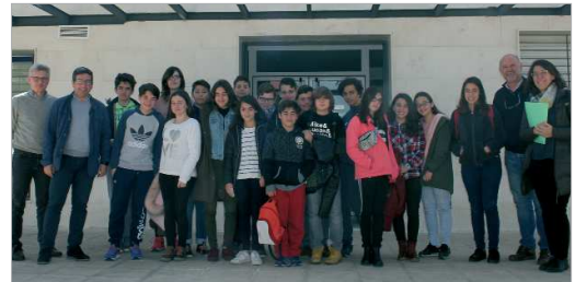
Foto de familia de la reunión con los y las estudiantes.