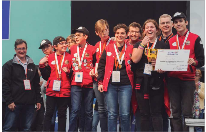
Clasificados para participar en la final de First Lego en Hungría.