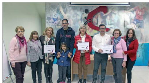
Entrega del cheque en el Patronato de Deportes.

Por quinto año consecutivo, el Patronato Municipal de Deportes organizó, el pasado mes de diciembre, su Chocolatada Solidaria a beneficio de las Cáritas del municipio. Así, los usuarios de la piscina llevaron pasteles hechos en casa y el Patronato puso el chocolate.