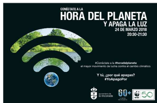
Puedes adherirte a la Hora del Planeta en la web.

La Hora del Planeta recuerda cada año que un pequeño gesto