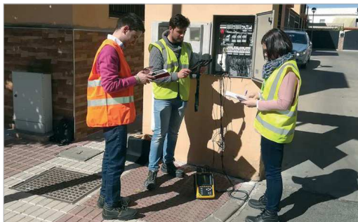
La empresa Letter ha empezado con el trabajo de campo.

Una de las acciones que se está llevando a cabo es la realización