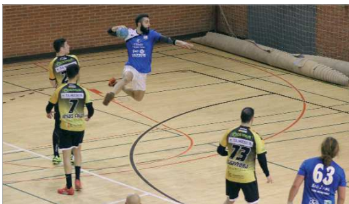
Imagen del duelo entre el BM San José y el Ángel Ximénez.

El BM San José afronta los Play Off con el ascenso a categoría nacional asegurado con la idea de seguir creciendo de cara la próxima temporada