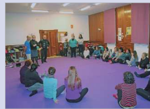
Taller de defensa personal.