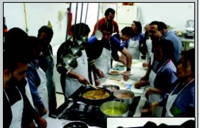
Armonía, excelente sentido del humor y una total disposición a aprender son los ingredientes con los que se cocina el mejor plato posible: el de la igualdad de género.

El laboratorio está en la calle, se comenta e incluso hay quien ya sugiere reediciones anuales, cursos mixtos de hombres y mujeres e incluso alguno destinado a enseñarles a ellas chapuzas del hogar.