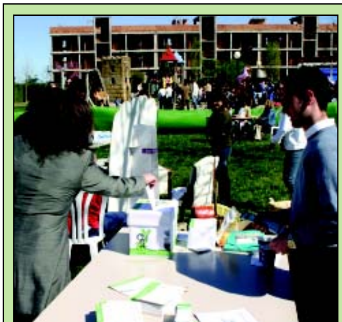
Fiesta en el Dehesa Boyal. Como ya es tradición, millares de vecinos llenaron hasta la bandera el parque Dehesa Boyal, con motivo de la convocatoria institucional realizado por el Día de Andalucía. Las actividades lúdicas, las propuestas medioambientales y culturales, los talleres juveniles y las actuaciones musicales de la orquesta Surmania y Agüita Salá pusieron la guinda a la jornada.

Un proyecto que «normaliza a medio plazo el panorama educativo del núcleo de La Rinconada» y que «permitirá que el instituto Azahares vuelva a sus orígenes de centro de infantil-primaria», al tiempo que «servirá de alivio al colegio Gualdaquivir, teniendo en cuenta el crecimiento poblacional estimado».