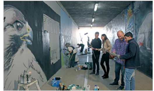
Concurso de graffiti de la Red CreaJoven.