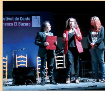
La Peña reconoció la ayuda de Diputación.