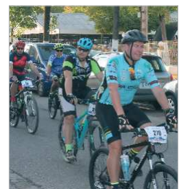
Los deportistas disfrutaron.

El ciclismo está de moda en el municipio y cada vez más son los grupos que salen regularmente en diferentes rutas por lo que, cuando se produce una cita como la Cicloturística, la serpiente multicolor que entraña, luce sus mejores galas y regala fotografías de ensueño a los múltiples aficionados que, apostados en las márgenes del camino, esperan el paso del pelotón. Desde la caseta municipal, el pelotón recorrió el Bulevar del Almonazar, la Avenida de la Unión y entrará en el núcleo de La Rinconada para atravesar El Majuelo, recorrer algunas de las calles más características de la localidad y volver por la antigua carretera para coger caminos en Las Torres, alcan-