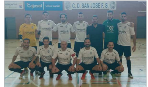
La plantilla del San José FS posó antes del comienzo del encuentro.

El San José Fútbol Sala comenzó una nueva temporada en Segunda Andaluza con un holgado triunfo ante el Atlético Carmona, un clásico del fútbol sala provincial, que este año recuperaba la categoría.