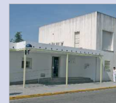
Sede de Bienestar Social.

negociado con los sindicatos y otorgan mayor puntuación a: