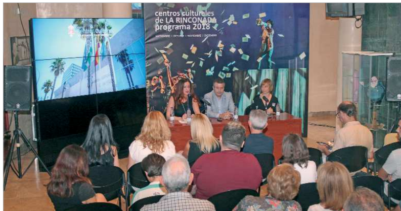
Presentación de la programación de otoño en La Villa.

París, primera en tomar la palabra, ha destacado que "somos una pequeña compañía que reside en Sevilla pero que de forma gradual y sin darnos cuenta, estamos trasladando nuestra actividad creativa aquí, porque nos ofrecéis un espacio maravilloso para crear, pensar y reflexionar. Es difícil encontrar espacios como estos, en donde te den todas las facilidades para tu proceso creativo. Un maravilloso equipo humano que sigue un plan estratégico y que sabe hacia dónde quiere