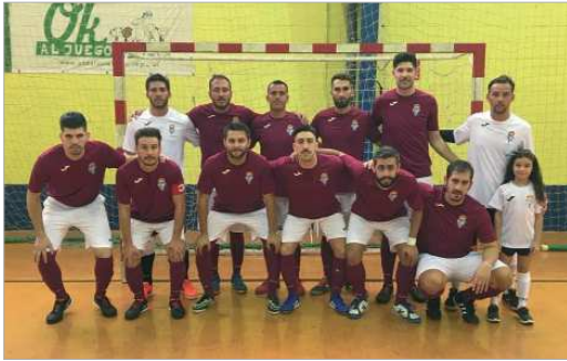
La plantilla del Tres Calles en el primer partido ante el Águila.