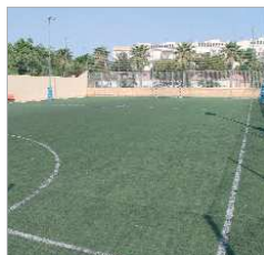
Pista de césped del 'Castaña'.

Plaza Factoría Creativa La Paz 1 y 2 van a ser sometidos a una reforma integral en la que se contemplan los revestimientos, la sustitución de las ventanas y la