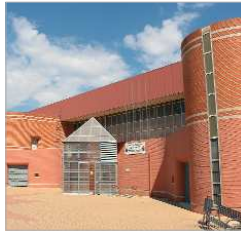
Pabellón Fernando Martín.

El otoño viene cargado de actuaciones que inciden directamente en la escena urbana en los edificios municipales, lo que va a permitir que el municipio prosiga su proceso de modernización a la vez que optimizar las dotaciones públicas y los servicios existentes. En la actualidad se encuentran iniciando el expediente de contratación, con la idea de que las obras salgan a concurso con lo que ello implica a efectos de calidad de vida y de generación de empleo y dinamización económica.