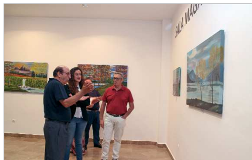
El artista muestra su obra a la delegada y al director del área de Cultura.

Su técnica se basa en el realismo, abarcando todo tipo de ámbi-