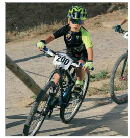
El Cañamito Bike, en forma.