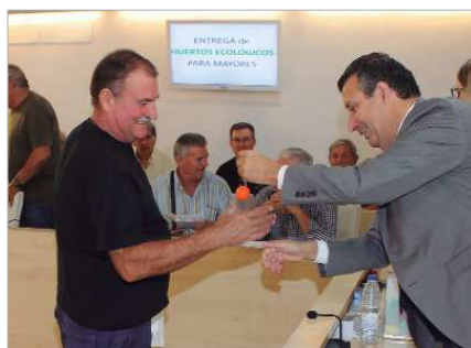
El alcalde entrega la llave de su huerto a un beneficiario.