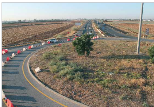
La rotonda de acceso a la Autovía será eliminada.

Esta primera fase, previa a la construcción del Viaducto, resolverá la intersección de la A-8004 con el vial metropolitano. Consiste en eliminar la actual glorieta construida durante la ejecución de las obras del tramo I del acceso norte a Sevilla y que se ha mantenido como conexión provisional entre los dos tramos. Sin embargo, actualmente se colapsa con el tráfico procedente de las localidades de San José y La Rinconada hacia la capital hispalense, por lo que el nuevo enlace facilitará los movimientos desde San José de la Rinconada hacia Sevilla y eliminará el colapso existente. Estas actuaciones tienen por objeto, entre otros, mejorar la organización y la capacidad de la red viaria en las áreas metropolitanas, ámbitos de influencia de las grandes ciudades, caracterizados por una movilidad de carácter local y con niveles de tráfico importantes.