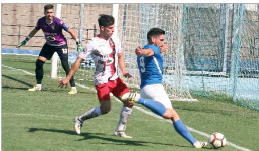
Sabo intenta ganar línea de fondo ante la mirada del arquero del Pinzón.

Dicen que sólo con el escudo no se ganan los partidos y el San José puede dar buena prueba de ello, a tenor de lo visto en el último duelo ante el Pinzón, un rival que llegaba al Felipe del Valle con un solo punto en su casillero y que parecía un rival propicio para qui-