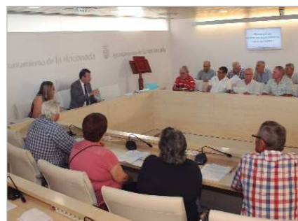
Propietarios de los huertos de La Rinconada.