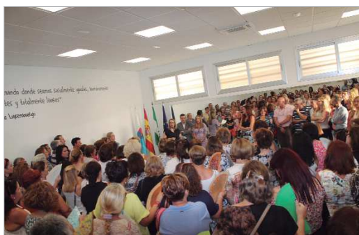
Una representación de la sociedad civil acudió a la inauguración.