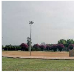
Plaza Factoría Creativa.

Centro Joven La Estación El Centro Joven La Estación va a modificar el Salón de Actos. La idea es ubicar las oficinas en la planta baja recuperando el espacio perdido con la zona que actualmente se usa como almacén. La planta alta, también será reformada ubicando en la misma, diferentes salas destinadas a las acciones formativas que se llevan a cabo en el área de Juventud. El presupuesto de las actuaciones es de 95.000 euros.