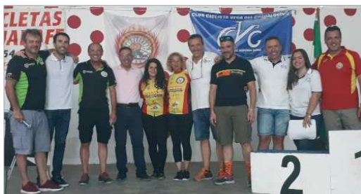
Una de las entregas de premios en la Caseta Municipal.

Las lluvias en los días previos modificaron levemente el recorrido, lo que no mermó el espectáculo de una prueba plenamente consolidada que contó con 400 participantes