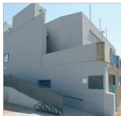
Centro Joven La Estación.

Centro Joven La Estación El Centro Joven La Estación va a modificar el Salón de Actos. La idea es ubicar las oficinas en la planta baja recuperando el espacio perdido con la zona que actualmente se usa como almacén. La planta alta, también será reformada ubicando en la misma, diferentes salas destinadas a las acciones formativas que se llevan a cabo en el área de Juventud. El presupuesto de las actuaciones es de 95.000 euros.