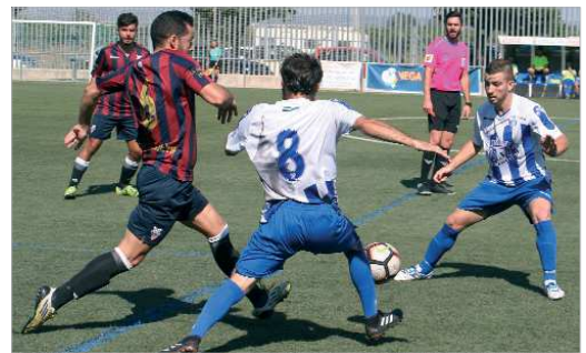
Charro y Barriga presionan la salida del balón durante el último duelo.

facilidad, lo que aumentado el poderío ofensivo del equipo. Esto quedó demostrado ante el Villanueva, al que los rinconeros marcaron siete goles. Pero lo más importante que se puede