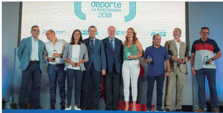
Foto de familia con todos los deportistas galardonados en la XXXIII Gala del Deporte de La Rinconada.

Rinconada en deportes, doblando las subvenciones a las entidades y desarrollando un ambicioso programa de actividades propias o de las propias entidades, con las que trabaja codo con codo". Por último, el edil mencionó el Plan Estratégico de La Rinconada, que marcará el desarrollo del municipio hasta el año 2022 y que tiene, en una de sus líneas de actuación, infraestructuras deportivas como un nuevo pabellón cubierto en San José Norte o la nueva pista deportiva en el Felipe del Valle -a la vista para todos los presente-, entre otras actuaciones".