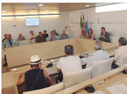
Reunión con los nuevos propietarios de huertos en San José.