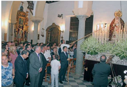
Finalmente la lluvia impidió la salida de la Patrona de la iglesia.