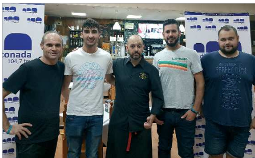
El equipo de deportes de Radio Rinconada, en bar La Dehesa.

El bar La Dehesa acoge la nueva edición de un espacio que se estrenó con el análisis del equipo de la Radio.