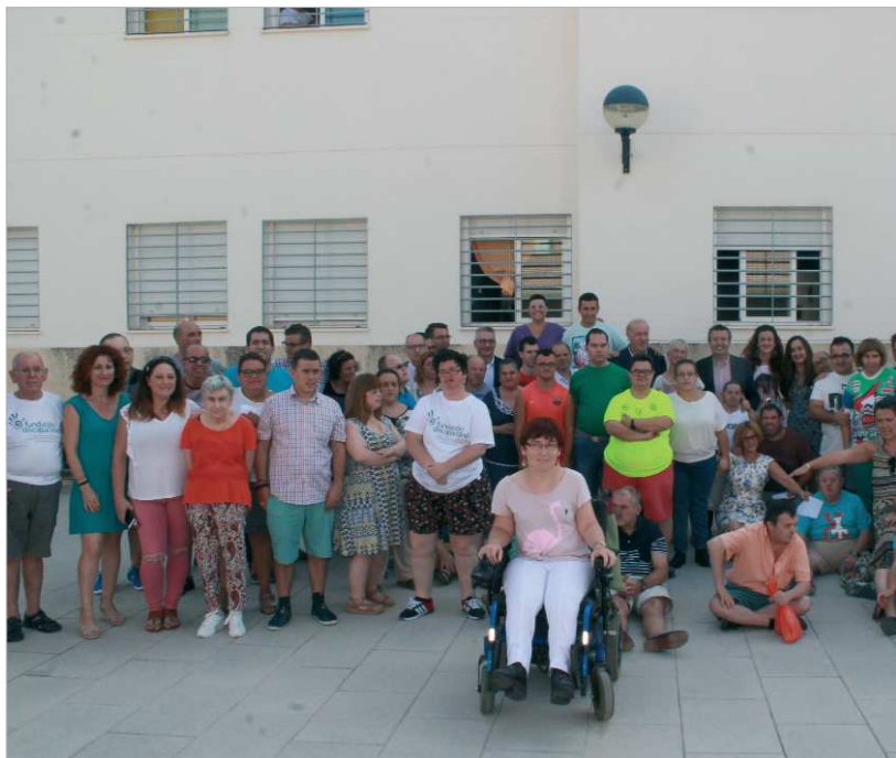
Vicente del Bosque compartió una jornada con los usuarios y las usuarias del Centro Ocupacional, así como con el personal del centro.