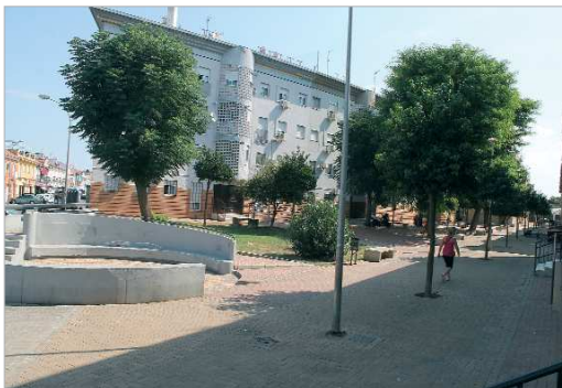
La plaza 'Los Inventores' renovará su red de abastecimiento y saneamiento.

La Empresa Metropolitana de Abastecimiento y Saneamiento de Aguas de Sevilla S.A. (Emasesa) va a llevar a cabo un proyecto de sustitución de las redes en la Plaza de los Inventores de San José de la Rinconada, para lo que invertirá casi medio millón de euros. De este modo, se renovarán las redes de abastecimiento y se colocará otra nueva red de fundición dúctil, a la par que se cambiará el saneamiento actual por otro de gres.